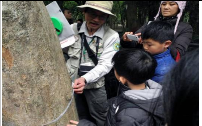
小朋友第一次測量老樹的胸圍，印象深刻