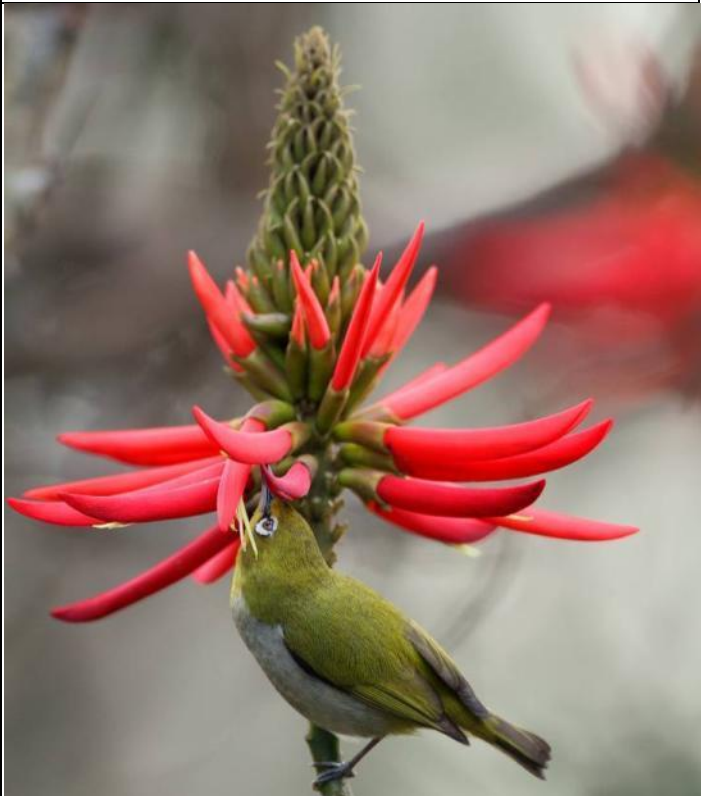
觀察一下綠繡眼是如何取得火炬刺桐花蜜？