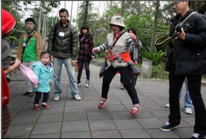
小玲老師難得帶小叮嚀隊，很有成就感