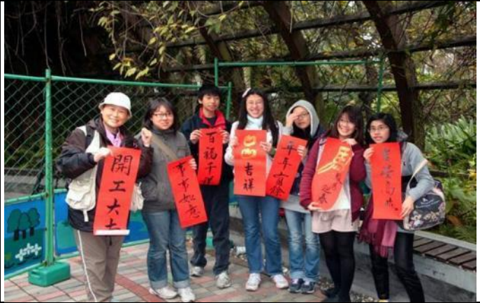
小玲老師與遠從桃園北上學生新春祝福合影