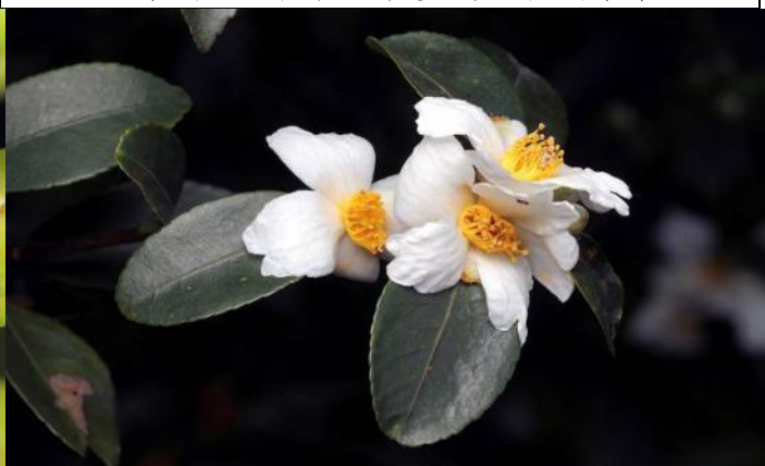
去年種植的短柱山茶早春已經開花