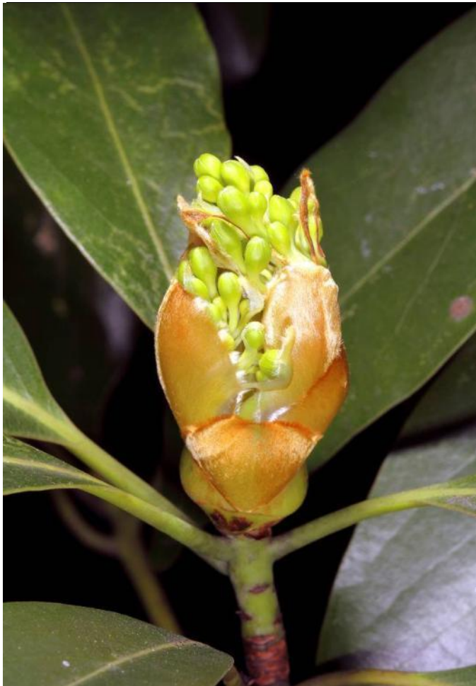
豬腳楠金褐色的苞片包裹著幼葉與花序