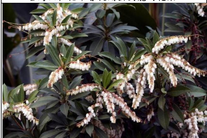
台灣馬醉木開出一串串鈴鐺狀的花朵