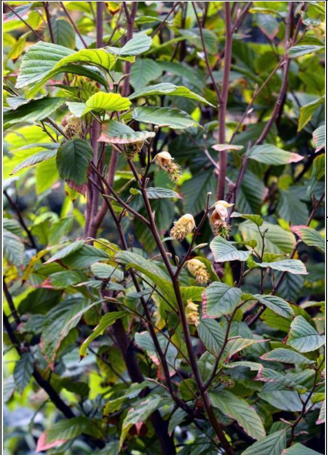
原生植物區珍貴稀有的台灣瑞木正在開花