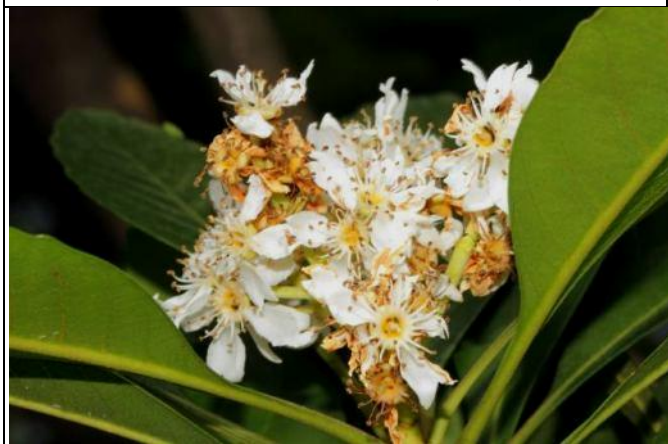
台灣山枇杷早春就開出美麗的花朵