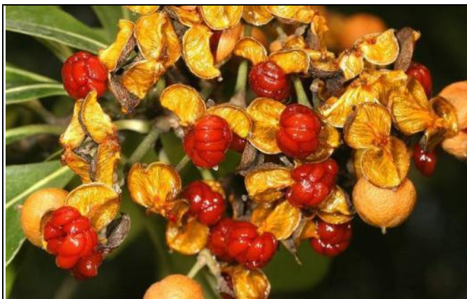
台灣海桐果實開裂，紅色種子十分誘人