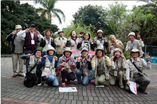
1月12日早上服勤各位志工老師合影