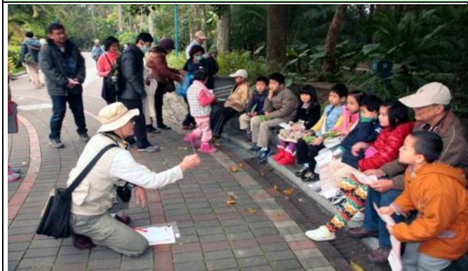
帶隊老師與隨隊記錄