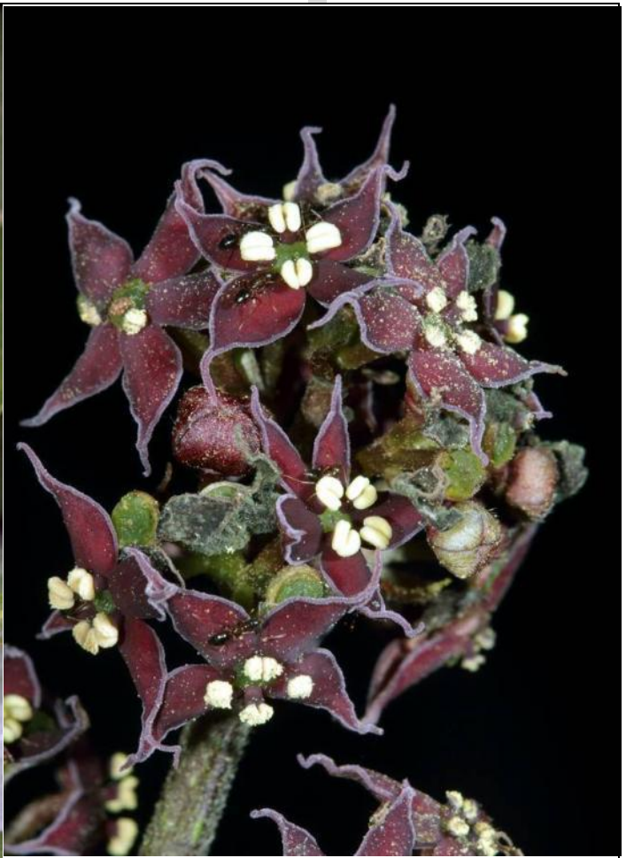
這麼美麗的桃葉珊瑚卻種植在廁所旁邊