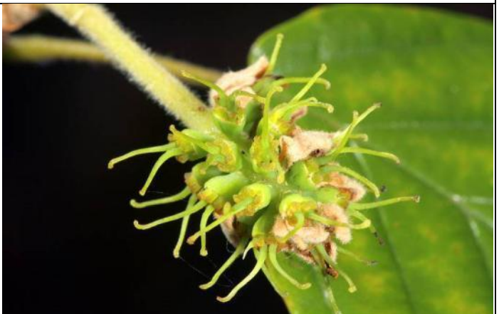
台灣瑞木雌雄同花，不同時間成熟，雌蕊成熟期