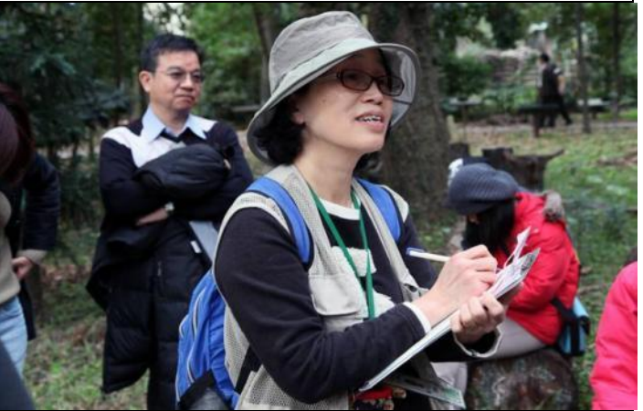
國明老師：各位看看這棵老樹有多高？在哪裡？