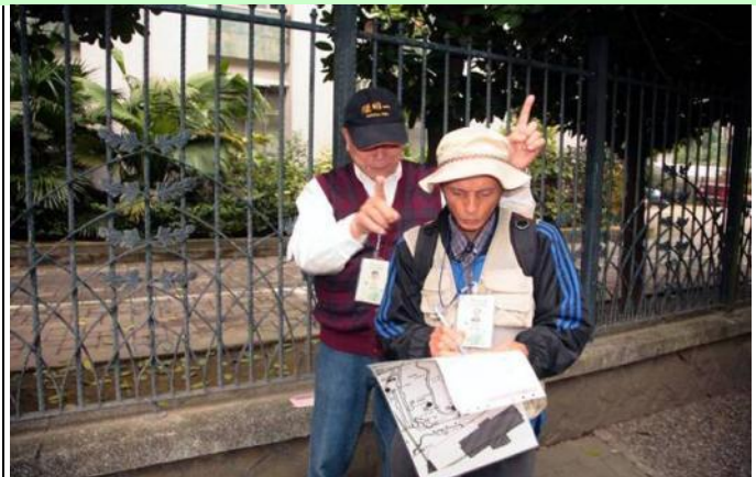
周老師跟文俊老師開玩笑，真是童心未泯