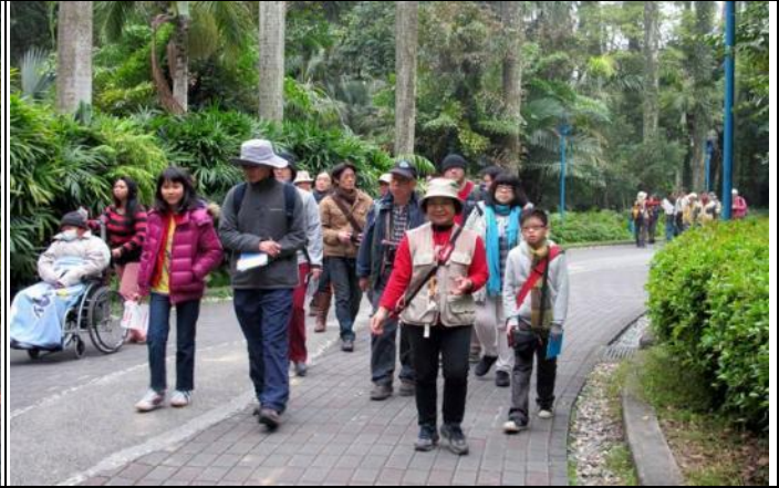
1 月 26 日下午服勤各位志工老師合影