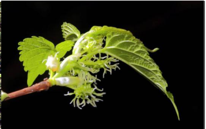
小葉桑為雌雄異株，圖為小葉桑的雌花序