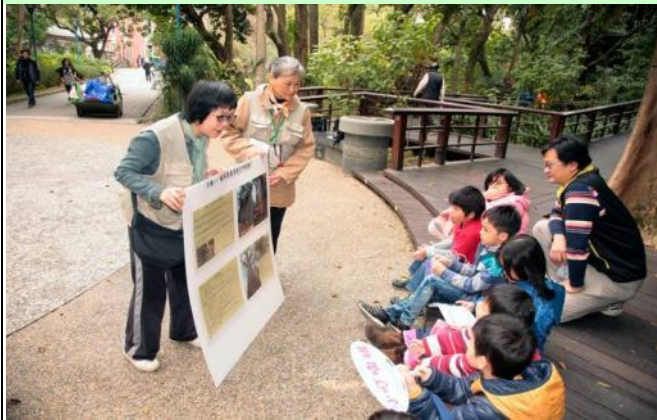
駐站第一站 活動一 "多老叫老樹"? 活動二 "老樹年齡的測量"