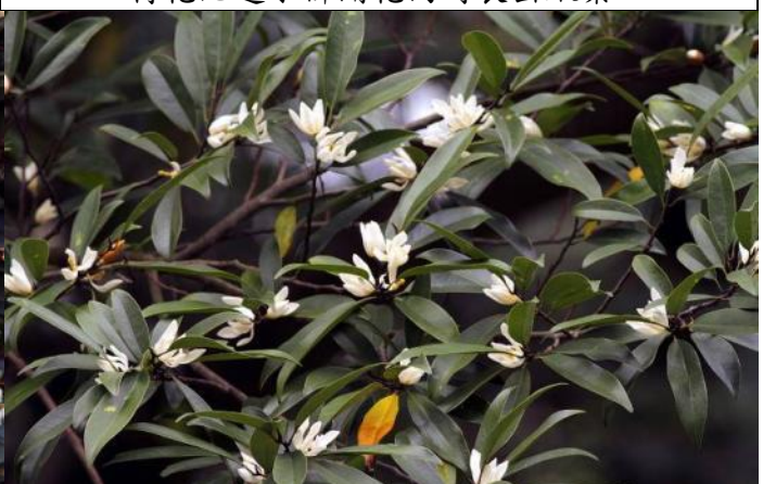
烏心石是闊葉一級木，花朵具有芳香