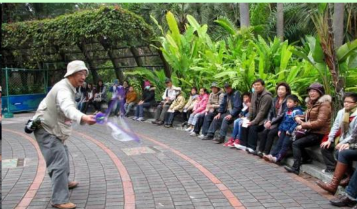
南海老師氣泡魔術一直是開場的亮點