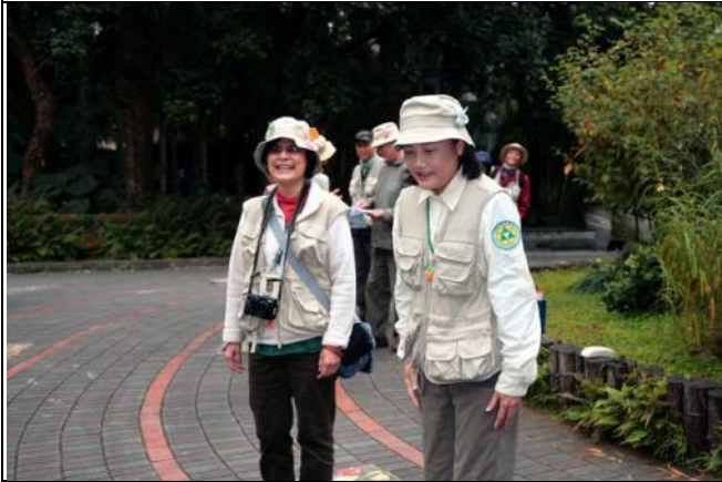
素華、素芳姊妹今年要多偏勞兩位了