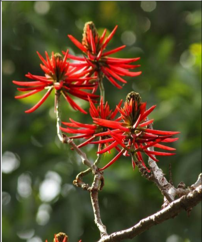
火炬刺桐花序像不像一把把的火炬？