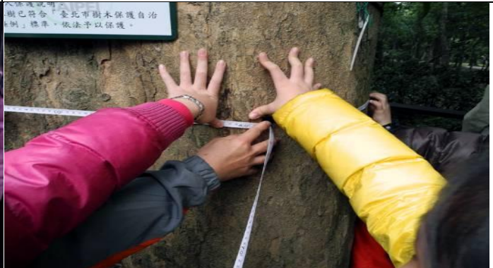
測量時皮尺一定要水平，否則就不準了