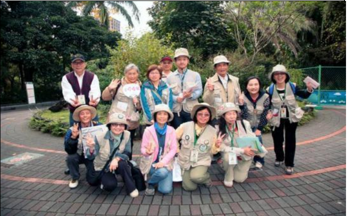
1月12日下午服勤各位志工老師合影