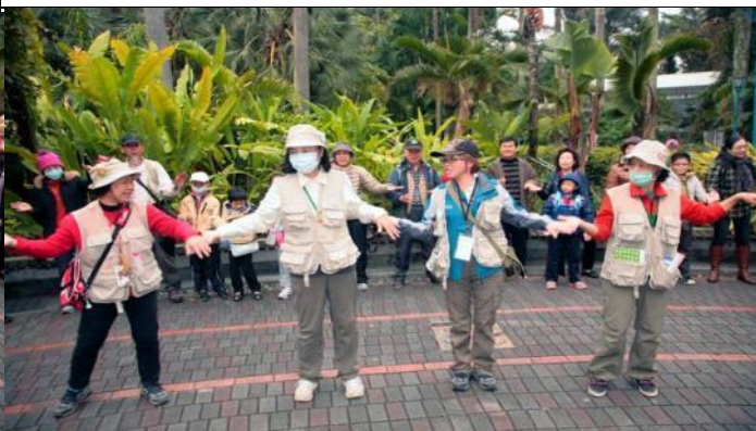
來，大家手牽手跟我一起做