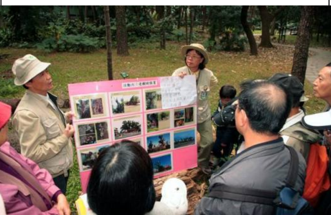
相新老樹有知一定會感謝大家為牠的祈福