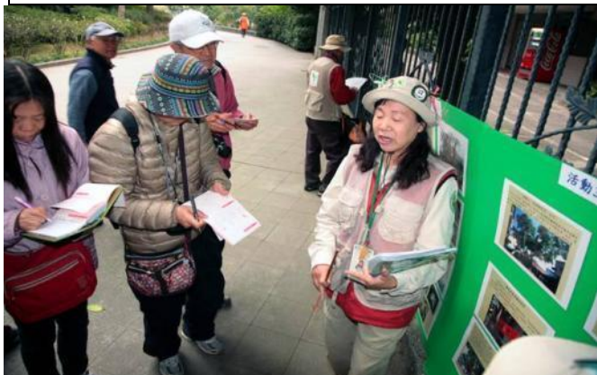
雪花老師非常認真的複習圖片解說內容