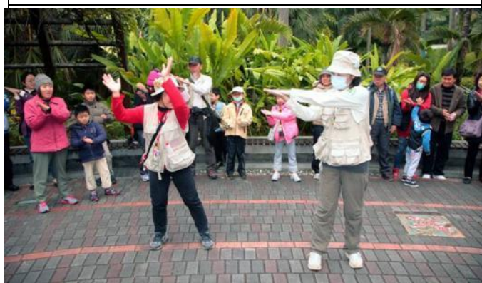
美香老師開場常常突槌，爆笑不斷