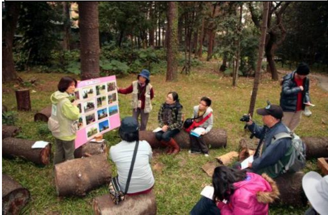
老樹消失有人為與自然的因素