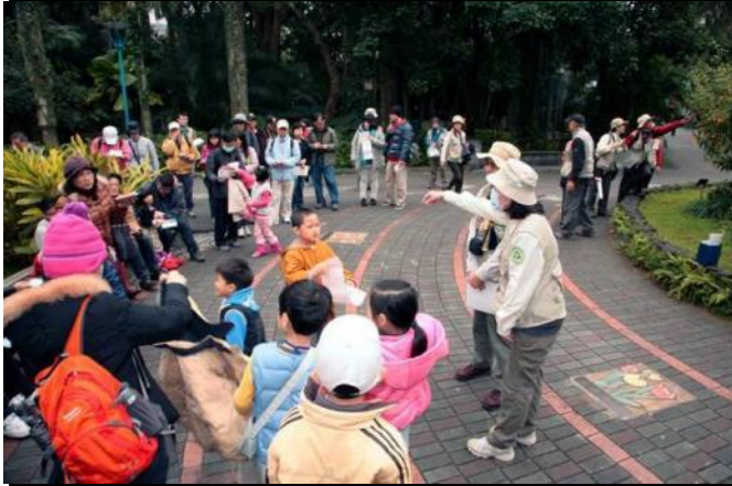
1 月 26 日早上服勤各位志工老師合影