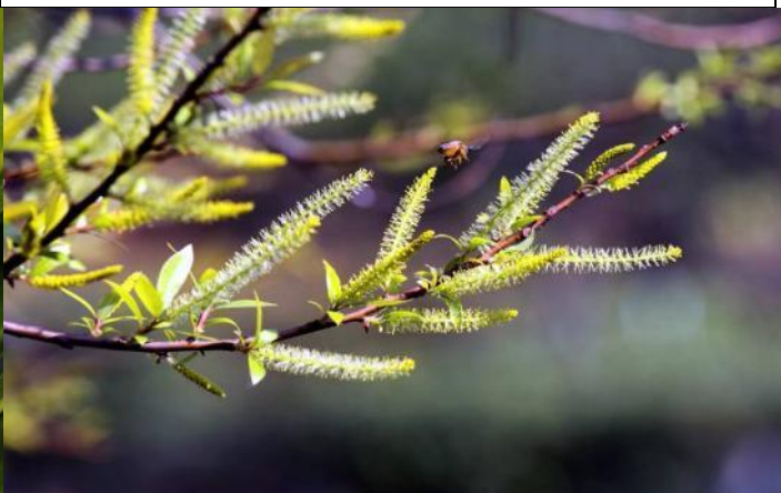
荷花池邊水柳開花同時長出嫩葉