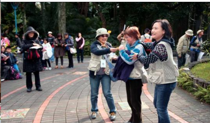
歡迎今年新任的組長與副組長