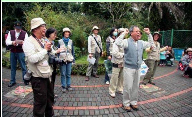
救國團陳老師精神抖擻的開場