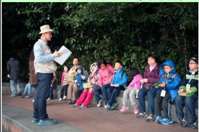
你們知道古亭名稱是如何演變，跟老樹有何關係