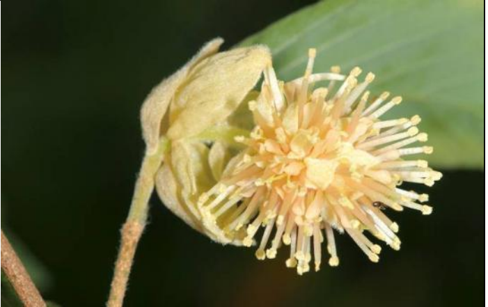
台灣瑞木雌雄同花，不同時間成熟，雄蕊成熟期