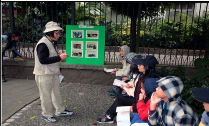
雪花與遊客分享老樹與各民族的歷史淵源