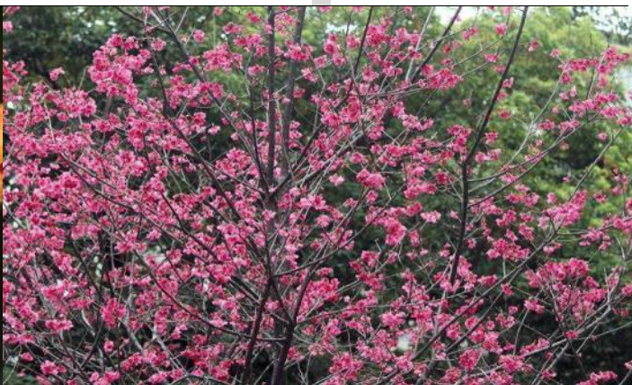
過年期間山櫻花正在盛開，喜氣洋洋