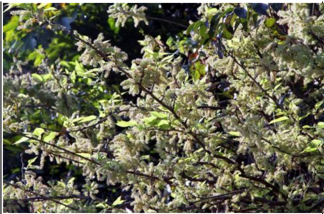
小葉桑在早春開花，圖為雄花序