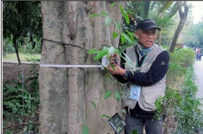
跟老樹抱抱，你看這姿勢可不可愛