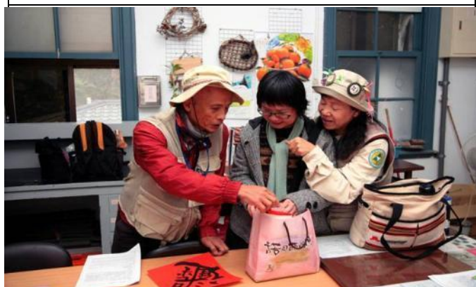
志工室內大家分配新年賀歲吉祥話