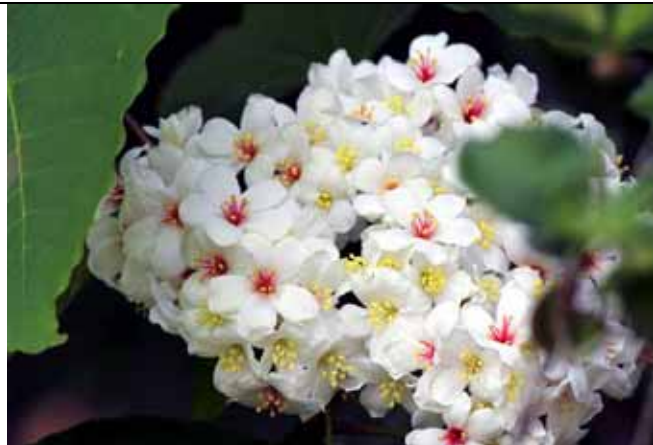
油桐美麗的白色花朵