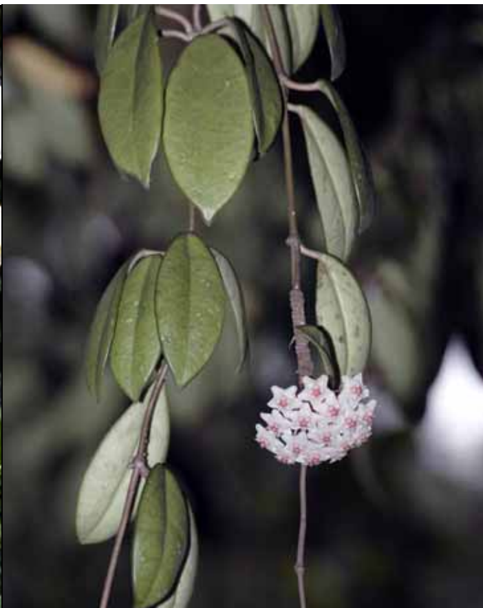
毯蘭是原生多肉附生植物，開花極美