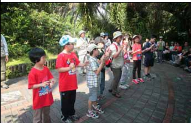
美香組長：伊比壓壓！捉到誰做錯有獎品