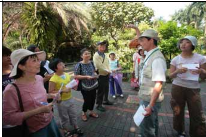
福和老師講的認真，遊客也收穫良多