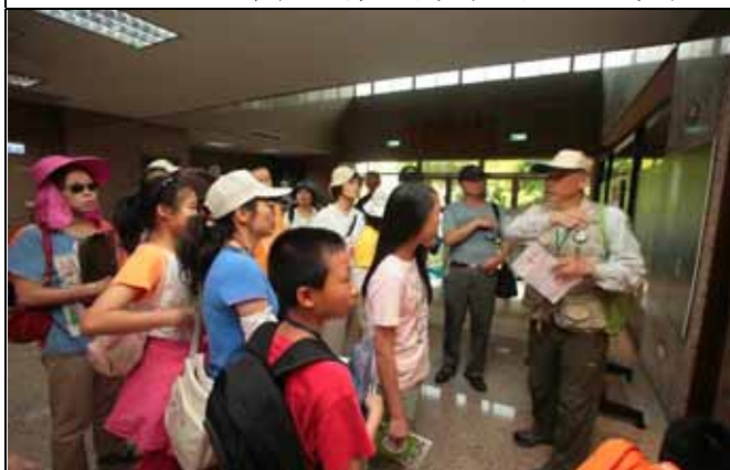
若大家對木材有興趣，歡迎週二至週五來參觀