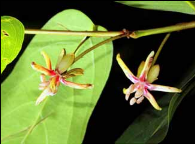
大風子的花非常小又常在高處不易觀察