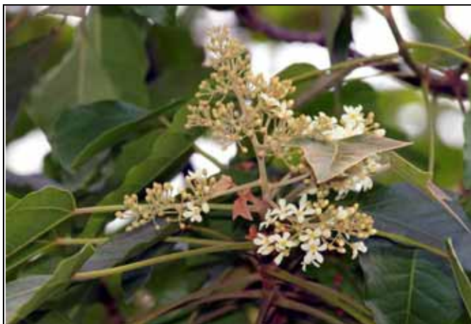
同屬大戟科的石栗開花就不如油桐豔麗