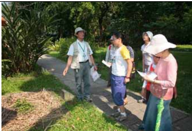
福和老師：稻草以前也是建築用的材料之一