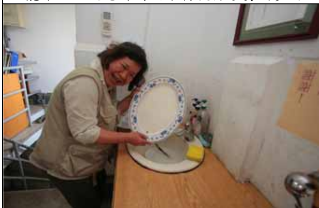
美香組長最辛苦，要煮飯還要兼洗碗