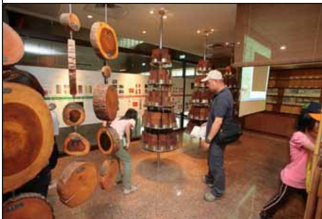
遊客對於木材館內的陳設標本非常有興趣