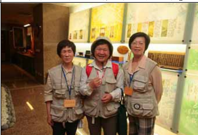
感謝木材組秋蓮老師、美雲老師幫忙解說