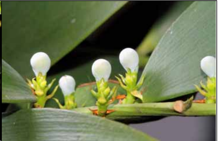
竹柏的裸露胚珠真像光頭小和尚