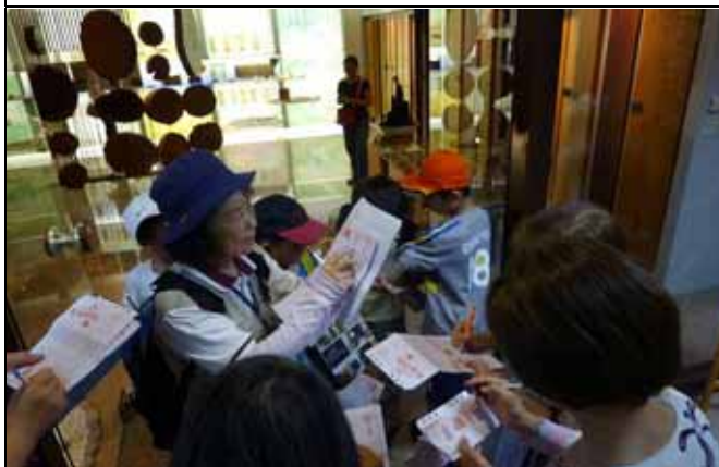
雪花老師帶隊與遊客討論摺頁內容