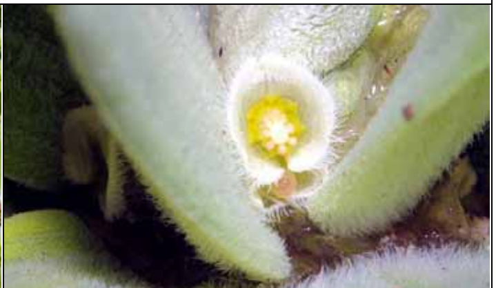
天南星科的大萍也是佛焰花序