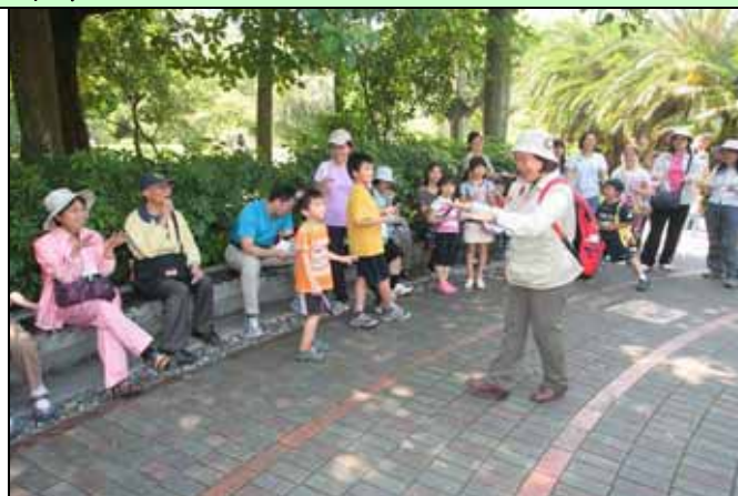
美香老師團康凝聚大家的注意力