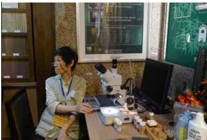
美雲老師協助秋蓮老師操作電腦