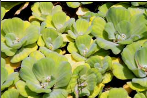
水生植物區大萍正在開花