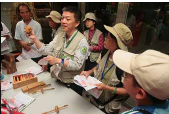
旺旺老師：你看這樣一劍穿心是如何製作的