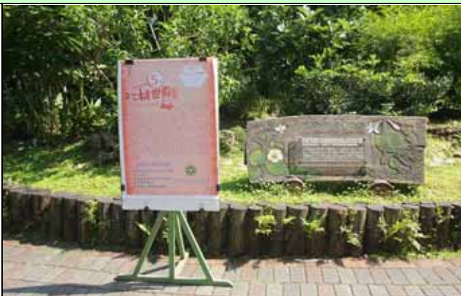
上午九點準時開講