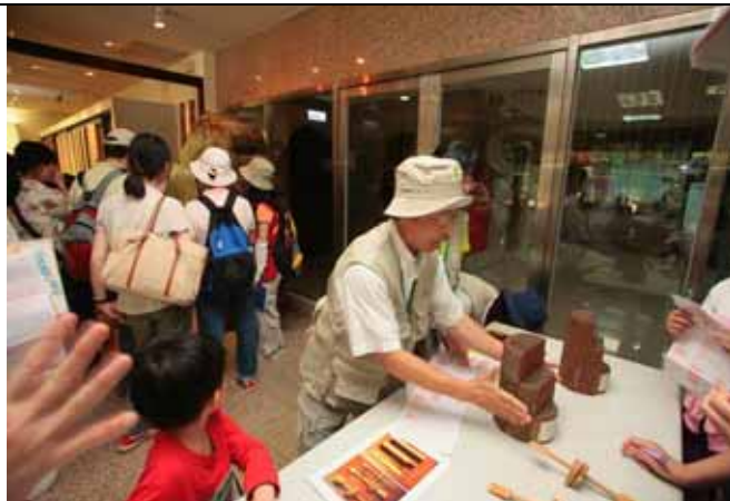
芳昌老師趣味介紹木材的三種切面