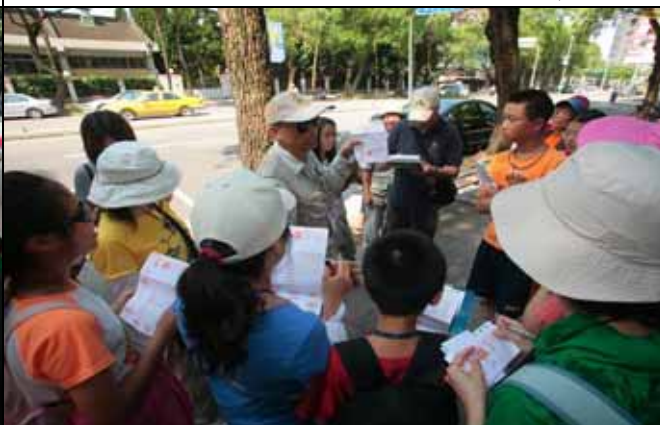
砍樟樹的人叫腦丁，背的袋子叫「腦袋」