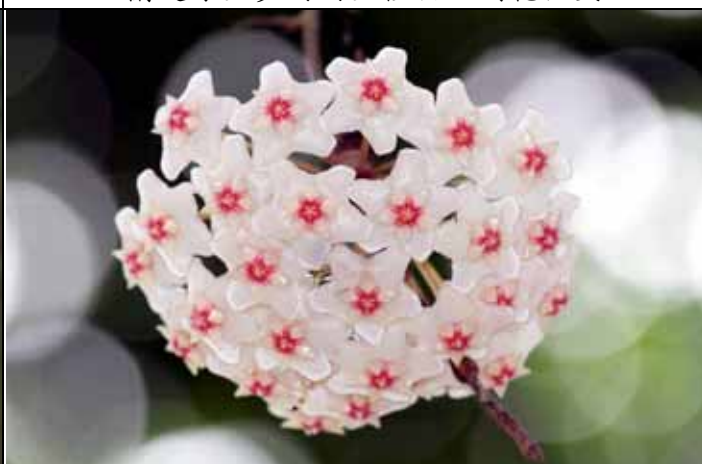
毯蘭的花肉質具副花冠，非常具有觀賞性