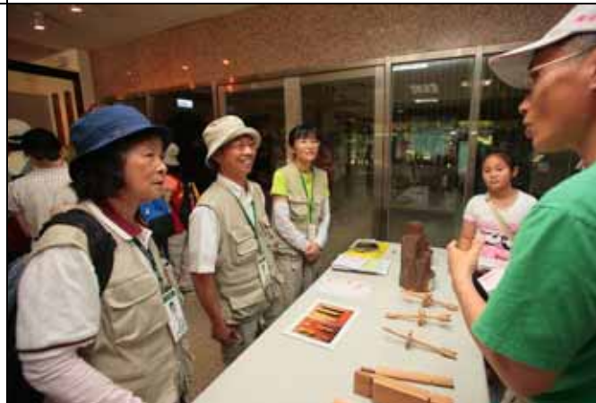
遊客認真聽講不斷提出非常有深度的問題