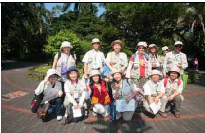
早上服勤志工大家合影紀念