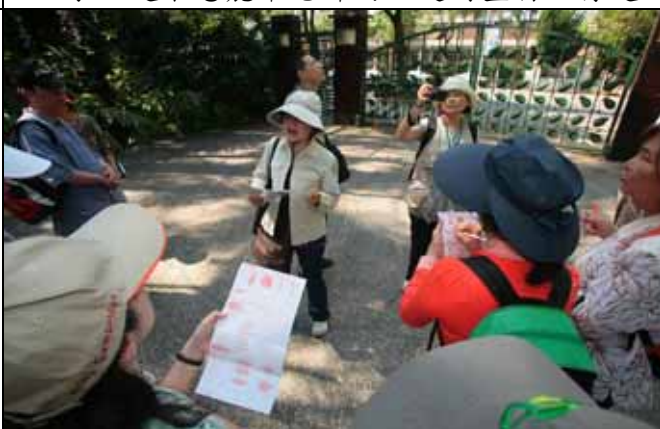
月明老師帶隊介紹各種常見的樹木用材