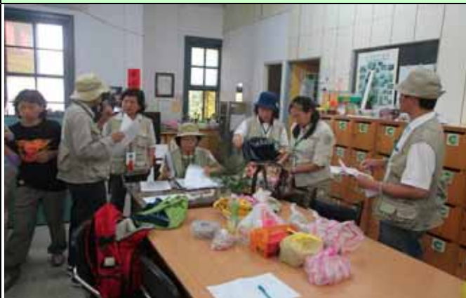
早上志工室內大家都在忙著準備解說講稿