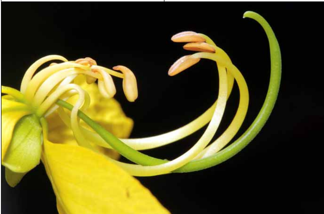
豆科的阿勃勒是常見的行道景觀樹木，其特殊的花蕊構造具有極為獨特的授粉機制