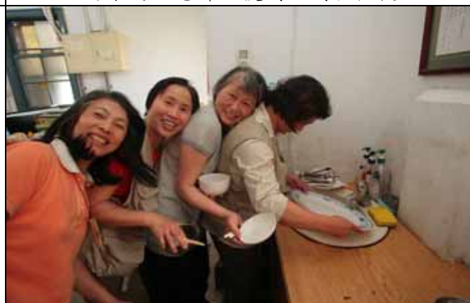
有這樣排隊洗碗的？恐怕是來亂的吧！