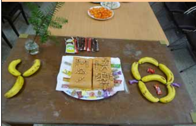
大家看出來香蕉所排出的字嗎？原來是阿母