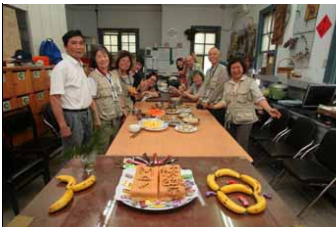
用餐前大家快樂合照，祝母親節快樂