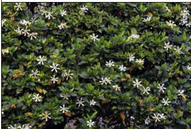
原生的梔子花具觀賞性又是香料植物