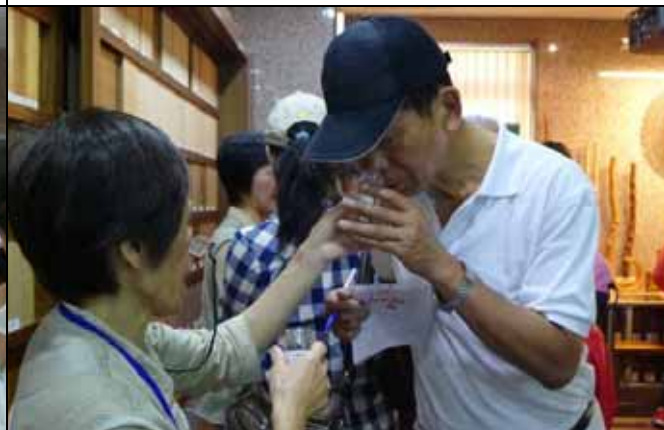
木材精油是不是具有非常特殊的香味