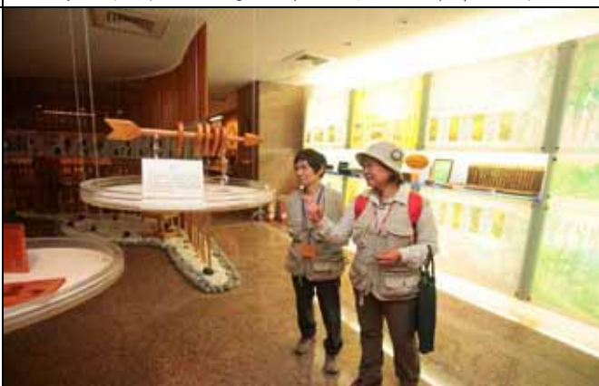
一劍穿心真的是非常奇妙的木材加工成果