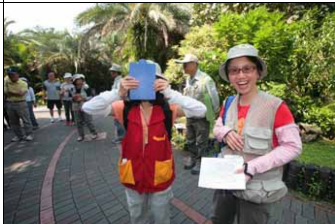
維英老師你是不是鬼片看多了！