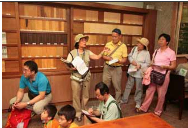
麗華老師有經木材認證，也幫忙解說