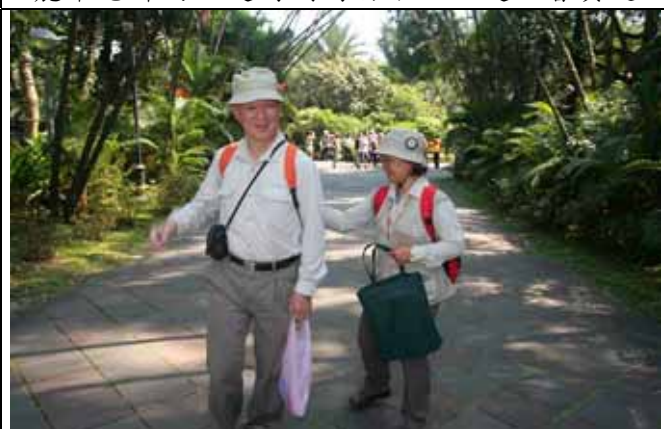
煥光老師、美香組長是大家最好的後勤支援