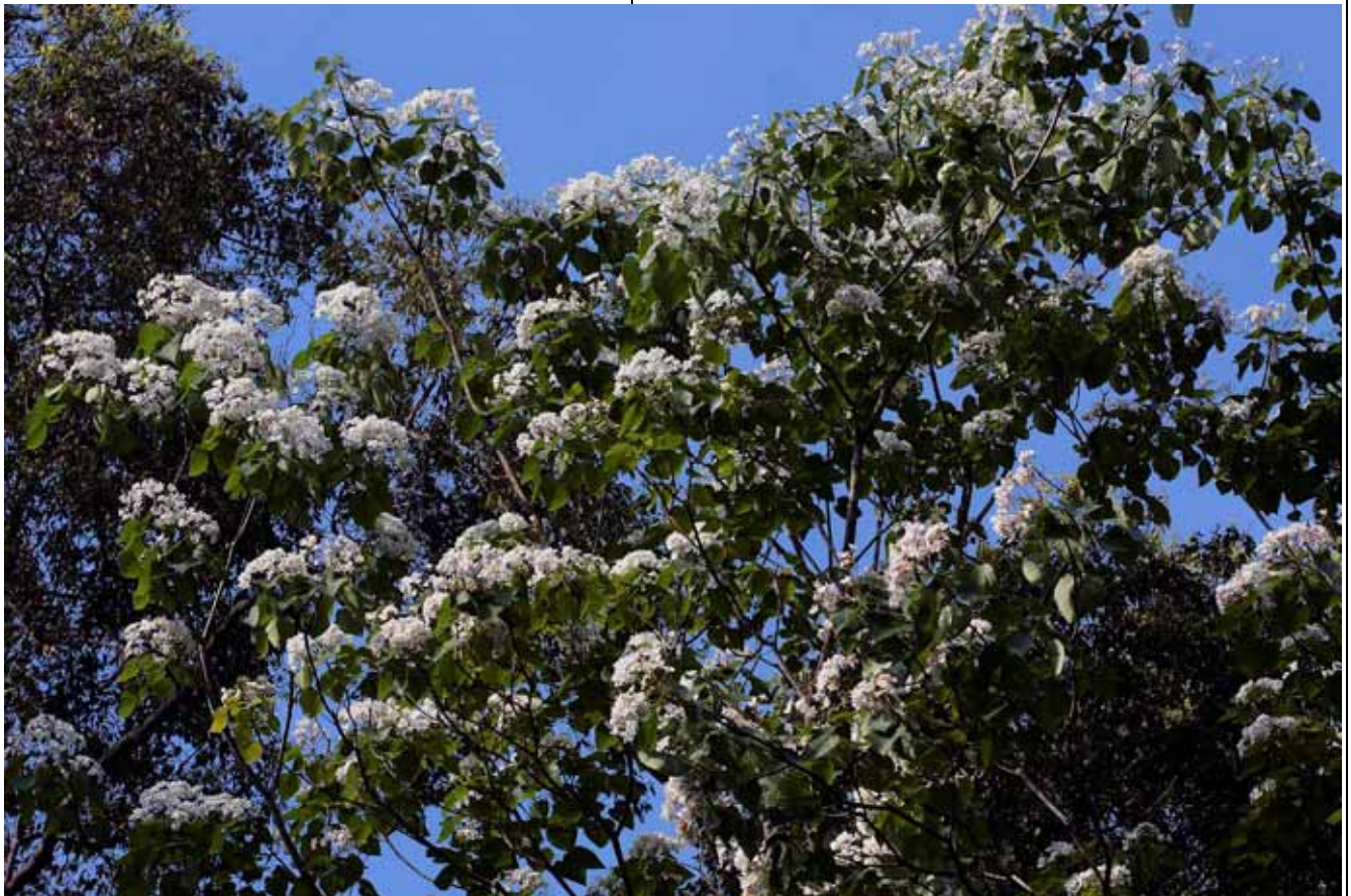
五月最出名的該是低海拔大片油桐開花，土城還有桐花公園，遊客絡繹不絕，還要交通管制