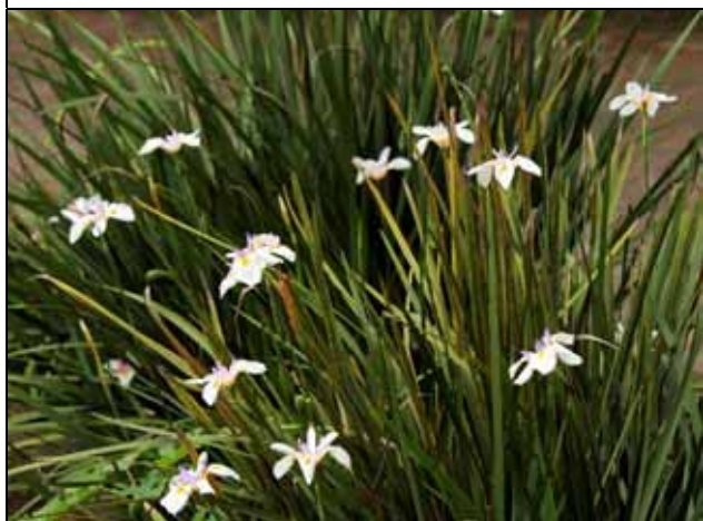
烏葉鳶尾現正盛開，藍白色花朵非常醒目