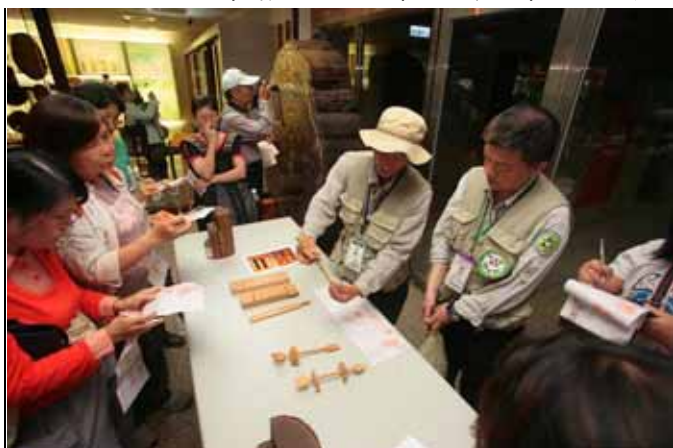
文俊老師解釋一劍穿心是如何製作的過程