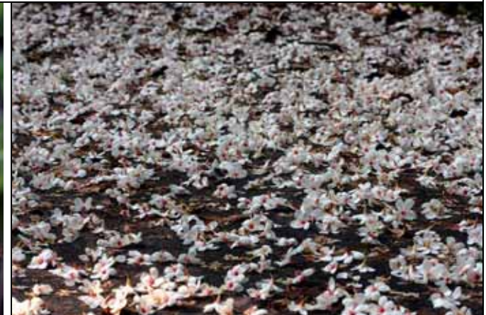
遍地落花，所以又有五月雪的美稱