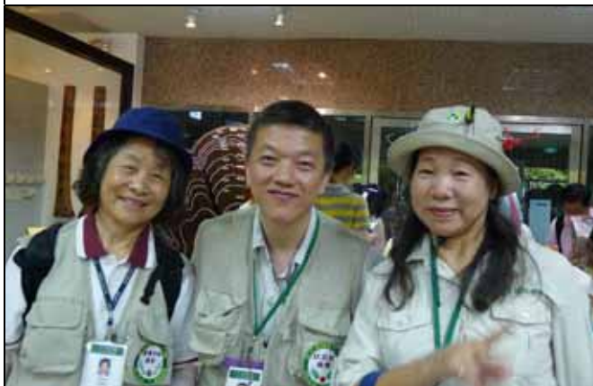
最可愛的帶隊老師：雪花、永芳老師