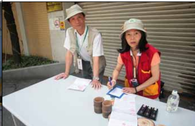
維英老師下次講解要帶凳子，否則真難拍到你