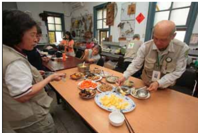
努力加餐飯，下午還要再努力