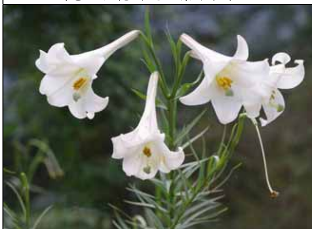
台灣百合花瓣有紅條紋可與鐵炮百合區別