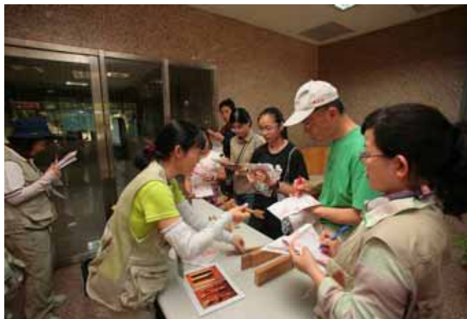
仰恩老師：大家猜猜看一劍穿心的製作過程