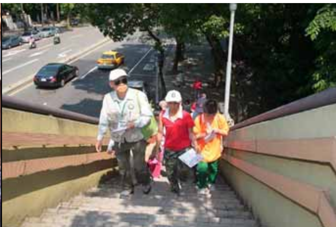
難得要去木材館參觀，大家走天橋以策安全