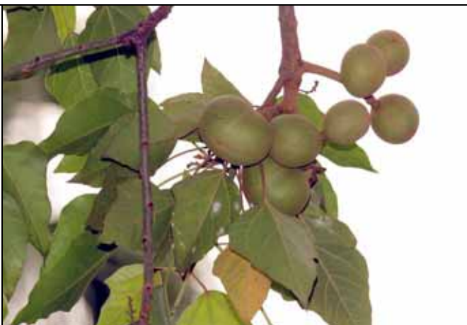
石栗種子可供榨油