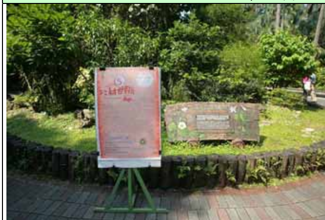
下午兩點，下午解說準時開場