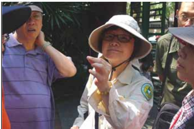
你看琉球松的針葉是幾針一束