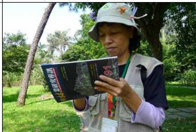
蔡蔡老師勤奮做筆記，將講解內容記錄下來