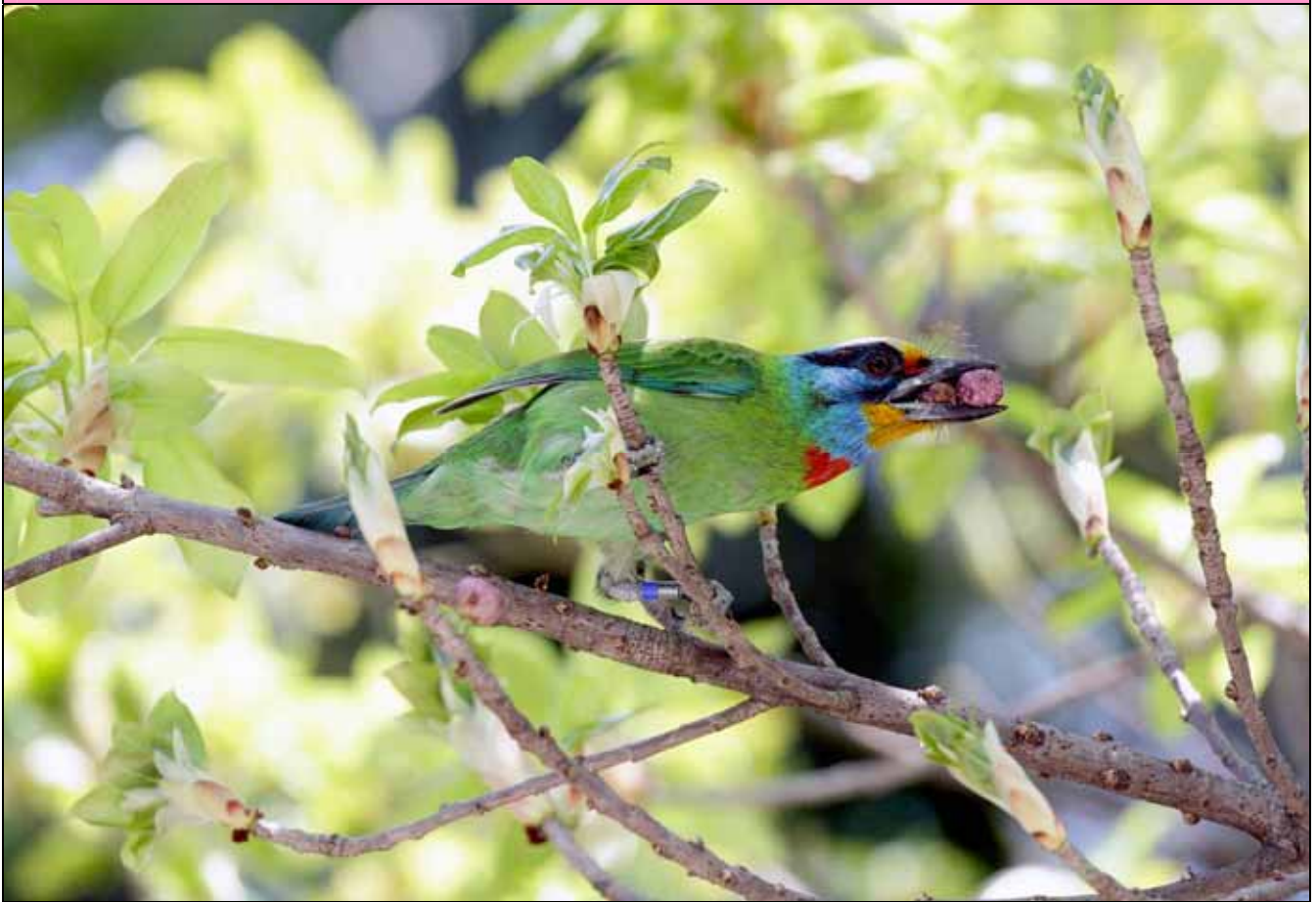
現在是許多鳥類的繁殖季，掛上腳環的五色鳥啣滿口的雀榕果實回巢餵幼鳥