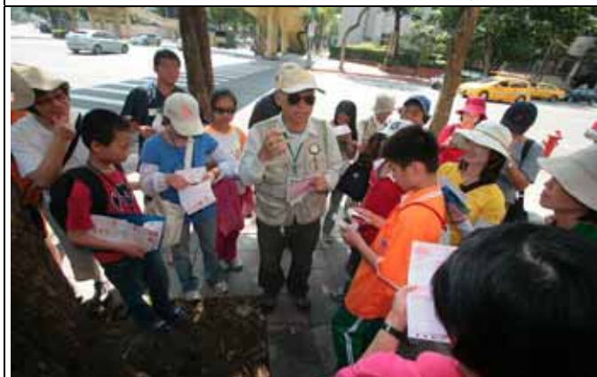
丁老師：是念茄（音加）苳樹而非茄苳樹