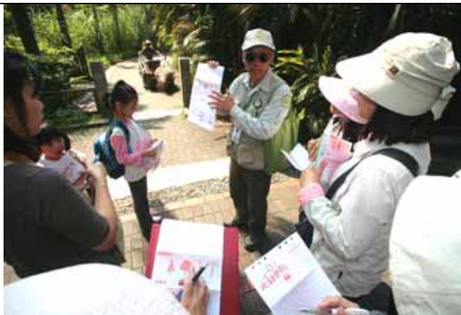
丁老師先介紹遊客觀察各種不同的樹木特徵