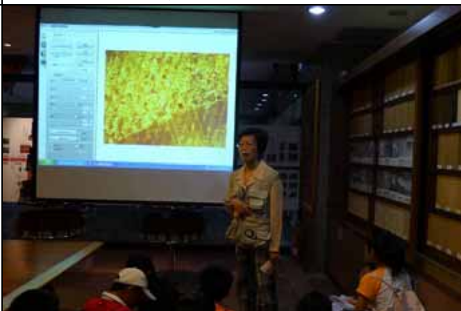
木材館內有周全的視聽解說設備