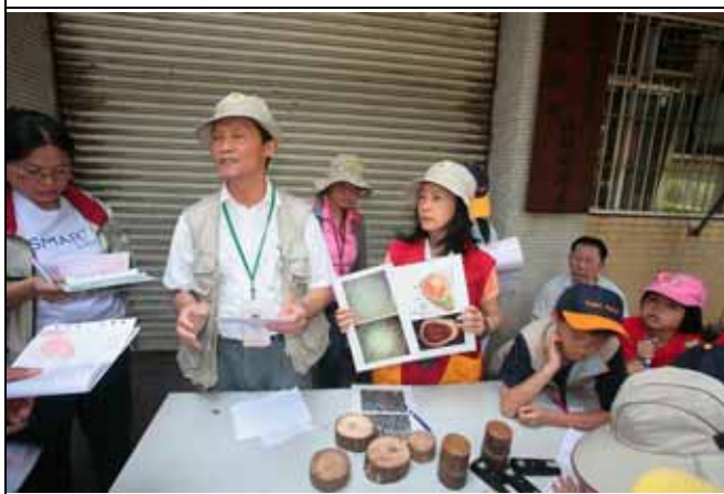
福和、維英老師介紹各種不同植物莖的結構