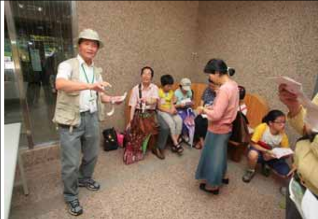
認真的福和老師最後還為遊客總結討論