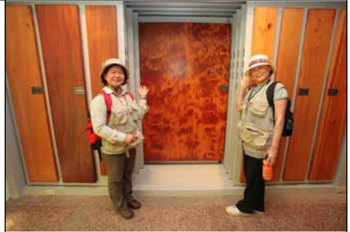
能跟這片千年扁柏切片合照真是榮幸