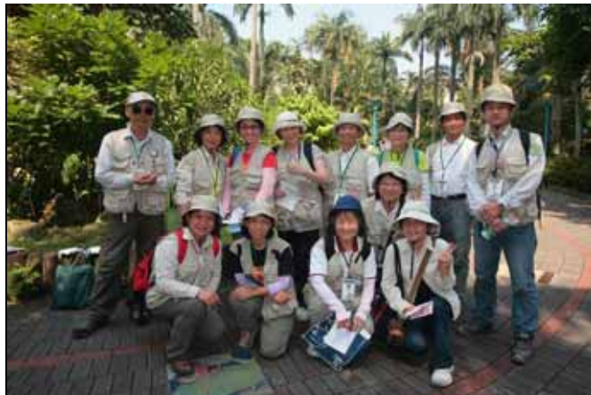
下午服勤的各位志工老師合影紀念