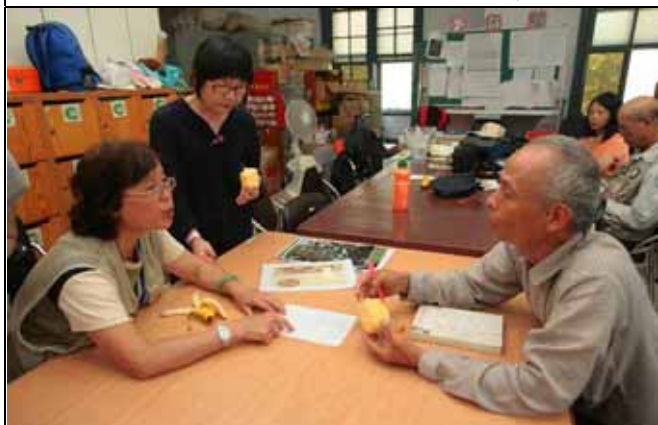
麗華、文俊老師討論木材枝條修剪的步驟