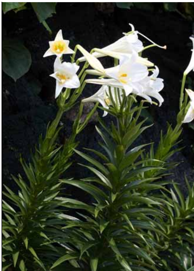
鐵炮百合花瓣純白葉子較粗短