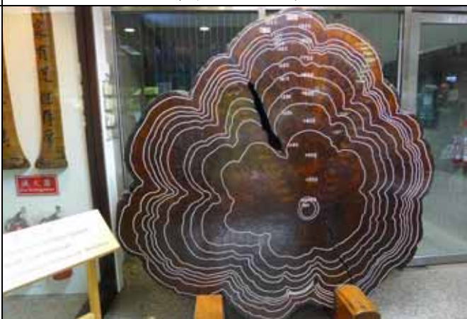
木材館入口的千年台灣扁柏可稱為國寶