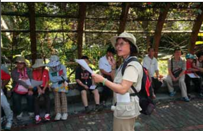
麗華老師的主題詩開場將今日主題融會貫通