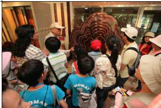
這棵扁柏有一千年歷史，真是我們的國寶