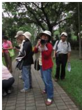
忘了裝相機的記憶卡