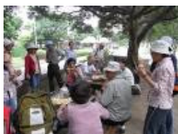
忘了時間 忘了吃飯