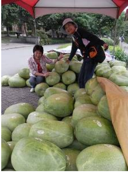
愛用國貨!來吃甜西瓜吧!