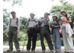
日頭赤炎炎~真用功