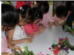
數吧!數完才能下課!