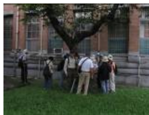
美女攝影師 or 徵信社