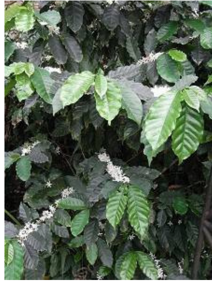
今年咖啡會大豐收!到時候來喝咖啡吧!