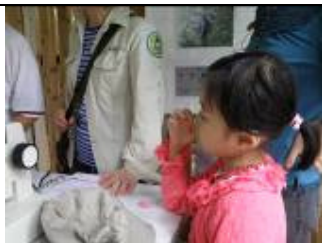
這次的學習單. 甜.. 真好吃!