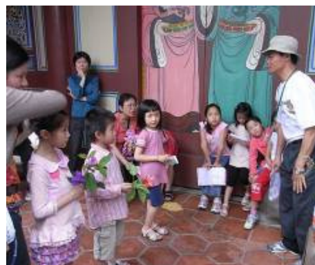
下午的小朋友最甜, 是蚊子的最愛!