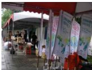
雨!結束了活動,散不了聚植物園的人影!