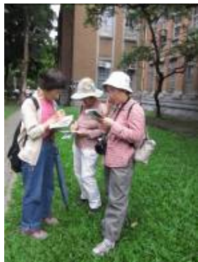
忘了有人拍照存証