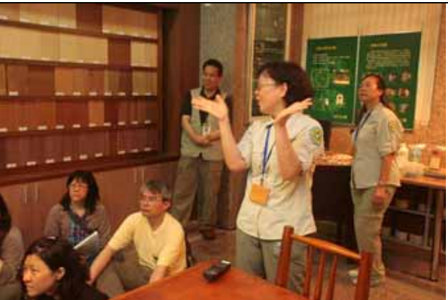
爾玟老師今天幫忙介紹木材館，生動的手勢與表情增加不少吸引力