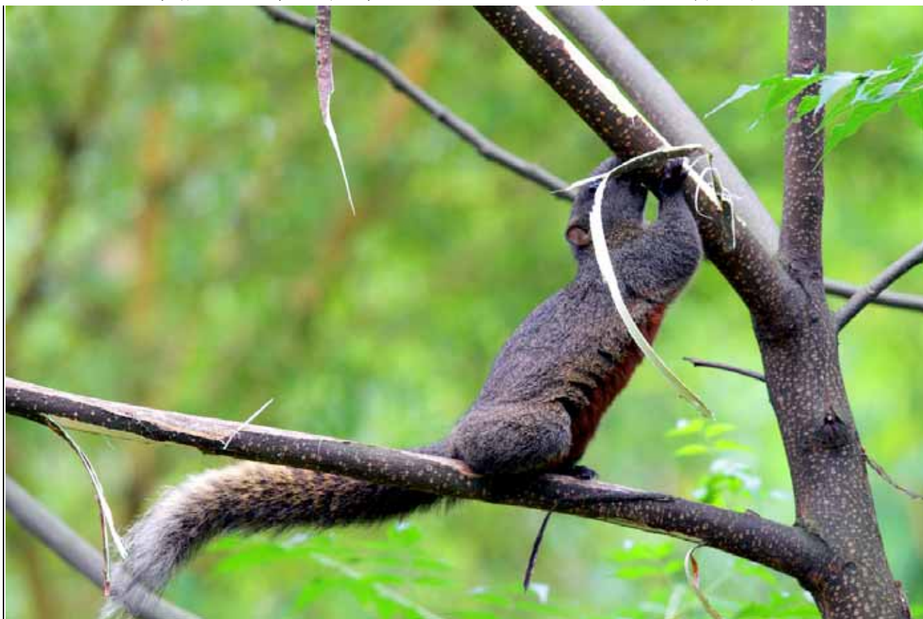
松鼠雖然可愛，但尖牙利齒卻也是樹木的殺手，圖中的苦楝樹樹皮就遭殃了