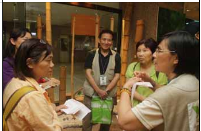
素華以生動活潑的方式介紹木材館的各種展示