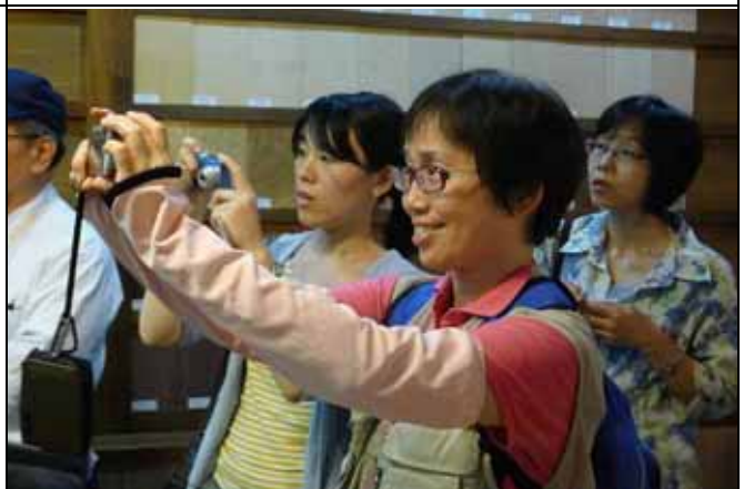
這麼珍貴的鏡頭要趕快拍下來