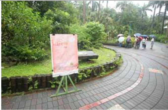
上午九點，天降大雨，但解說仍準時舉行