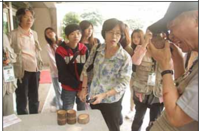
我來示範一下用放大鏡觀察木材結構