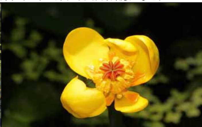
原生植物展示區的台灣萍蓬草花朵