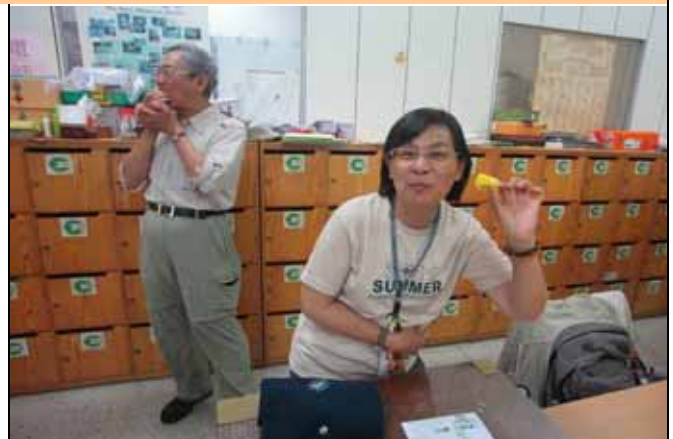
哈哈！我搶到了！鳳梨真甜！