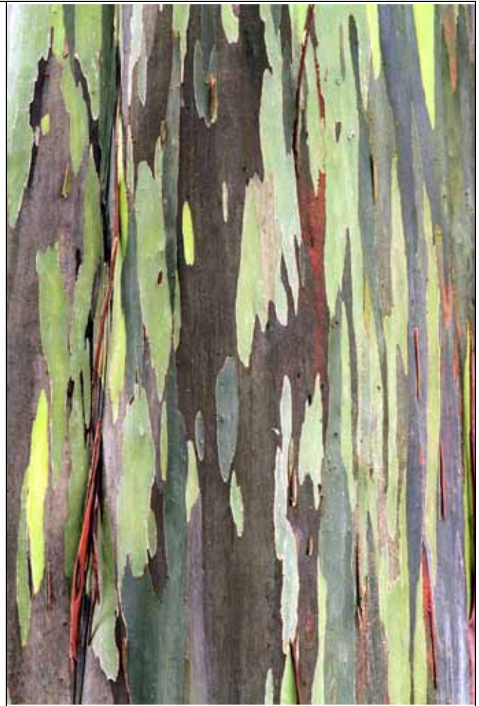
粗皮桉每年都會脫皮，產生各種美麗的顏色