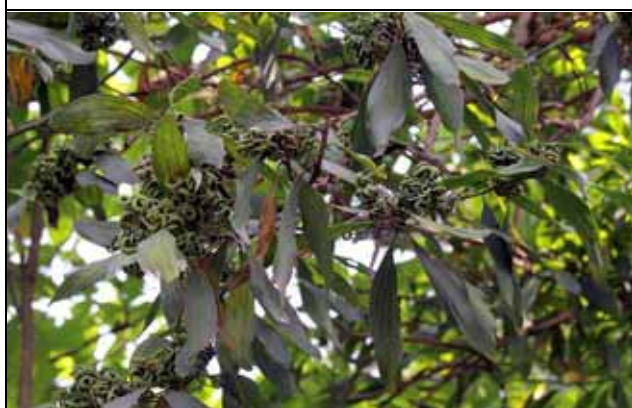
直幹相思樹扭曲的豆莢非常有趣