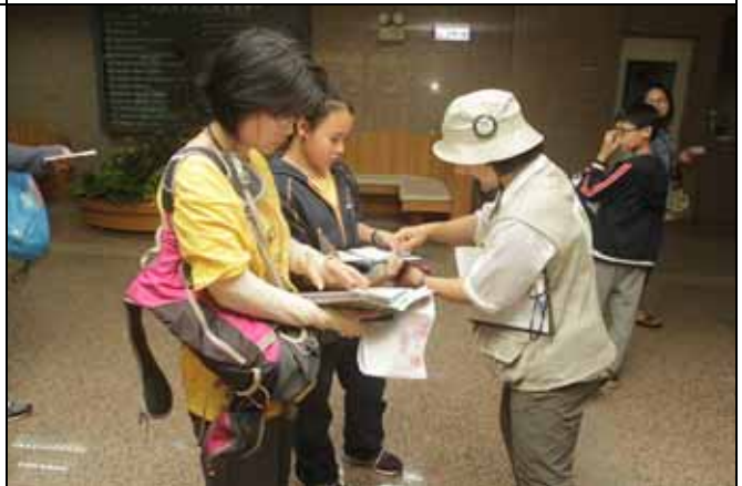
美香組長熱心的幫遊客蓋章