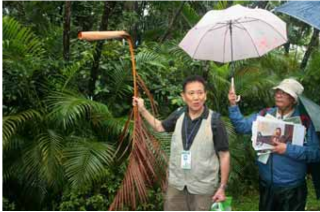
黃椰子葉子圓筒狀的是它的葉鞘部分