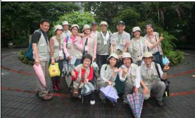
123 雨傘放下，趕快留下這張服勤記錄照