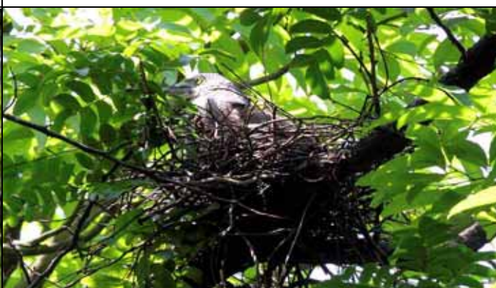
黑冠麻鷺在台灣赤楠上築巢繁殖（已離巢）