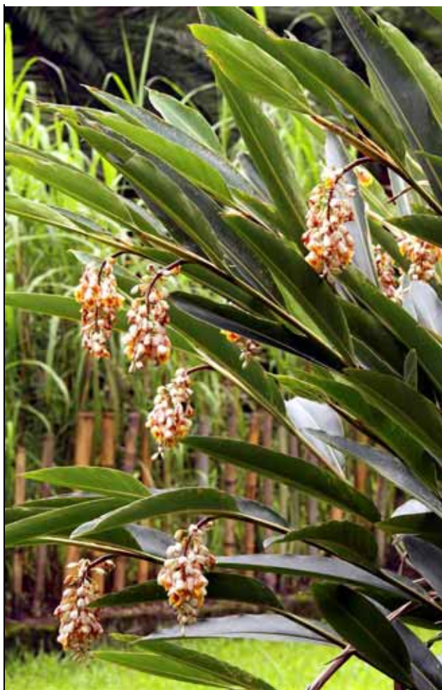
月桃正在盛開，一串串下垂的花序非常美麗