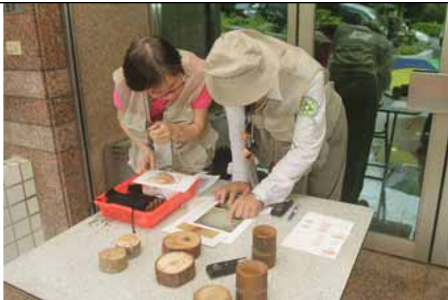
來！我們先討論等一下要講的內容