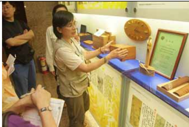
這些都是手工非常精巧的工藝品