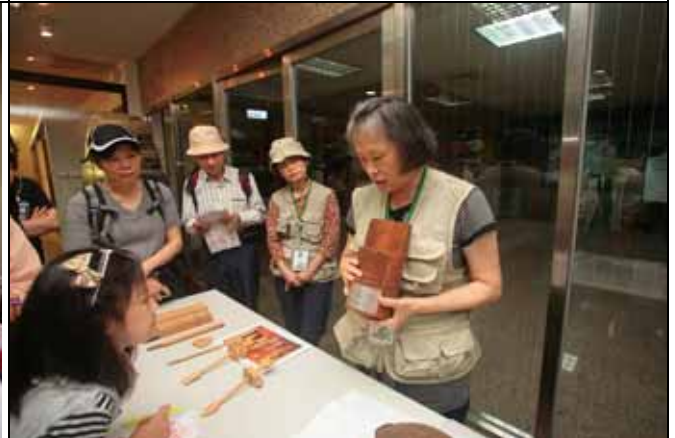
小玲老師介紹木材的三種切面方法