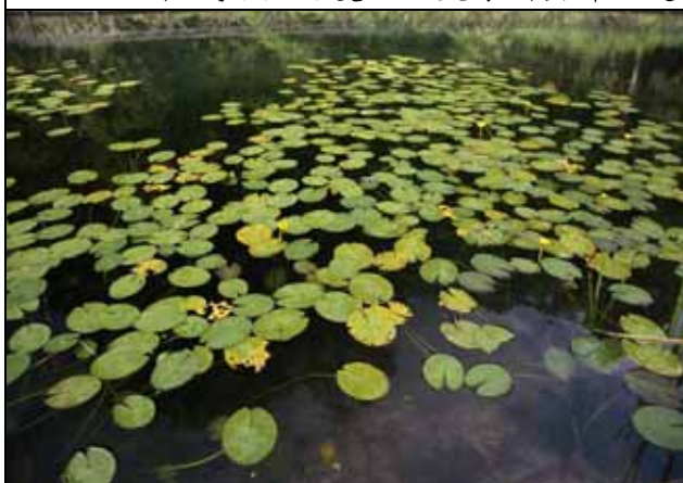
台灣萍蓬草是非常美麗的原生植物（福山）