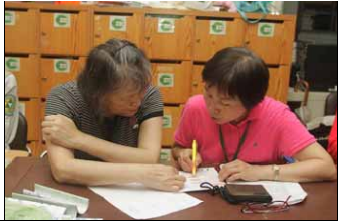
小玲與秀珍老師在討論下午的解說內容