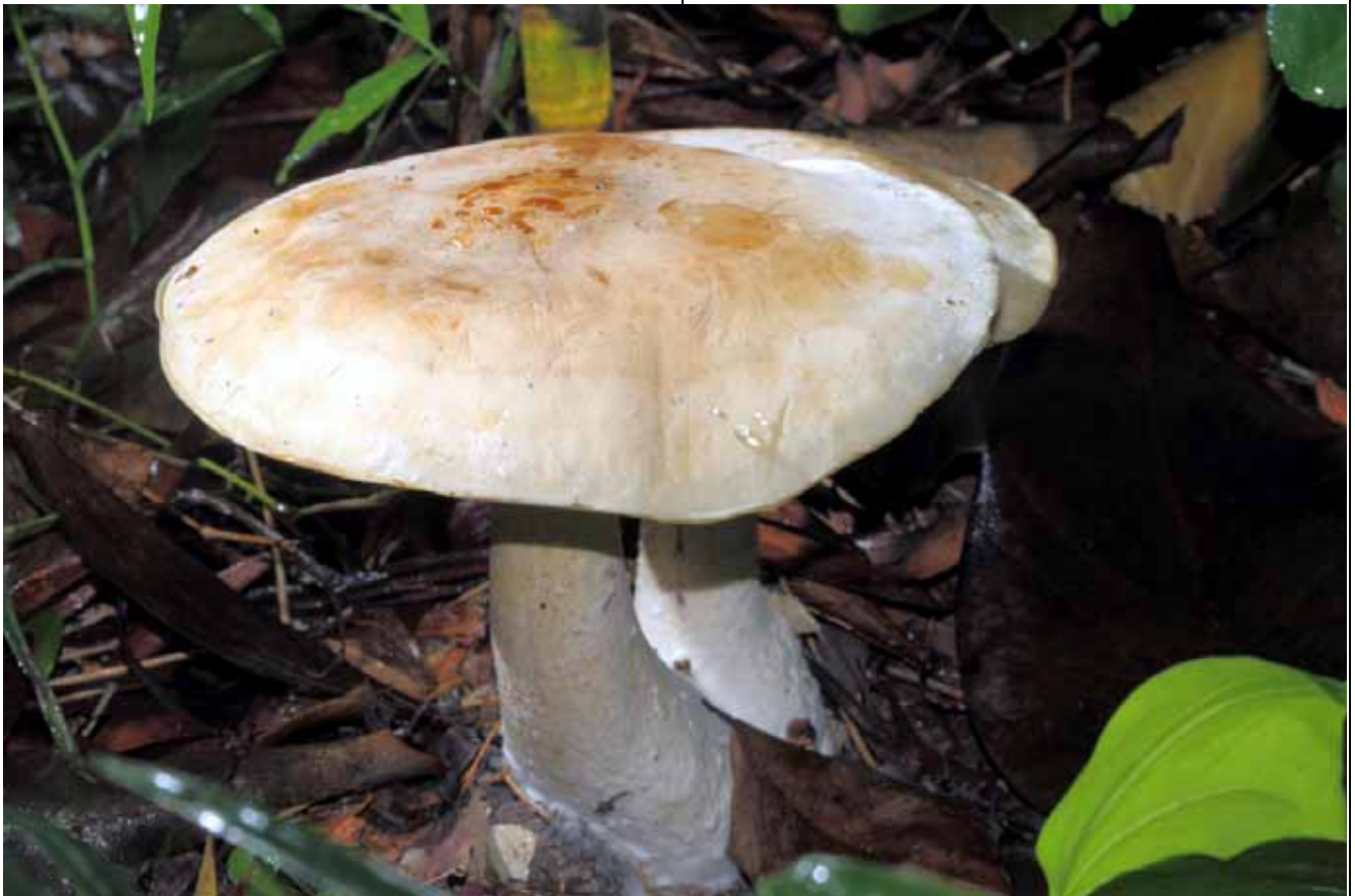
在天南星科植物區的巨大口蘑被人採走了！