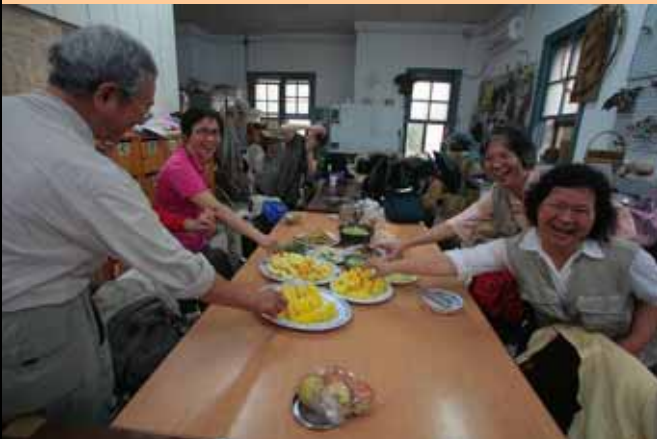
飯前吃水果！大家快來搶！