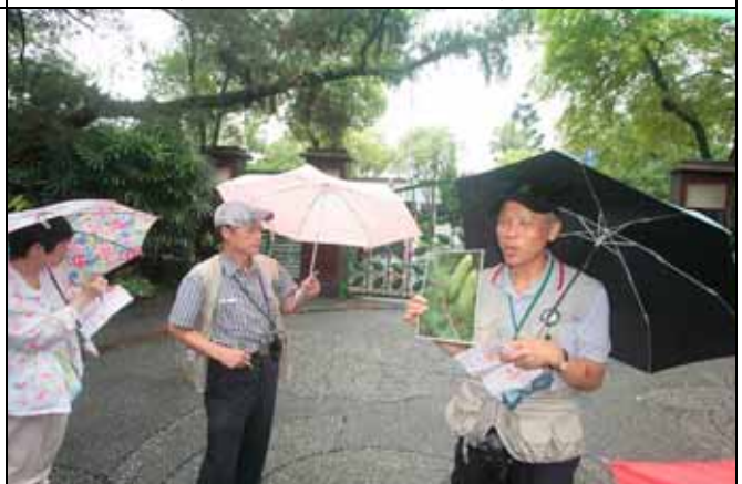
台灣油杉是屬於不連續分佈的稀有樹種