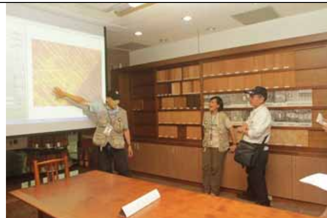
丁老師協助介紹木材切面紋理的產生