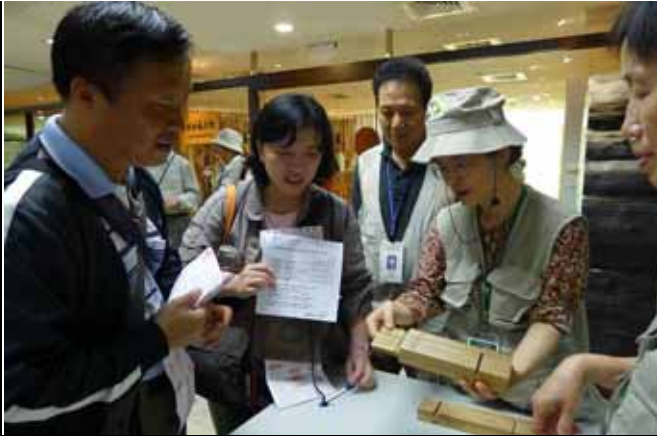
秋萍老師介紹一劍穿心是如何做到的