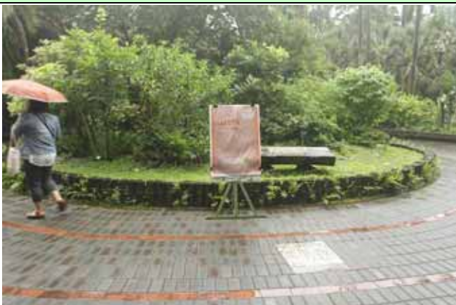
下午兩點，雨勢轉小，解說準時開講