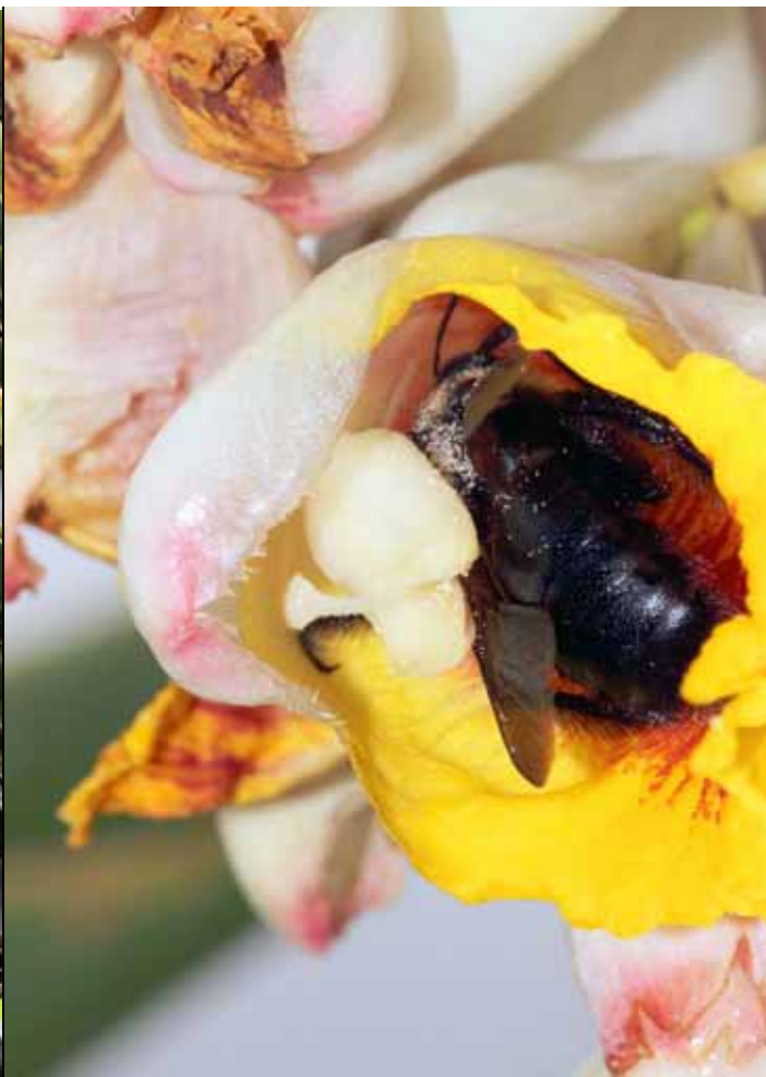
月桃由大型的蜂類傳粉，柱頭上翹避免自花傳粉