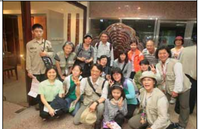
志工老師與遊客跟千年扁柏切片合影