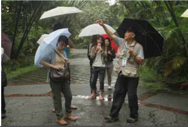
丁老師：琉球松、台灣二葉松其實血緣很近