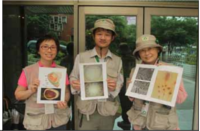
家蔚、秀珍老師下午講解木材的結構