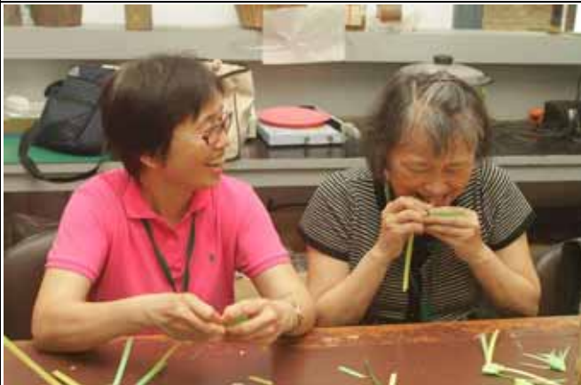
唉呀！這塑膠繩可真硬，我牙齒快斷了