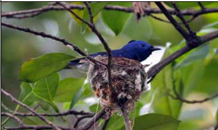
黑枕藍鶇正在殼斗科植物區築巢