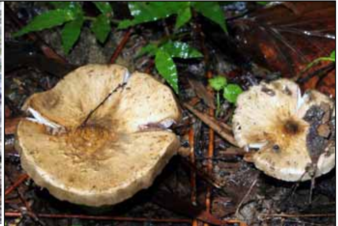
雞肉絲菇與白蟻具有非常密切的關係