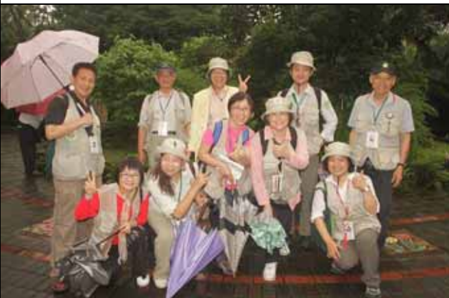
雖然天公不作美，但大家仍要擺出最美的 POSE