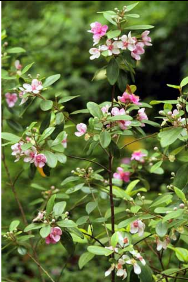
桃金娘是非常美麗的原生觀賞花卉