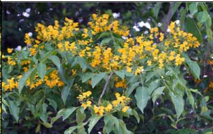
印度紫檀小巧美麗的黃色蝶形花