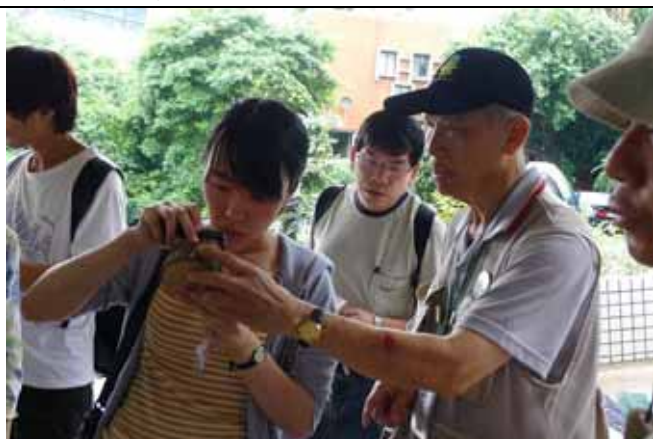
日本朋友非常認真，每週都來聽課