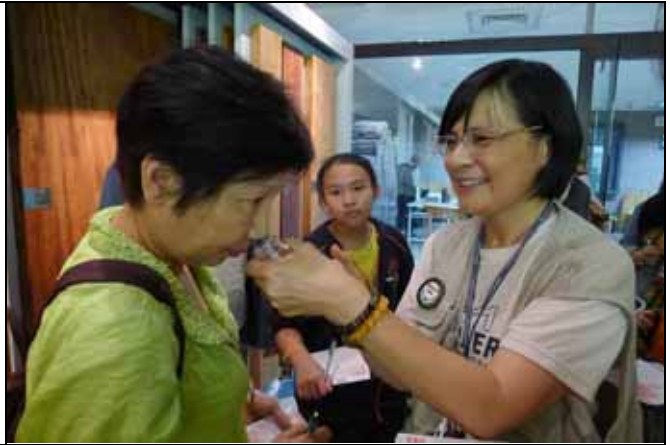
來！聞聞看這味道是不是很香