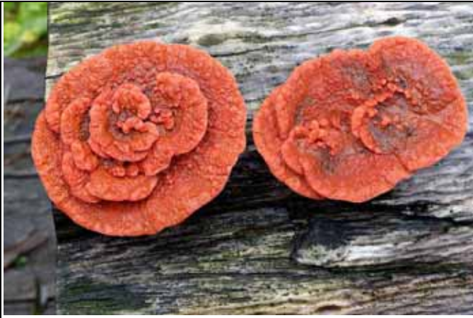
在遊客諮詢服務處前的血紅密孔菌也被採了