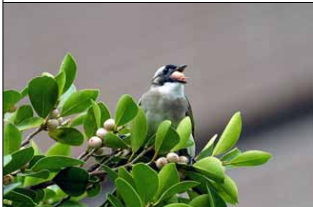
白頭翁是園區常見的鳥類，也是種子的傳播者