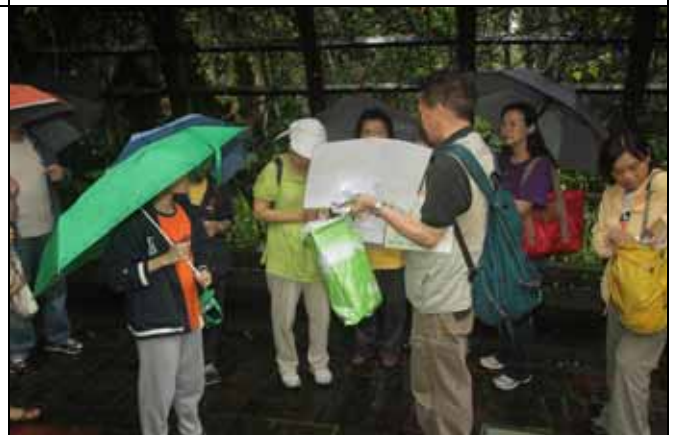
熱心的華光老師帶了許多圖片幫助解說