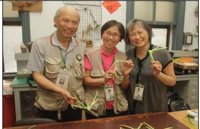
丁老師教了兩個很認真學習的徒弟