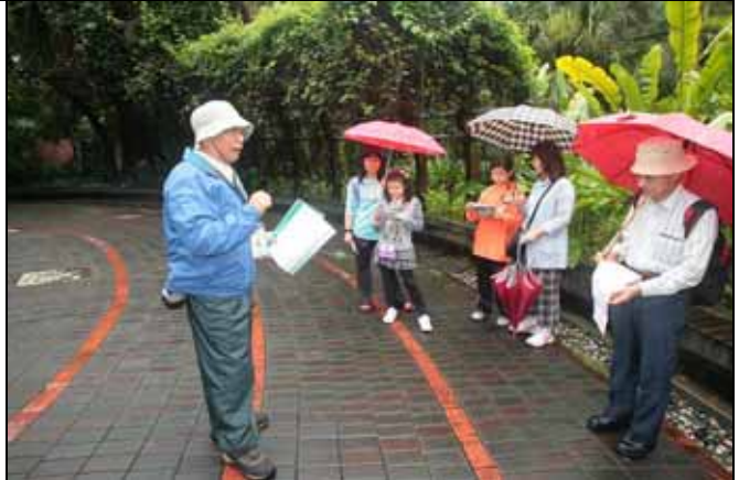
首先，南海老師介紹今天主題內容