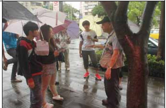
台北楓是樟葉楓和三角楓的雜交種