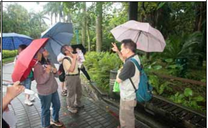
華光老師：茄苳有公有母，屬於雌雄異株