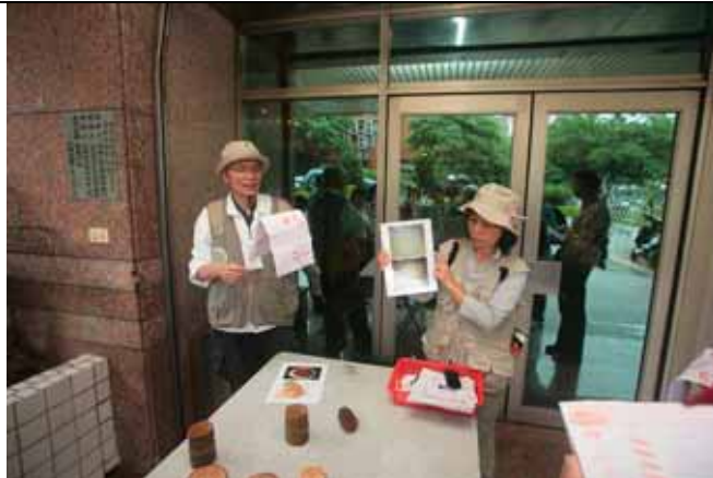
游老師：裸子植物具有管胞而不具導管