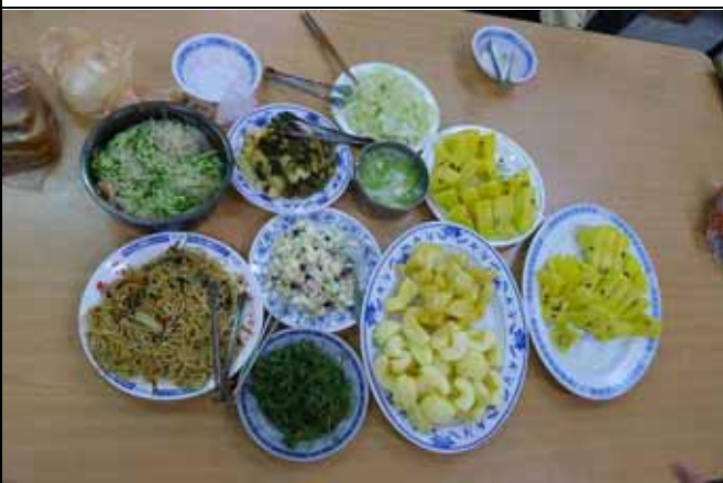
中午大家共同提供的豐盛午餐