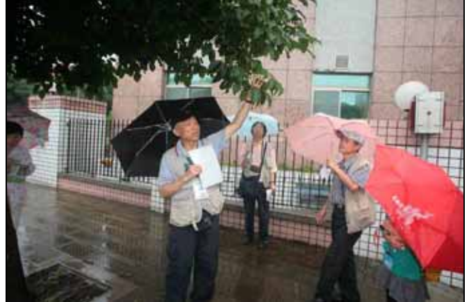
丁老師：茄苳是屬於三出複葉，很好分辨