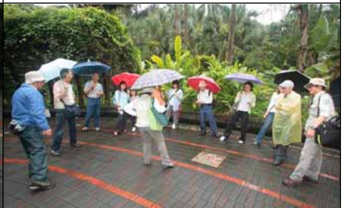
美香組長：Front；back；side 跟我腳步跳