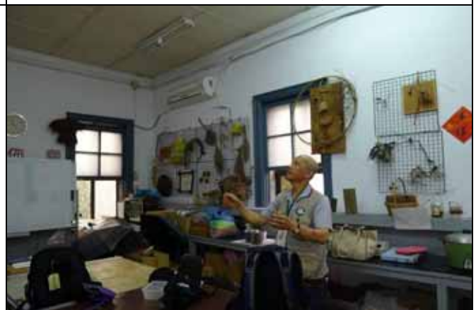
丁老師童心未泯，飯後還玩紙飛機