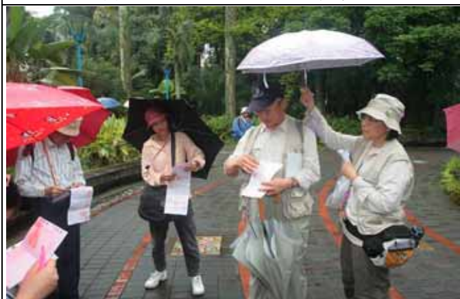
國明老師：為何日本黑松又稱為男人松？