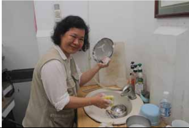
趕快洗碗，飯後來去逛植物園區