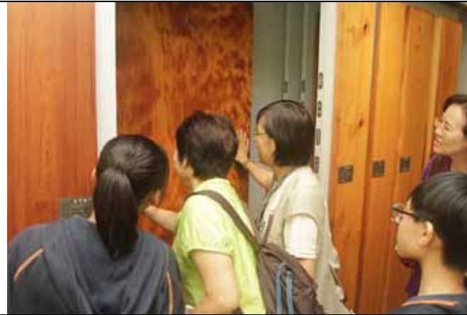
來！看看這裡面最珍貴的一塊木材切片