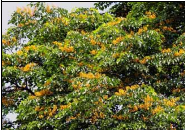
印度紫檀花朵很美麗，但花期非常短促