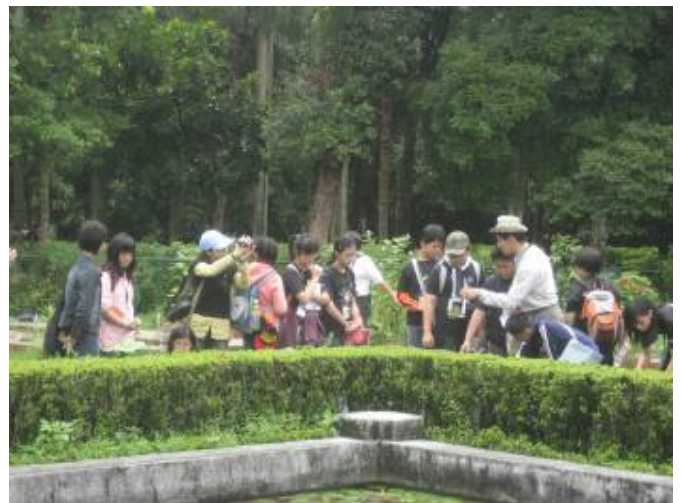
輕鬆一下（午休時間）