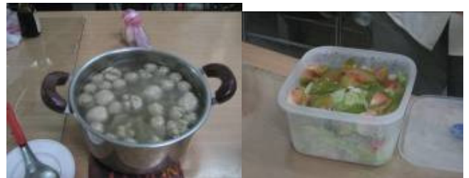
別小看這 2 盆,來自蘭嶼的飛魚湯及沙拉耶！