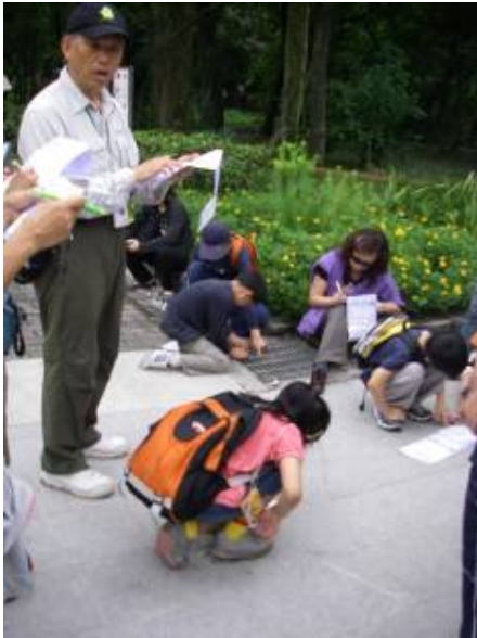
用啥魔法，吸引這些人？