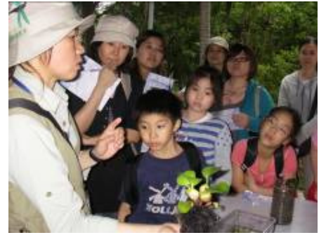
愛泡水植物.....那裏找?