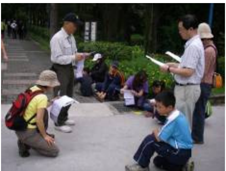
在連尋寶圖 or 寫學習單?