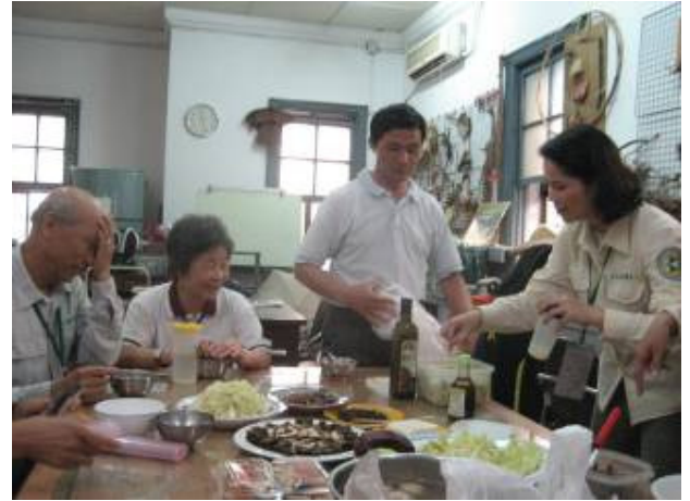
喂！妳們動作快一點，丁老師餓到頭痛了