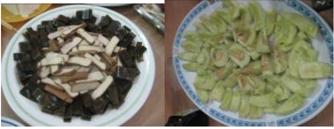
看看志工老師們~滿滿的愛心水果及菜餚.....