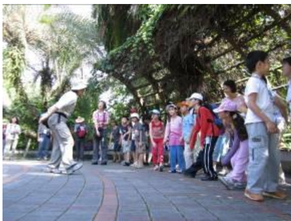
開場暖身運動不可少→小朋友少了下床氣