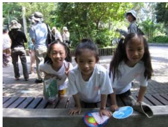
說真的氣溫多高多熱，老師看到小朋友開懷的笑認真的參與，暑氣全消.....不信您自己看...多可愛