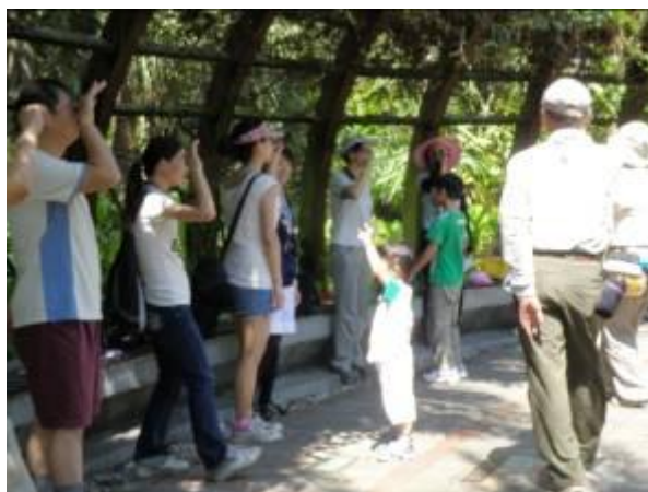
松鼠松鼠搖一搖尾巴→教遊客如何避太陽曬哦!