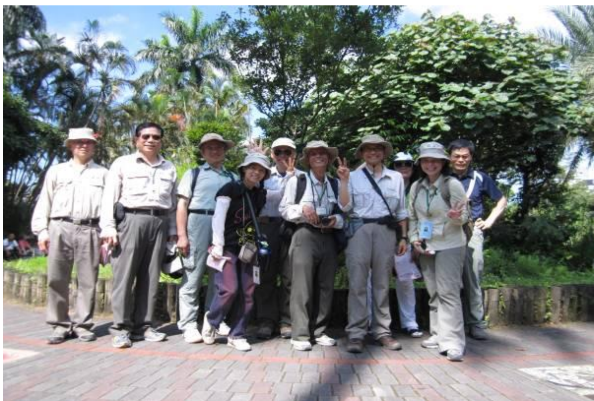
本週師資陣容.....還有每一站開場沒露臉的老師哦！ 來~~慢慢看吧!