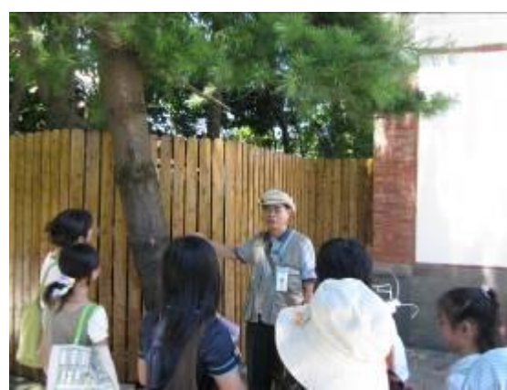
本週 唯一不畏酷暑 的團體是.....