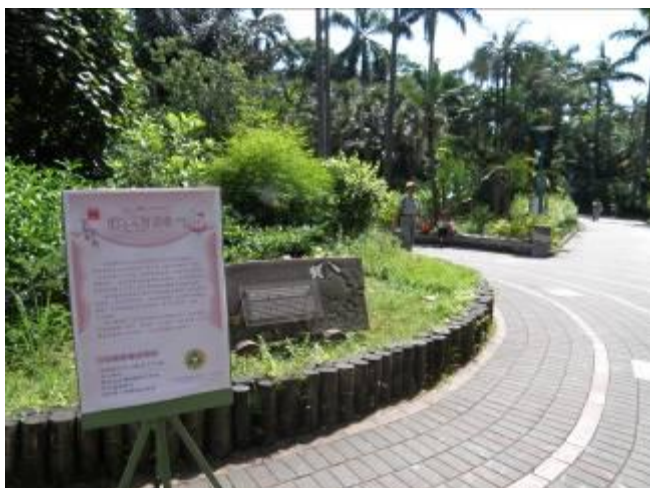
日頭赤炎炎 一早就熱) 隨人顧性命(等無人)