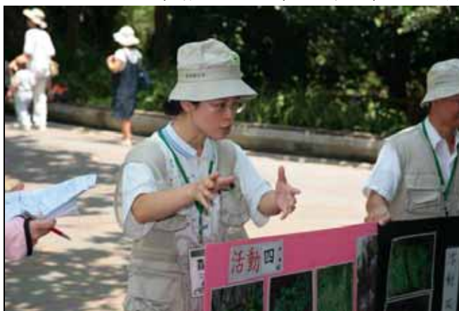
秋萍老師敘述大漢溪污染，義憤填膺