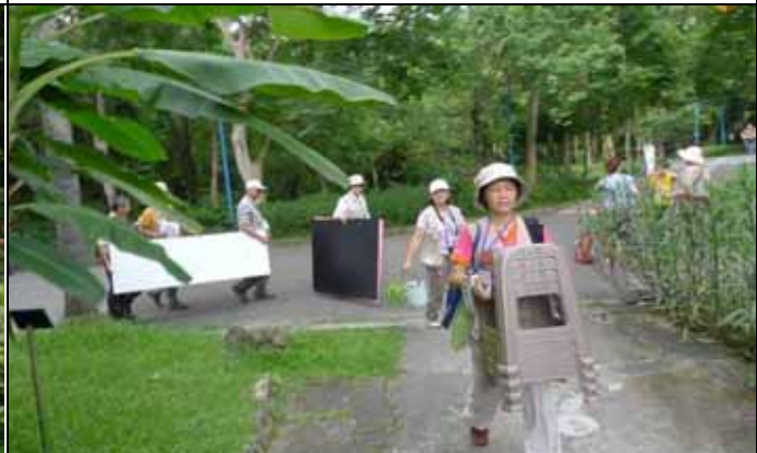
辛苦的一天結束，大家把家私收回志工室