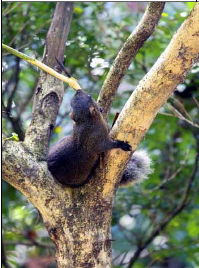
松鼠剝取樹皮是園區內樹木非常嚴重的殺手