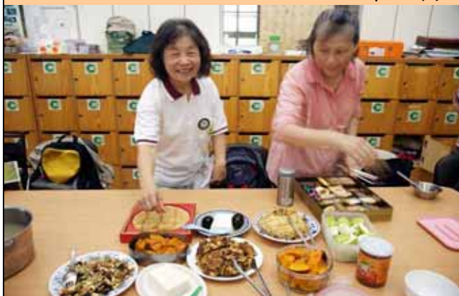
這喜餅看起來太好吃了，真想先嚐一下