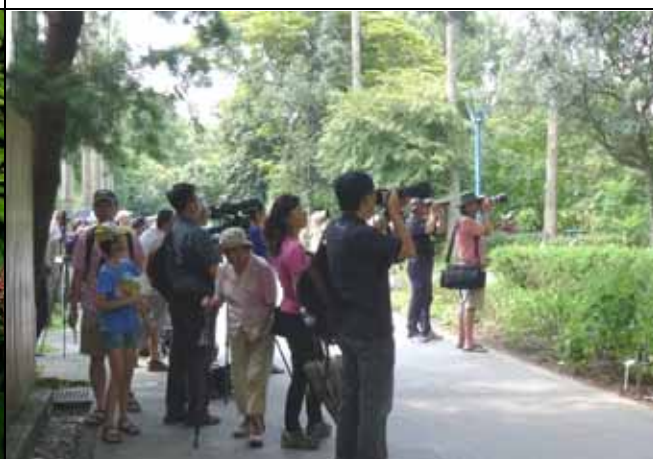
鵲鴿築巢吸引大批遊客前來拍照