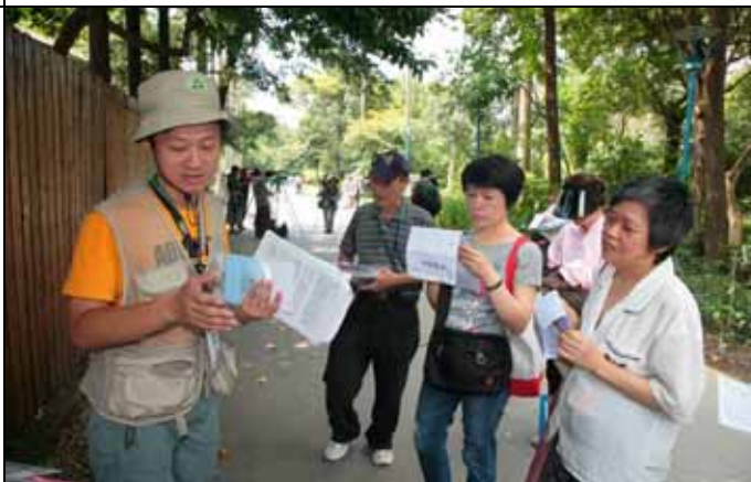
家蔚老師跟遊客討論不同的水生植物有何功用