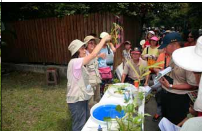
我們來用空心菜做一個吸附能力的實驗