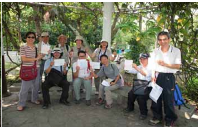
完成了！遊客們高興的展示拓印的作品