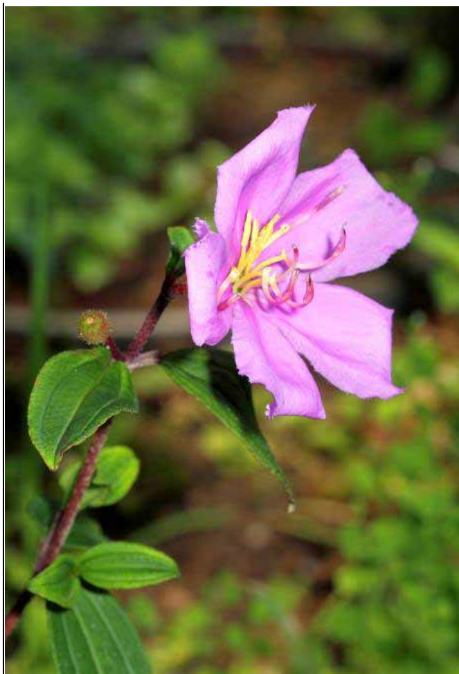
分類園區水社野牡丹已開出豔麗的花朵