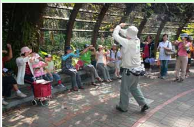
南海老師帶動唱帶動了一天的活動開端