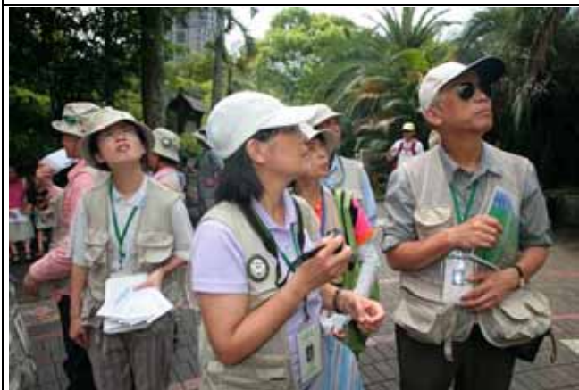
噢！大家在看什麼！好像是 UFO