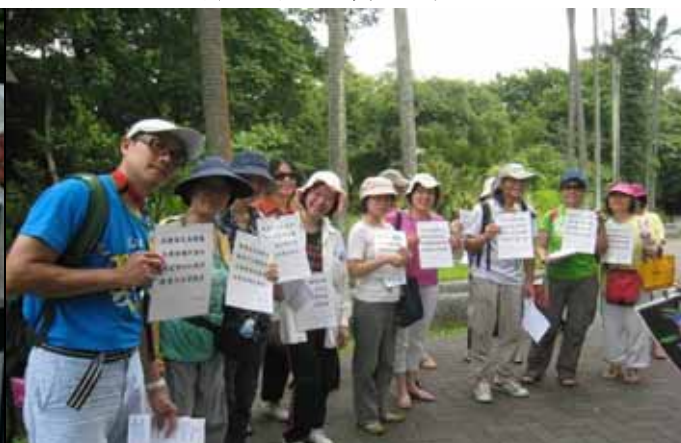
猜猜我是誰！爸爸媽媽拿字謎