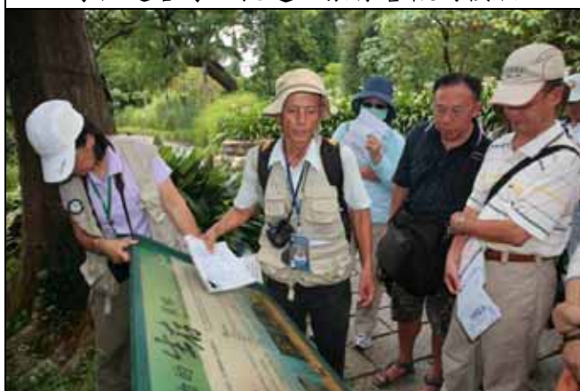
我們一起來看看水生植物有哪些生存妙招吧！