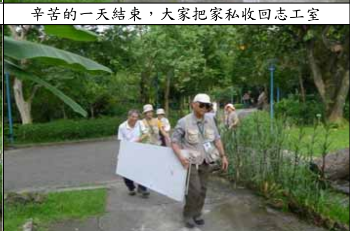
熱心的遊客也來幫忙將桌椅還原