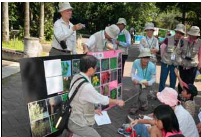
李小龍的師弟是誰？是過江龍！