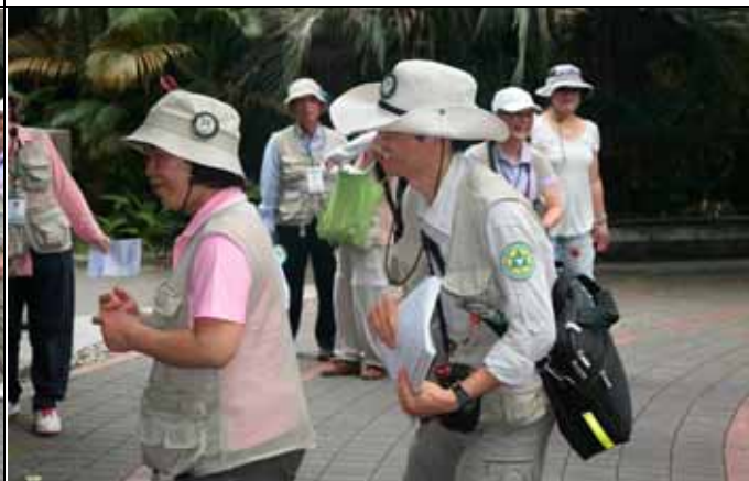
美香組長：金敏老師別在後頭捉弄我