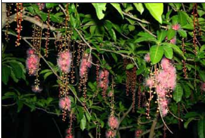
穗花棋盤腳像不像夜間的煙火