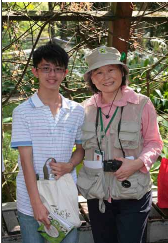
小玲老師的學生也來聽講，與老師合影