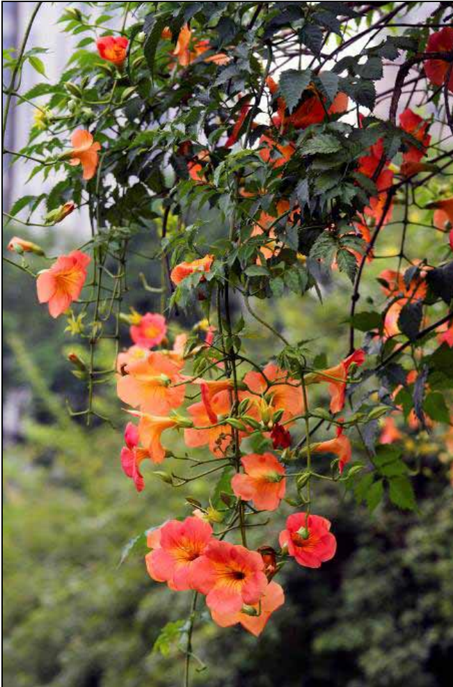
荷花池旁花架上的凌霄花開出美麗碩大的花朵