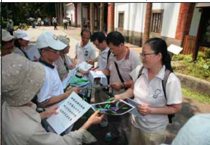
大家一起來對對碰，看誰最快找到家