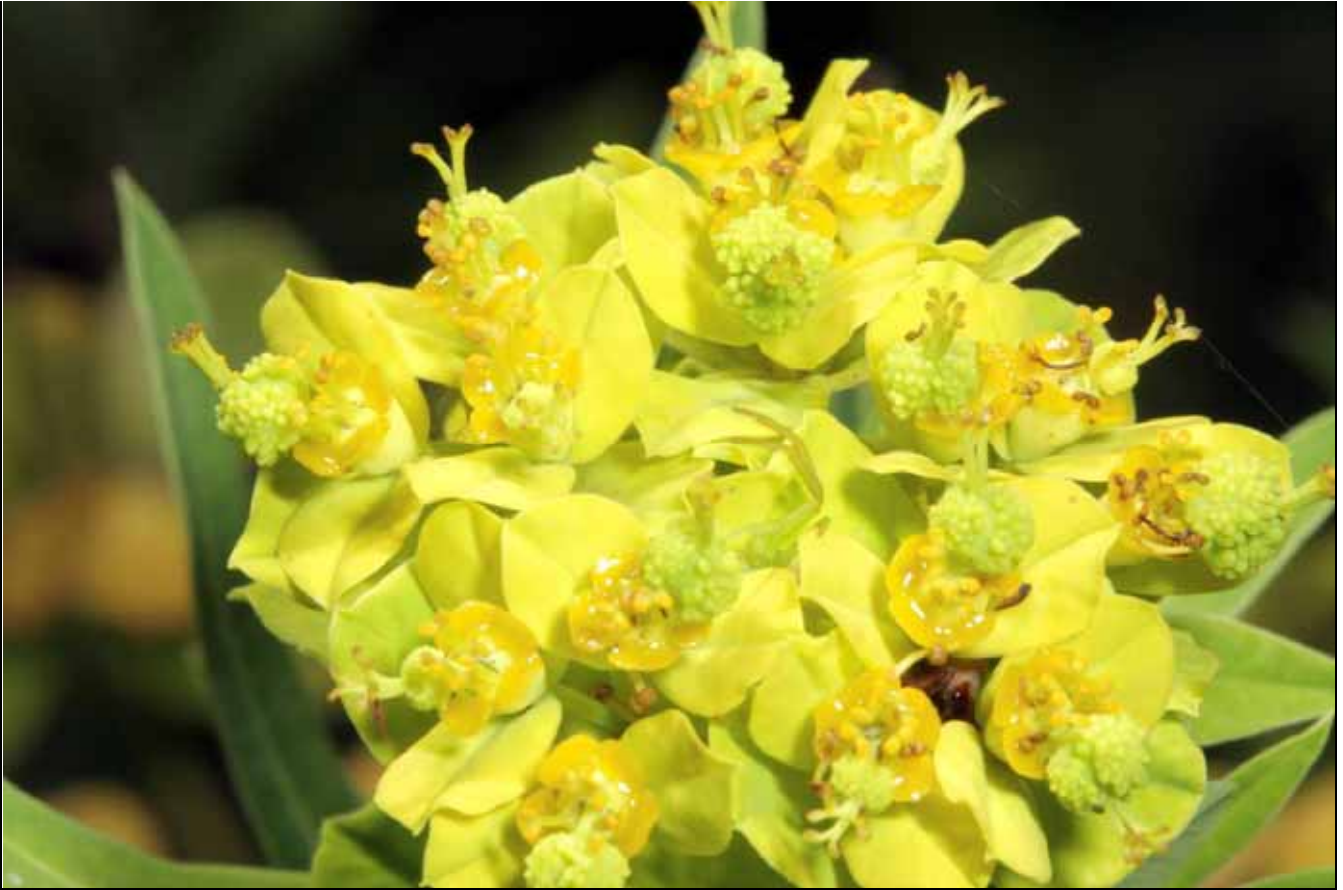
大甲草的花序中躲藏著一隻蜘蛛，您找了嗎？這隻蜘蛛在等待什麼？