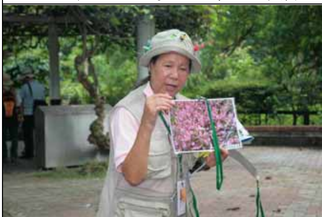
水豬母乳是環境污染的指標植物