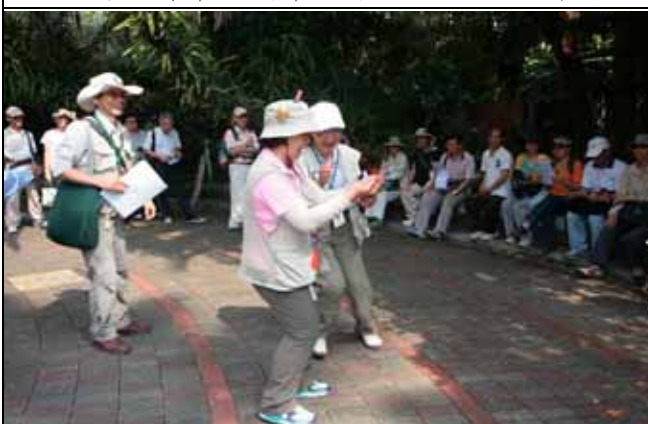
哈哈！這隻紙鶴還真會飛呢！