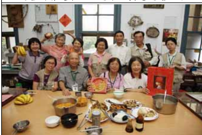
南海老師嫁女兒，大家紛紛恭喜他