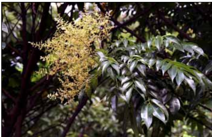
山豬肉現在正在開出黃白色花穗