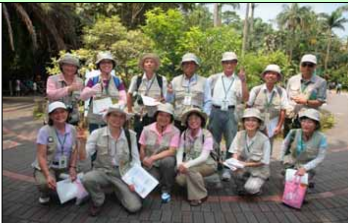
下午服勤志工大家快樂合影