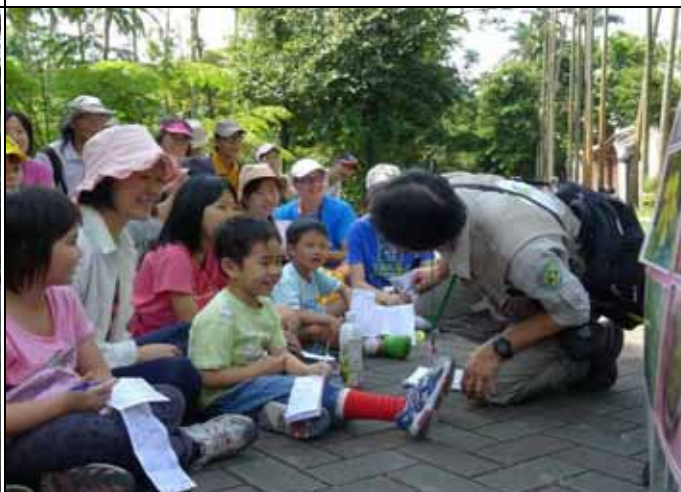
小朋友你實在太厲害了！金老師要送你禮物