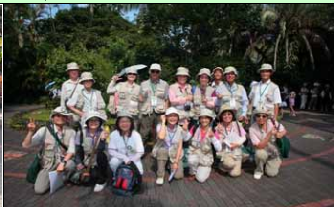
早上服勤的志工用最美的姿勢留下記錄