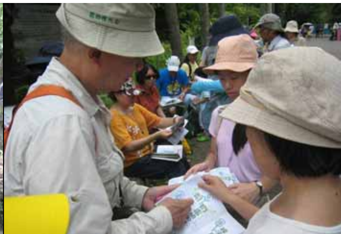
煥光老師非常認真有耐心的幫遊客蓋章