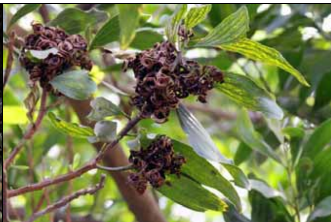
直幹相思樹的果莢成熟開裂放出種子