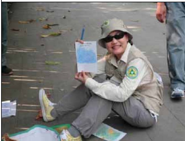
素芳老師得意的展示他所拓印的作品