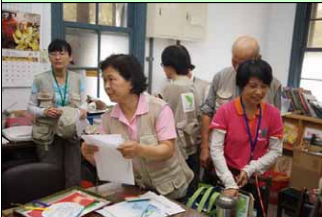
出發前，美香組長忙著分配任務與補充資料