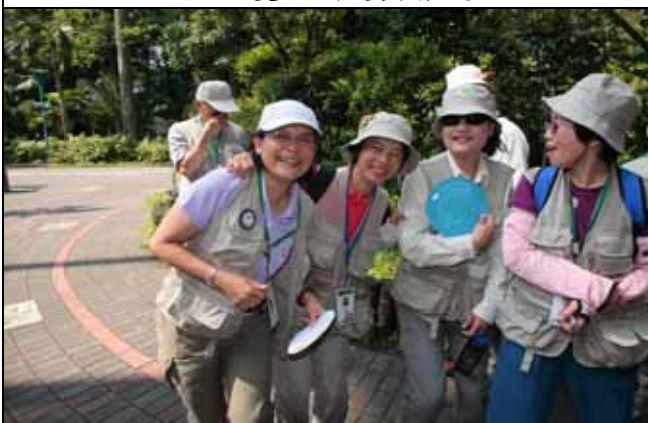
秀珍老師：你們今天真的是來亂的！