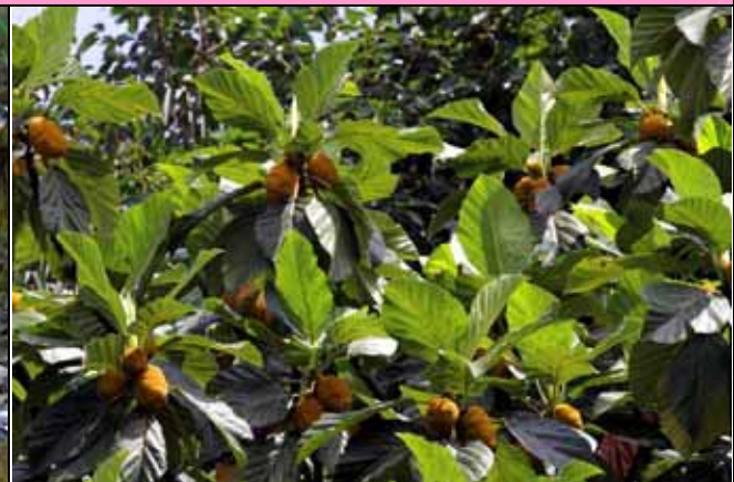
麵包樹上結滿果實，少不得又吸引松鼠上門