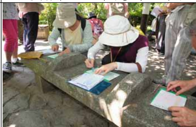
遊客非常認真的用蠟筆在模版上拓印