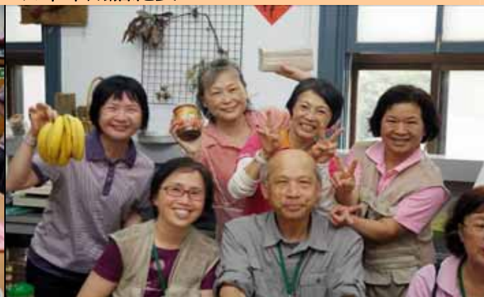
丁老師在眾家美女環繞下淡定如山