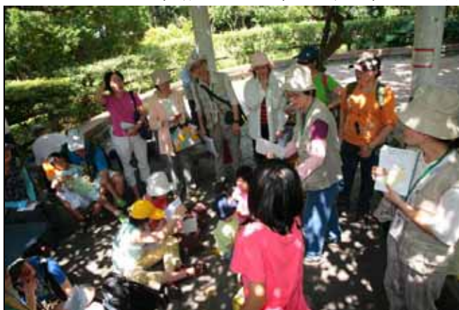
每位遊客每人挑選一張你喜歡的模版