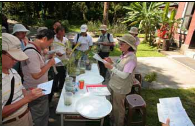
麗華老師主講各種污水對環境的影響