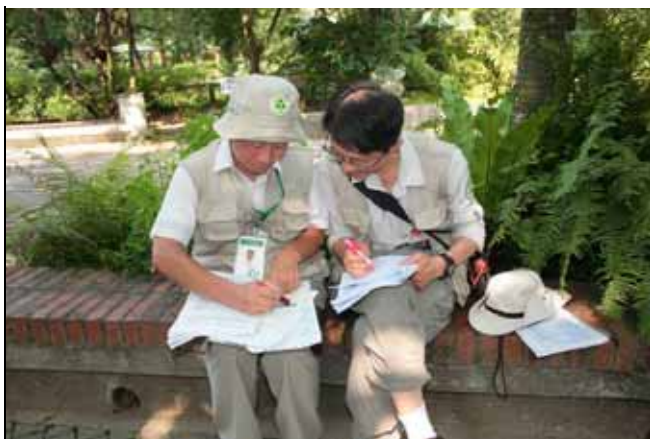
金敏老師好用功，還一直跟芳昌老師請教