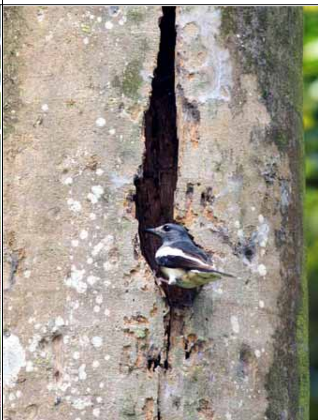
鵲鴿在布政使司前大王椰子築巢