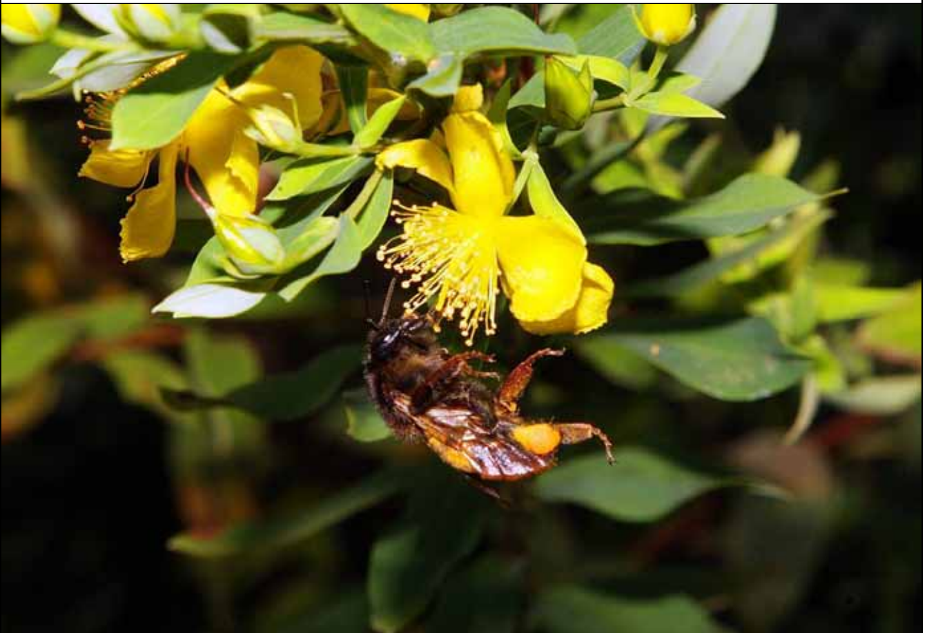
早晨，方莖金絲桃上熊蜂忙著授粉採蜜