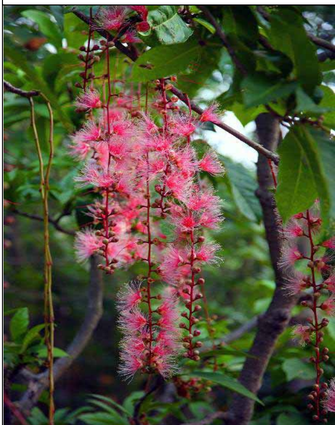
穗花棋盤腳是夜間最美麗的花朵