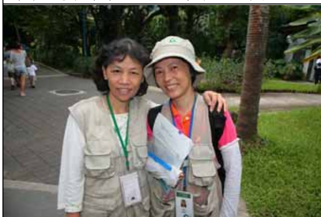
維英與蔡蔡老師合照就不用墊腳石了