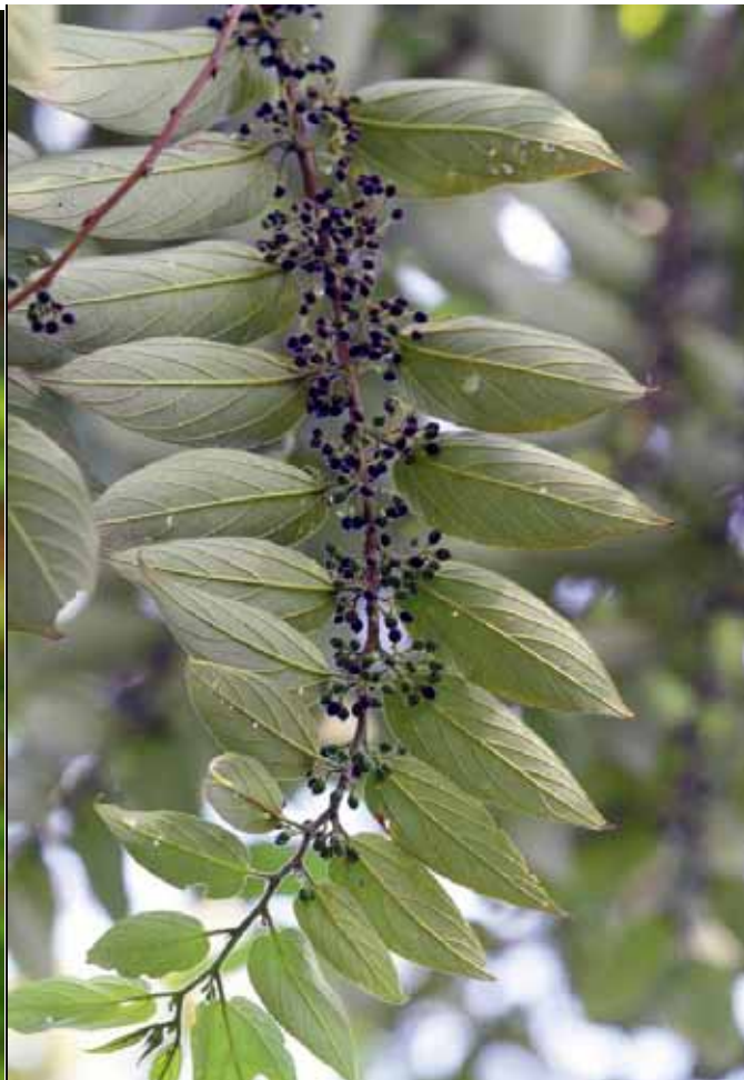
山黃麻果實開始成熟，許多鳥雀飛來啄食