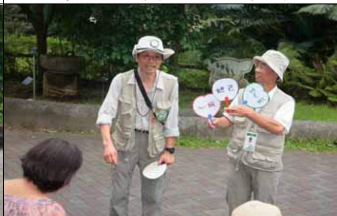
今天我們在咬人狗樹下講空心菜的鬼故事