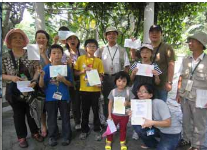
福和、素芳、芳昌老師與遊客展示拓印作品