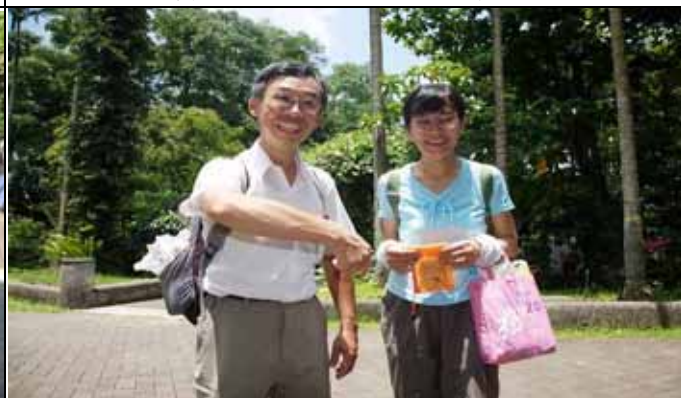
中午芳昌、仰恩老師要去午餐的約會