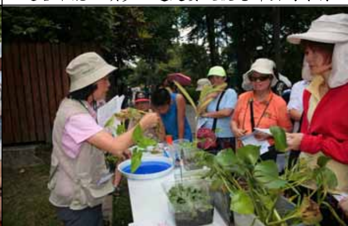
你看空心菜根部上有許多細細的根毛