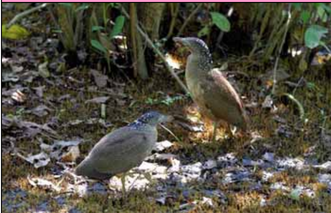
黑冠麻鷺四隻幼鳥都已離巢，非常健康