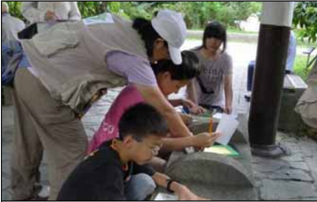
素華指導遊客正確使用蠟筆拓印