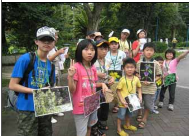
猜猜我是誰！小朋友拿圖片