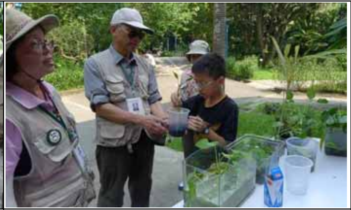
我們利用空心菜來做一個吸附的實驗