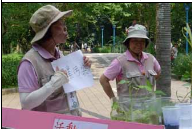
你知道一頭豬的污染量是人的幾倍？