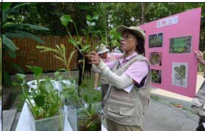
為何這兩株布袋蓮外型有這麼大的差異？