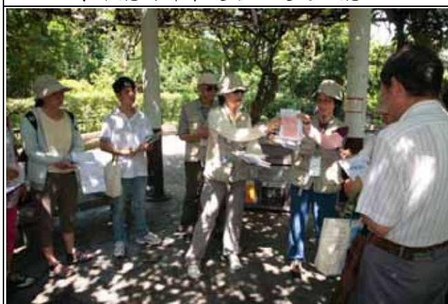
素芳、秀珍老師展示拓印的方法