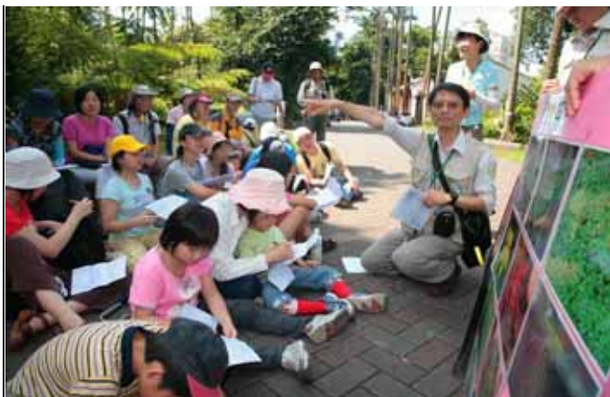
金老師要講一個空心菜的鬼故事給大家聽