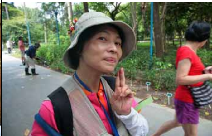
維英老師是不是要參加今天我最美的選拔