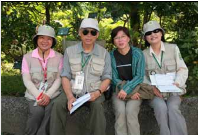
好久不見的麗英老師也來探望大家