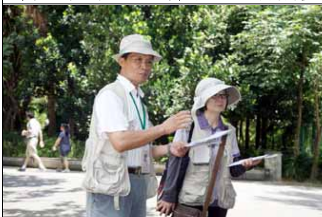
福和、月明老師結束後還留遊客下來總結