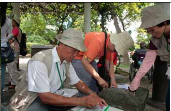
福和老師：我也來玩玩水生植物拓印