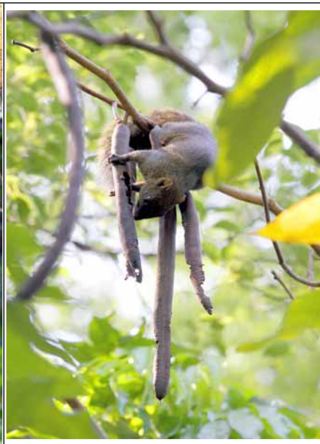
阿勃勒的成熟果實也成了松鼠的美味大餐