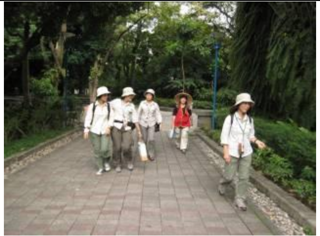
哈囉！妳們在逛大街哦！