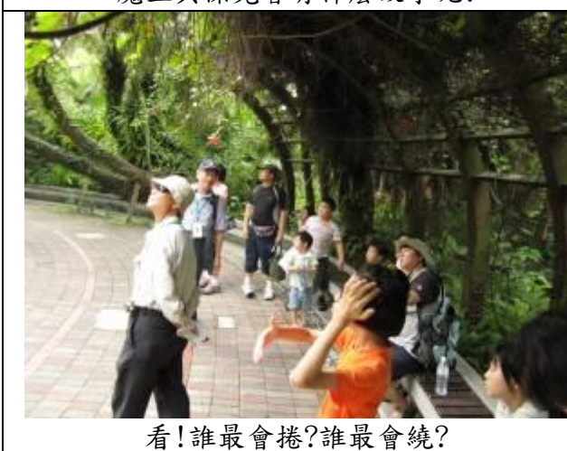
看!誰最會捲?誰最會繞?