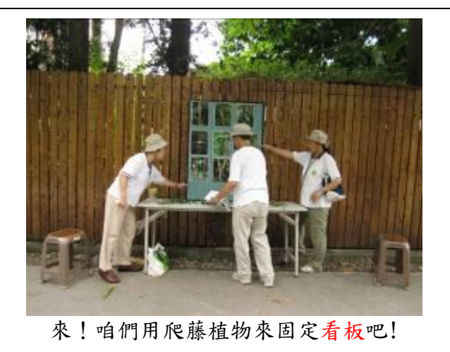
來!咱們用爬藤植物來固定看板吧!