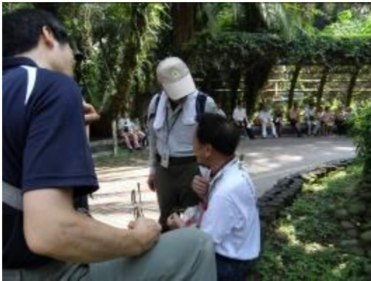
好久不見的小光老師，招來熱情的問候