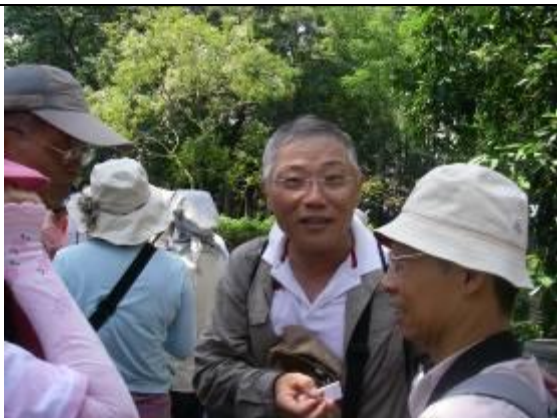
十葉老師~稀客哦!原來另有任務