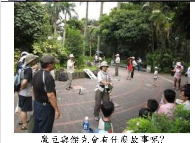
魔豆與傑克會有什麼故事呢?