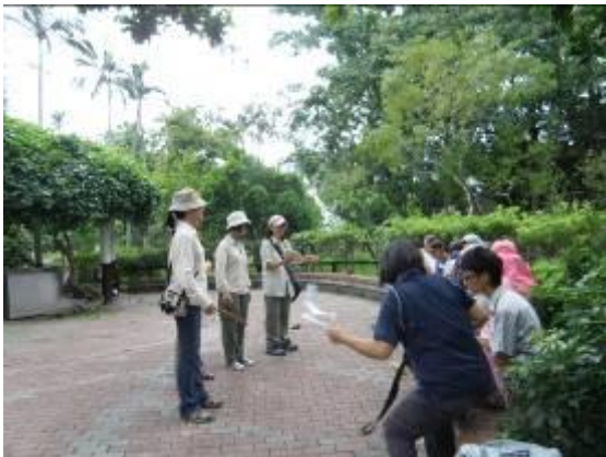
三娘叫子...(使君子的子)