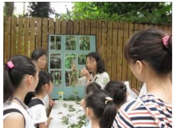
爬藤植物是偷懶還聰明？