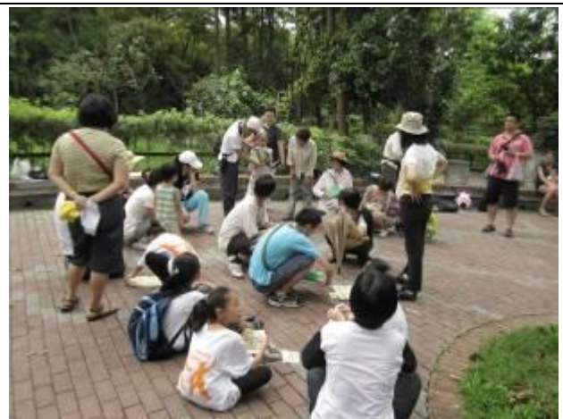
小朋友發表潛能……讚！