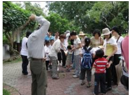
誰?誰在施法呢?..黃藤的莖是捶背的好工具