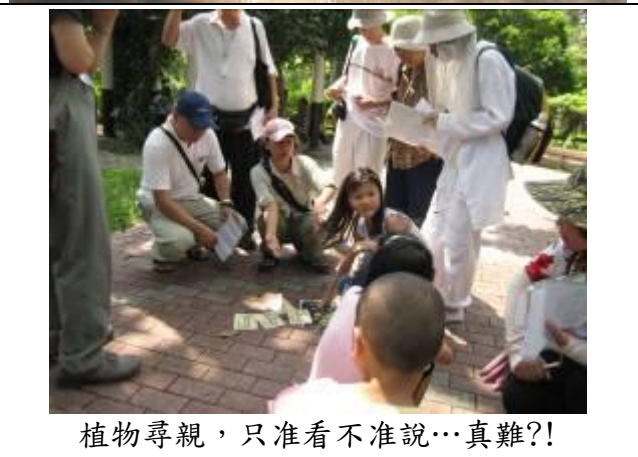
植物尋親，只准看不准說…真難?!