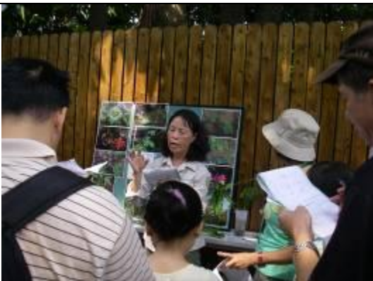
您知道嗎?下午小華如何自葡對瓜側→勾搭 吸附 連結 左旋右轉，再加捲捲繞繞展絕技!