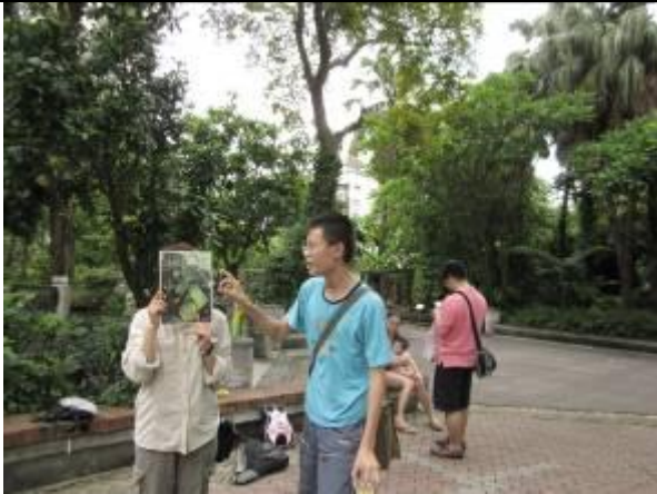
咱們未成年的小志工好久不見！ 大家要祝福他，原來明年要考高中，加油哦~