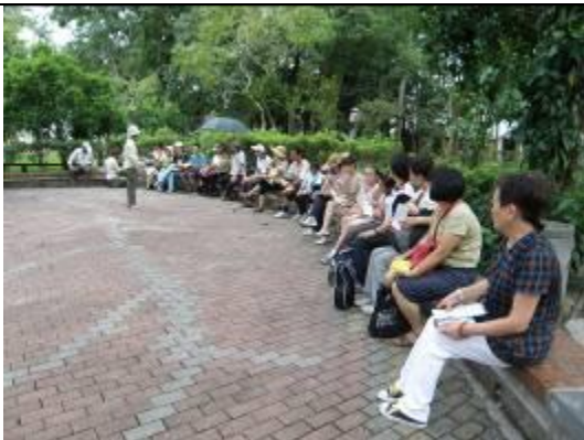
舒服的懶人→欖仁廣場地不太平整 不算是無障礙空間!?