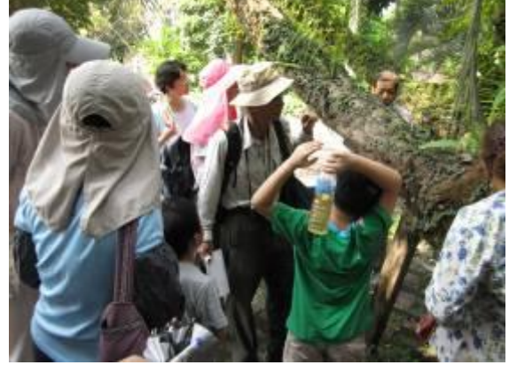
嚴格遵守不拍遊客正面，以免觸犯隱私權~