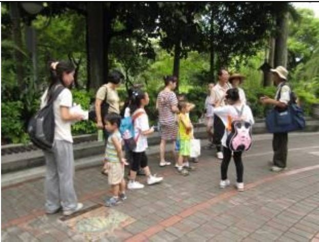
看！我百寶袋的法寶！