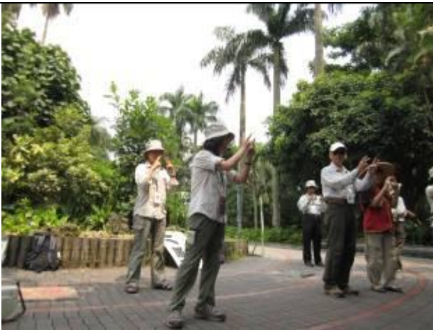
看看小華 變出小白兔哦！