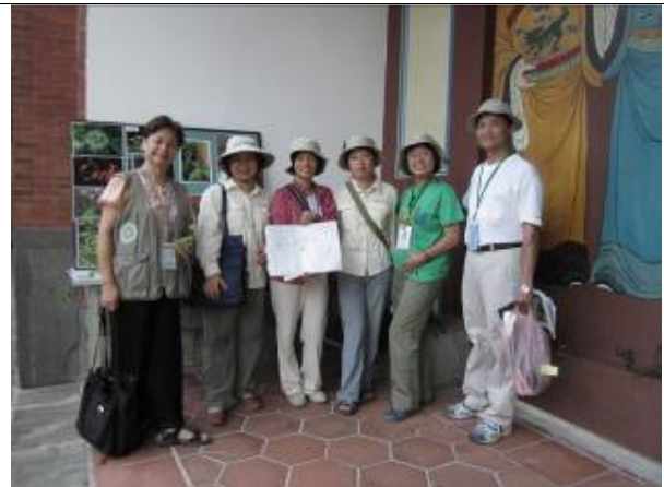
看得出來嗎? 白紙寫什麼? 拍照的(時間到)