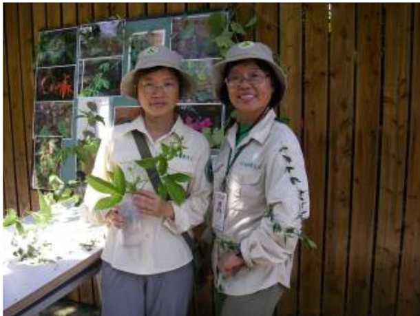
新組合~2 麗情深.....麗真姐您看著辦吧!