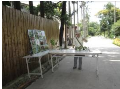
看看小英如何調兵遣將吧!