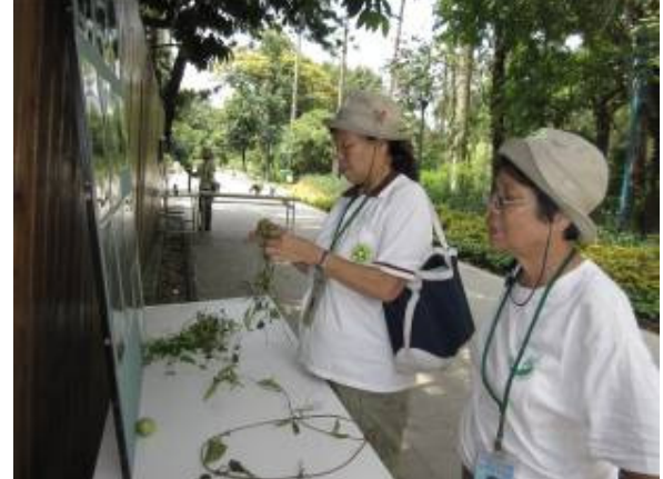
魔豆ㄚ! 魔豆ㄚ! ~誰是世界上最長.....最長的爬藤?