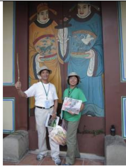
小和說~看我新門神....展神威