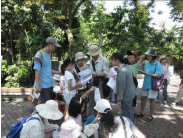
中午吃什麼？ 還沒喬好？ 我們蹲好久了~~~