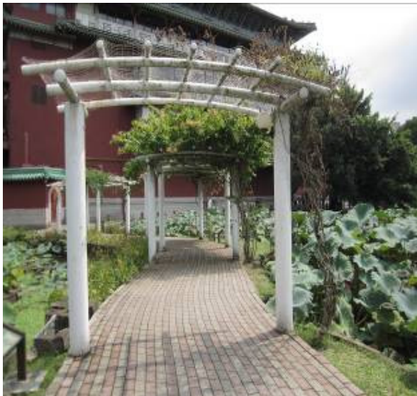
還記得那年春年在這棚下邊唱邊比~~ 金銀花 12 朵，大姨媽來看我..... 她不再開花了~ 默哀 3 分鐘吧! 是誰狠心的結束她的生命?