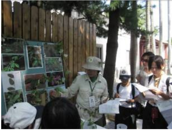
別忙著填學習單~也要聽聽植物的~麥角~ 什麼是對、側、腋、柄、勾、搭、吸&附?