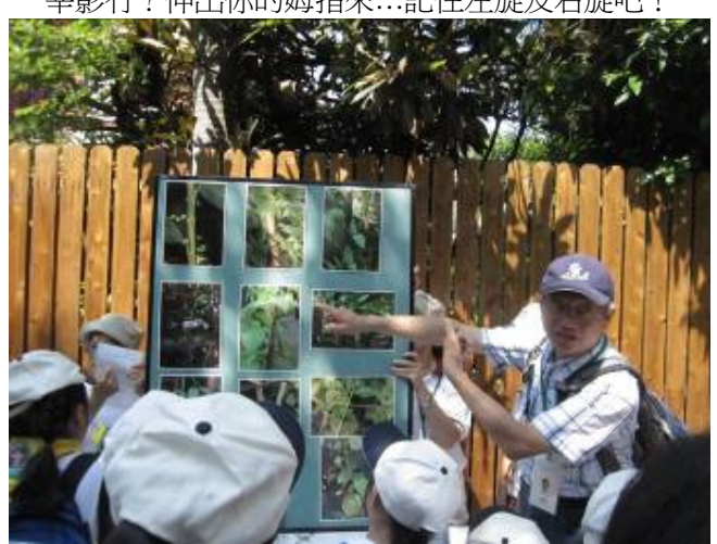
宰影有? 伸出你的姆指來...記住左旋及右旋吧!