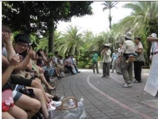
來來勒又~~該是那隻手抓鼻子呢?.. ...怎麼還有大字報？