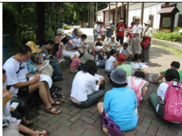
聽聽小和的郭使君的故事