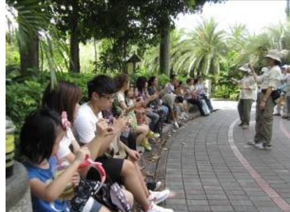
到底是長...還是寬...動手又動腦，身體才會好！