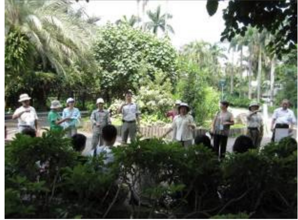
上午&下午~~~~大不同哦！