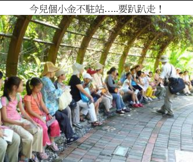
今兒個小金不駐站....要趴趴走!