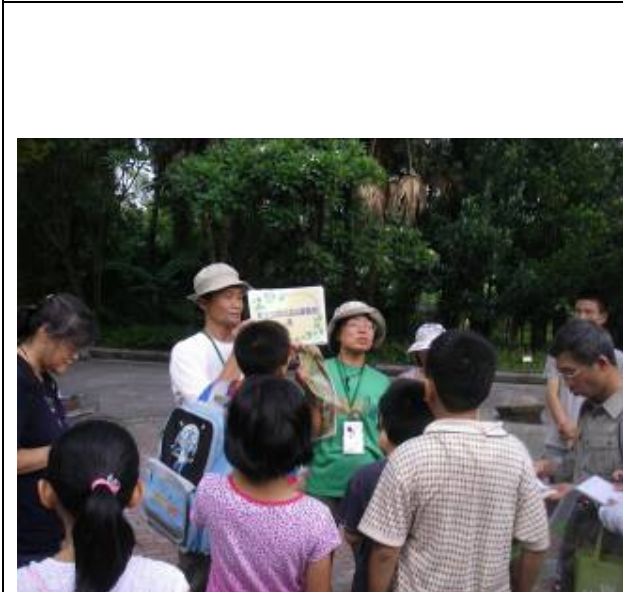
到底要看那裡? 還要~ 想一想爬藤植物對生態有...何影響呢?