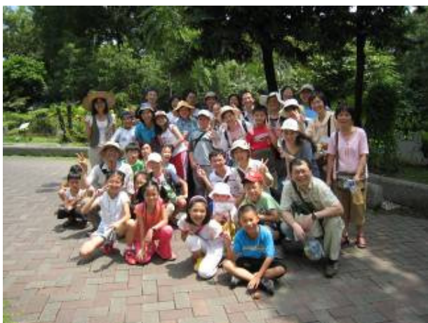
看看誰是遠道(新竹)而來的新朋友? 被我們的活動日誌吸引而來