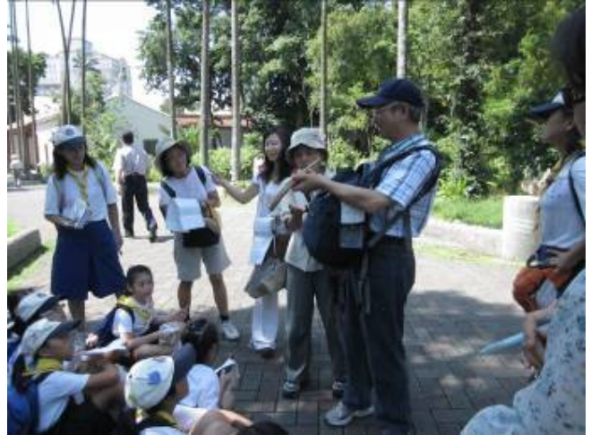
今天改賣.....是送白鳳豆!...答對的才有哦!