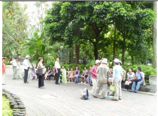
這一群在跳祈雨舞嗎? 真的後來下了一點點雨 開場結束就天晴了!