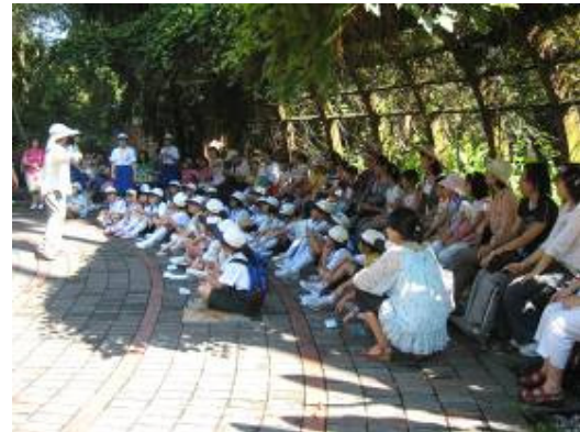
我知道了！今天是爬藤植物，只動手， 可以不動腳，所以~~咱們就穩如泰山的坐者