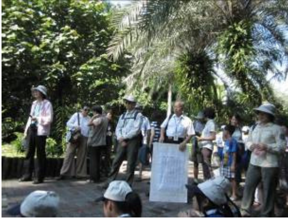
有那些老師呢！看看吧！