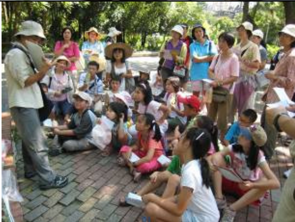
等會玩遊戲~先聽蔡蔡說分明