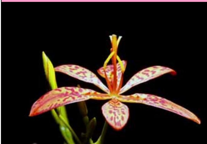
射干花朵的蜜腺位於花瓣基部 (花蜜位於花瓣表面)