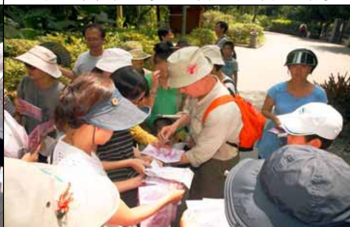
煥光老師被遊客包圍忙著蓋章