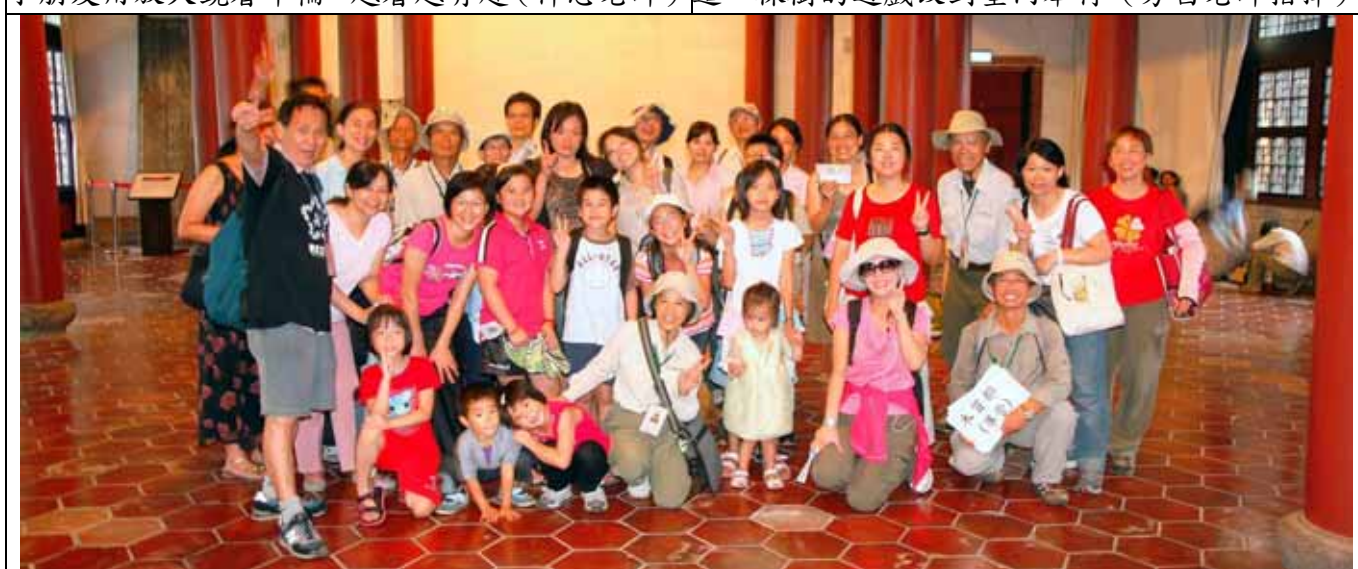
雖然天降大雨，遊客仍興高采烈的參與遊戲，圓滿結束，大家合影留念