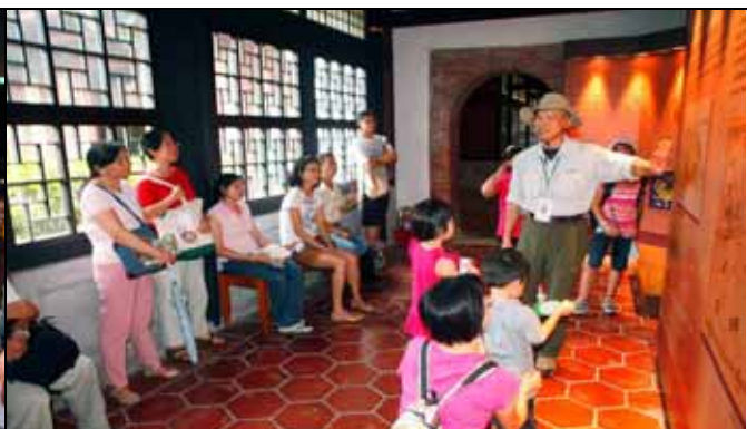
丁老師藉躲雨把握機會介紹布政使司的由來