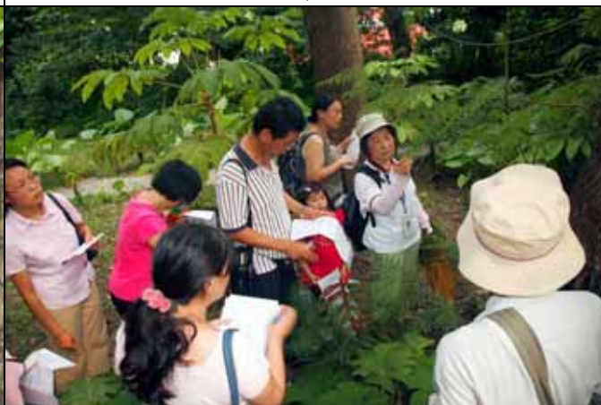
銀樺的樹葉非常特別，是二回羽狀裂葉