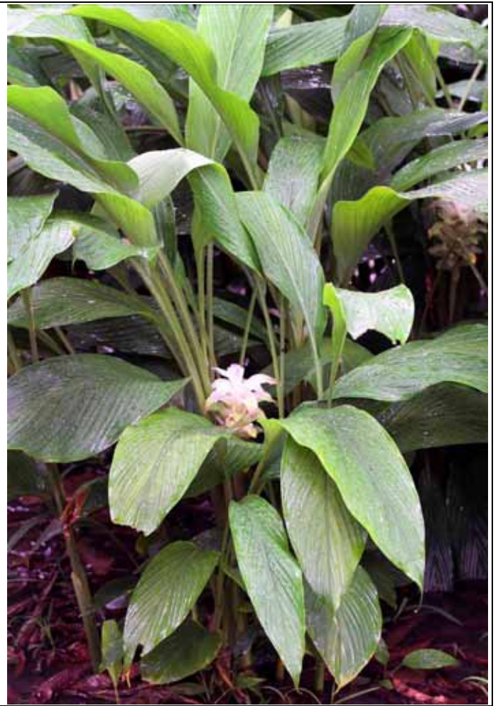
佛經植物區薑黃正開出美麗的粉紅色花