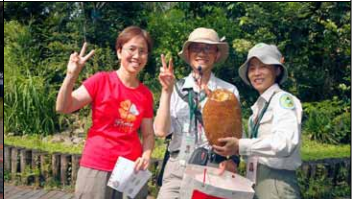
今天解說活動中最吸引人的果實-波羅蜜