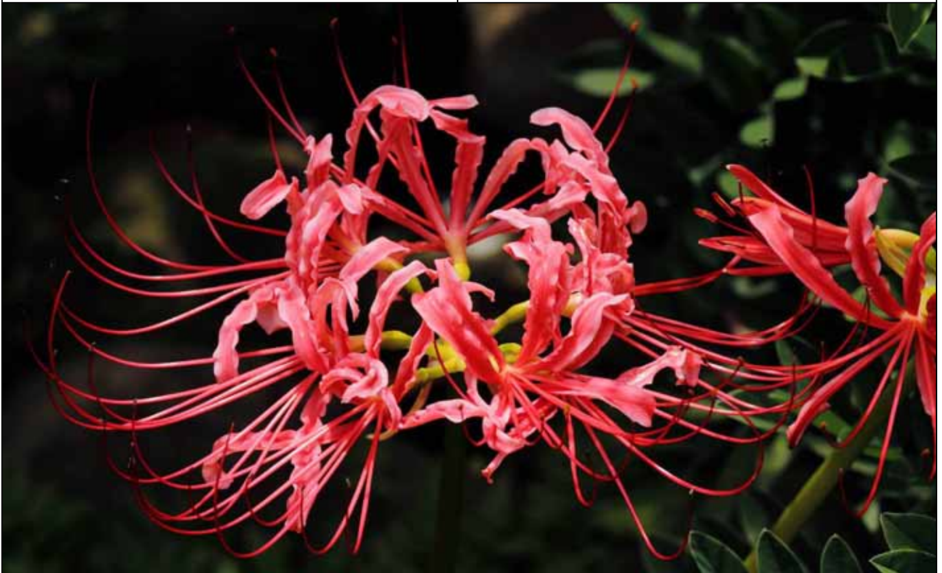
原生地在馬祖的紅花石蒜今年花開得特別茂盛，非常美麗，花期很短，要看請早