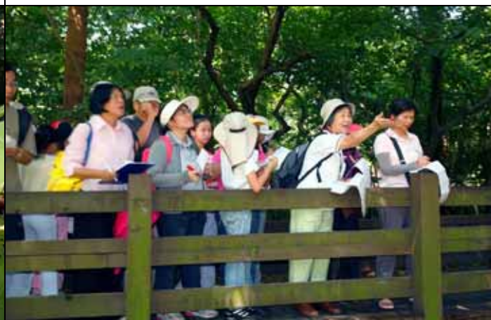
雪花老師帶隊從棧道上觀察各種樹木的樹皮