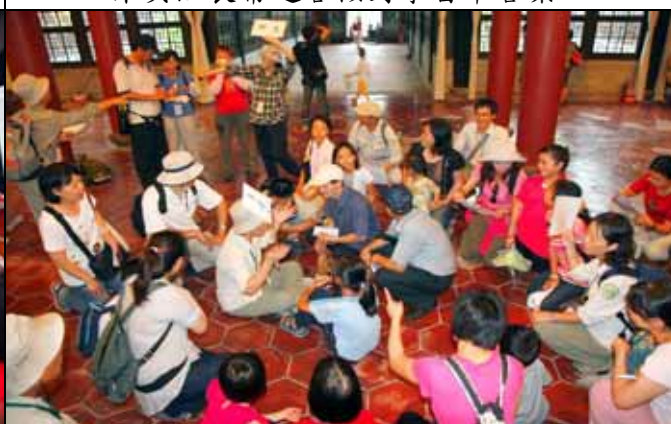
造一棵樹的遊戲改到室內舉行(芳昌老師指揮)