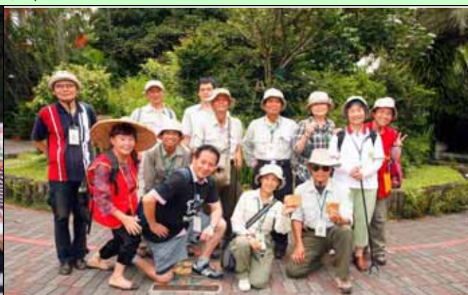
下午服勤志工合影