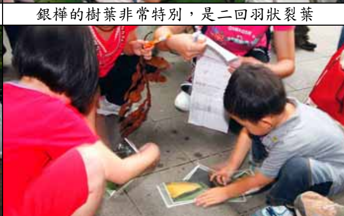
小朋友高興的玩花朵拼圖遊戲