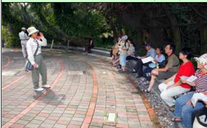
下午由維英組長出場跟遊客介紹