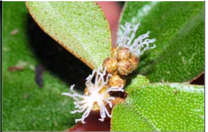
裡白巴豆（雌花）