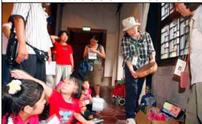
小玲老師解釋木材各部分的組織構造