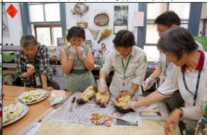
波羅蜜不只果肉好吃，種子更有菱角的風味