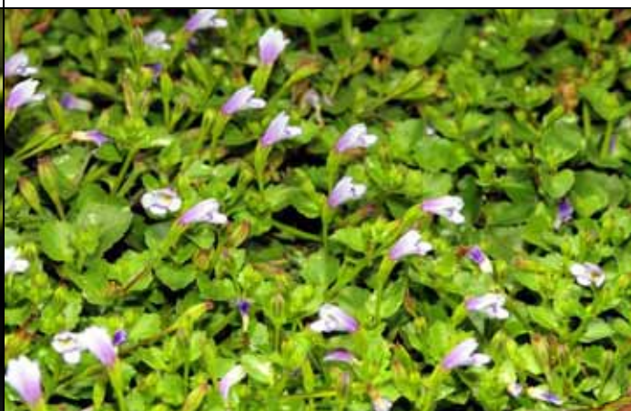
原生植物區的地被小草-水晶草正在盛開