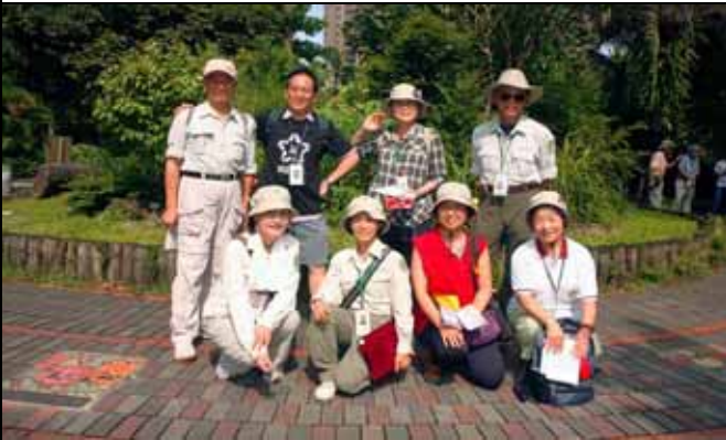
早上的部分志工合影（維英組長請在第一排）