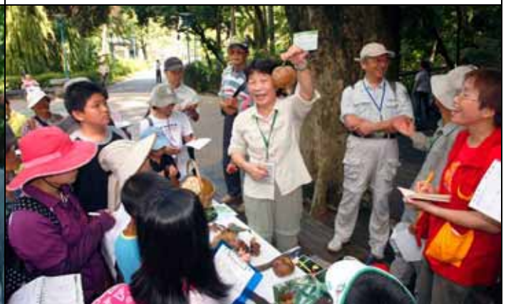
來！看我從恆春帶回來的肉粽（可惜不能吃）