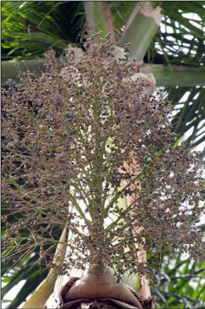
大王椰子果實成熟為黑褐色，肉質