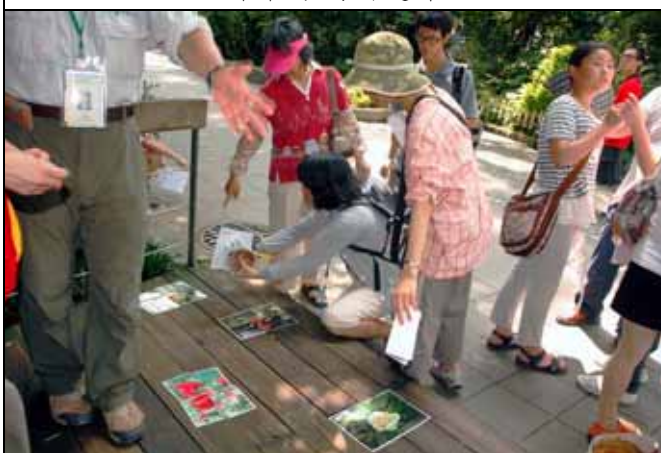
遊客們玩著各種樹木花朵的拼圖遊戲