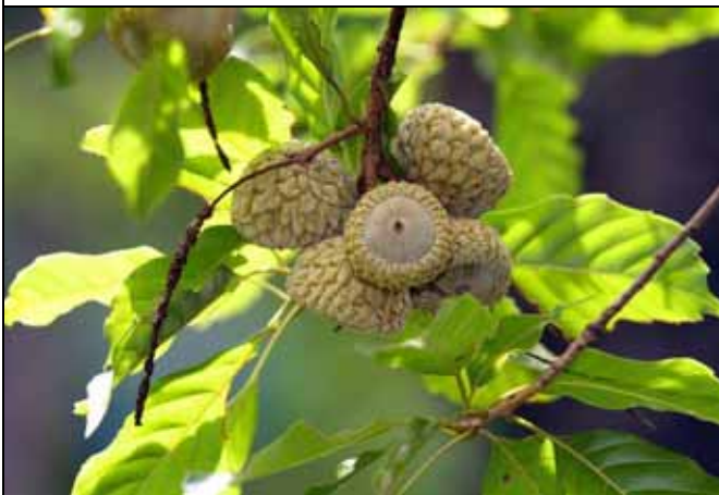
後大埔石櫟又叫煙斗石櫟，現正進入果實成熟期