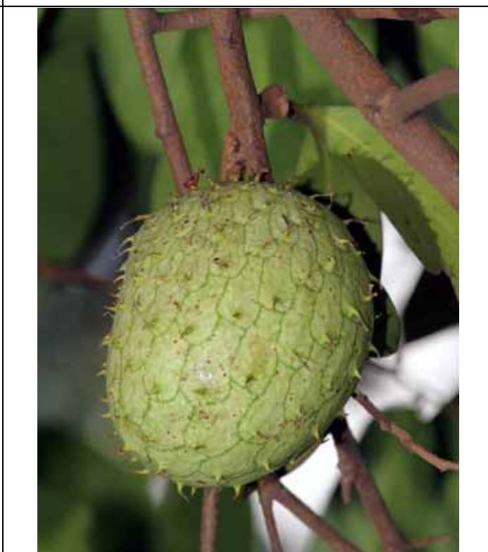
山刺番荔枝的果實表面有許多肉刺