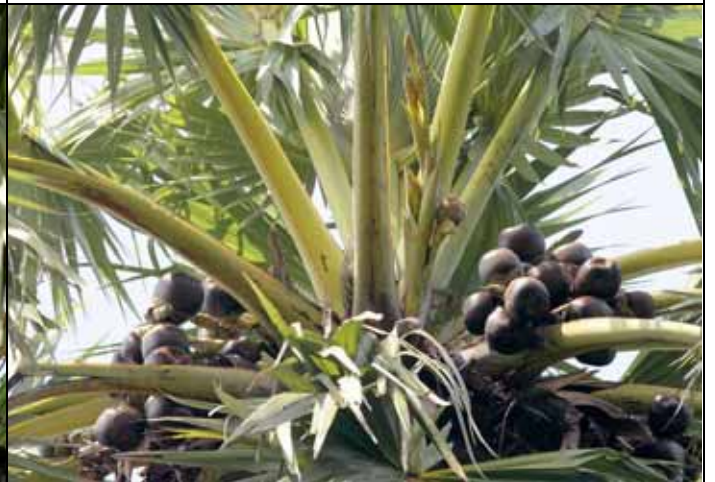
結果累累的扇椰子的雌株