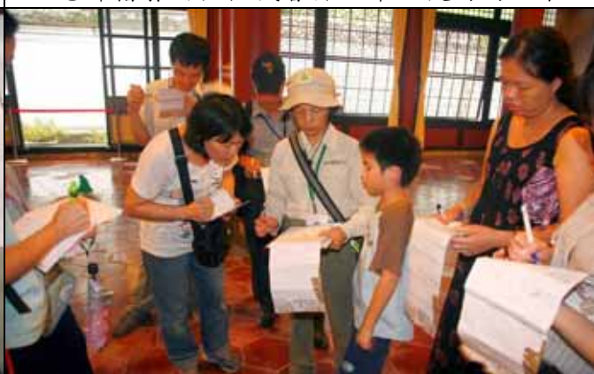
維英組長幫遊客核對學習單答案