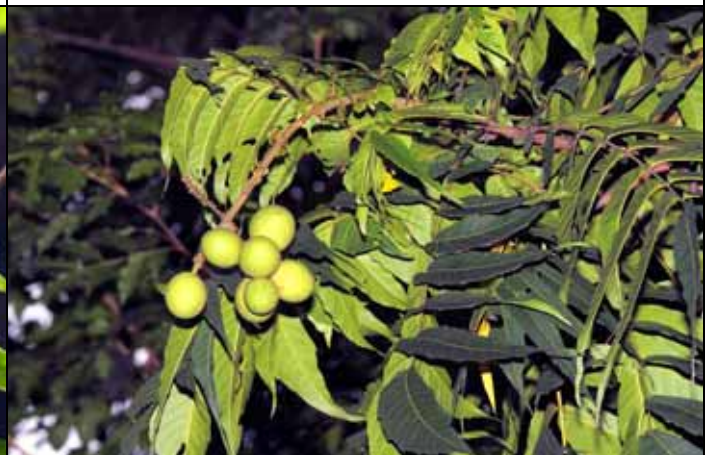
台東龍眼是龍眼無患子科的親戚，木材堅硬，是蘭嶼達悟族人製造拼板舟的原料