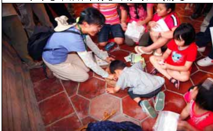
小朋友用放大鏡看年輪，越看越有趣(仰恩老師)