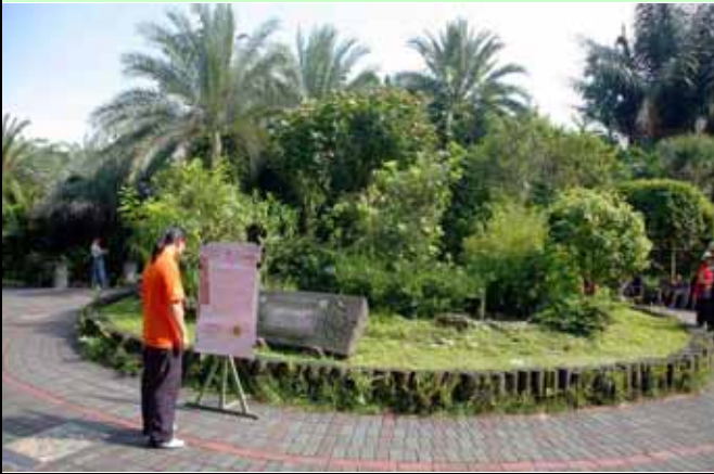
原生植物區前的大海報吸引不少遊客閱讀