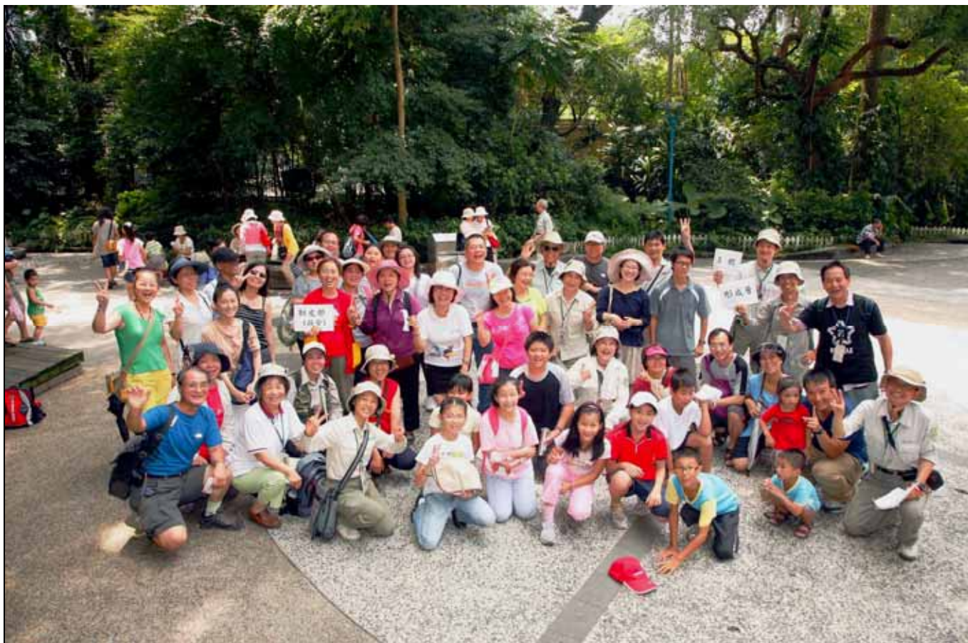
活動圓滿結束，志工與遊客和樂融融，過了一個充實又有意義的早晨，大家高興的一起合照紀念