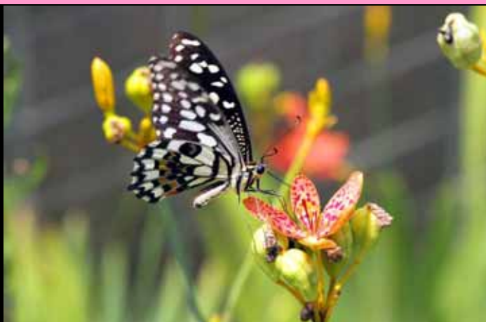
射干花朵吸引鳳蝶飛來吸取蜜腺的花蜜