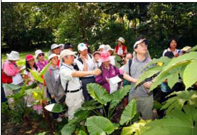
國明老師帶隊講解蘆葦的運用