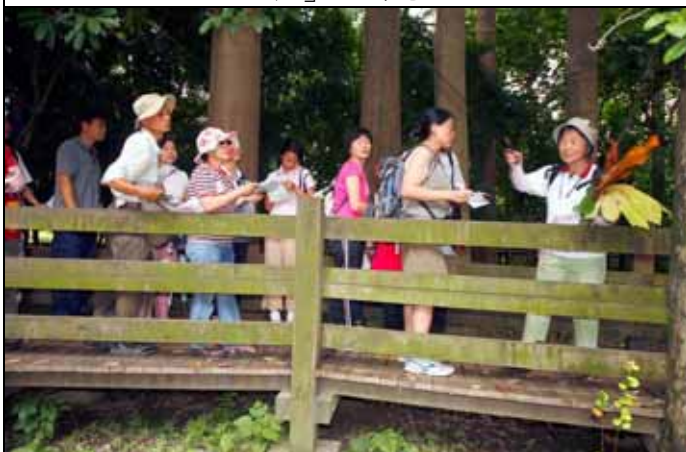
雪花與文俊老師介紹各種樹皮形狀與葉形