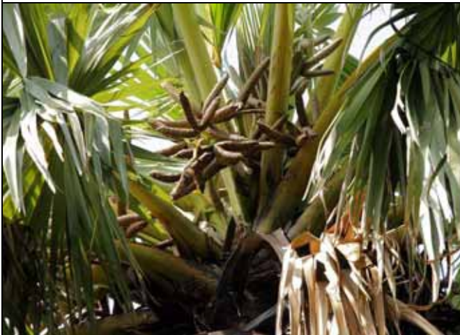
日治時代種植的扇椰子是雌雄異株（雄株）