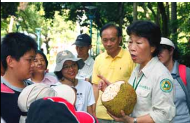
麗真老師解說活潑生動有趣，寓教於樂