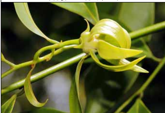
鷹爪花的花朵是製作高級香水的材料