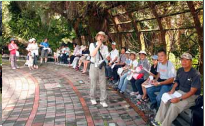
金敏老師首先出場介紹今天主題