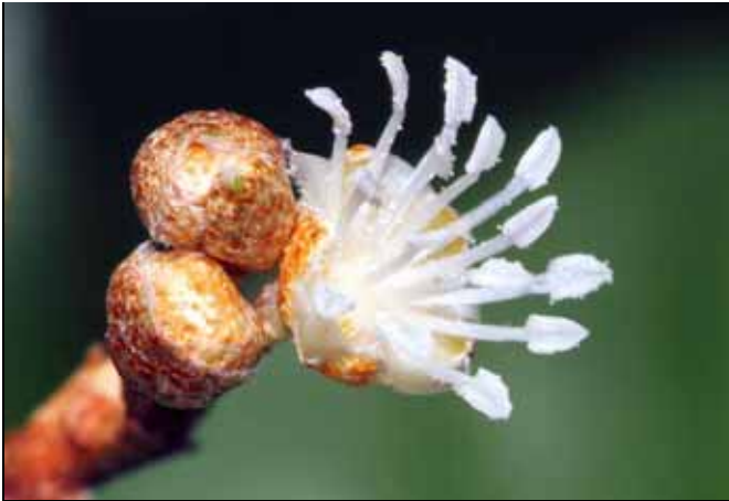
裡白巴豆屬於大戟科，為雌雄異花（雄花）