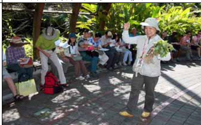
大家吃過當歸，有看過當歸嗎？