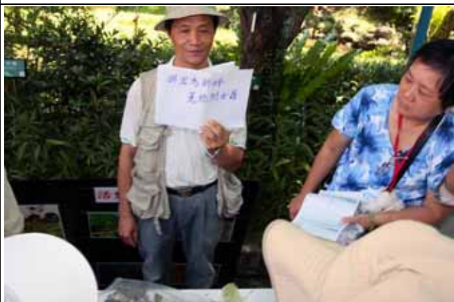
菟絲附女蘿詩句遠出於古代詩經