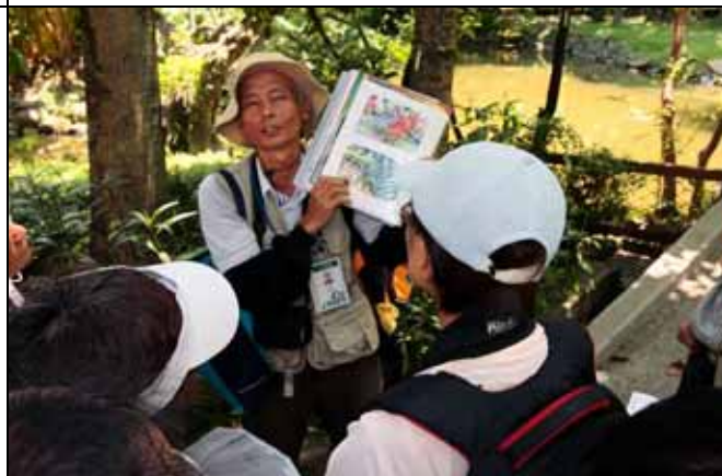
文俊老師都會帶一大本圖片補充教材