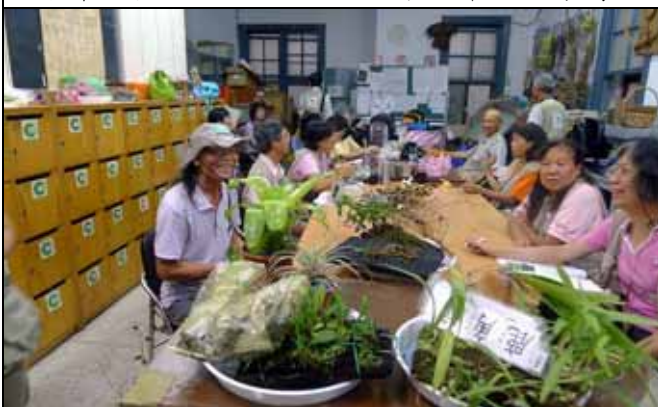
只有一位遊客，解說仍照常進行，絕不縮水