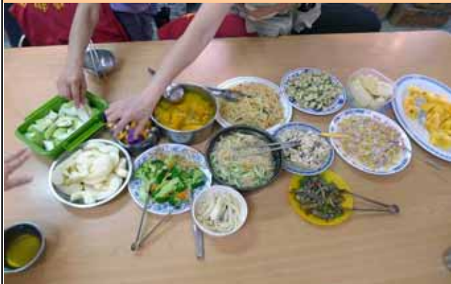
中午的料理多是志工精心製作