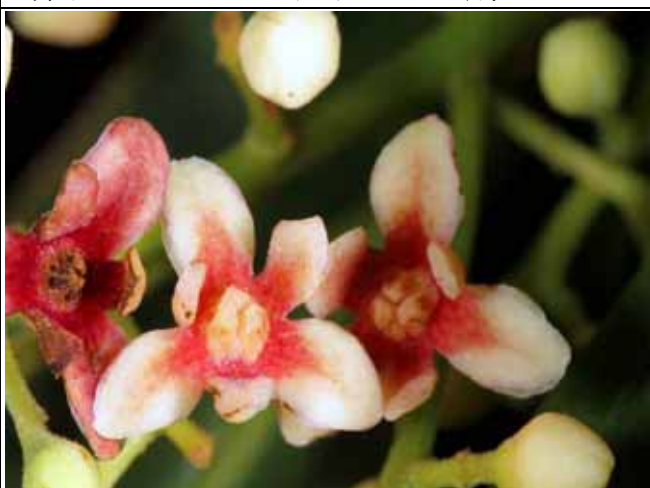
三蕊楠花朵特寫，因只有三個可孕雄蕊得名