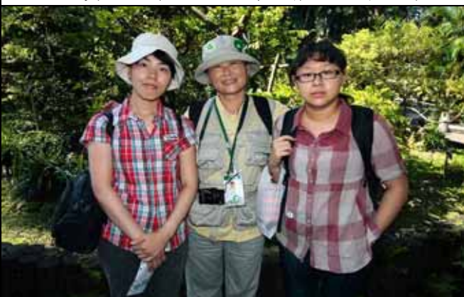
日本留學生真澄越來越進入狀況