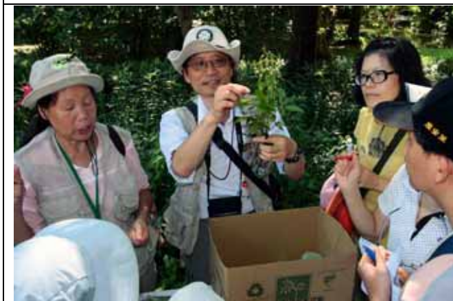
看看植物界最常見的吸血鬼-平原菟絲子