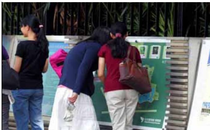
兩位遊客在討論今日我最美的展示圖片