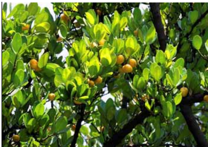
菲島福木的果實像不像滿樹柑橘