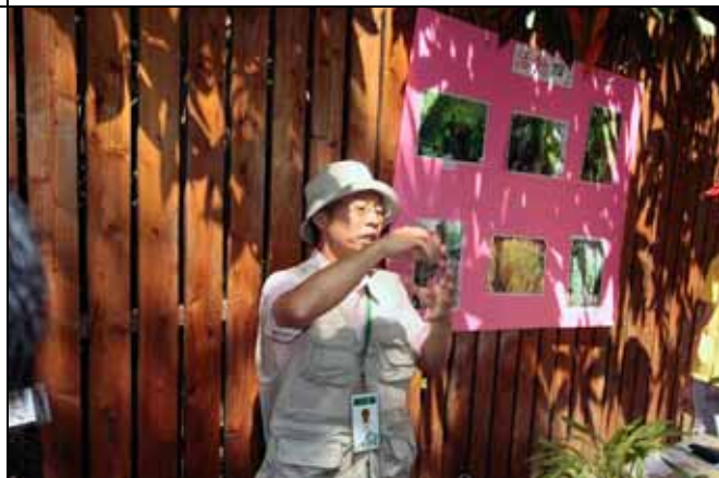
熱帶雨林中鳳梨葉片常形成一個小水池