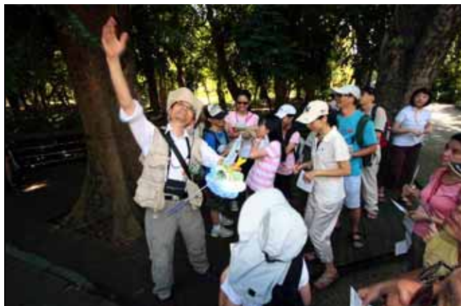
看看這兩棵崖薑蕨為何要長在大樹上