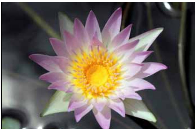
睡蓮開花第一天，露出中央成熟雌蕊