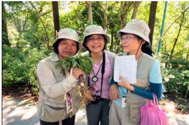
天氣炎熱，三位美女防護工作要顧好