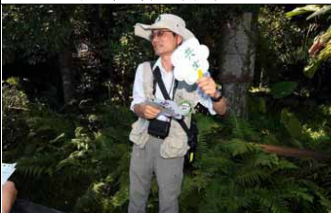
金敏老師還自製解說扇子增強口說效果