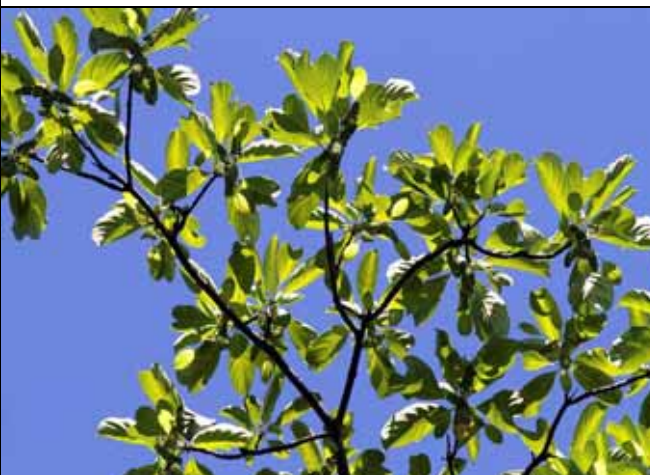
白金雞納樹垂下許多綠色花穗