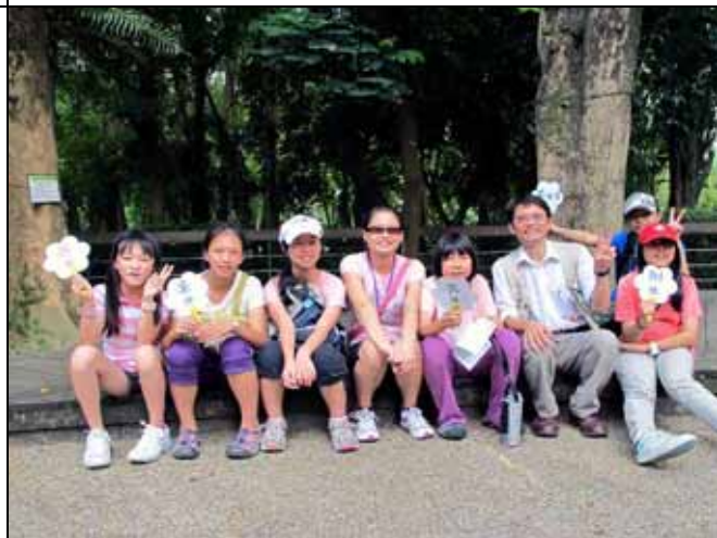
許多粉絲已經有第二代加入聽講行列