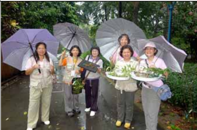
解說結束，一群人將借來的植物歸還溫室