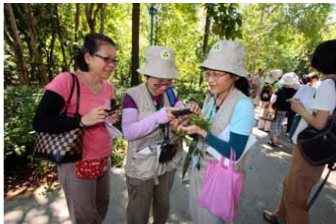
借我拍一下活的平原菟絲子的寄生枝條