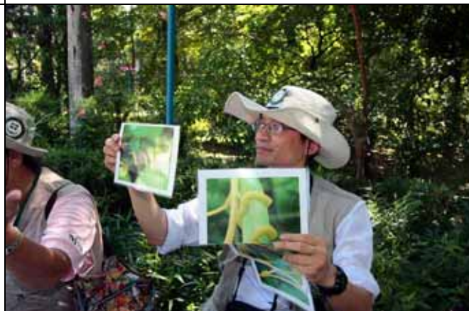
這是平原菟絲子纏繞侵入寄主的圖片