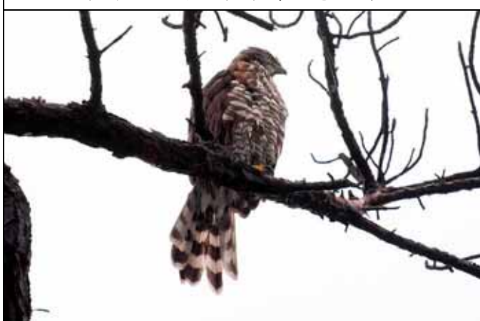
大雨過後鳳頭蒼鷹意外現身，令人驚豔