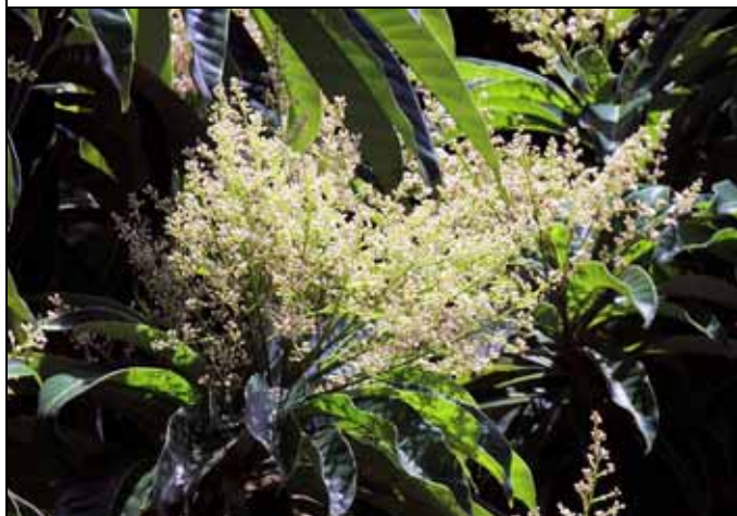
台東漆花果皆美，滿樹白花，非常醒目