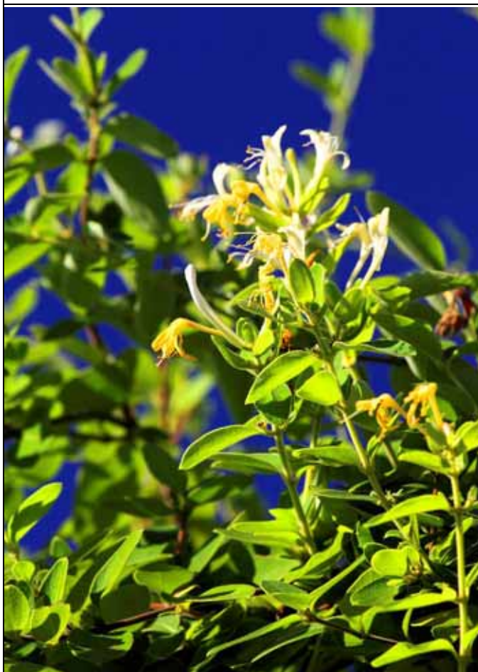
花架上忍冬因花朵有兩色而得名