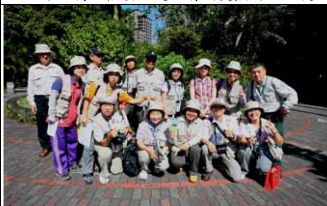
認真又快樂的志工們頂著大太陽服勤