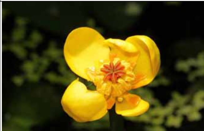
台灣萍蓬草中央雌蕊為紅色可供區別