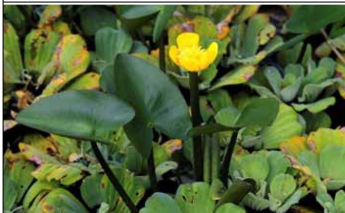
日本萍蓬草中央雌蕊為黃色