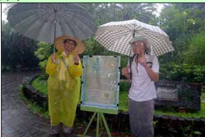
傾盆大雨中只有一位遊客準時到達