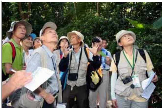
看看這棵中東海棗附生了多少蕨類植物