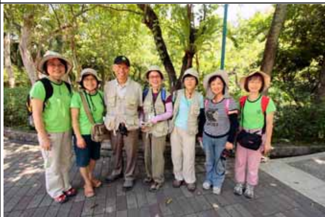
丁老師風趣的的解說贏得許多遊客讚賞