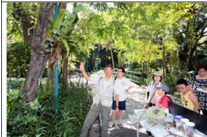
山蘇花有三種，常吃的有南洋及台灣山蘇花