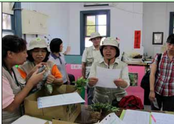
美香組長在志工室內忙著分配工作