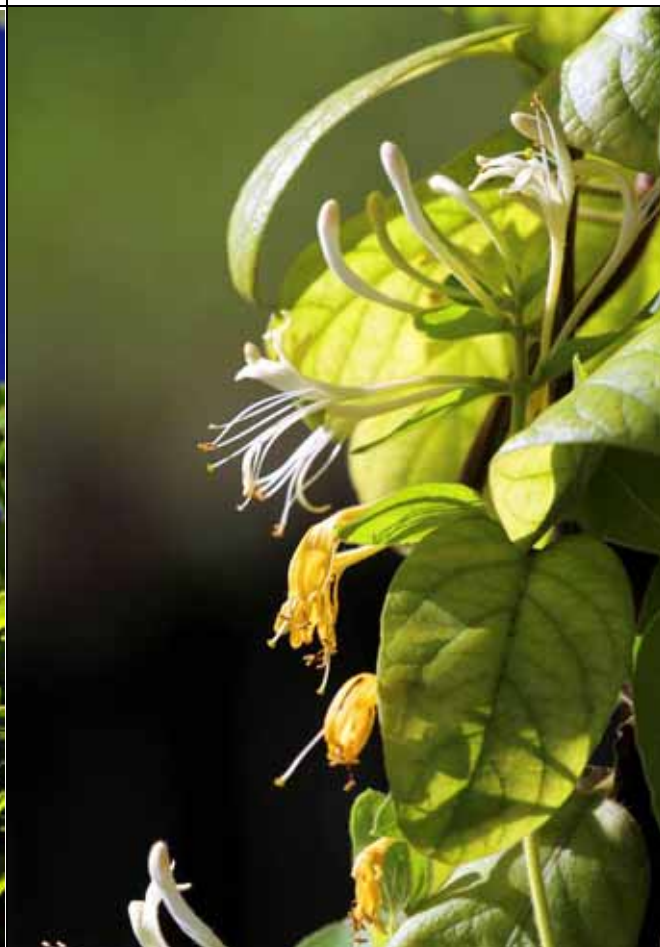
忍冬剛開為白色，花後黃色，兩色花朵特寫