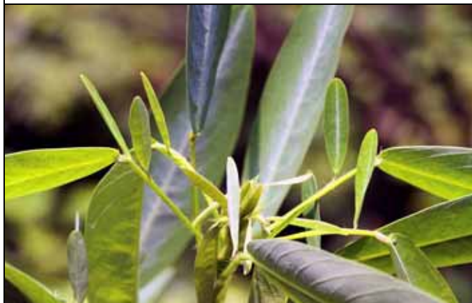
舞草的兩片小葉會隨溫度、音響而跳動起舞