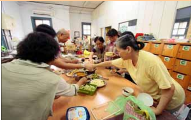
來！一起動手，大家努力加餐飯