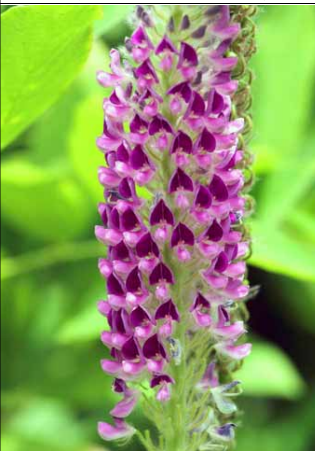
兔尾草漂亮的紅紫色花序