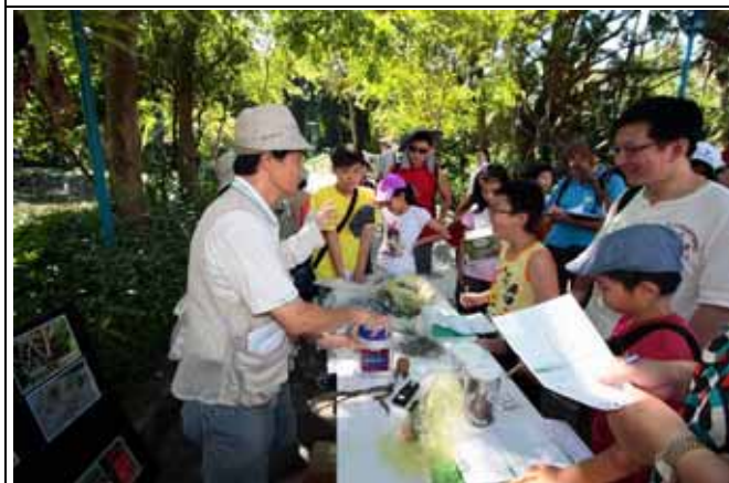
福和老師介紹各種寄生植物的型態