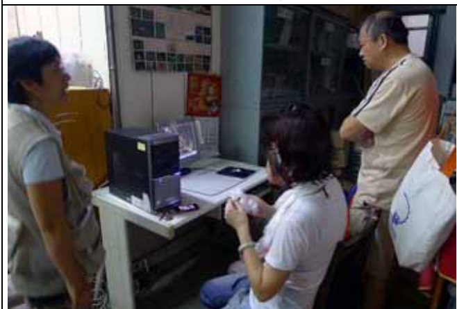
晚到的遊客觀賞菟絲子寄生的影片