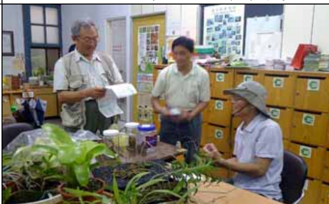
國明老師講解各種不同種類的寄生植物