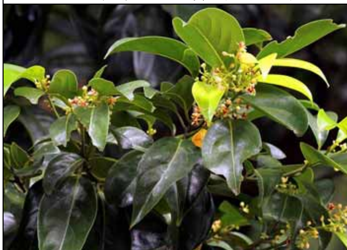
僅見於蘭嶼的三蕊楠現在正開花