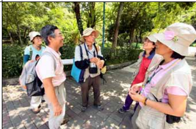
解說告一段落，大家交換一下心得