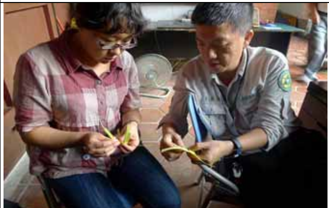
旺旺老師手工藝了得，大家來拜師學藝