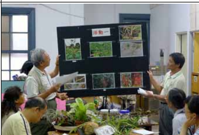
國明老師用圖板介紹各種寄生植物