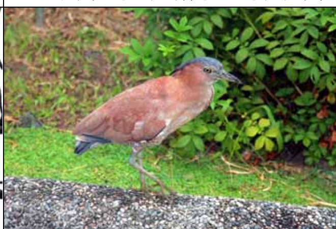
黑冠麻鷺在植物園已是相當普遍的留鳥