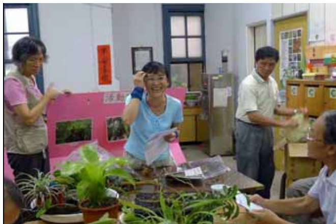
仰恩老師講解積水鳳梨與箭毒蛙特殊的生態