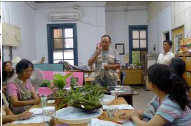
世界上只有艾氏樹蛙與箭毒蛙有此行為