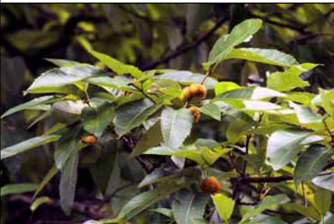
栓皮櫟花後結出許多帶有殼斗的果實