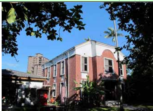
一早，萬里無雲，是個晴朗炎熱的好天氣