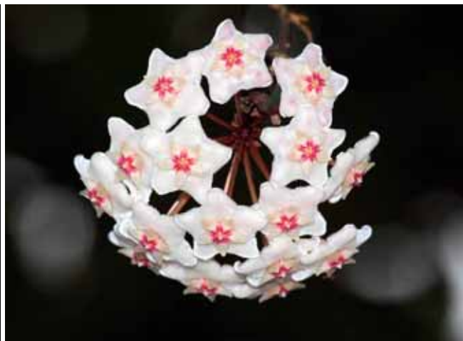
美麗的毯蘭乃是植物園開花最持久的蔓性植物