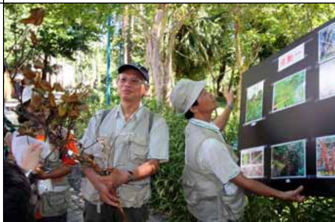
國明老師補充說明蓮華池桑寄生的特性