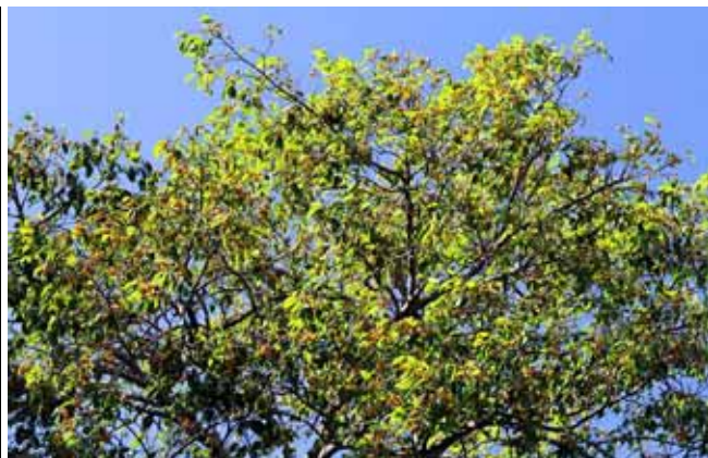
黃果垂榕經過兩次手術搶救，樹勢略見恢復