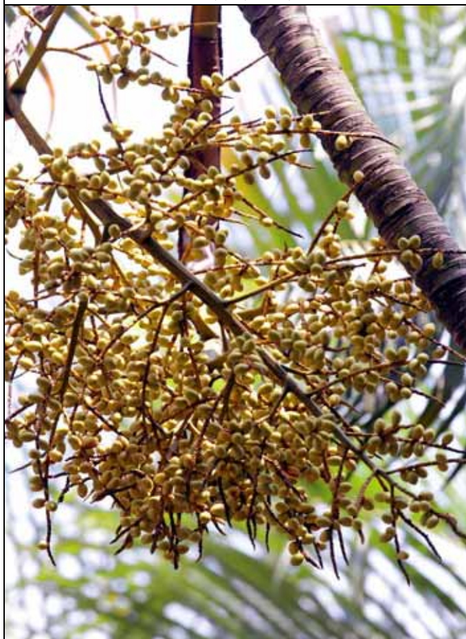
黃椰子黃紅色果實成熟後是松鼠的最愛