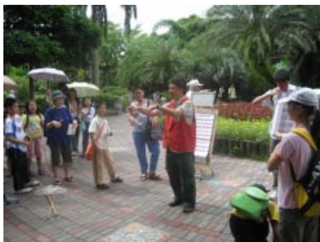
第一組的「團長」帶活動