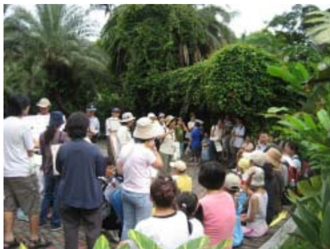
主持人被熱情的來賓團團圍住