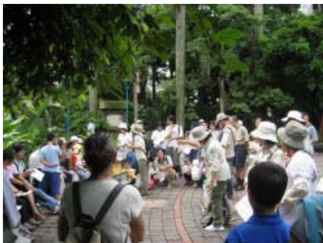
濕地功能「唱」給您聽