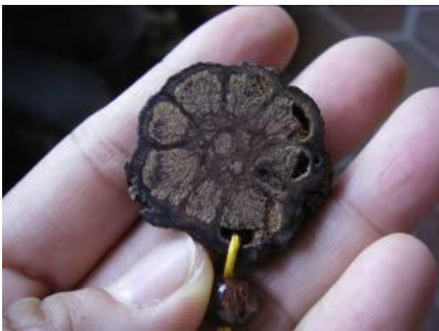
它的橫切面 木質部與韌皮部 交錯生長， 呈現如 菊花 般的美麗圖樣， 也因此成爲人們盜砍的對象！ 真的美極了！