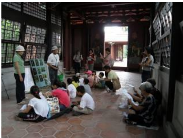
多氣派的一站.....氣氛佳，學習好