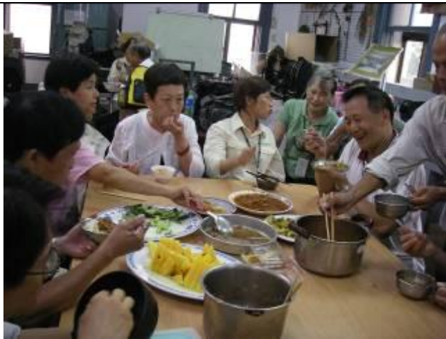
午餐的銘言：不吃完，下回就不帶來了！