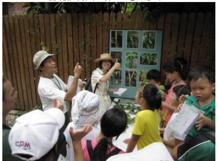
是快速記法啦！不告訴你，只有他們知道祕訣哦！