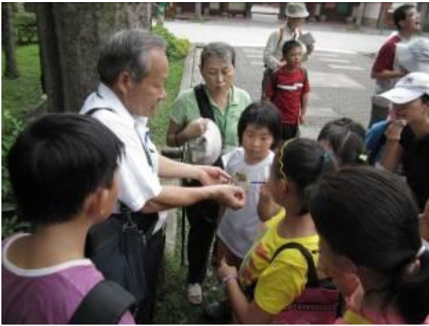
有沒有剪指甲？ 貓爪藤就是沒前，大王椰子上才有爪痕哦！