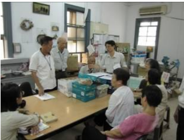
不午休？投票還是開獎.....還是開講問藥？