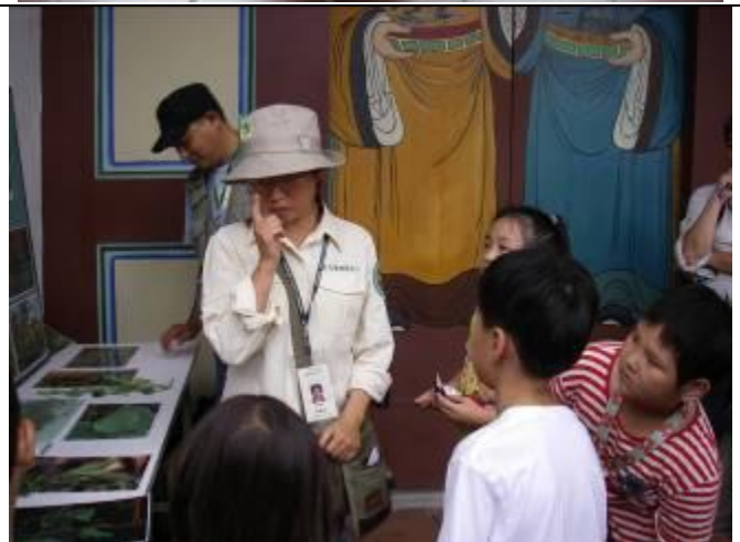
看孩子王，將解說內容深入淺出的傳達給小朋友， 有時則是把大、小朋友唬得一愣一愣的， 信不信，來瞧瞧就知道了！