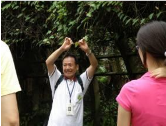
等~等~等~等~ 光哥~~ 您~可別學泰山用這「爬藤」給盪出去喔! 我救不到您Y!