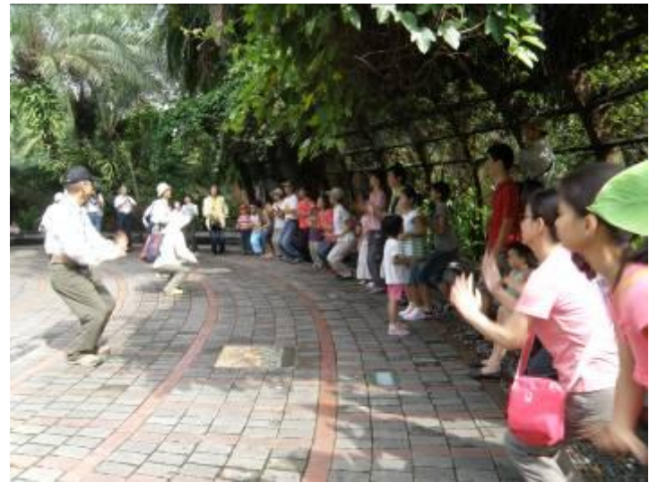
咱們馬步要蹲得穩→就要學阿美啦！