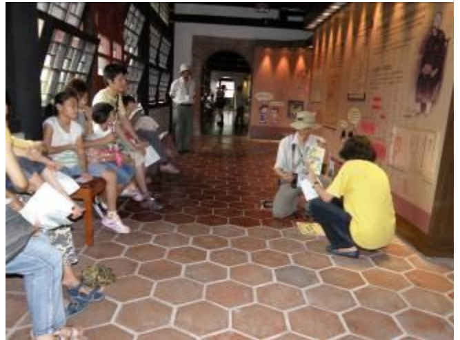
可別在衙署之內生火 男哥可是消防系畢業的