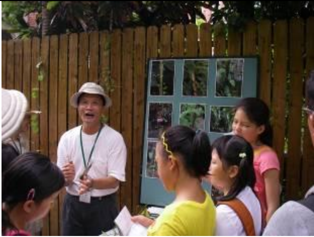
小福您就老實的說吧！ 爬藤的旋轉方向跟『你』有沒有關係？