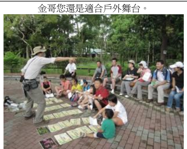
金哥您還是適合戶外舞台。