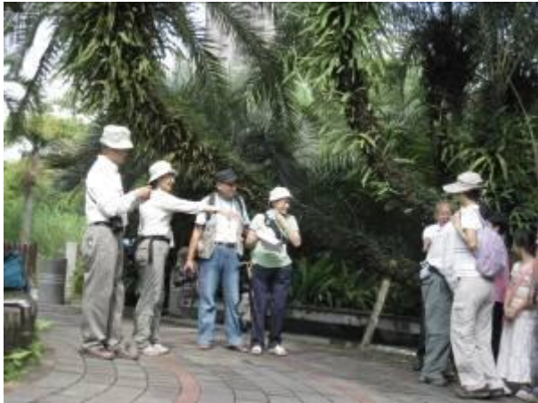
看到什麼？爬蟲類？還是爬藤類？