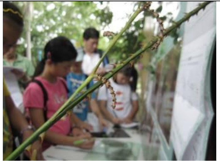
蟲癩？還是開花？還是？？？