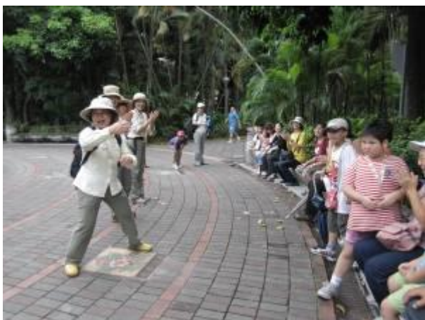
「扭一扭腰，拍拍手啊，眨眨眼睛，振振翅膀！」沒得閒哦！