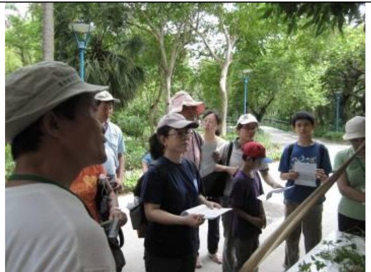
向左轉還是向右轉？拍電影哦？ 想太多了.....是向左旋，向右旋