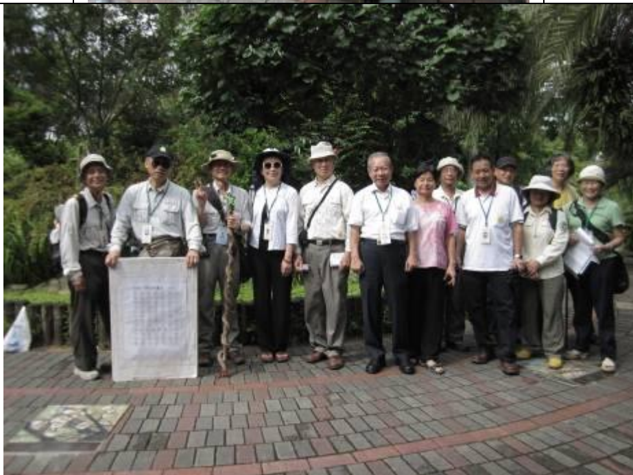
像不像「植物園」美聲合唱團！看看那個指揮棒，也能出現在台北植物園啦！