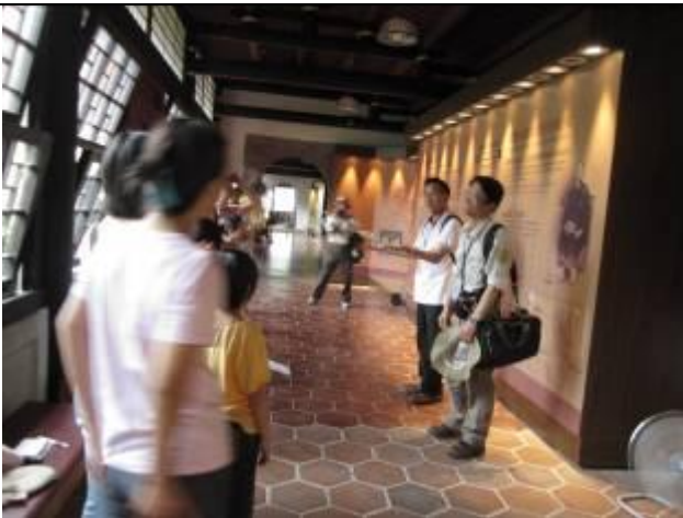
哥倆好？一起來躲雨！順便唱首世界名曲！