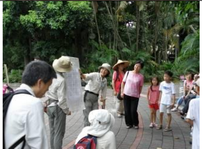
請用三 M 的電燈....大伙就不用彎腰看了