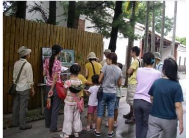
小英您在祈雨嗎？還是等我們活動完再下雨吧！