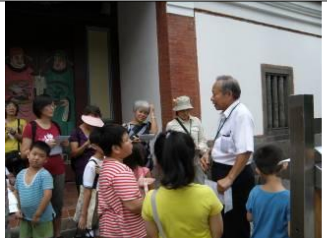
這一站真的看天吃飯 沒下雨→天空下認親 下雨→屋簷下認親 到底是誰要認親Y?