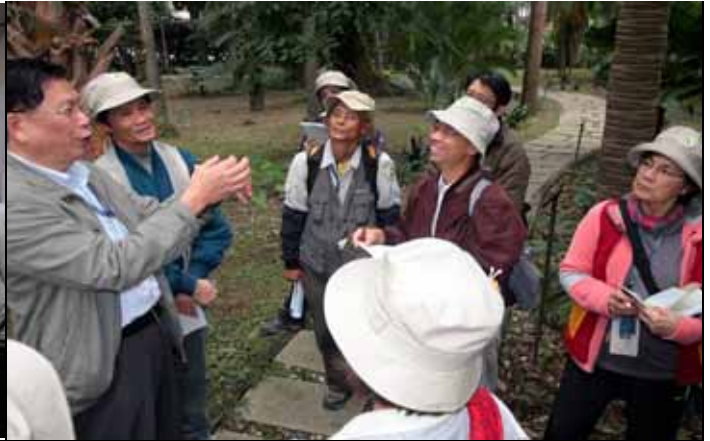
飯後周老師還帶大家去園區經驗傳承