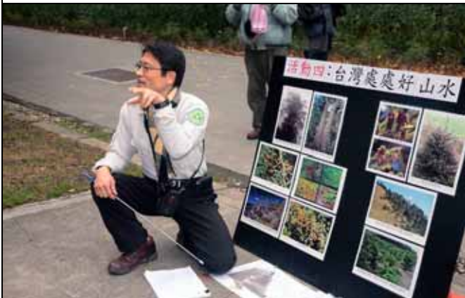
金敏老師還認真的查了不少資料補充內容