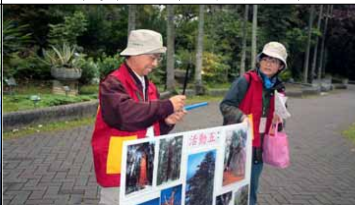
芳昌老師裝配生長錐，講解如何量取樹木年齡