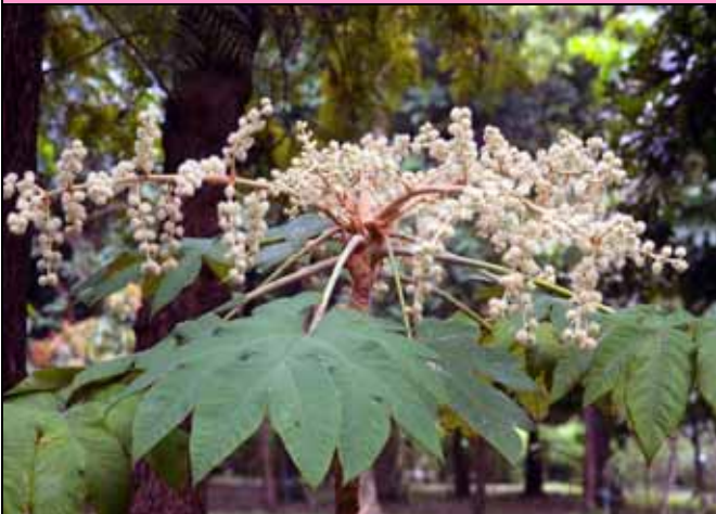
通脫木 (蓮草) 的繖形花序像不像一顆顆絨球