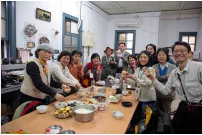
吃飯是最其樂融融的時刻