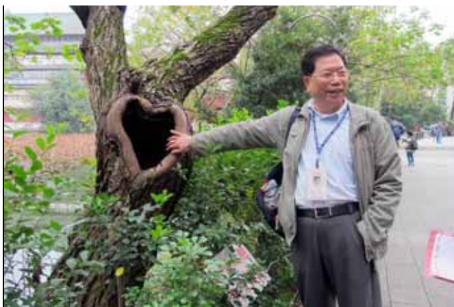
你看這個樹洞像不像愛心，實在有趣