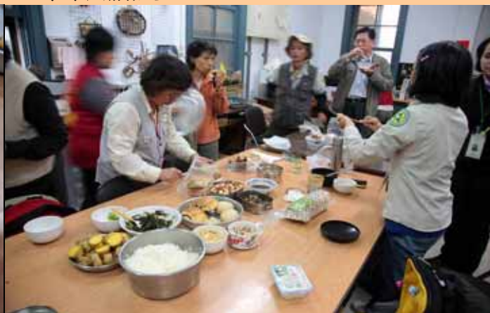
維英老師還熱心的幫大家抹花生醬