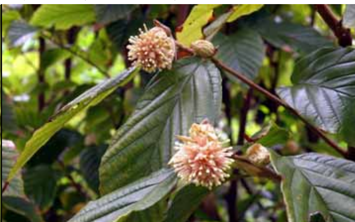
稀有的台灣瑞木只產於埔里附近森林中