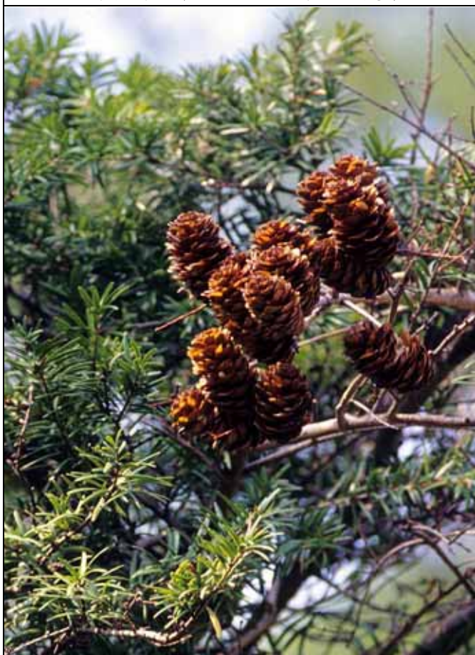
台灣油杉毬果已經木質化，不斷釋放種子