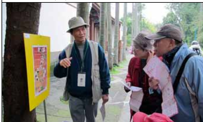
遊客對於陸生植物的演化途徑非常有興趣