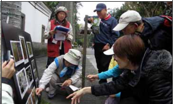
你看木麻黃的枝條像不像松樹的葉子