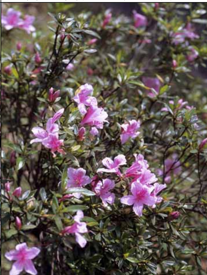
稀有而美麗的烏來杜鵑今年特別提早開放