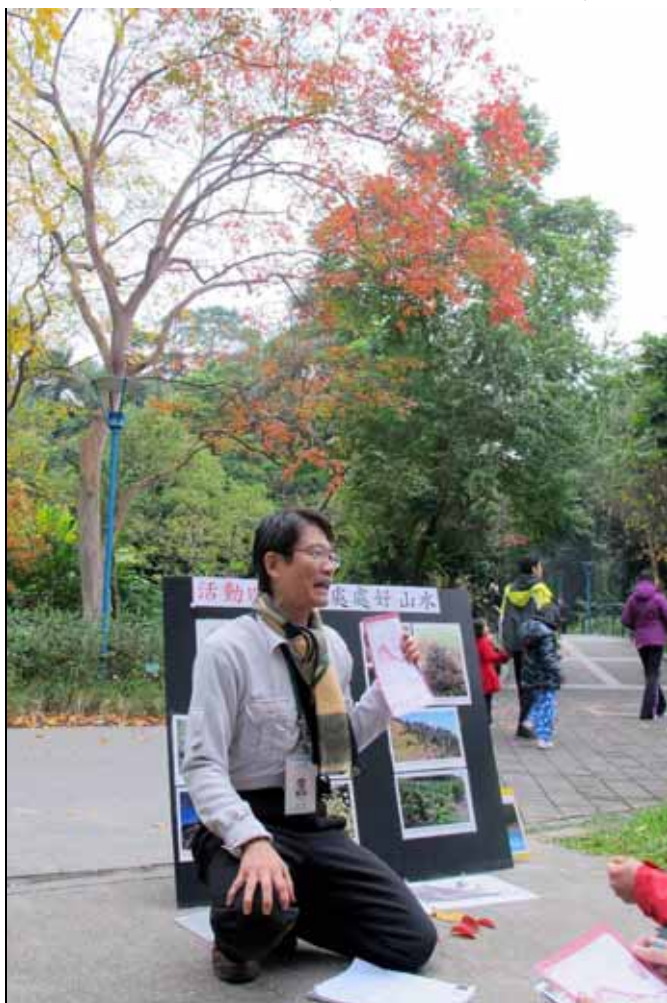
金敏老師特地挑了個好風水的地方解說