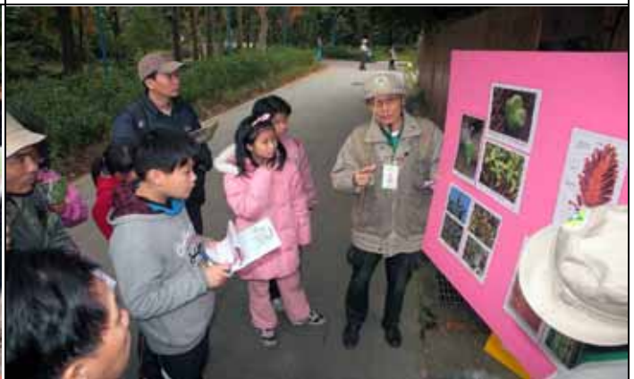
最難的活動—自然要老先覺-游老師出馬