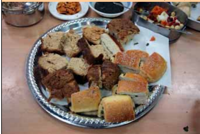
維英老師自己烘焙的愛心麵包