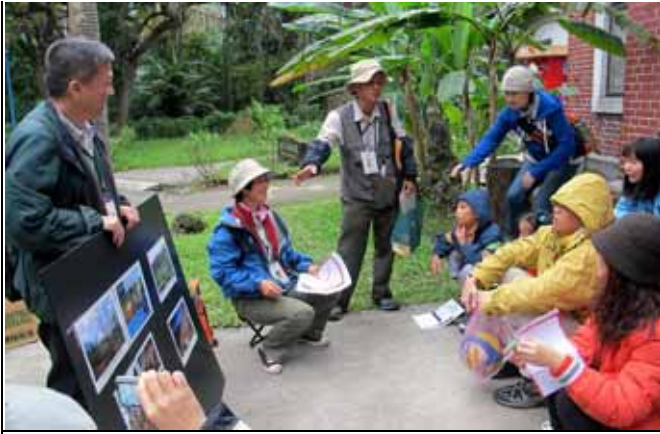
擅長植物的文俊老師不忘分享野外經驗