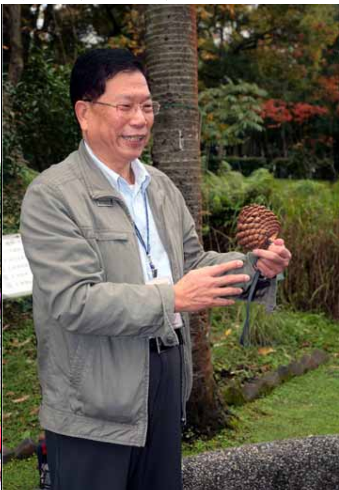
周老師還特地自己帶松樹毬果解說構造