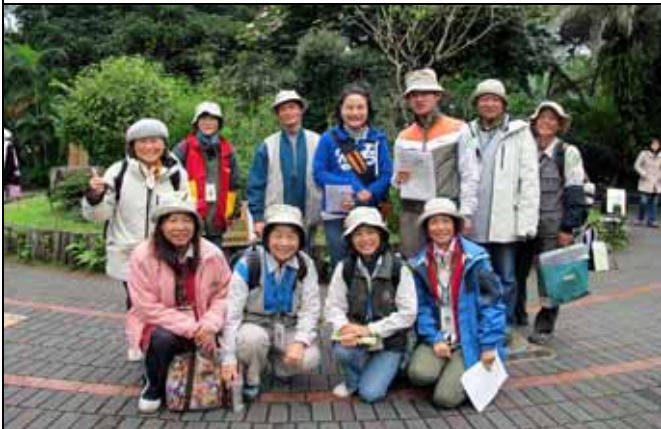
下午服勤的志工老師合影記錄