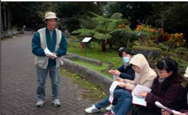
福和老師帶隊與遊客互動討論學習單內容