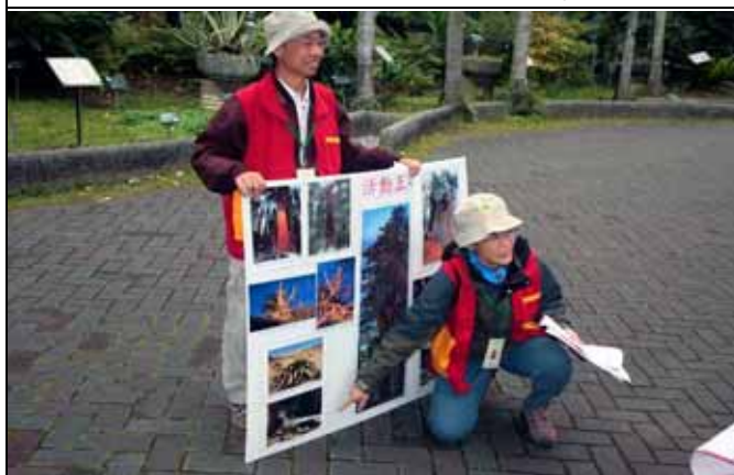
紅杉倒木下竟然可以開隧道讓車子通過