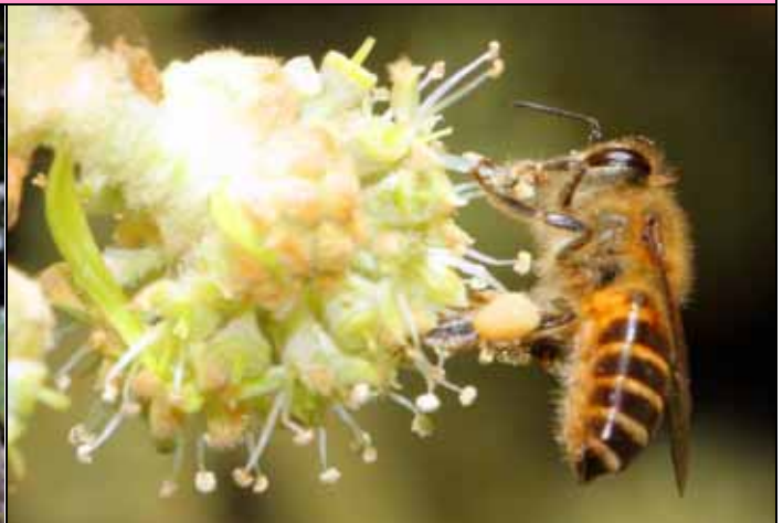
蜜蜂在通脫木的花上採集花粉