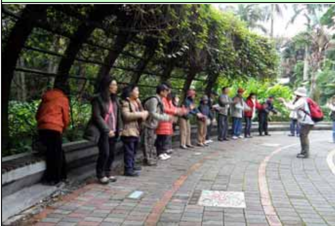
下午美香組長一樣帶遊客開場暖身