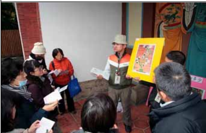
家蔚老師主講活動一陸生植物的演化過程