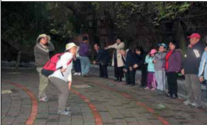
美香組長的拍手功讓大家都暖了身子