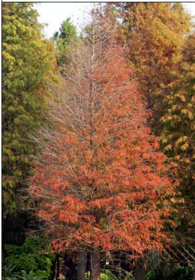
落羽杉是裸子植物中少見的落葉樹