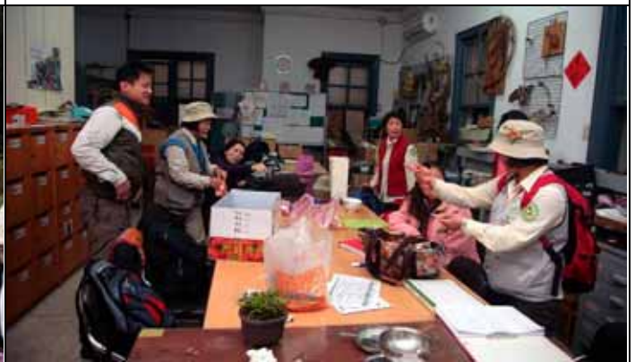
一天活動結束，大夥輕鬆聊天說地