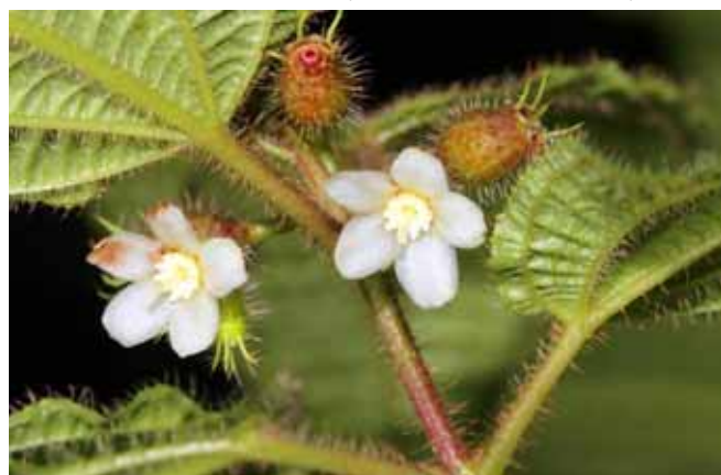
毛野牡丹的花很細小，要仔細觀察