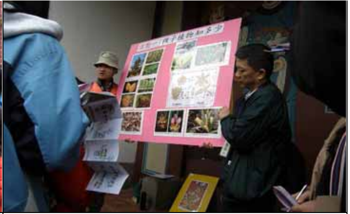
家蔚老師詳細講解裸子植物與被子植物的區別