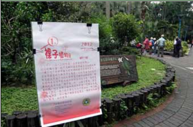
雖然下雨天候不佳上午九點活動仍準時開講