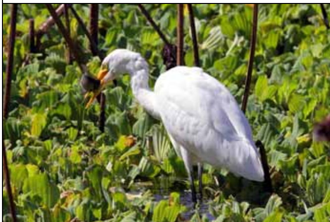
荷花池塘中數量豐沛的魚類是過境及渡冬鳥類最佳的食物來源（中白鷺吃食吳郭魚）