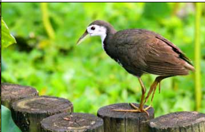
苦阿！苦阿！白腹秧雞特殊的叫聲讓人印象深刻 野外非常隱密，植物園中倒非常大方的讓人欣賞