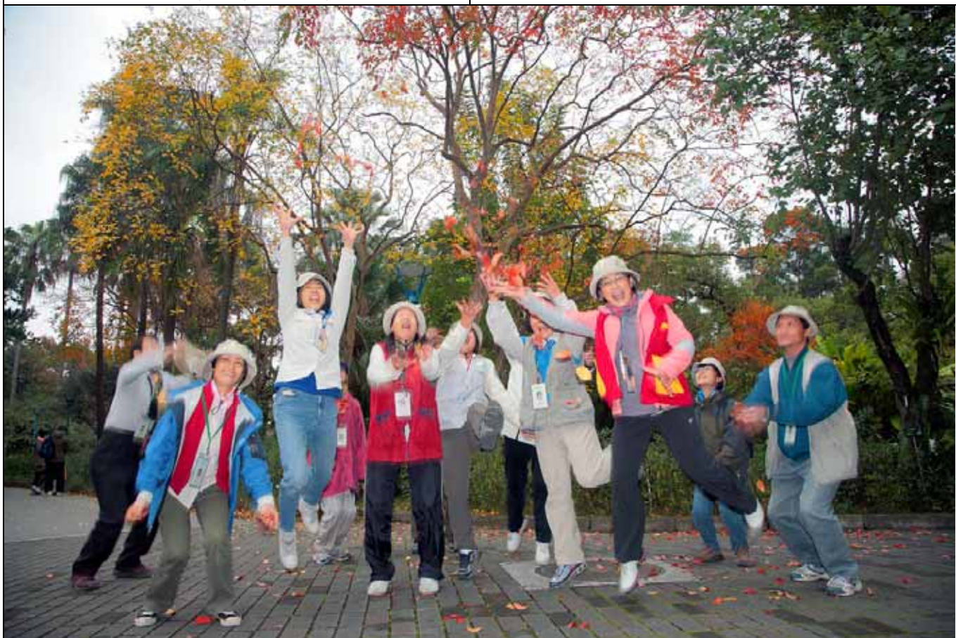
滿地落葉，一堆頑童興奮的玩起灑落葉看誰跳最高的遊戲，駭到最高點