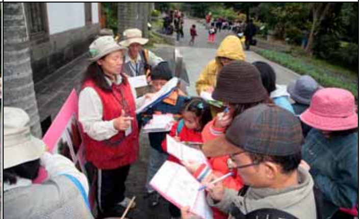
永芳老師帶遊客寫活動二的學習單