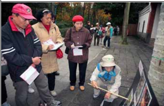
雪花老師非常仔細的解說圖片的重點