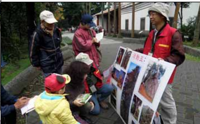
小朋友來算算看這棵紅杉上有幾個調查人員