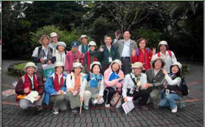
上午解說志工老師合影記錄(聽說軍中不可比 Y)