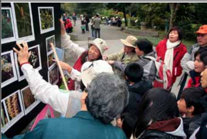
雪花、永芳老師認真講解，遊客都非常專注