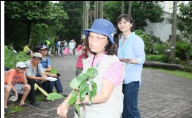
鴨舌草比布袋蓮小一號