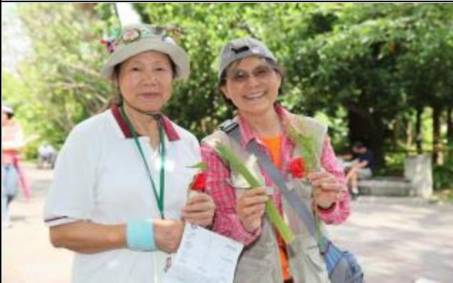
紅色康乃馨配上綠色田蔥，多美啊！