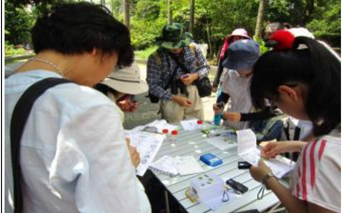
觀察之後，馬上有答案