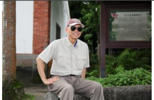
我長得像不像黑狗兄