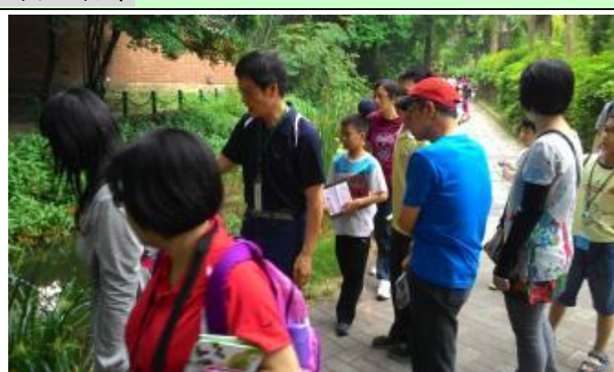
柏園老師帶遊客巡園找水生植物