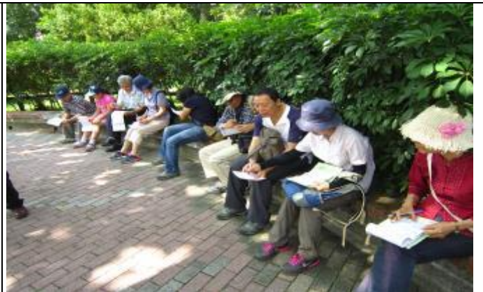
找找看有沒有實果