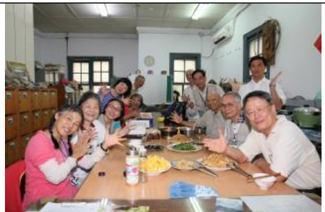
午餐時大夥兒同聚一堂