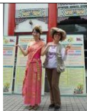
哎呀！秀珍老師和親善公主一樣美啊！