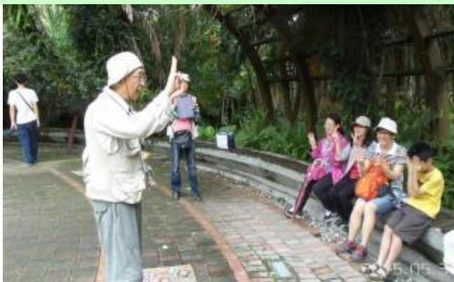
123 ㄟ 南海老師暖場