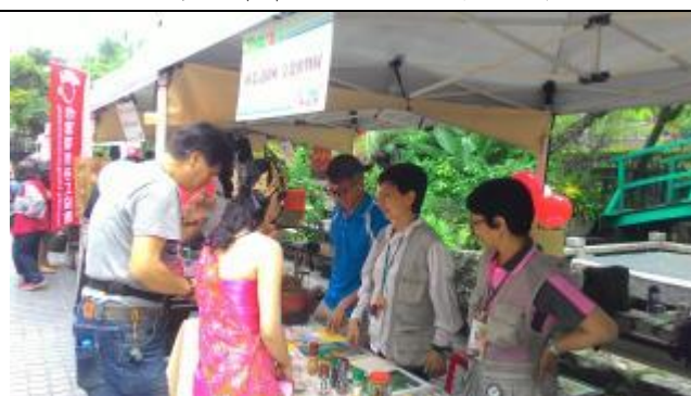
親善公主也對香料植物感興趣