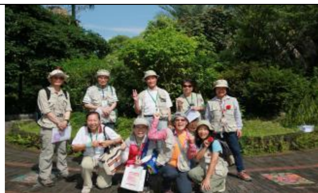
3日上午最有精神的服務團隊