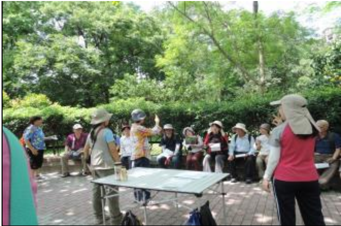
這謎底是 3 個字