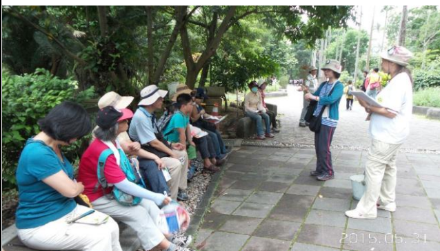
請你抽一張圖卡玩賓果遊戲