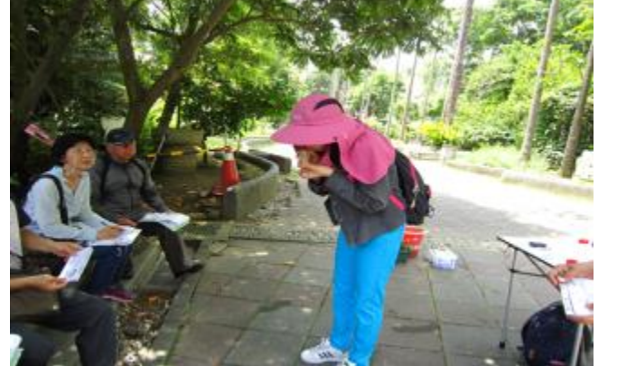
志工老師用天然吸管吹泡泡，以實做證明