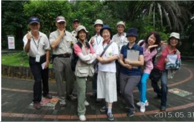
不同於一般的 pose 吧