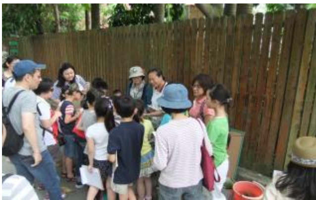
小朋友不要擠過來，大家都看得到