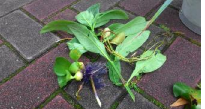
這個月的主角—溼地水草