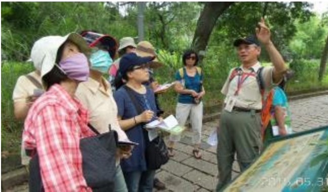
國明老師解說水生植物的生活習性