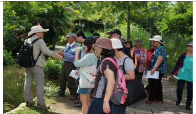
遊客聽得津津有味