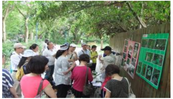
丁老師說了什麼好聽故事，為何大家眉開眼笑