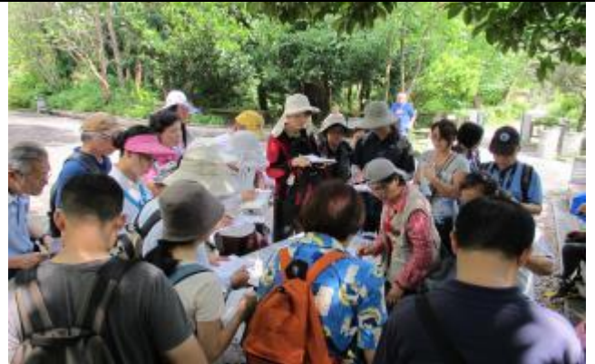
一流的老師，一流的遊客