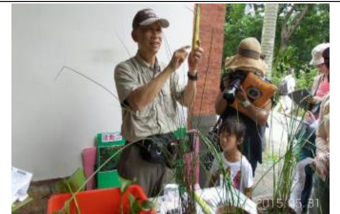
茭白筍的菰黑穗菌很有營養