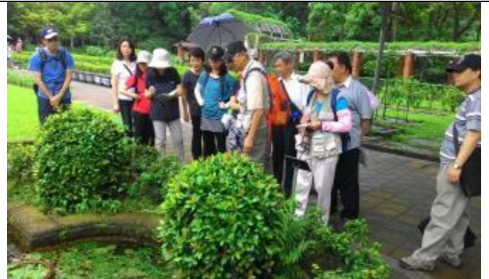
民生植物區有多種水生植物可觀察