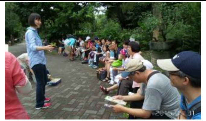
請在空格內填入1~9，大家來玩賓果