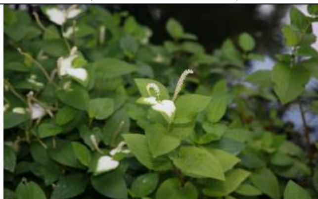
三白草也是溼地水草