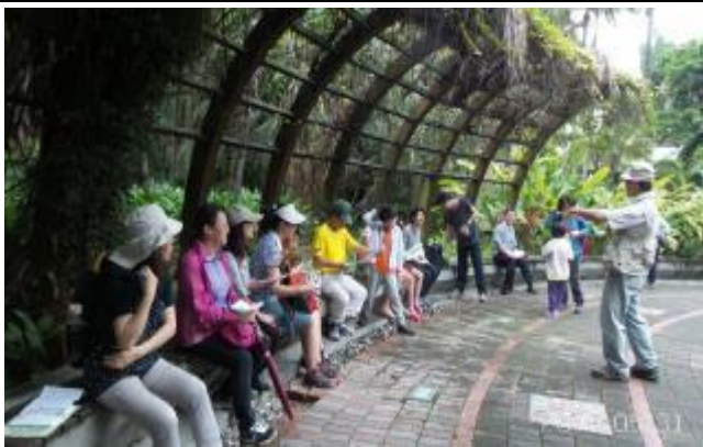
福和組長介紹本月主題-溼地水草