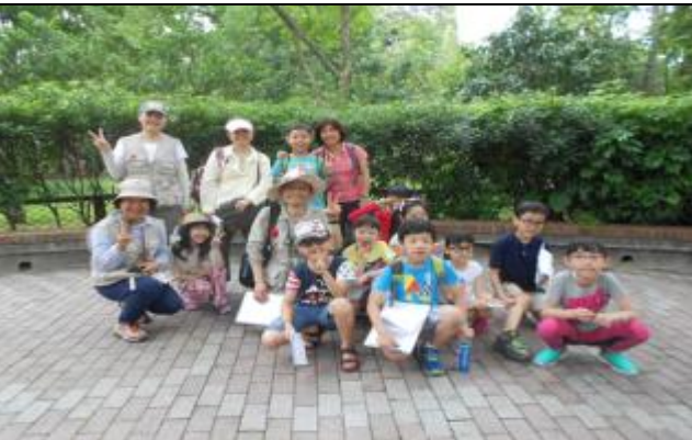
哆啦 A 夢隊