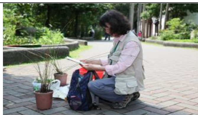
利用空檔再補充一些資料