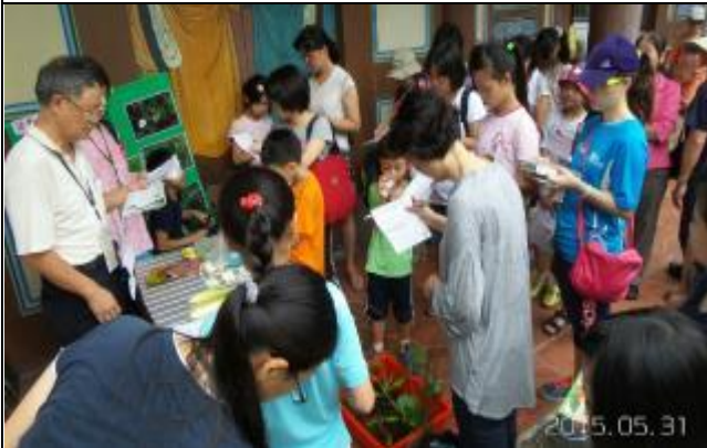
老師說的快抄下來！遊客學習好認真。