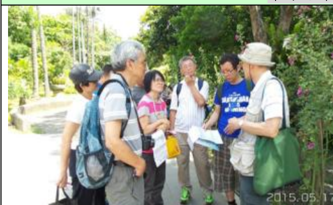
游老師解說水生植物的奧妙