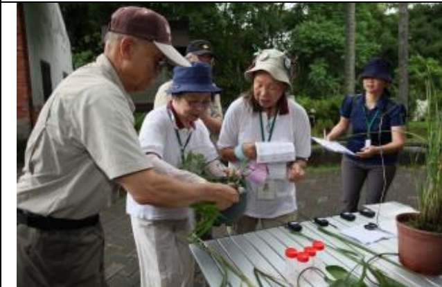
五種植物在一起比較，真的會搞混了