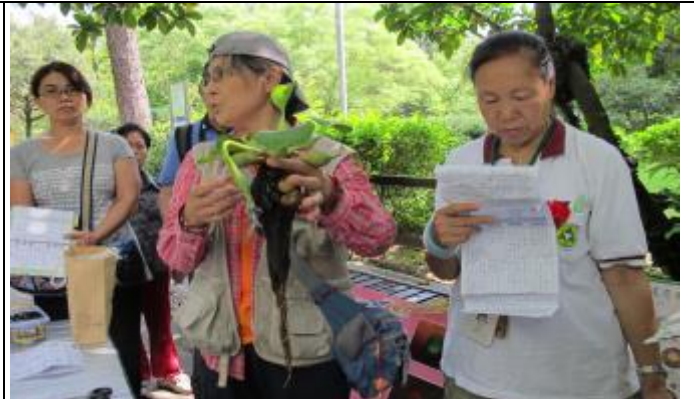
布袋蓮就是有胖胖氣室