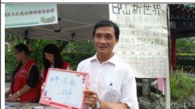
組長也義不容辭加入協助