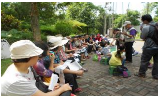
水草植物也會開出漂亮的花朵