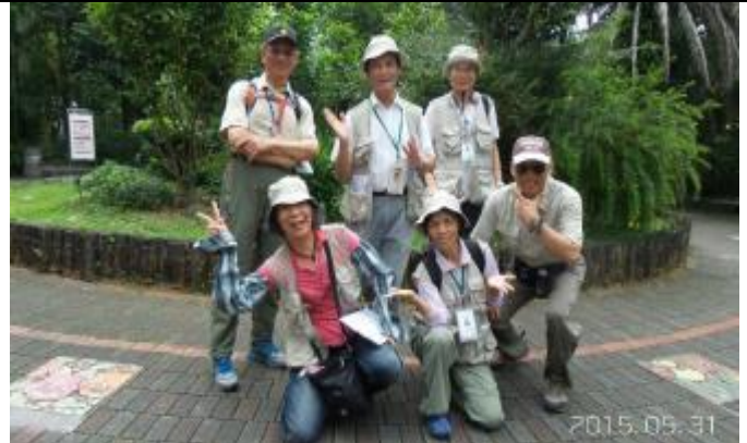
31 日下午服務團隊代表，其他老師去準備教材