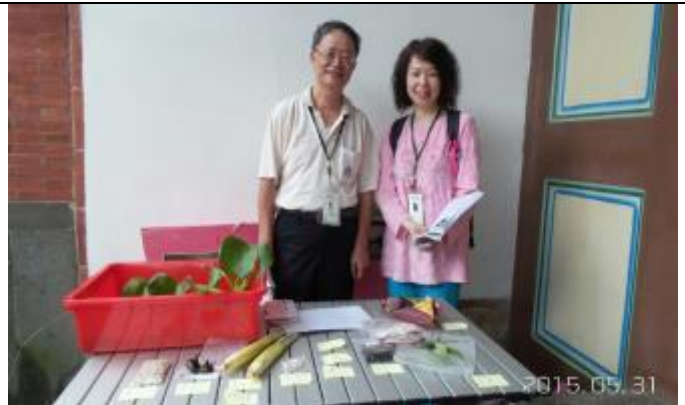
賣菜喔～ 本月道具真不少！