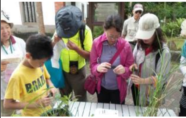
莖的橫剖面，你看清楚了嗎？