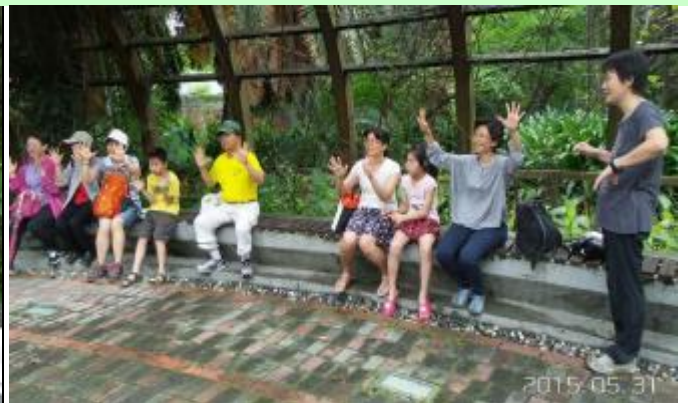
大家跟我一起這樣做