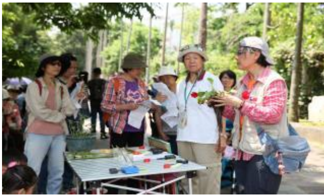
利用放大鏡達到實際觀察效果