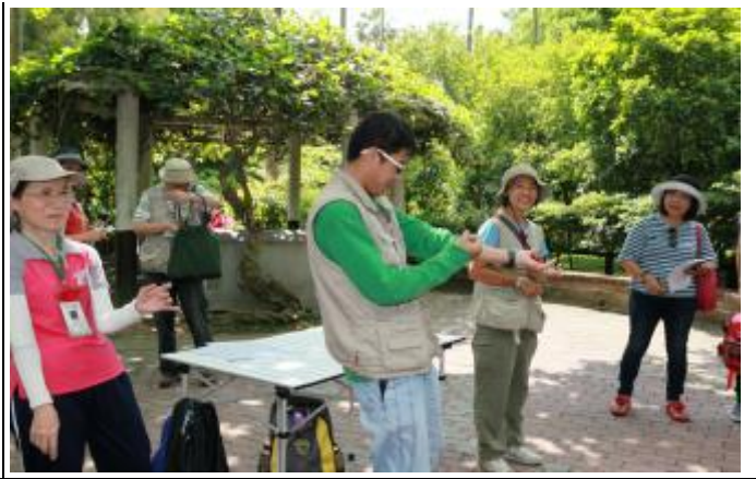
遊客比手畫腳表達水生植物的名稱