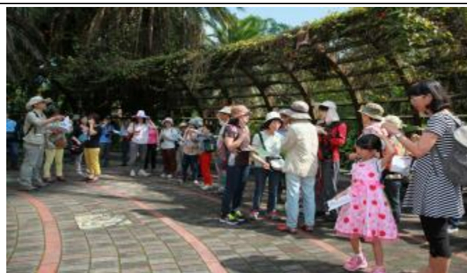
哆啦A夢隊快到金老師那兒集合