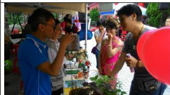
國際博物館日，植物園的攤位