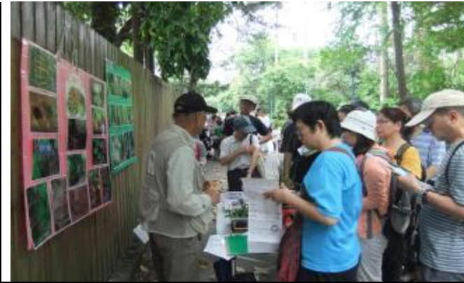
夏天蚊子真多，害我不能專心聽講