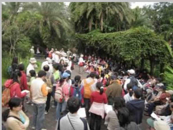
這是開場前的人群