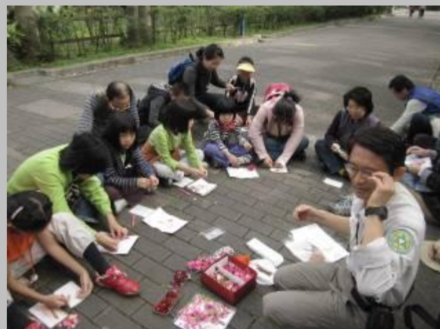
是花汁招展....涼拌手腳數盤....