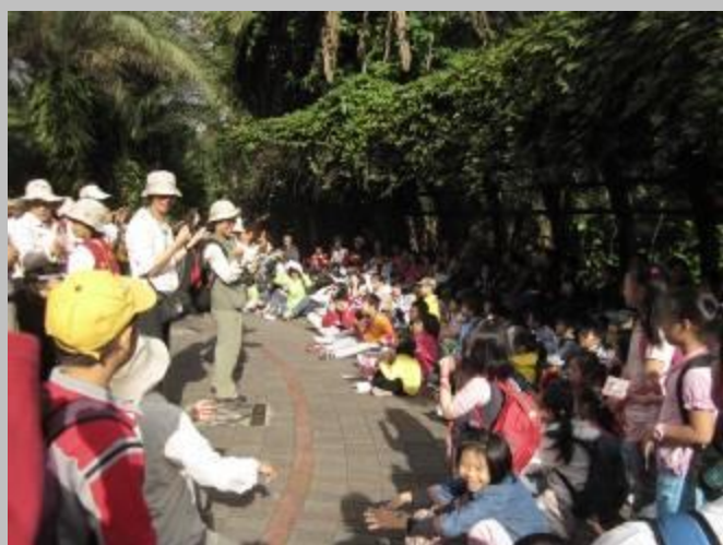
太陽公公一見小朋友坐好，就露出笑臉了