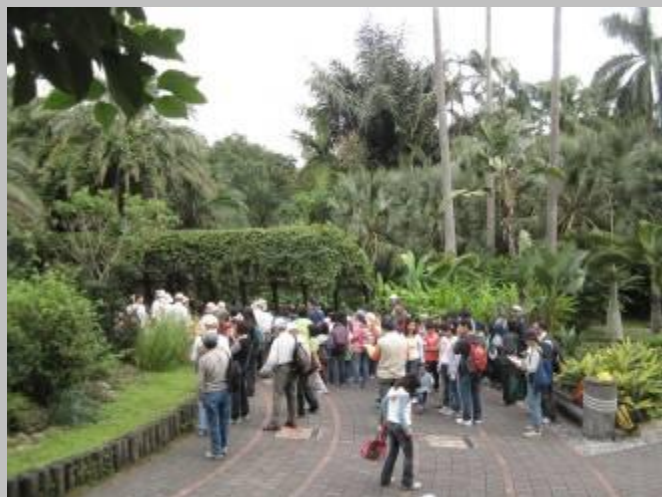
這是 9:00 後集合的人群