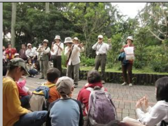
阿香姐的小叮嚀~~手腳與腦要協調哦！