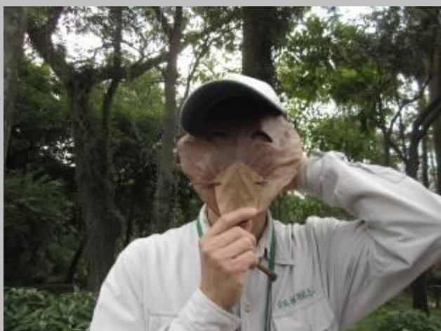
鐵麵人.....冷盤一道（猜猜偶是誰？）