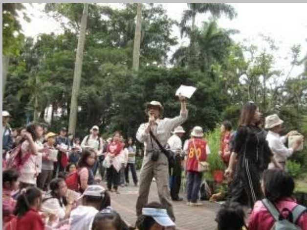
阿金哥揭開今天『花草遊戲』的序幕