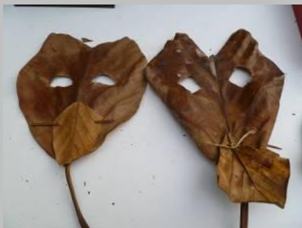
ㄉ~是葉葉精彩 摸摸看~聞聞看~拼拼看~ 順便找它的娘~