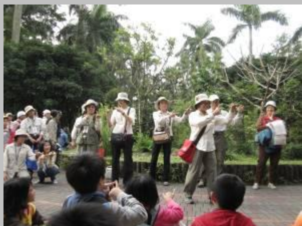
動腦之前要動動手和腳~