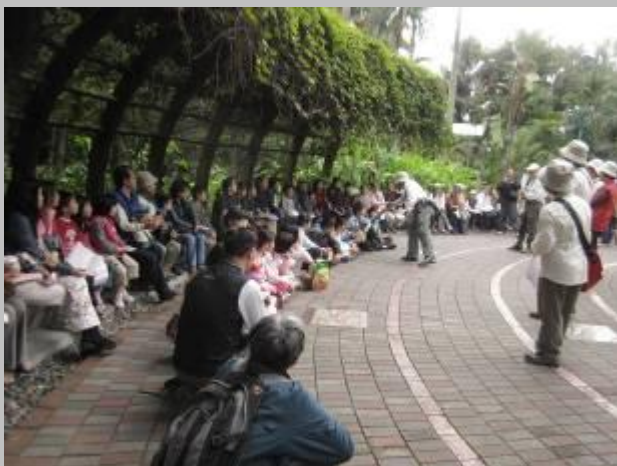
這是 9:00 前的人群