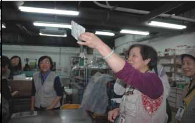
你看，一張漂亮的紙就出現了