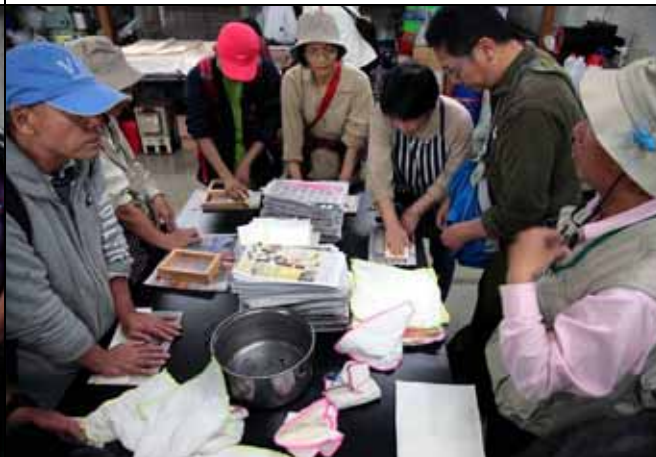
實際動手DIY是最重要的時刻