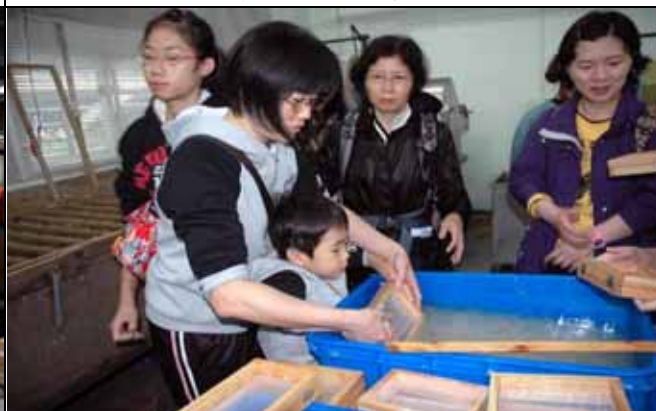
我也來，小朋友抄紙有模有樣！