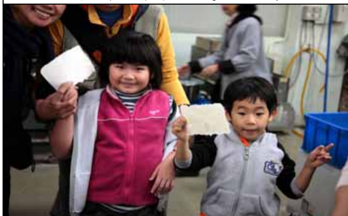
真棒！我自己會做紙了耶！