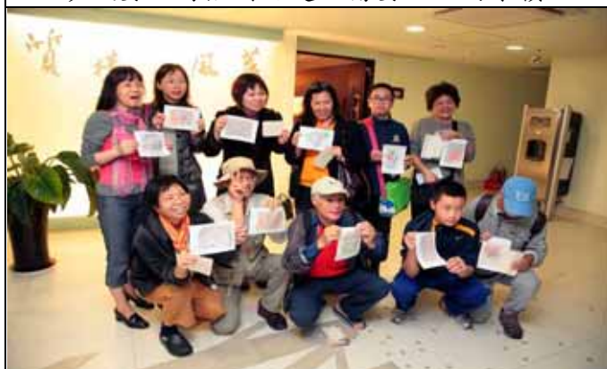
展示自己的作品真是驕傲又幸福