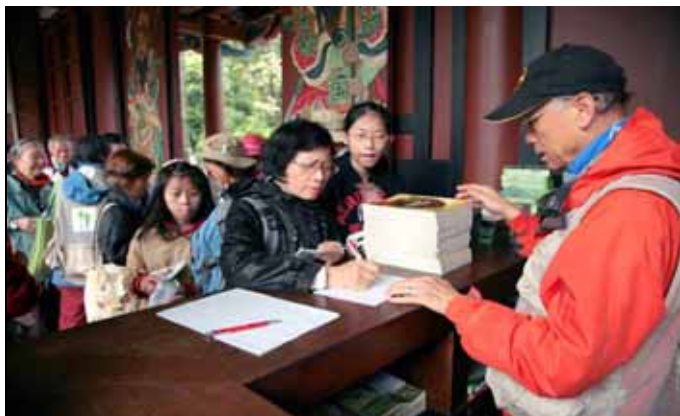
一年聽導覽的回饋，遊客排隊兌換獎品