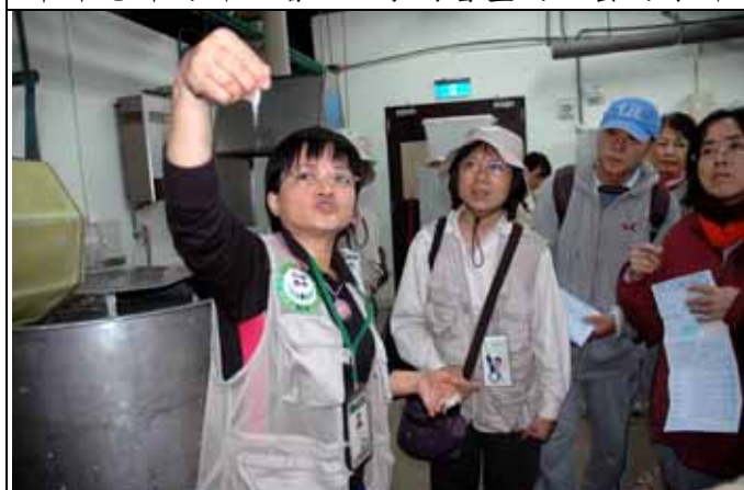
這就是由機器解出來製紙的纖維