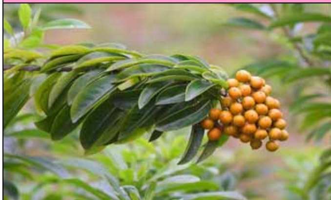
台灣海桐果實已經黃熟，不久就會裂開