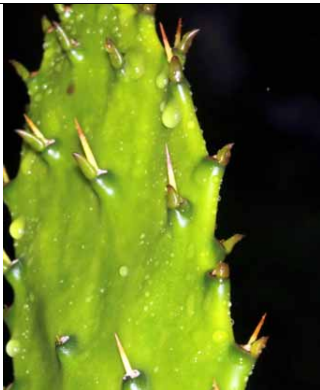
金武扇仙人掌的刺由葉腋的短枝伸出