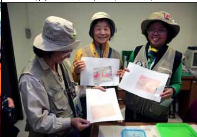
你看每一張流沙箋都完全不同