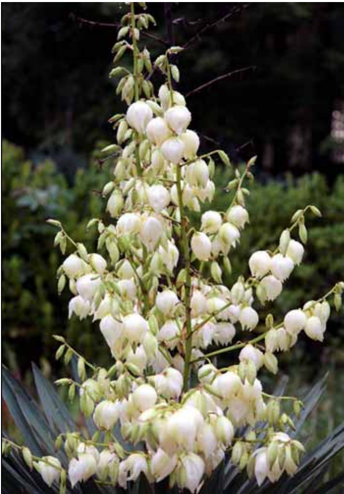
壯觀的王蘭花序，花朵白天合起，晚上開放