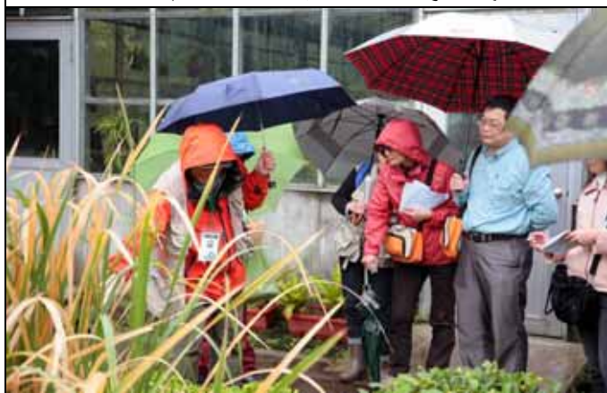
茭白筍殼不要浪費，也是製紙的原料