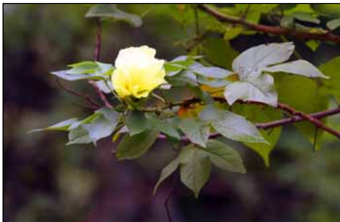
草棉是少數冬天還看到開花的植物