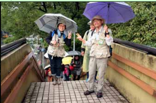
過馬路走天橋以策安全