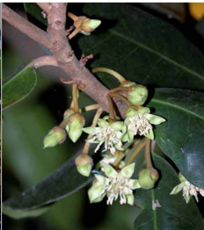
大葉山欖落花時雄蕊、花瓣都脫落，萼片宿存