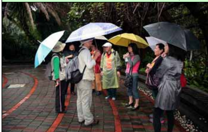
下大雨還過來聽導覽，今天的遊客真令人感動