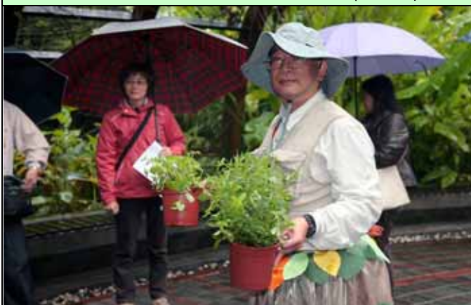
南海老師開場帶來甜菊、薄荷與大家分享