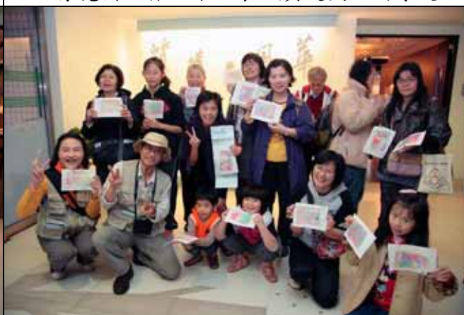
自己做的最棒，大家今天都很有成就感