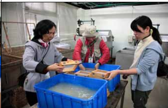
好像魔術一樣，手工製紙真是美好的享受