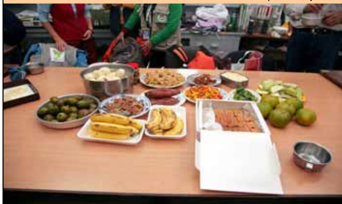
中午菜色豐富多樣，讓人食指大動