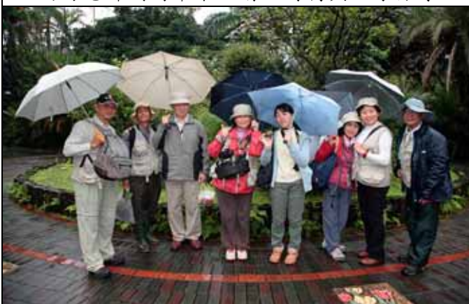
天下大雨，志工們仍不改其志，堅守崗位