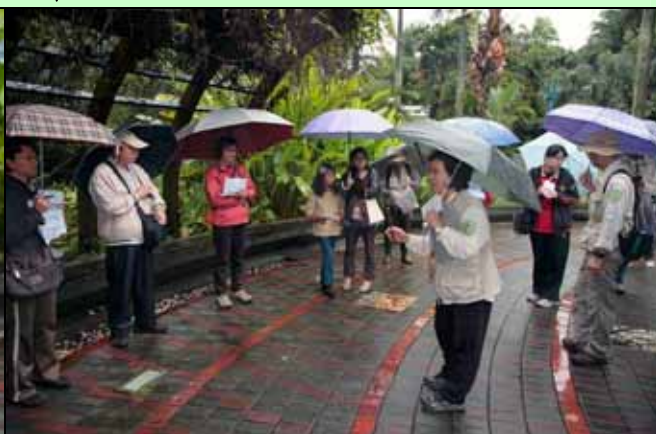
美香組長先將今天行程與大家介紹