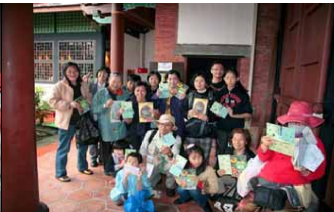
大家領到紀念獎品，真是快樂的收穫