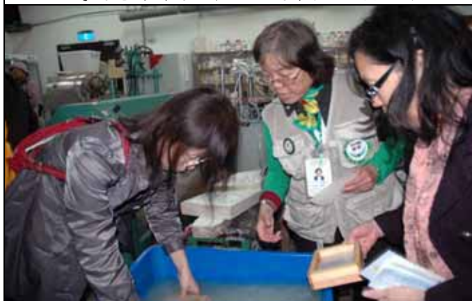
抄紙要如何恰到好處，需要經驗的累積