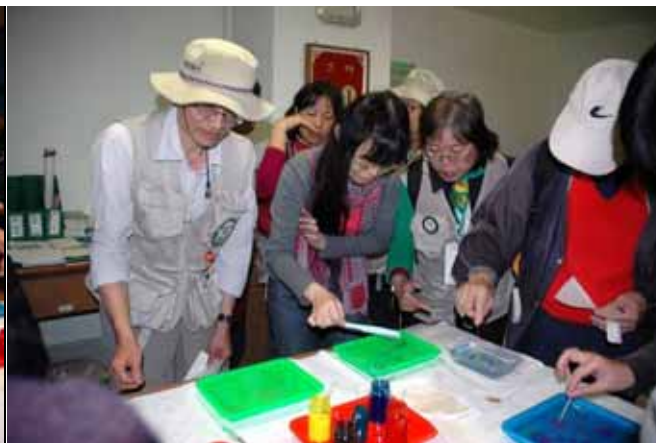
看看色彩的魔術，包你大為驚奇