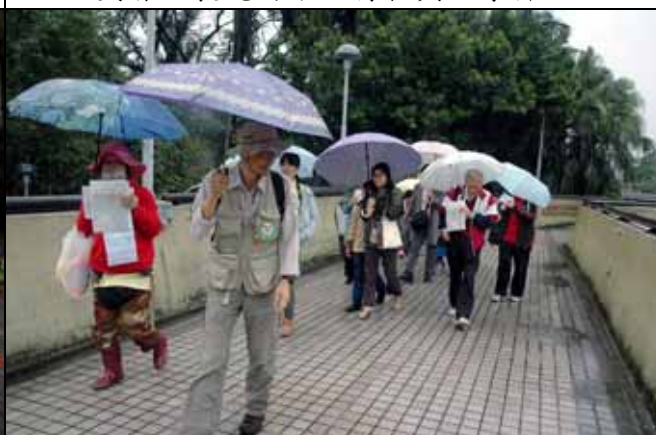
天雨路滑，大家過天橋時請務必小心