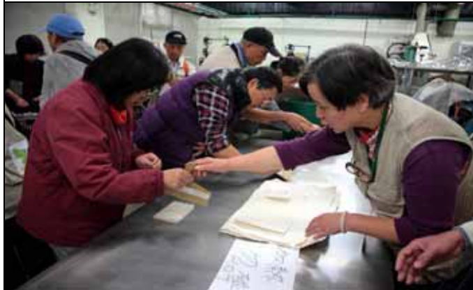
月妥老師指導遊客如何操作