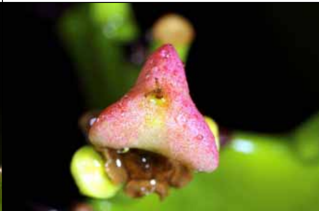
霸王鞭三角形的紅色果實很容易被忽略