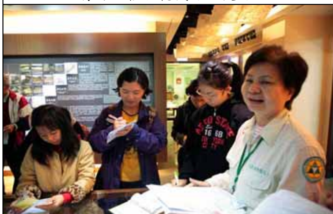
你們看的哪些物品不是紙做的？