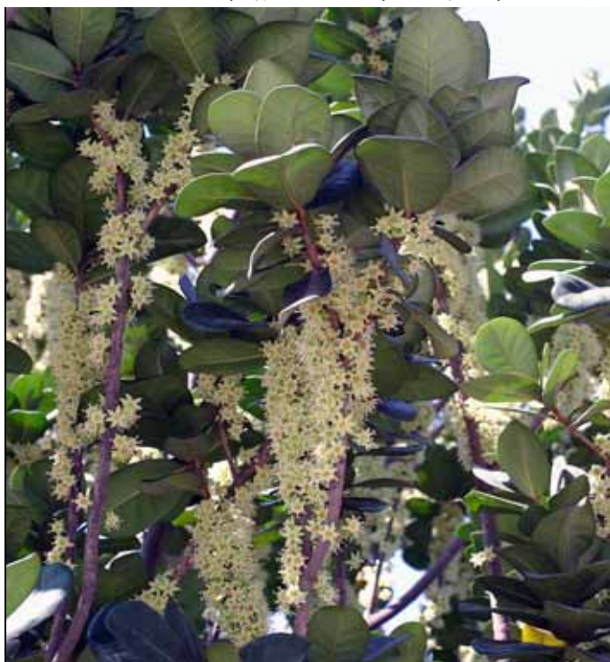
大葉山欖開花具有特殊的香味