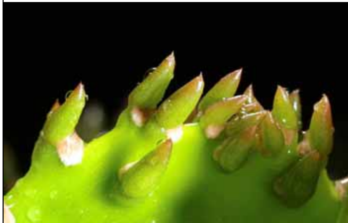
金武扇仙人掌的葉子非常細小，極容易脫落