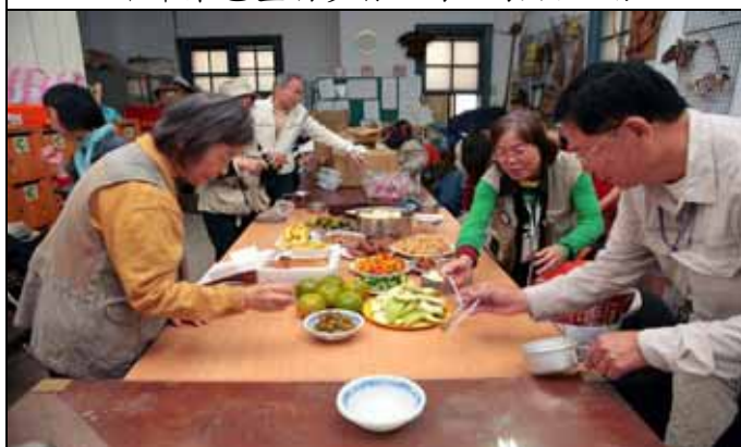
天氣冷大家要多加餐飯