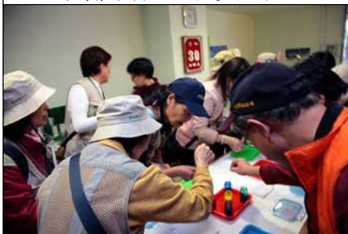
流沙箋的製作是今天大家最喜歡的DIY