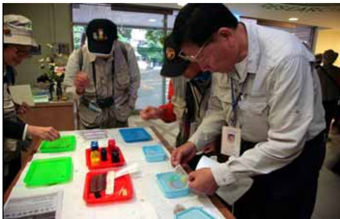
周吉常老師對流沙箋充滿好奇