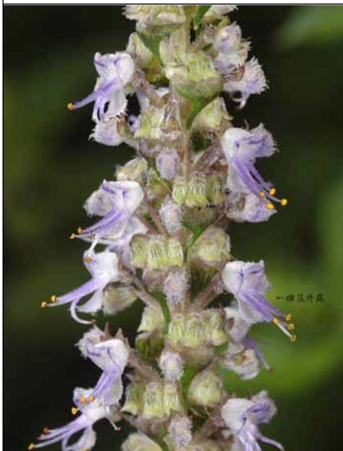
仙草的花由於雄蕊外露，所以並不屬於唇形花