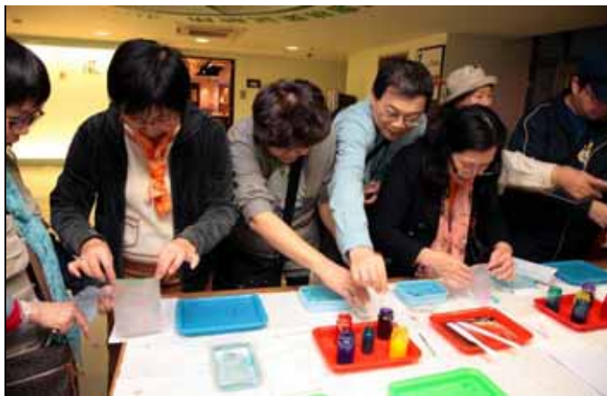
流沙箋是色彩最豐富，也是最難控制的手法