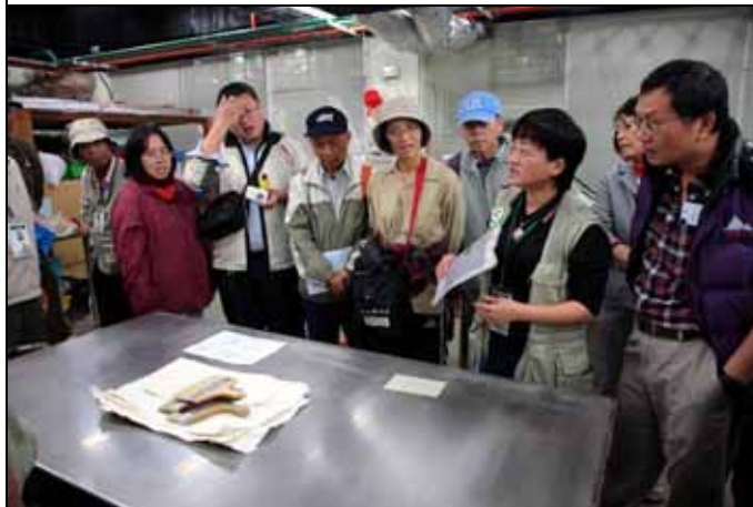
遊客對純意老師的解說非常感興趣