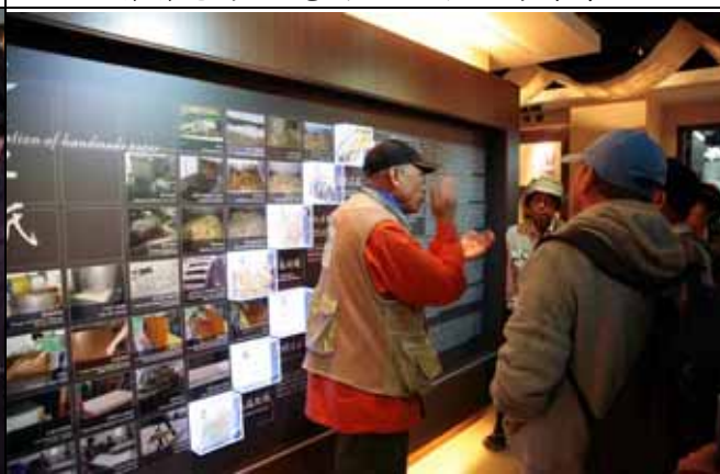
丁老師跟遊客介紹製紙的整個流程