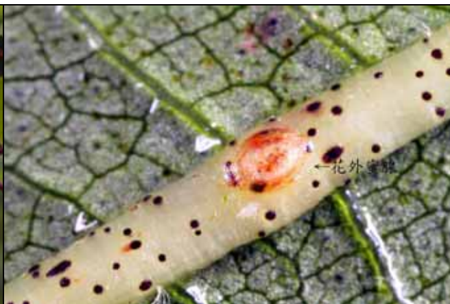
草棉的葉脈上有花外蜜腺，很容易被忽略