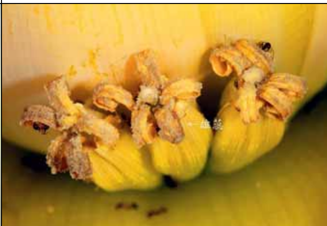
地湧金蓮花序中的雄花後開