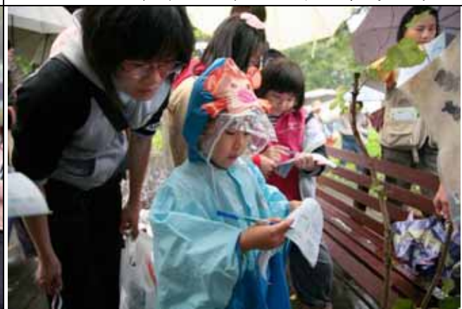
小朋友唸學習單，一絲不苟，真是佩服