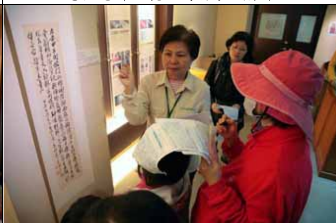
書畫很精美，裝裱才能保存長久