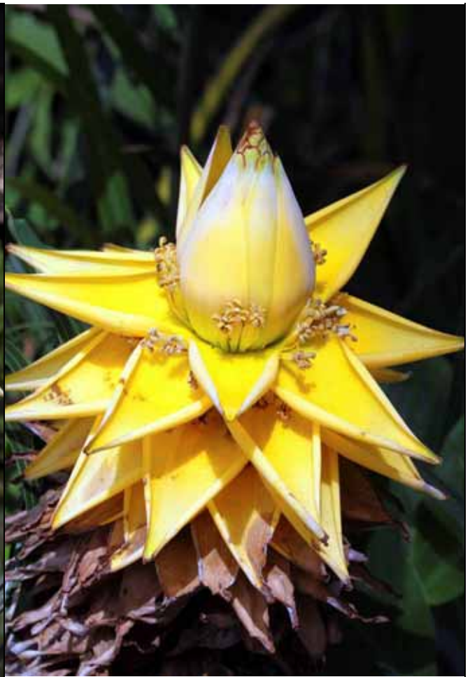
開花後期的地湧金蓮，全部開雄花