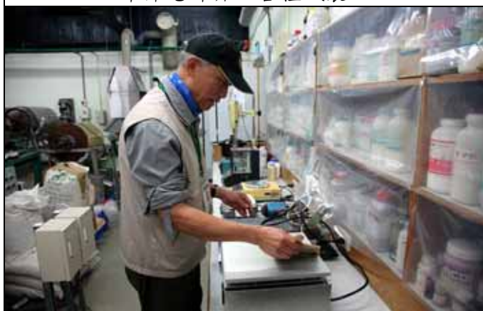
有另一種烘乾機可以使用