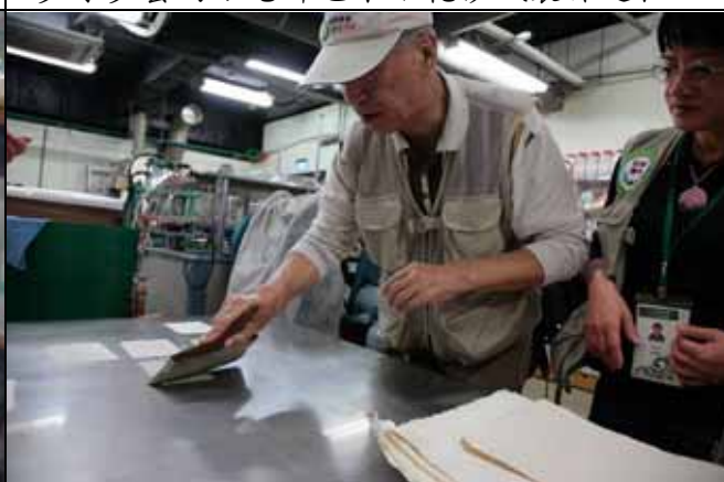
惠生老師示範如何將抄紙抹平