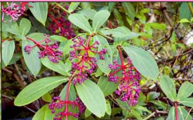
台灣野牡丹藤花果皆美，極具有園藝價值