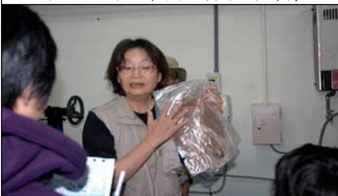
祖文老師介紹各種製作紙張的植物材料