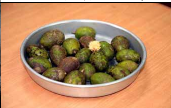
明珠老師還帶來少見的水果供大家嚐鮮