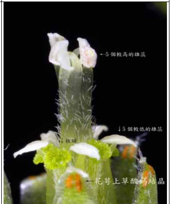
紫花酢漿草花朵為半等高花型，無法結果