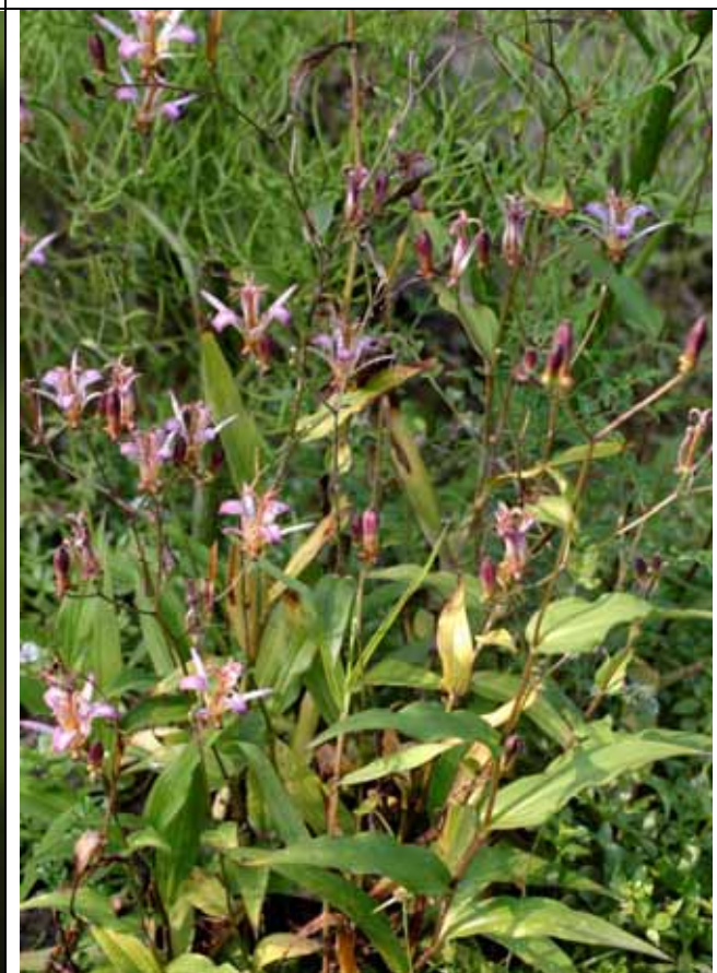
台灣油點草正進入盛花期，要看請早