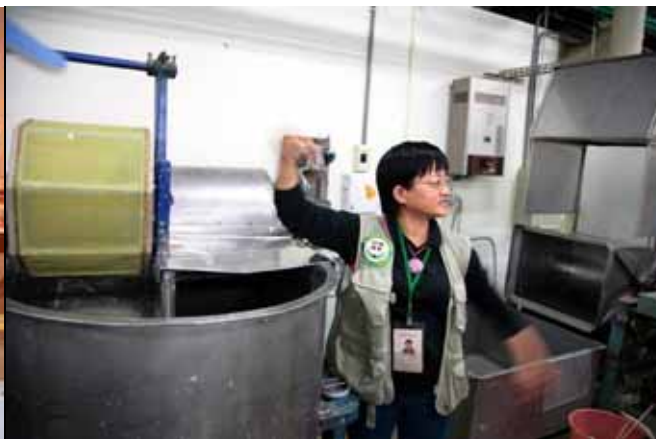
純意老師介紹不同的解纖機械