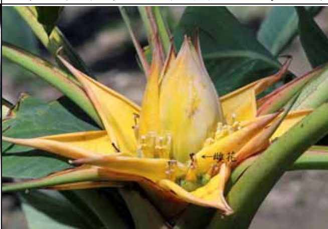
地湧金蓮花序是雌雄異花，雌花先開