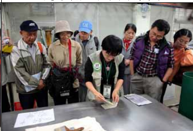
純意老師示範如何將抄紙抹平整的方法