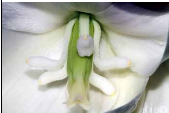
王蘭的花朵非常特殊，台灣很難結果