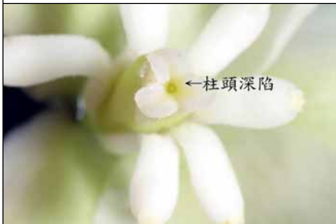
王蘭的柱頭深陷心皮內，必須靠王蘭蛾授粉