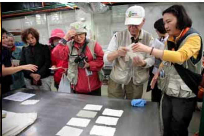
每一張紙都是大家親手製作的成果