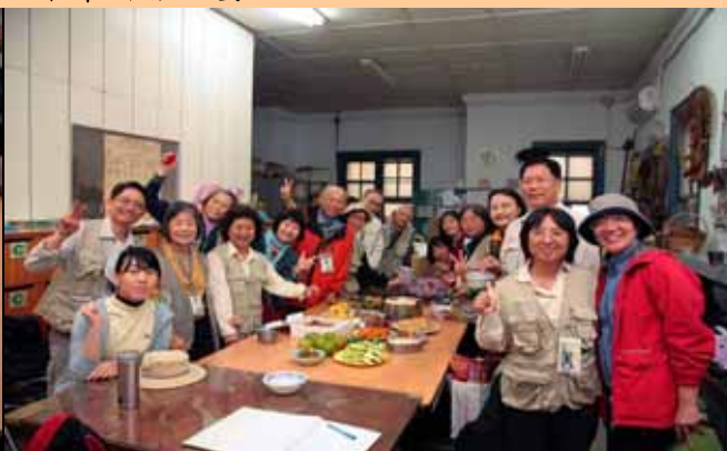
吃飯前大家一起來的大合照紀念