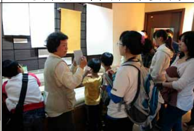
多才多藝的美香組長介紹不同紙張的性質。