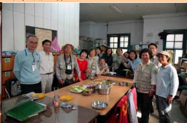
中午用餐的老師們合影留念。