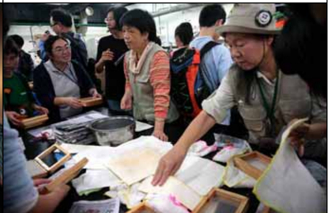
在志工老師安排下，大家忙中有序！