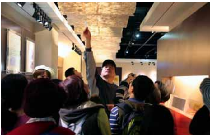
看哪！這些美麗的燈罩全是用構樹皮所製成。