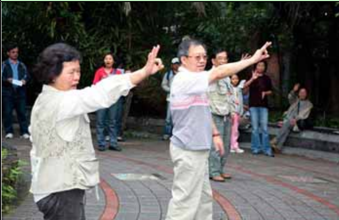
來！跟著我的龜波氣功練習，保證長命百歲。