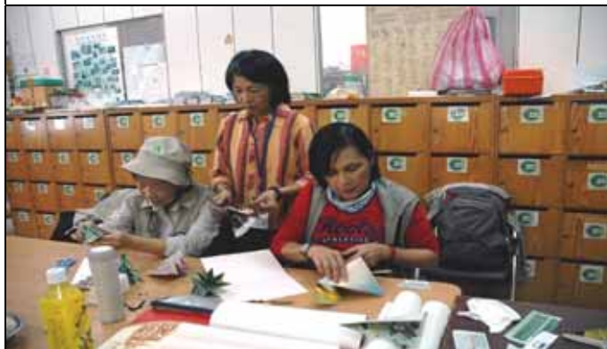
聖誕節快到了，開始學做摺紙聖誕樹！