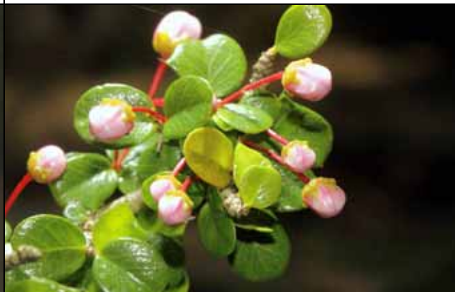
刺葉黃禱花花苞基部可清楚看見黃色油腺