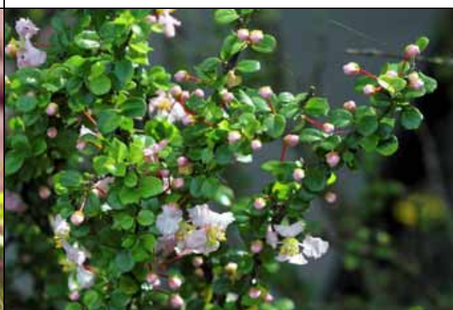
刺葉黃禱花花葉皆美，是很優良的園藝植物