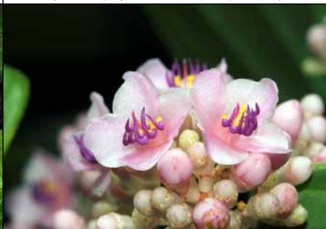
密花野牡丹藤花朵雄蕊具關節