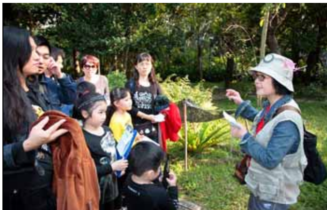
月明老師帶遊客逛園區認識各種造紙植物。