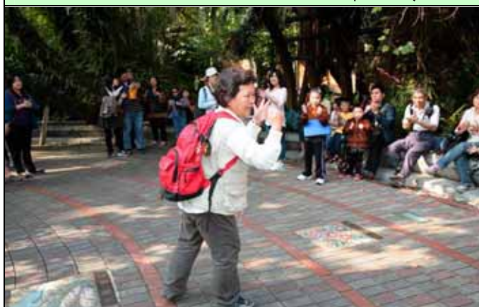
美香組長開場絕無冷場，保證氣氛強強滾！