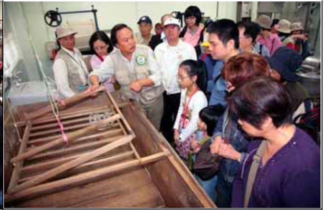
手抄紙很有趣，但也是非常費力的工作！