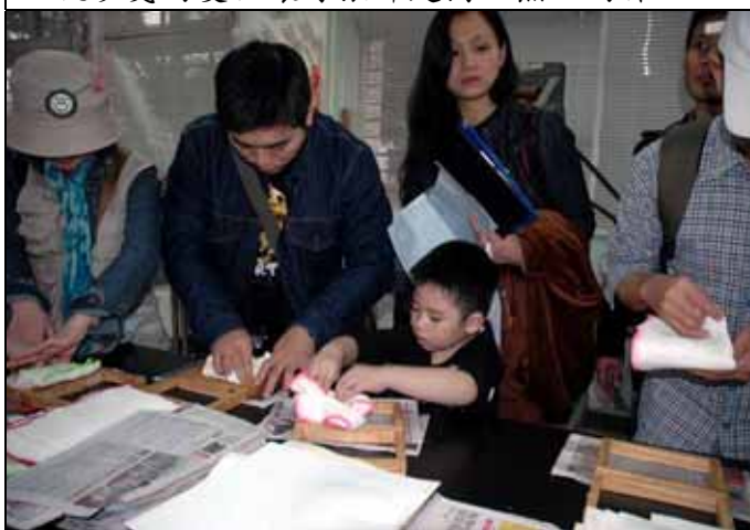
植物園的解說非常適合親子同樂。