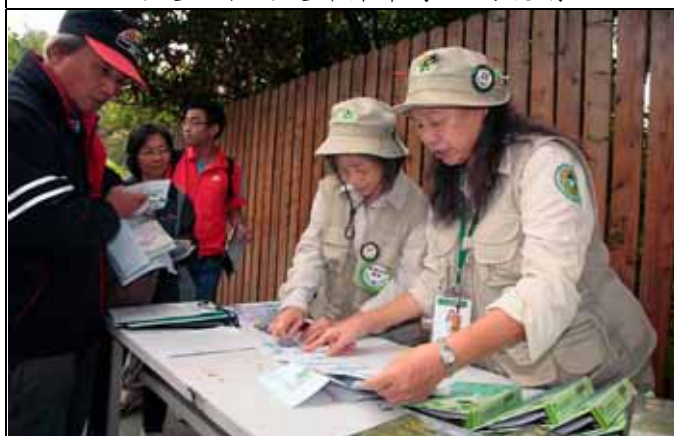
雪花、永芳老師負責下午的獎品發放！