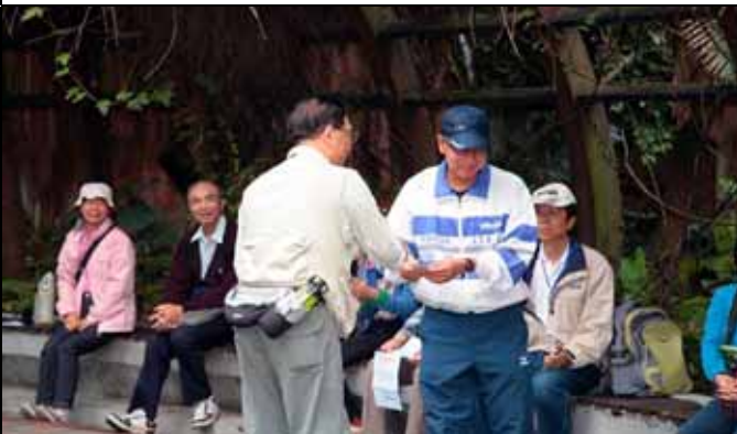
遊客中黃老師認得最多志工老師而得獎。