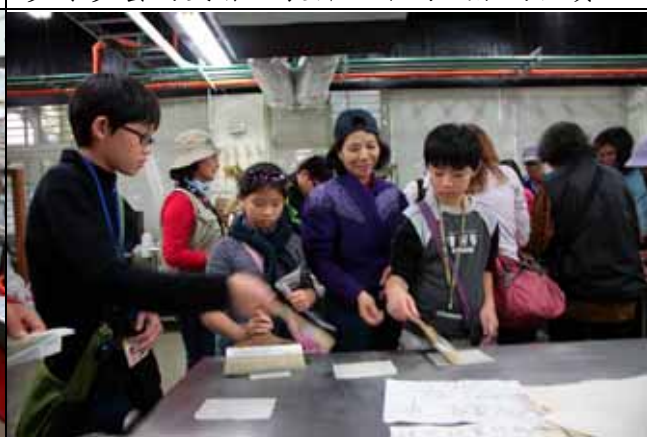
小朋友製作手抄紙有模有樣！