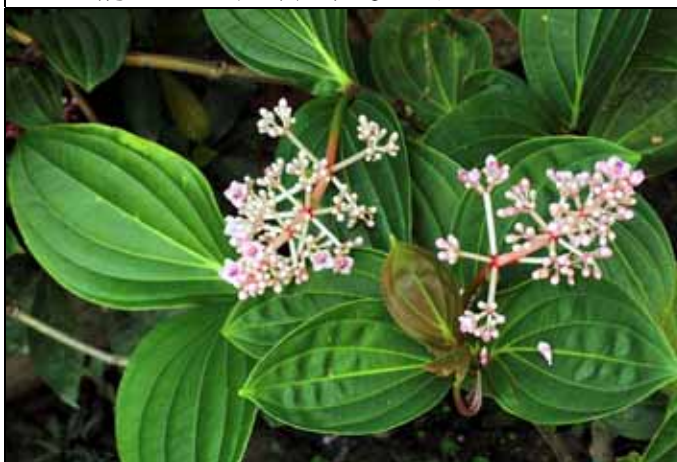
密花野牡丹藤花序大而豔麗