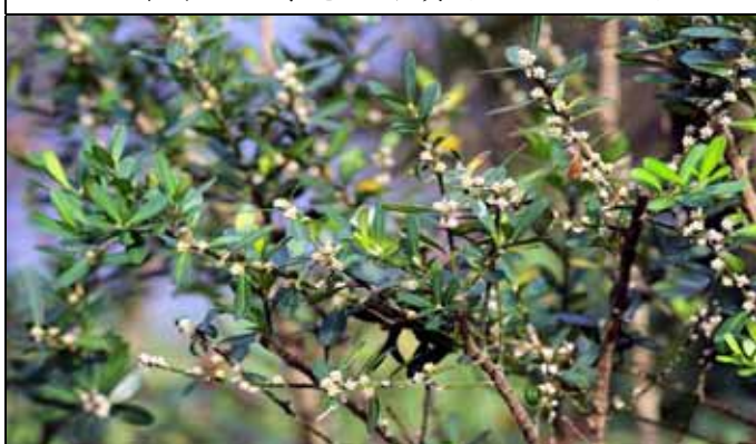
小葉黃楊花朵細小猶如白雪