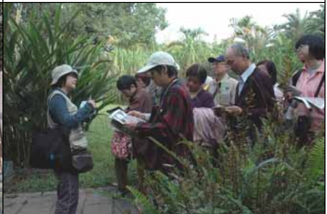
月明老師帶隊介紹各種造紙植物。