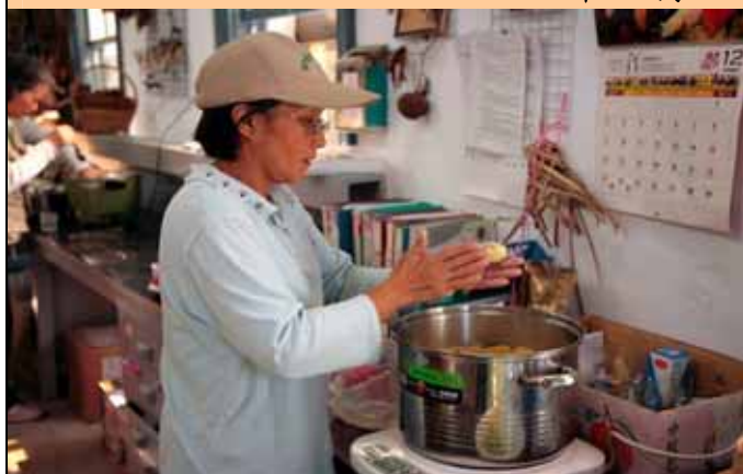
汪汪老師巧手製作湯圓替大家加餐飯。