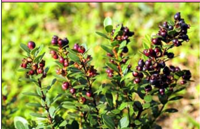
小葉赤楠紅紫色的果實令人垂涎欲滴