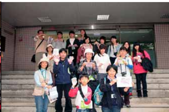
每張作品都是大家的心血