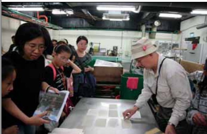
煥光老師也是紙張高手，協助遊客烘紙。