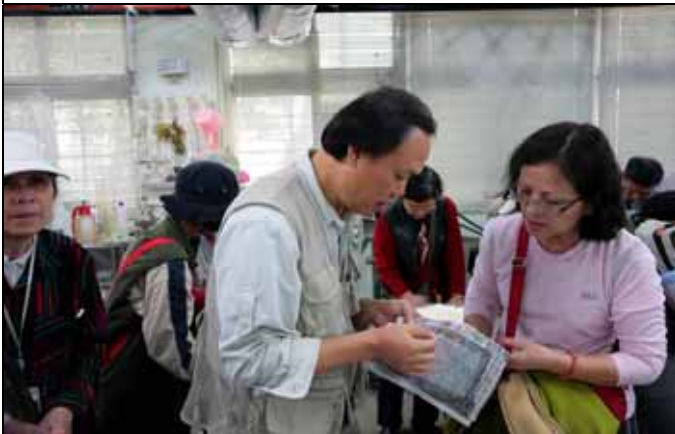
浪誠老師小心仔細的幫遊客調整紙張濕度。