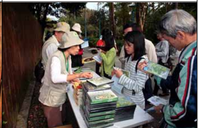
一年來除了知識上的收穫還有禮物可拿真好！