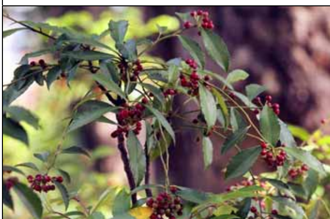
玉山紫金牛紅色果實吸引鳥類吃食