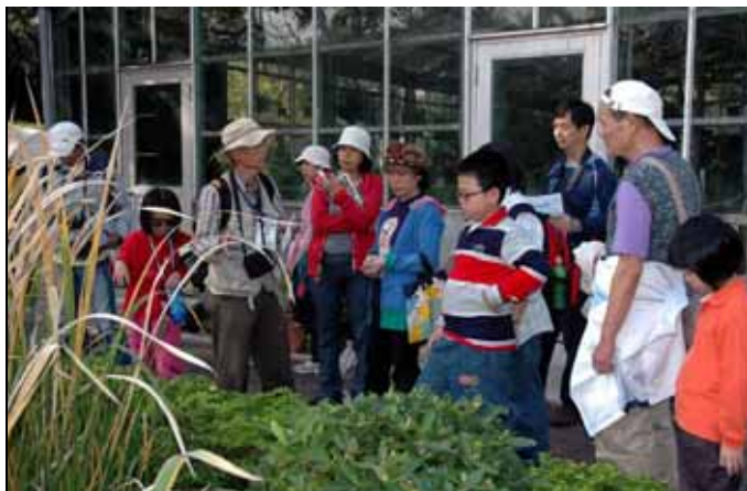
茭白筍殼也是非常重要的造紙原料唷！