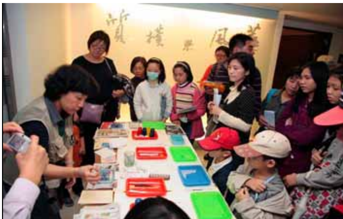
流沙箋的變化讓每張都是獨一無二的作品