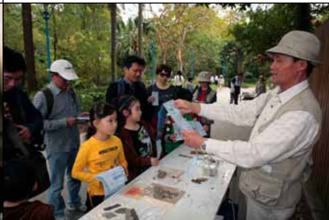
福和老師讓遊客思考學習單內有趣的問題。