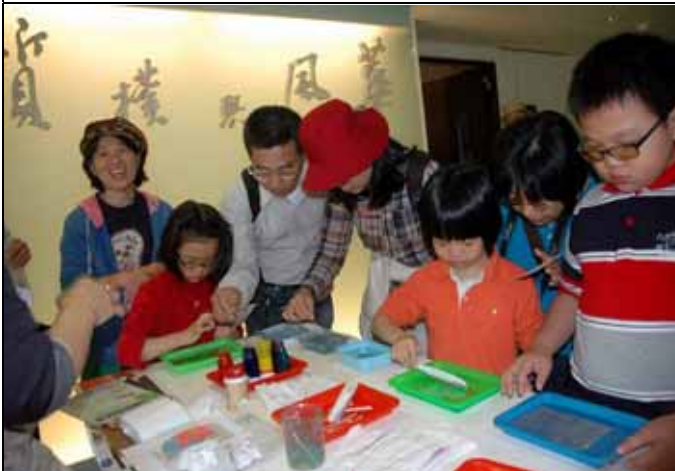
大家聚精會神專注於流沙箋的製作