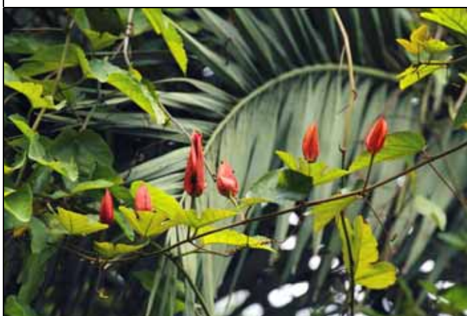
葡萄葉西番蓮花苞上有蜜腺吸引螞蟻當保鏢