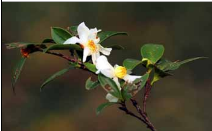
油茶在冬季開出滿樹白花