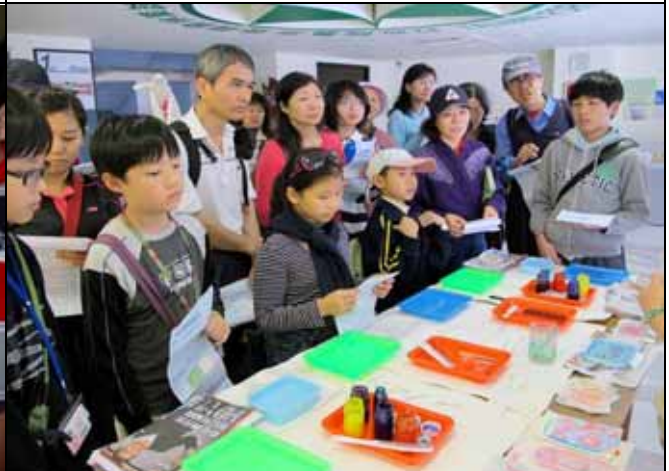
為了解說工作，志工老師得準備許多道具！