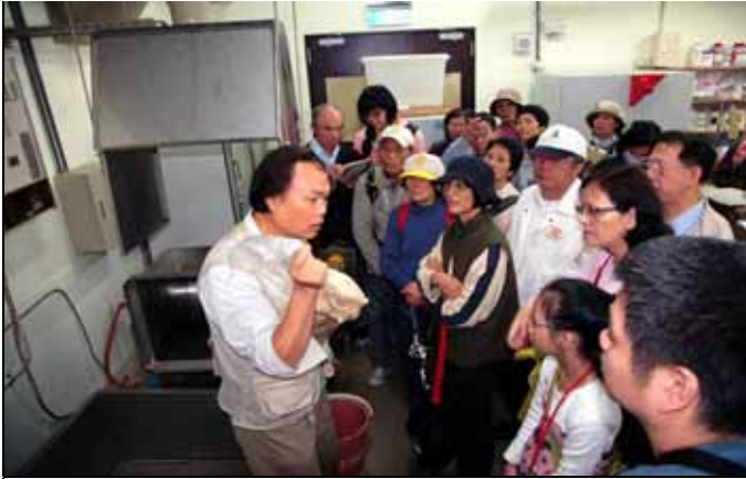
浪誠老師介紹解纖後的造紙原料。