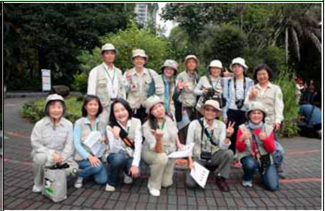
又是一個快樂服勤的日子，看到大家真高興！