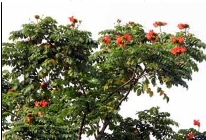
豔麗的火焰木開花永遠吸引遊客的目光