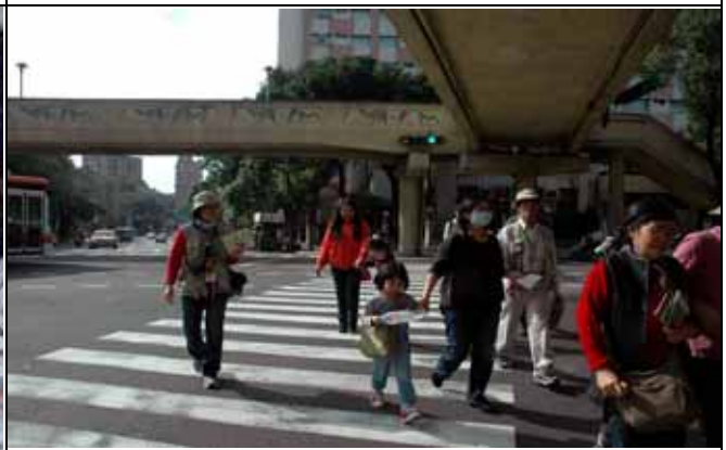
不方便爬樓梯的遊客，大家要小心過馬路唷！