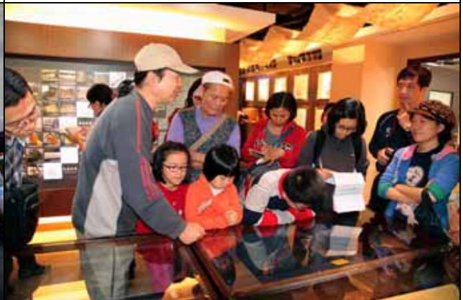
明禮老師講解各種不同紙張的用途！