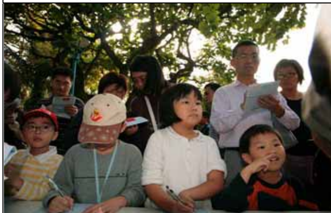
大朋友、小朋友都非常專注的聽講！