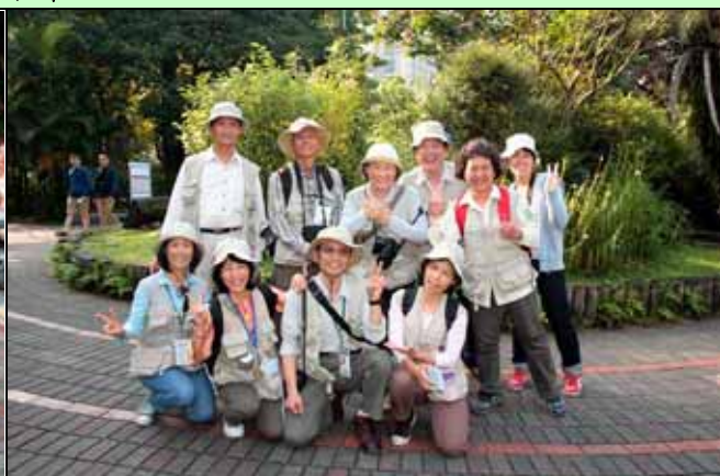
下午值勤老師快樂的合影紀念！