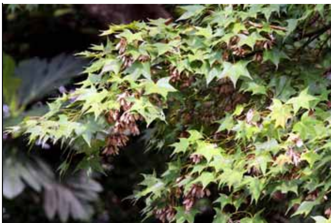
青楓的翅果已經成熟，準備脫離母體