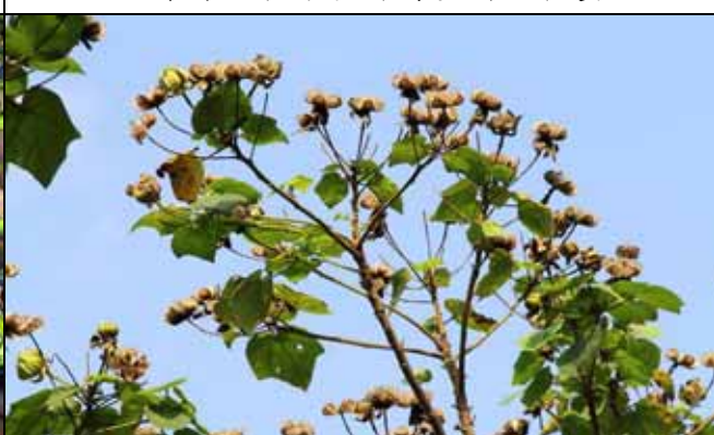
山芙蓉的果實部分已經成熟開裂