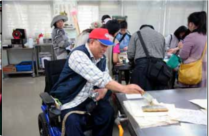
雖然行動不便，但求知慾望永遠不變。