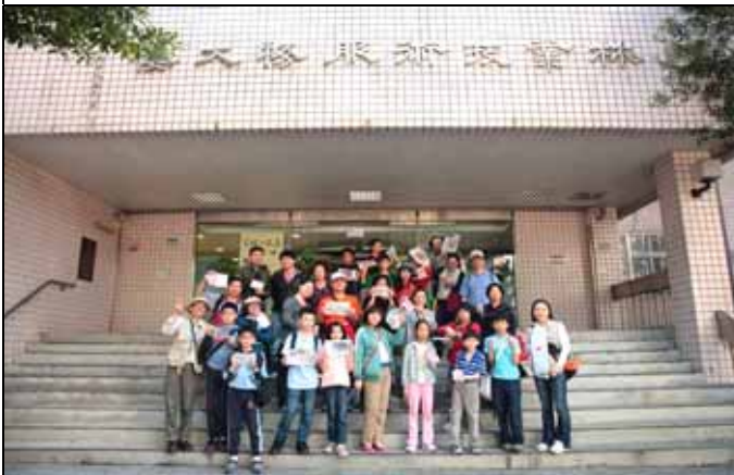
開心吧！大家一起展示自己的得意作品！