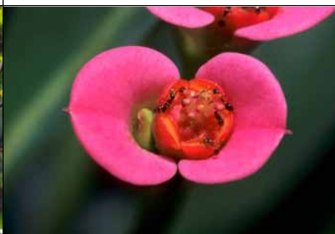
螞蟻在麒麟花蜜腺上尋找花蜜