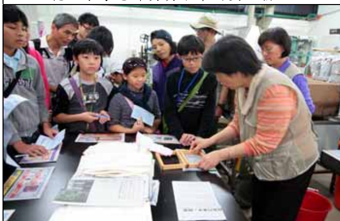
大家操作迷你版的手抄紙！