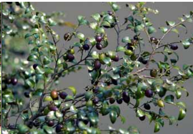
原生植物區楓港柿的紫黑色果實成熟