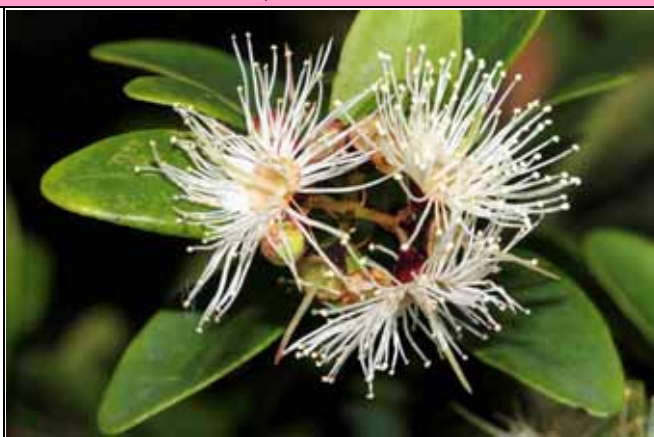
小葉赤楠花朵基部有豐富的花蜜