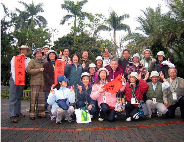
兔年開春行大運，大家合照添喜氣