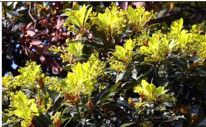
樟科植物區豬腳楠嫩綠的新芽與花穗