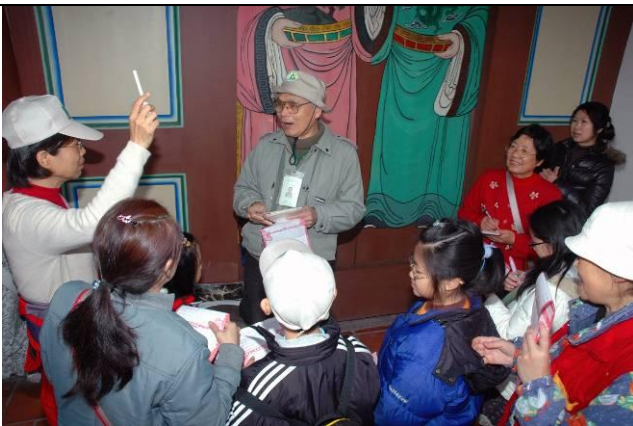
游老師負責駐站解說，小玲老師從旁協助，遊客答對題目有獎品