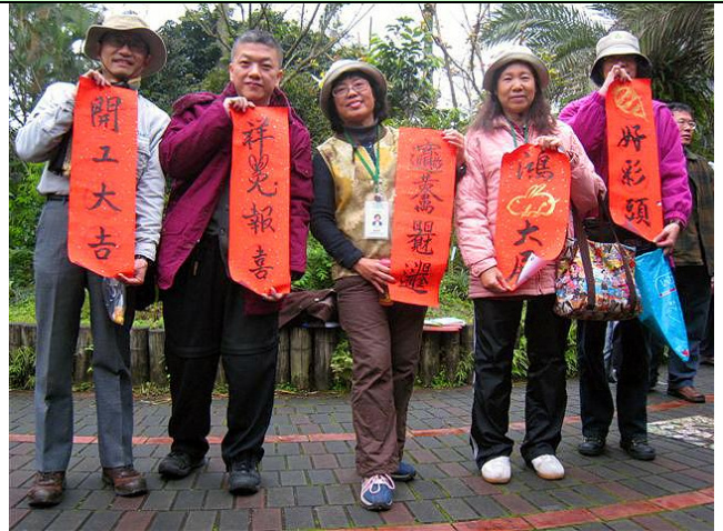
新年新希望！先來個春聯大展。 祝大家新的一年都能喜氣洋洋