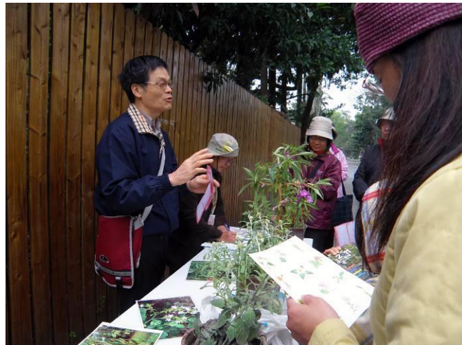
柏園老師講解十二生肖植物的源由及植物特徵