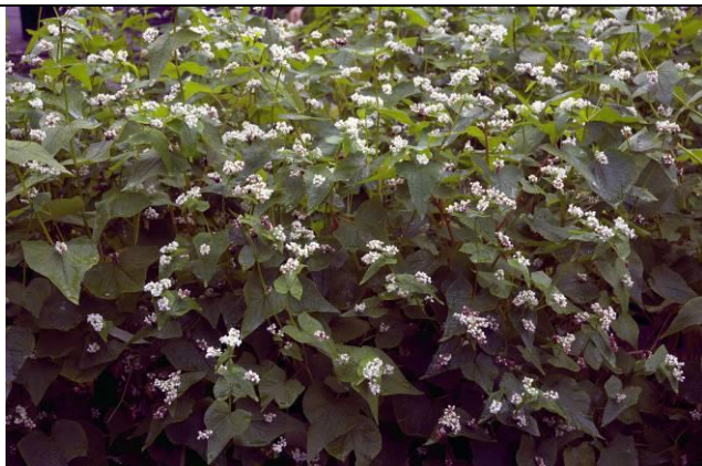
民生植物區 蕎麥開花結果，有機會帶蕎麥麵與大家分享