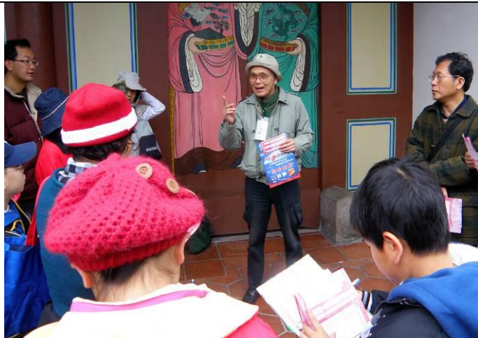
游老師負責第二站的解說， 樂於與遊客分享，講解生動又有趣味