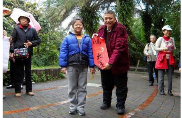
很像兔子的可愛小朋友，祝你今年鴻兔大展！