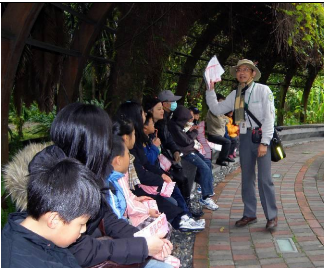
金敏老師講解今天的主題， 讓遊客即早進入狀況