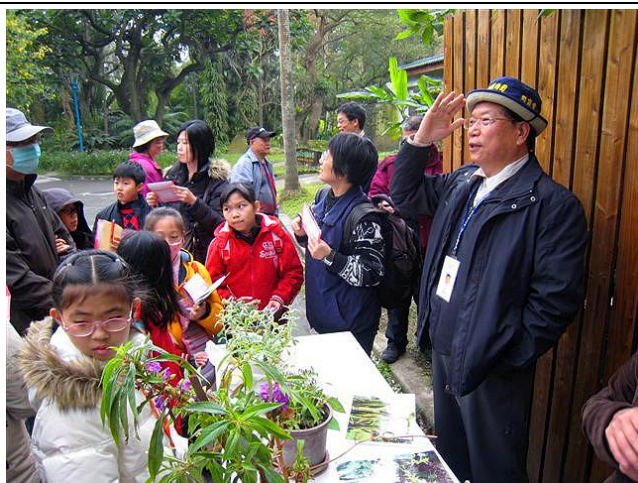
周團長學識淵博，侃侃而談， 自信與風度是解說人員的典範