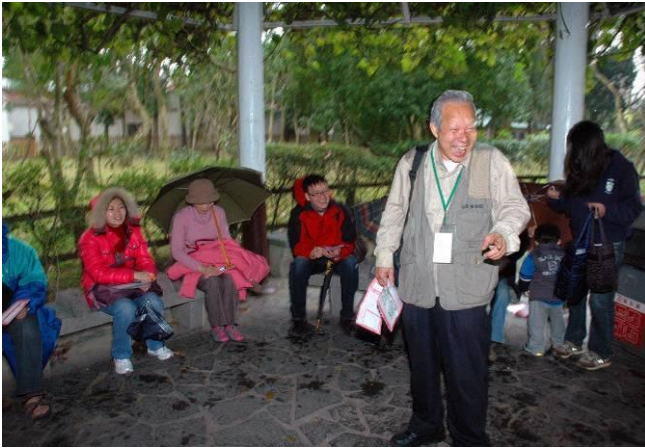
忠雄老師永遠精神抖擻，風趣幽默，生活經驗豐富，最能讓遊客笑開懷