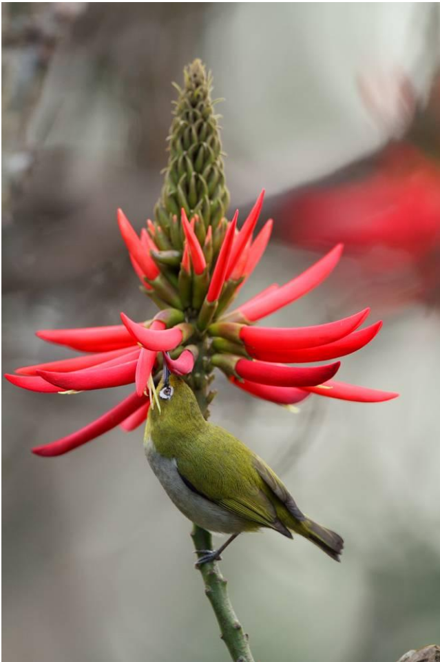
往延平南路側門邊的火炬刺桐 是綠繡眼的最愛