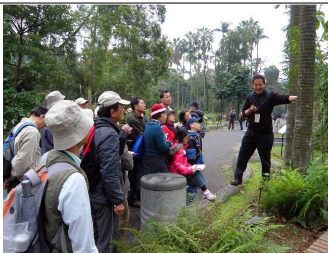
棕櫚樹樹幹上為何有一圈一圈的環紋， 待我華光老師解說分明