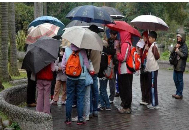
黔靈老師帶隊，冒著風雨， 認真又賣力為遊客解說