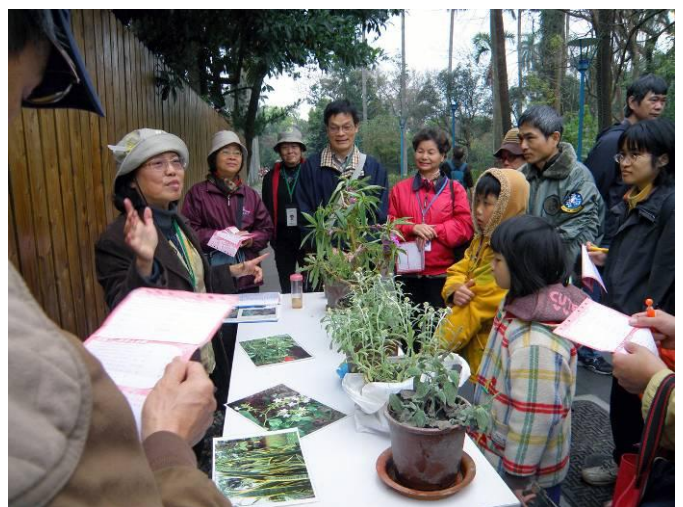
麗華老師負責第一站，妙語如珠， 雖然寒流報到，大家聽的是如沐春風