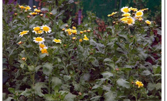
民生植物區茼蒿不只可食用，也是美麗的觀賞花卉