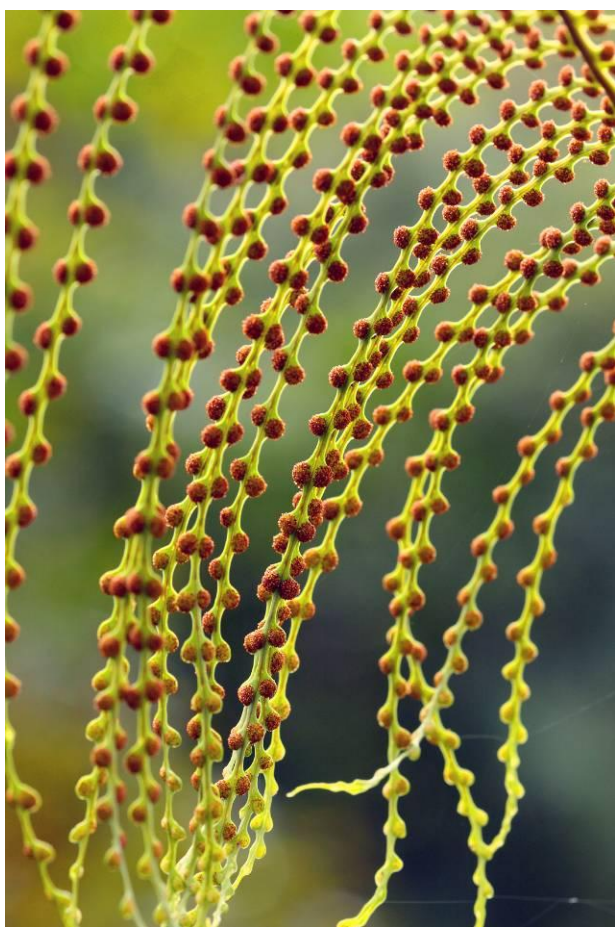
連珠蕨孢子囊群的葉片 像不像隨風搖曳的珠簾