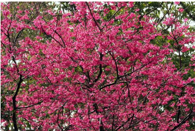
保育大樓大門旁的山櫻花正在盛開，紅豔動人