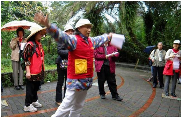
來！看小玲老師這個姿勢， 猜猜看這是什麼字！