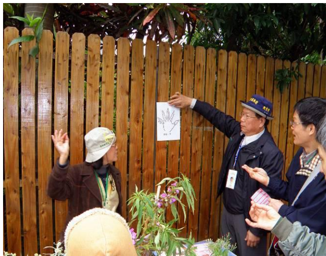
掐指一算，天干地支盡在掌中