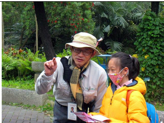
金敏老師與小朋友分享十二生肖植物的心得