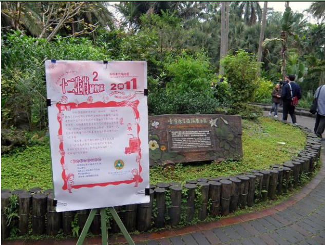
一元復始，萬象更新！上午九點， 志工導覽準時開張，迎接新一年的遊客