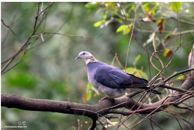
志工室前方大樹上停棲的灰林鴿，感謝 SHEN R-S 先生 提供相片