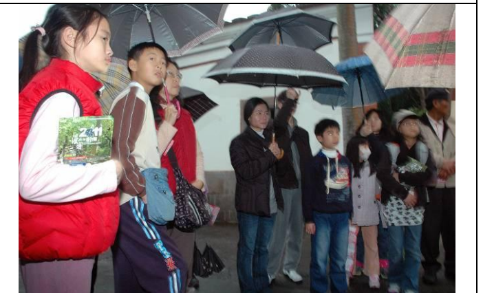
寒流冷冽、下雨都趕不走遊客熱烈的參與！下午一點就有遊客冒雨在廣場啃麵包等待，實在令人感動