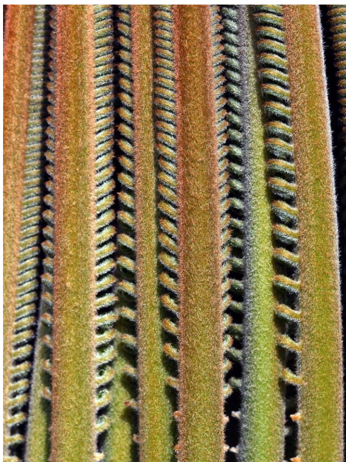
猜猜看這是哪一種植物美麗的新葉， 答案下回分解.....