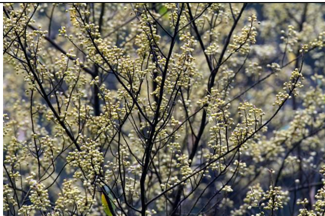
現在是馬告（山胡椒）的開花期，滿樹黃花，北橫沿線是欣賞的好地點（攝於大雪山）