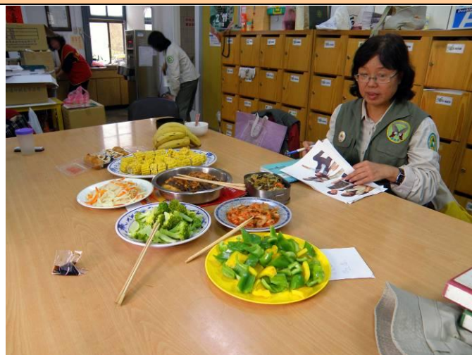
那盤青椒看起來真漂亮，等下要多吃兩口