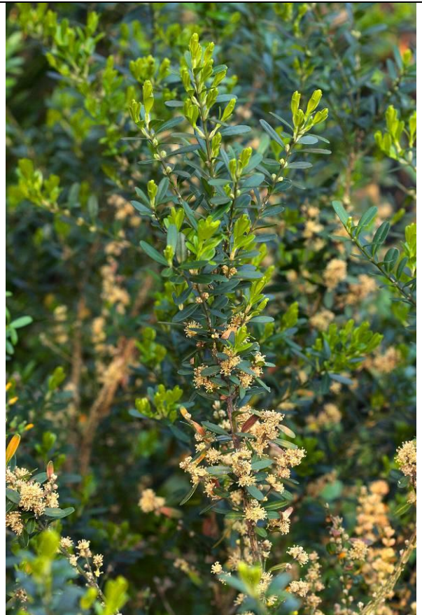
當成綠籬的雀舌黃楊花期也近尾聲，有空可到志工室旁觀賞