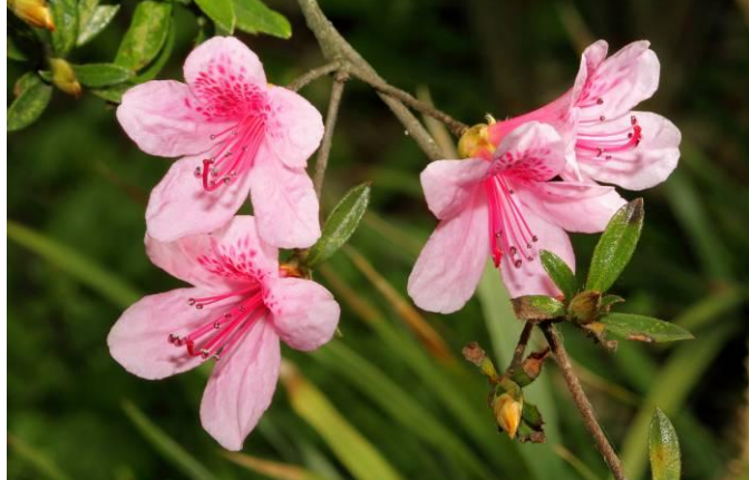
行政大樓對面稀有保育植物烏來杜鵑現在正盛開