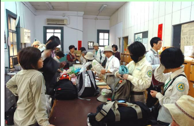
準備出發！志工室忙碌的一天要開始了