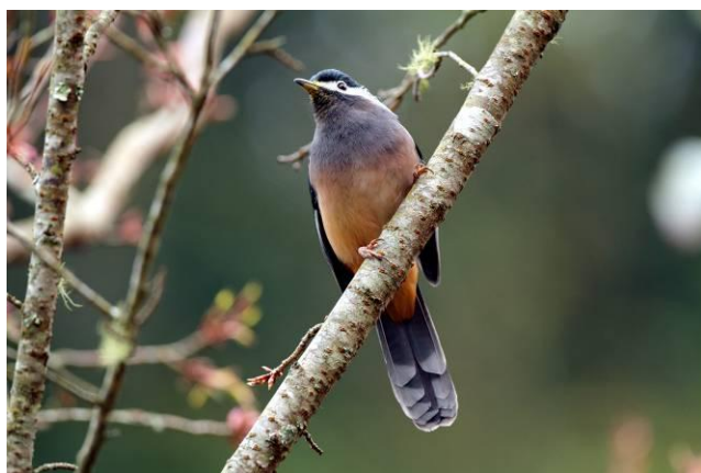
植物園中怎會進駐一隻白耳畫眉，是否為籠中逸鳥？