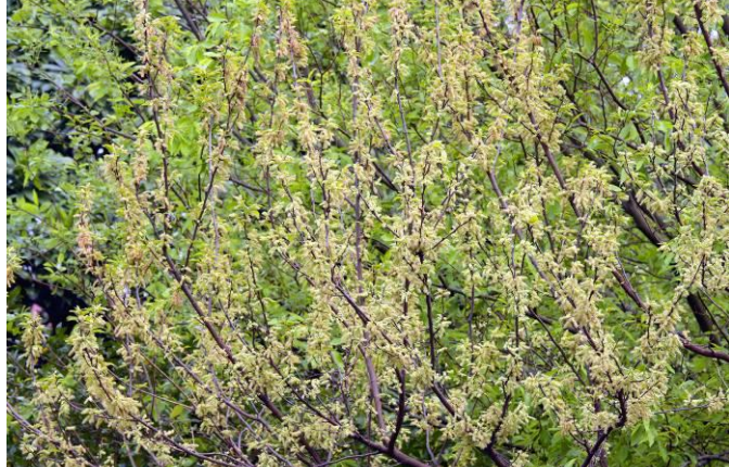
雖是乍暖還寒時，小葉桑已迫不及待開出滿樹花朵