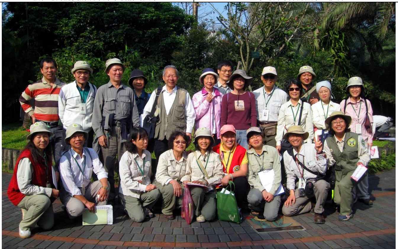
難得天氣轉晴，大夥先來個大合照，每個人都心情愉悅！快樂的志工團隊