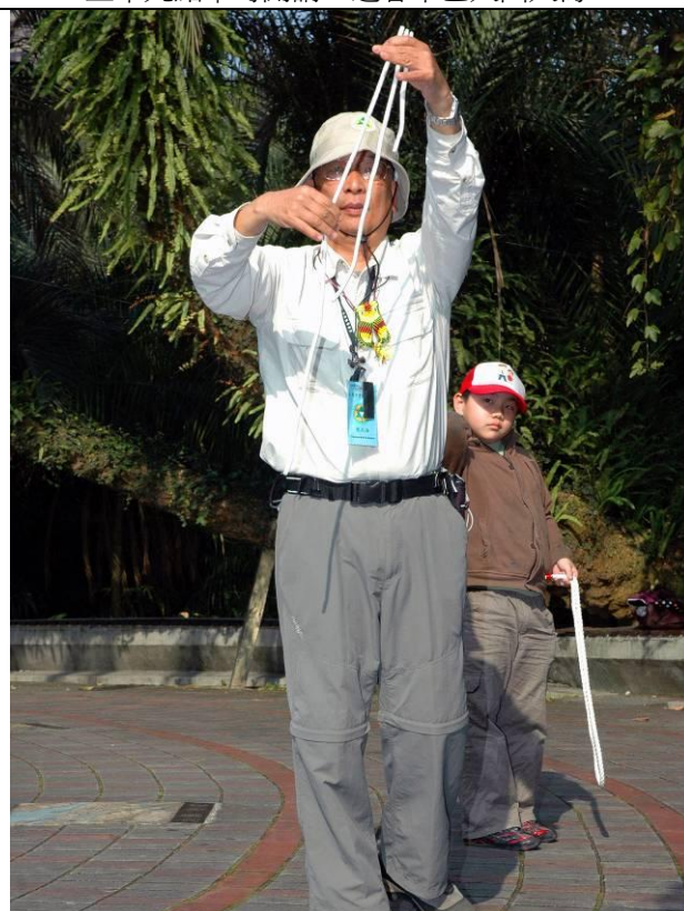
南海老師開場，使出渾身解數，舞出十八般武藝，遊客也報以熱烈的掌聲，或許太陽劇團會邀請南海老師擔綱表演！