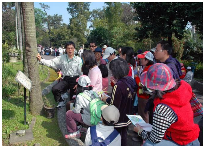
帶隊的柏園老師認真解說 12 生肖植物的特徵