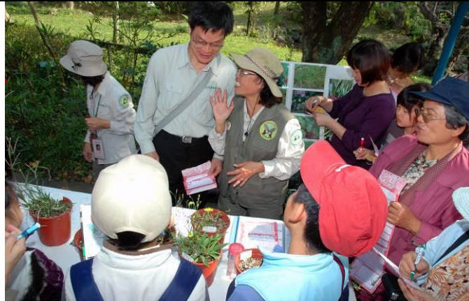
連續篇 2-4：柏園老師幫幫忙啦！