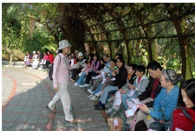
仰恩老師：12 生肖童謠請跟我用國語念一遍，包你唸完 口齒清晰，講話輪轉，中午多吃一碗飯