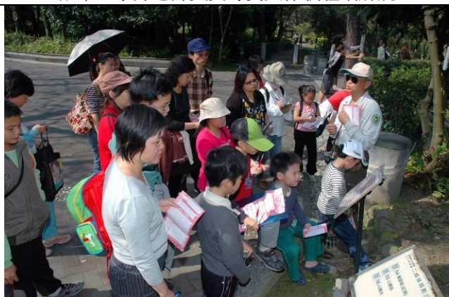
丁老師：你們知道山豬肉（植物名）一斤多少錢的笑話嗎？