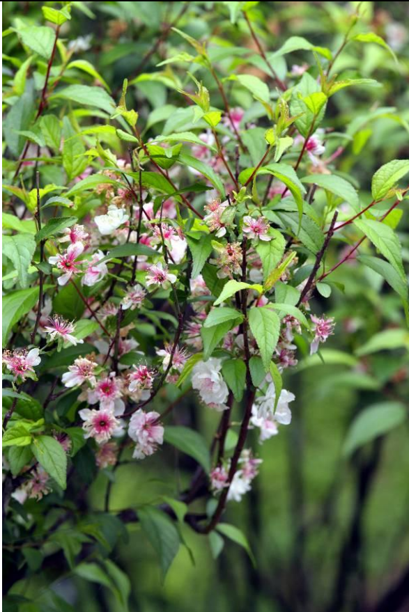
行政大樓對面翠梅也在盛開，花期不長，要欣賞請早