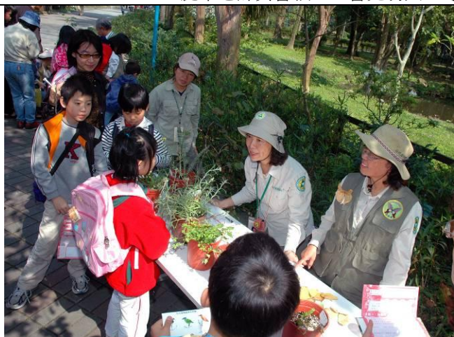
淑華老師：這位小朋友實在太厲害了！一定要發獎品