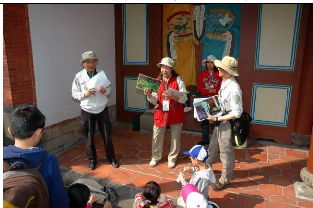
游老師、永芳老師共同講解 12 生肖的由來