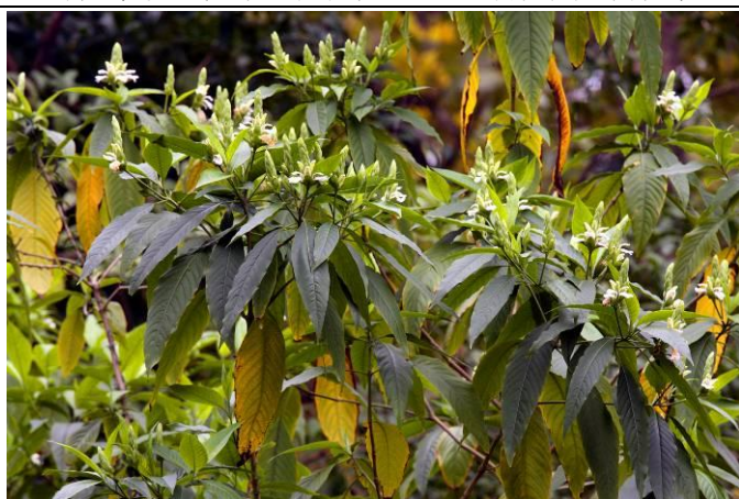
您有注意到志工室對面爵床科的白珊瑚開花？