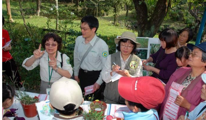
連續篇 4-4：大師出馬果然迎刃而解；植物園志工真的臥虎藏龍，人才濟濟！