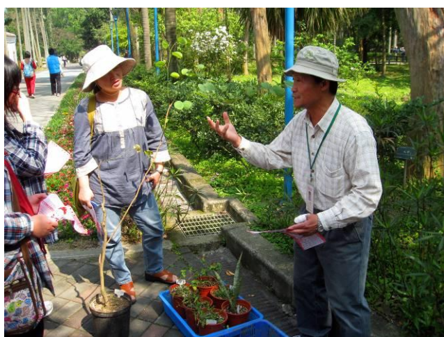
福和老師認真解說羊蹄甲名稱的由來