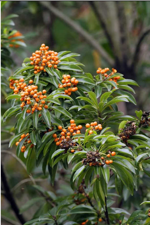
台灣海桐果實雖已到末期，但仍吸引不少鳥類前來取食