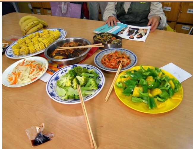
中午的菜色多樣又營養豐富，可惜留下吃飯的人不多