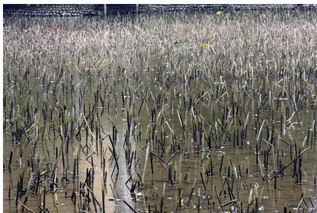
荷花池荷花枯梗別有一番風味