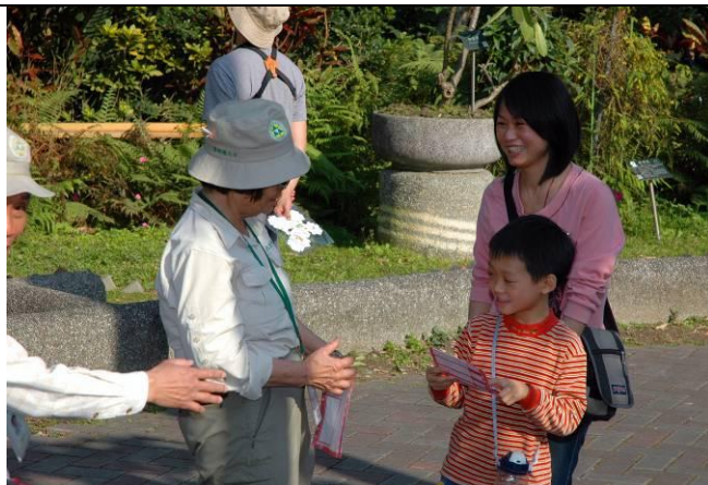
姿琇老師：這位小朋友的植物分享實在太精彩了！