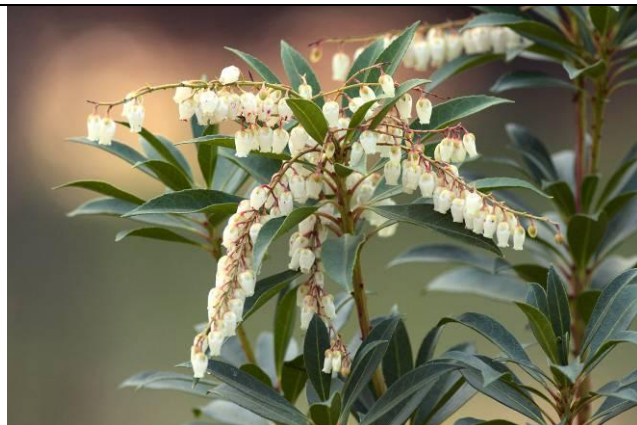
十二生肖區原生中海拔地區的馬醉木難得開花（陽明山區常見）