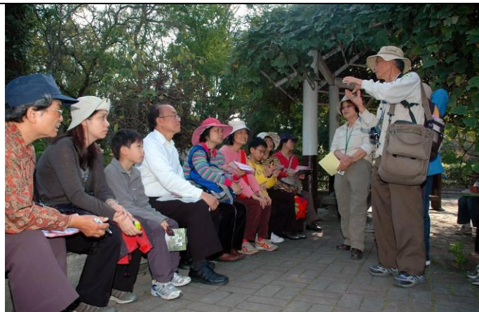
日將西沈，文俊老師仍不忘與遊客分享植物保育的觀念