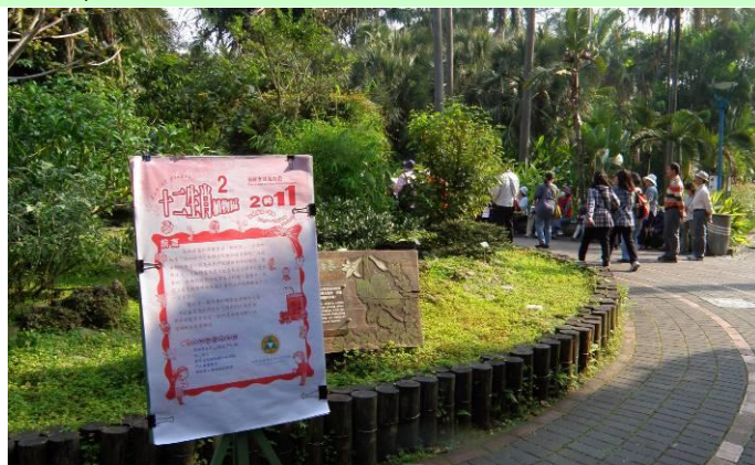
上午九點準時開講，遊客早已人山人海。