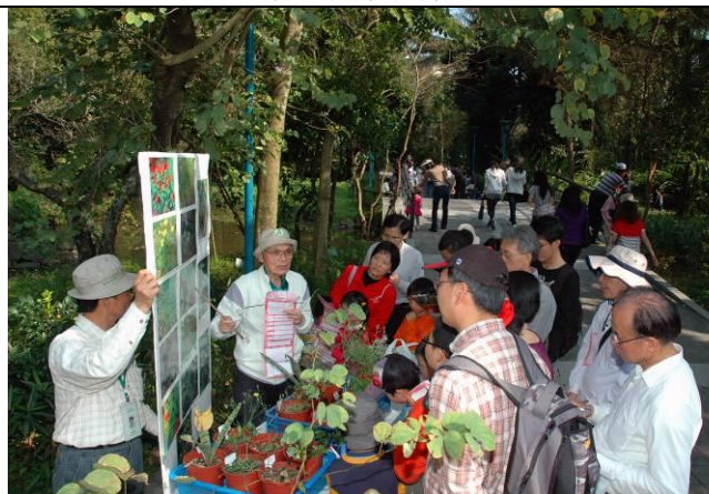
游老師值勤超認真，絕不馬虎，每一種植物都詳細解說