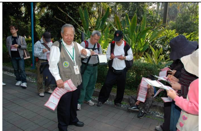
忠雄老師字字珠璣，遊客連忙抄下妙語