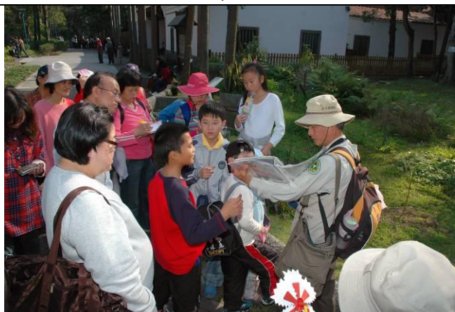
文俊老師總是會帶著私人圖片講義隨時機會教育