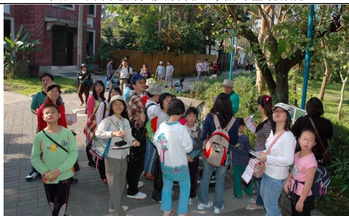
天外飛來的不明物體？原來大家在看搔癢樹（九芎）