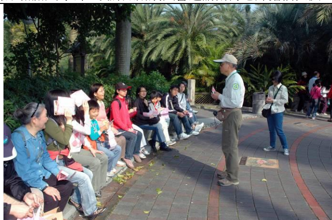
丁老師：你們知道台灣第一個動物園在哪裡？就在我們台 北植物園。遊客：真的嗎？那植物不是被吃光了？