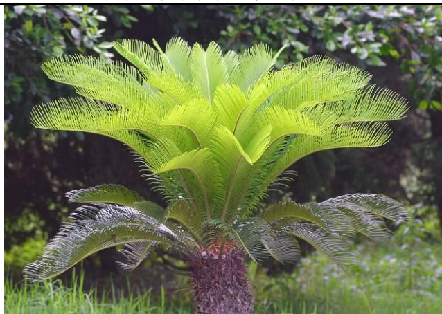
上期問題的解答是蘇鐵的新葉，不知您猜對了沒？