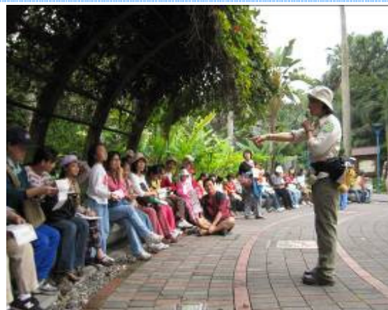
那位勇於發言的小孩...最可愛