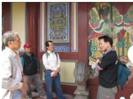
華光老師您可要常來!您看粉絲這麼多!