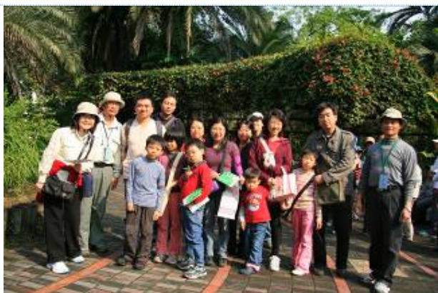
月明 福和老師一日之計在於晨..早起的鳥兒有虫吃