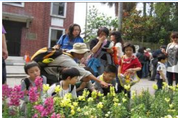
植物的莖有支持作用