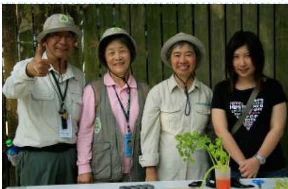
南海老師說:雪花寶莖讚! 膚色氣質不輸小美女