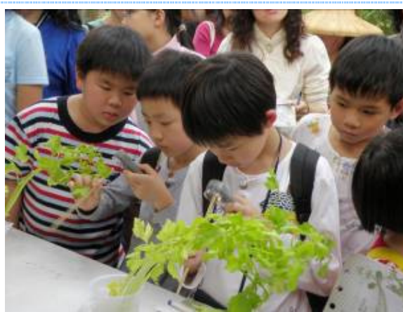
內行的看門道，外行看熱鬧