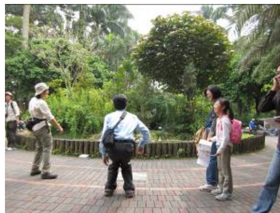
热情的家長!謝謝您的犧牲參與!