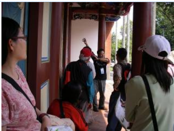
累了嗎?還是躲太陽?