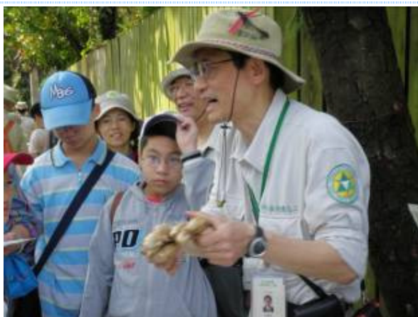
薑地下莖，分離出的生薑醇和薑烯酚，有止吐效應