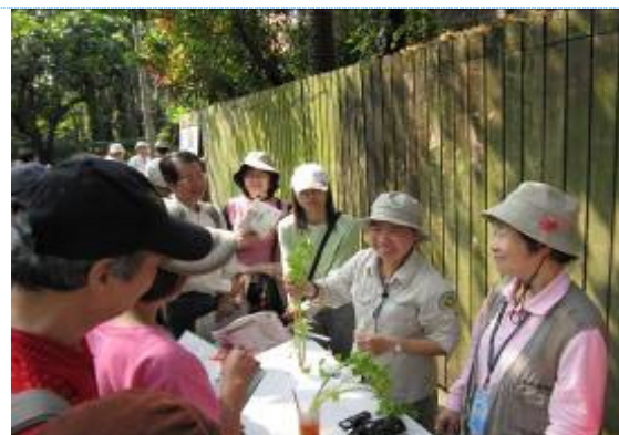
芥菜妙用~炒花枝、加入貢丸湯、葉子可炒蛋及實驗