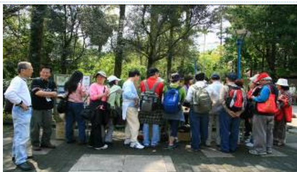
就是這一攤,讓華光老師帶隊結束後高歌一曲