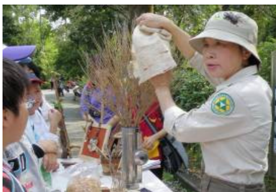
看我變……. 美麗是真的哦!