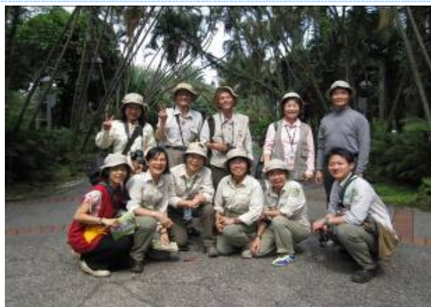
犧牲午休!好學不倦的老師們