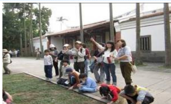
文俊老師說:用側枝萌發的植物會斜長