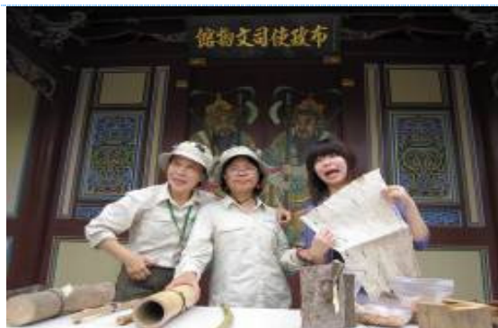
在古蹟門前擺攤…羨慕吧!