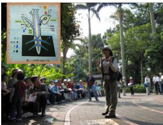
老師在講有沒聽丫! 植物的莖像高速公路貫穿葉與根, 傳送養份與水份...