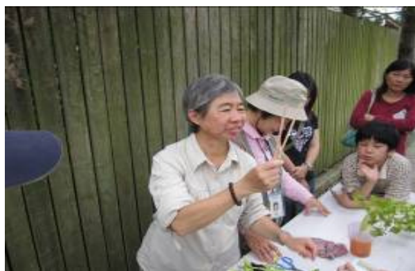
愛地球別用免洗筷! 是要你們看莖的輸送作用啦!