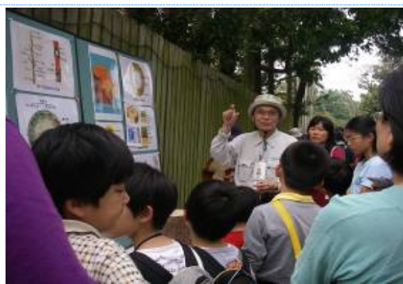
莖裡有許多小猴子..您知道嗎?