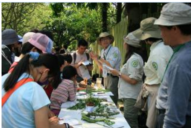
金敏老師現在有童軍椅了,不用蹲了!