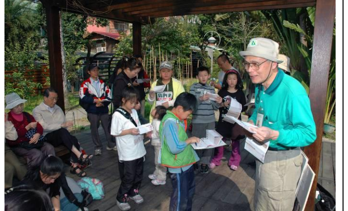
游老師：小朋友年紀小小就知道用花瓣數目分類，來日不可限量