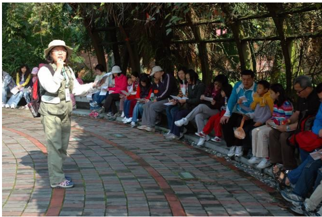
麗華老師開場，創意的用打魚歌帶出今天的主題（青蟲、蝴蝶、還有自捏麻薯…）