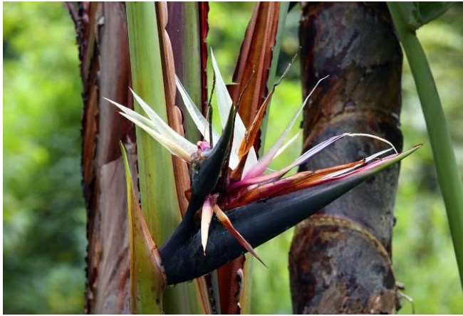
棕櫚科植物區旅人蕉正在開花，您知道旅人蕉名稱的由來嗎？