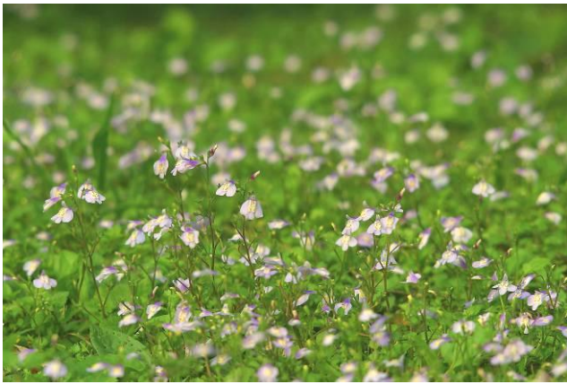
在志工室前方的草地上，通泉草正在盛開，大家觀察植物時可別忽略這種漂亮的野花