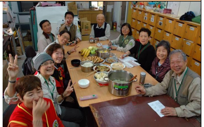
開動前，伙伴們其樂融融來張合照