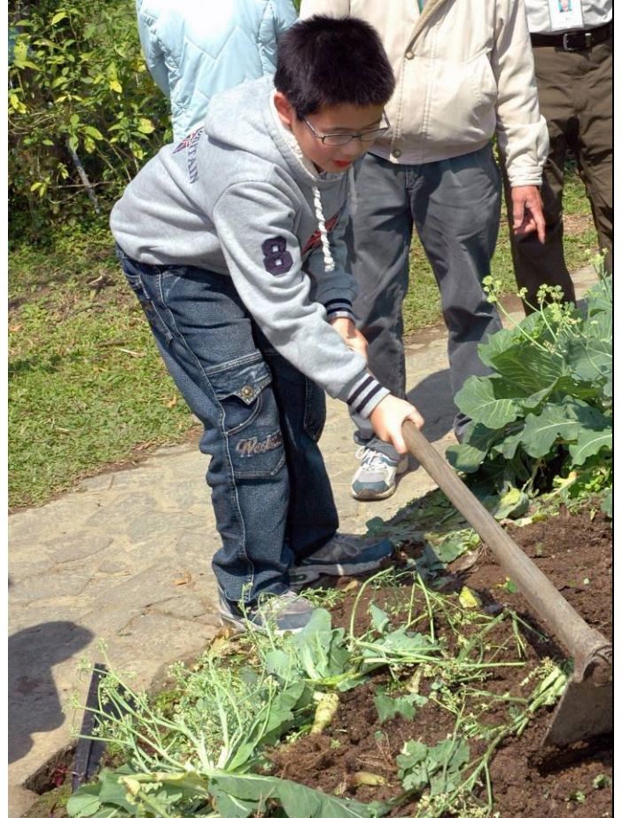
大朋友、小朋友大家一起來享受一下親自拿鋤頭，動手種植物的樂趣