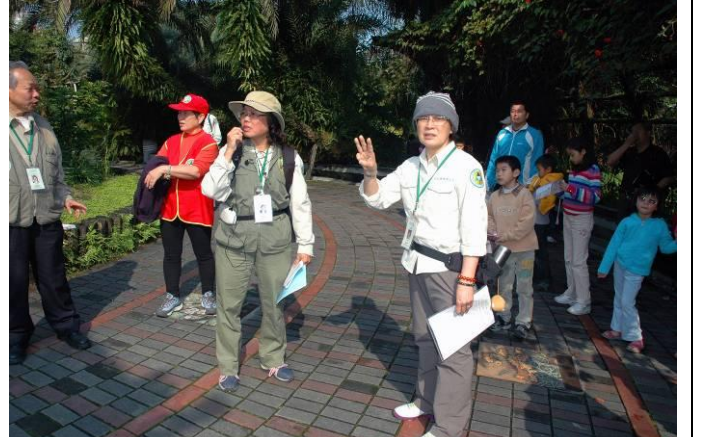
素華老師今天值星，正在跟麗華老師傷腦筋如何分組