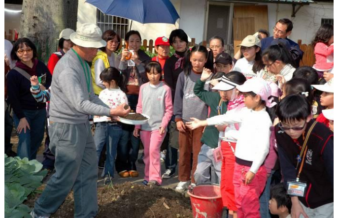
連續篇 2-4 好！我來試試！終於小朋友伸出手來了