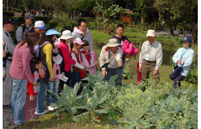
福和老師：你看花瓣的形狀就知道為何叫十字花科