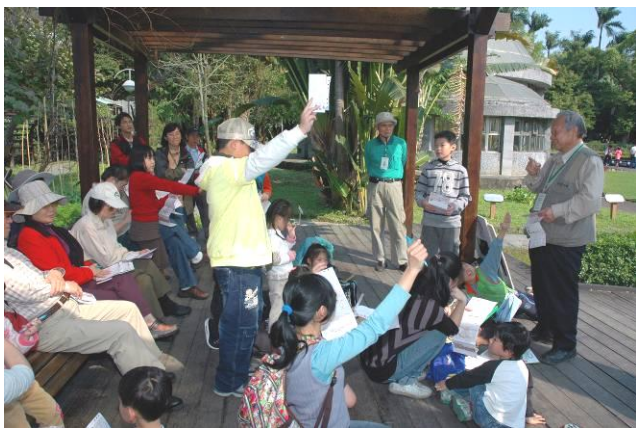
忠雄老師：誰是賓果王請舉手