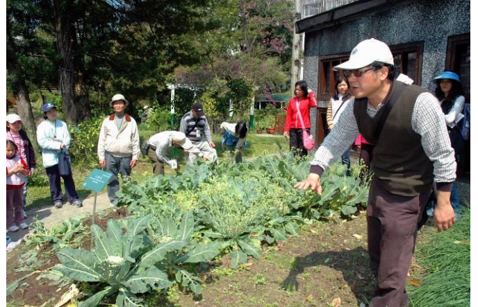
瑞明老師以自身經驗介紹耕作時整地栽培的手續