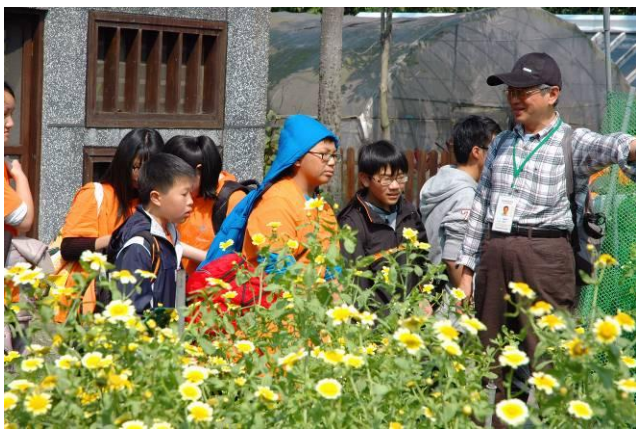
國明老師：你們一定吃過蘆筍，但你們看過蘆筍生長的模樣嗎？