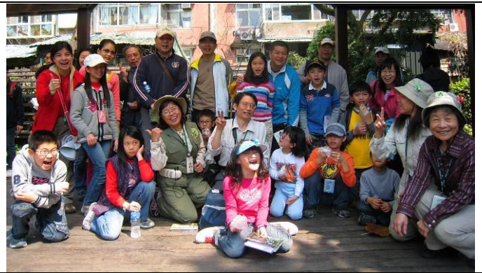
每位遊客都吃到自己親手捏的麻薯，快樂的跟志工老師們合照