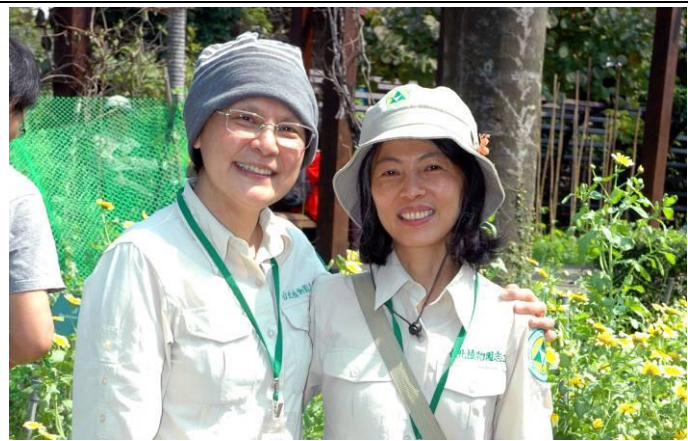
素華、維英兩位前後任組長，歷經人生的磨難後能重新歸隊，相擁合照，真是得來不易的幸福