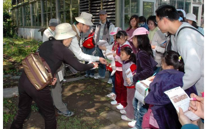
家蔚、黔靈老師：給小朋友看一看葉菜類的大害蟲-青蟲（紋白蝶的幼蟲）的模樣