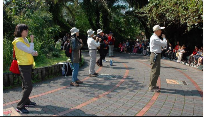
丁老師介紹各種民生植物的及賓果遊戲流程