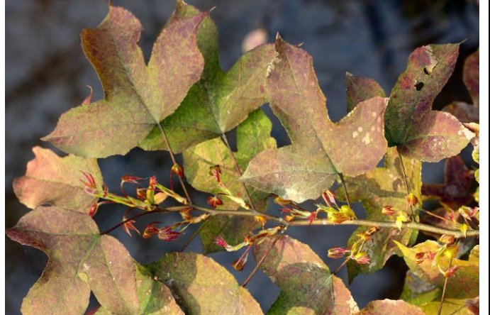
湖岸邊的楓香正長出黃紅色的美麗新葉