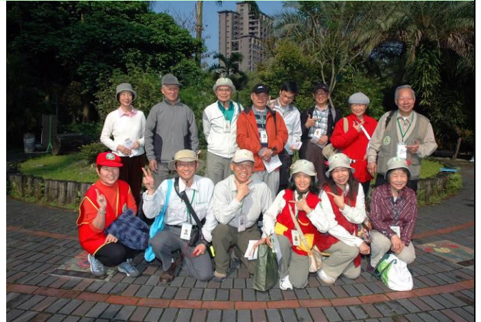
上午出席志工開工前擺出最棒的姿勢快樂合照