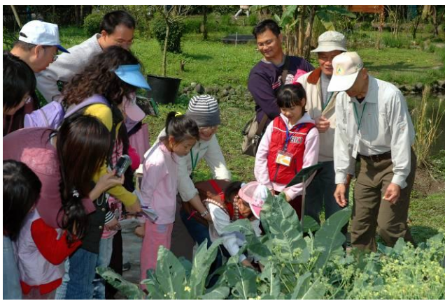
素華老師：你是在拔人還是在拔蘿蔔！？