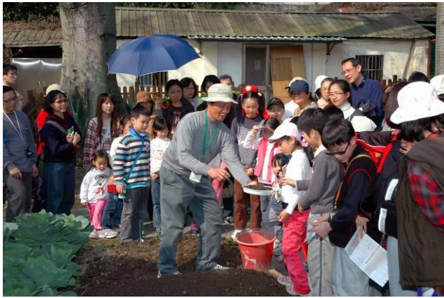
連續篇 1-4 福和老師：小朋友要不要親手試試灑播種子（小朋友遲疑中）