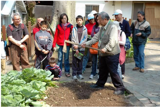
忠雄老師每天都笑口常開，精神抖擻，還親自下田示範鋤頭的操作方法，令人羨慕