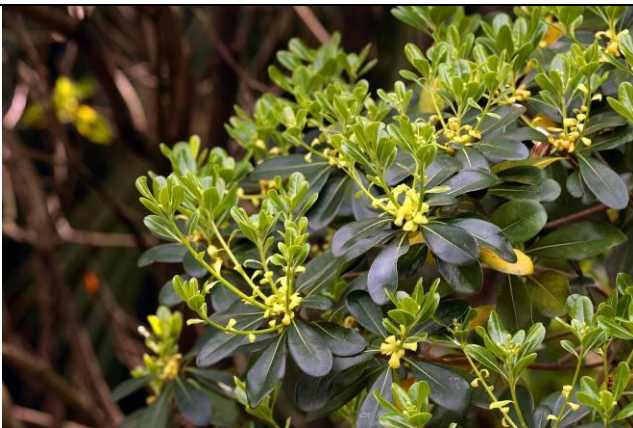
海桐的新葉與花苞