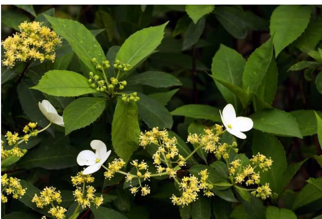
欖仁廣場邊狹瓣八仙花是觀察不孕性花的好材料