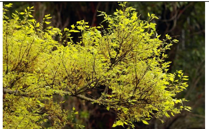
朴樹剛發的新芽與花穗讓整棵樹變成金黃色