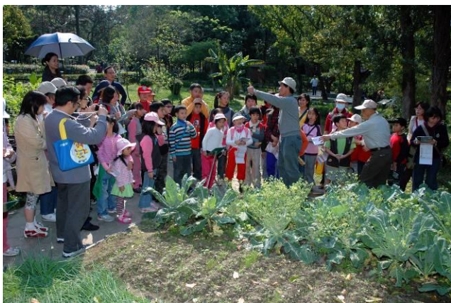
福和老師駐站介紹十字花科蔬菜