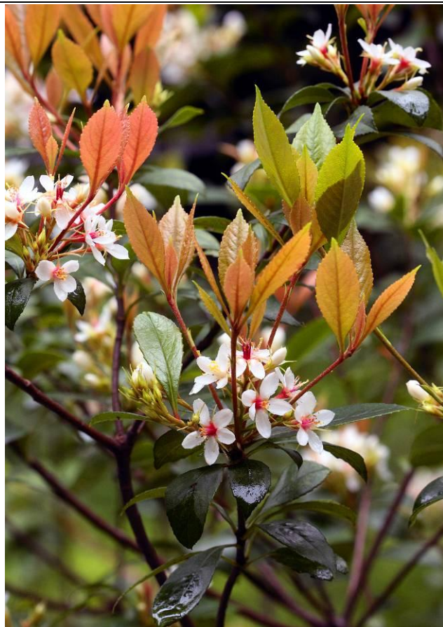
石斑木現在是盛花期，新葉與花朵真是美麗