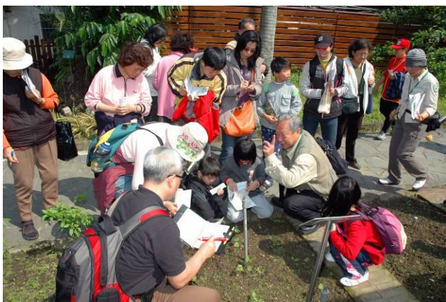
忠雄老師：你們來看看豆類的三出複葉是什麼模樣