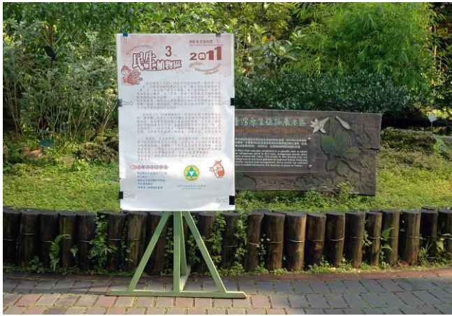
上午 9 點，民生植物準時開講