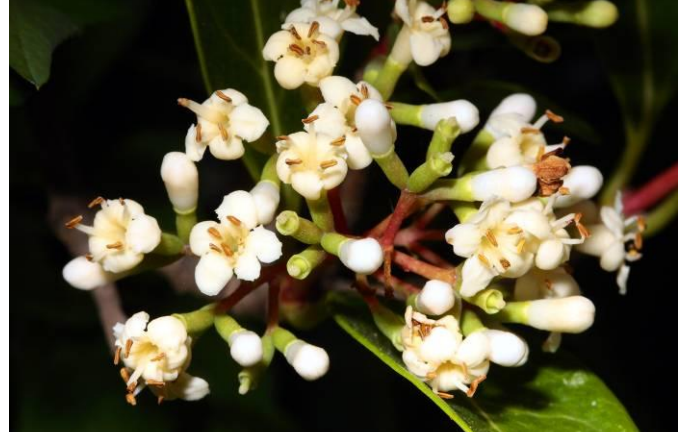
種植在蕨類植物區旁邊的珊瑚樹小雖小，卻已開花結果