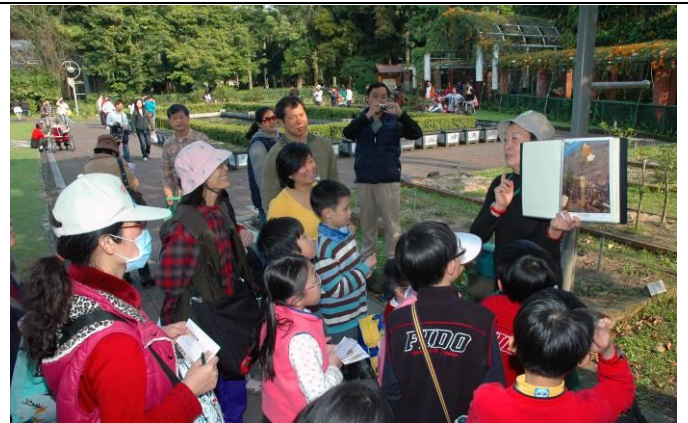
黔靈老師介紹用果實套帶來防制病蟲害