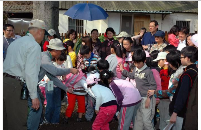
連續篇 4-4 小朋友們玩得不亦樂乎，還有小朋友沒搶到而嚎啕大哭，可見吸引力超強