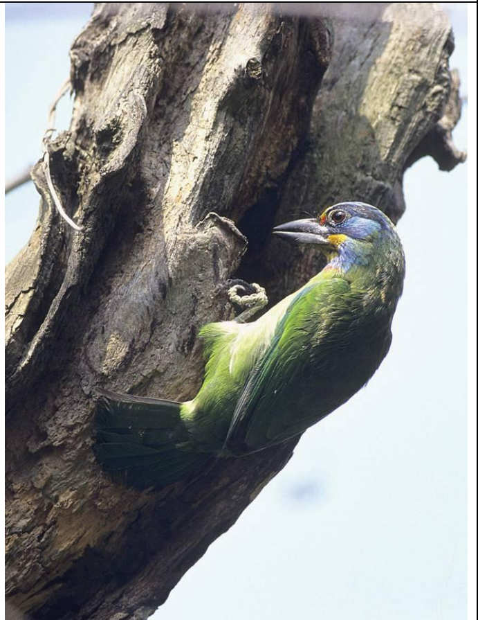
五色鳥是園區常客，已經開始求偶及尋覓適合築巢的枯木