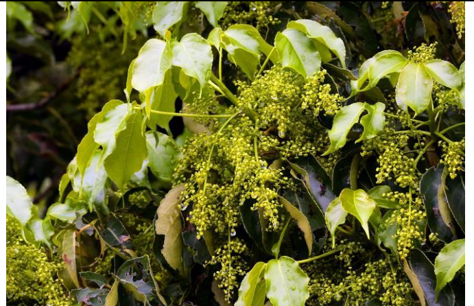
茄苳是雌雄異株的喬木，雄株開始開花，代表春天來了