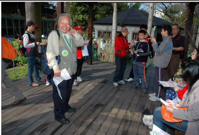
忠雄老師：哇！花生種在哪裡我好像不記得了