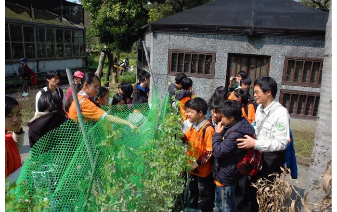
柏園老師：你們來觀察一下豌豆是如何能往上攀爬