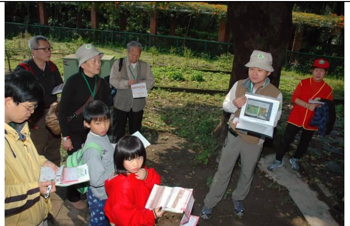
家蔚、黔靈老師介紹農業生態與有機農業