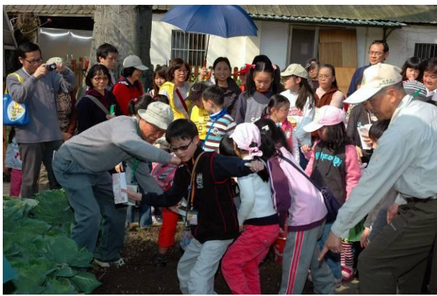
連續篇 3-4 很好玩耶！其他小朋友一擁而上，福和老師、丁老師趕忙指揮小朋友別踩到別人的植物