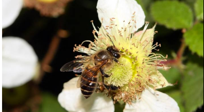
蜜蜂幫助薔薇科的虎婆刺傳粉