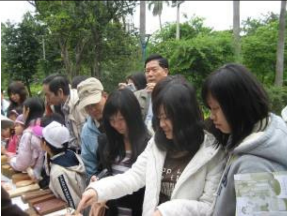
團長說:這攤位是啥? 又是兩麗聯手擺攤位