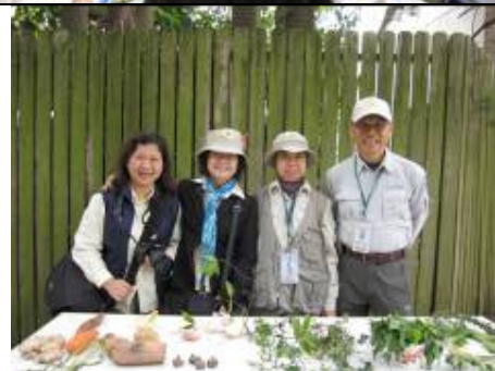
多開心! 忙裡偷閒 .....這張滿意嗎?