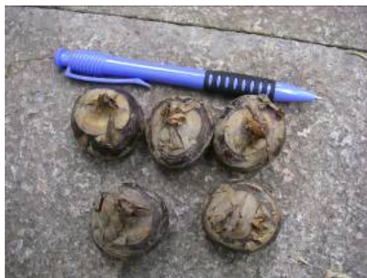
特別介紹：這就是紅燒獅子頭原料（荸薺）的生前