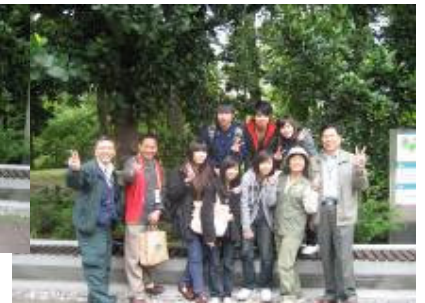
就是愛拍照留念啦! →1 來!來!攝影機。2 華光老師害羞不好意思。3 團長說程序上要存証。4 終於完成...ya~