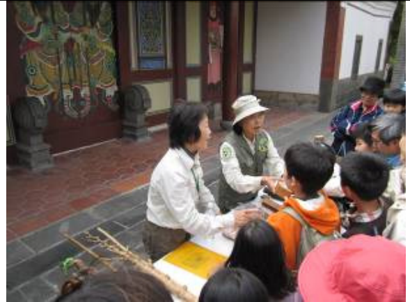
.....記得 5/7 布政史司開幕後,要低調一點哦!