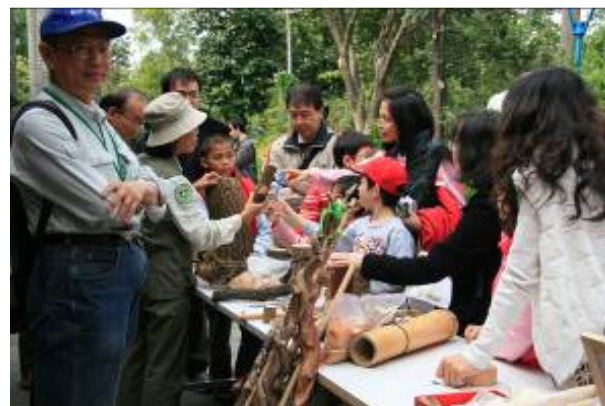
國明老師無奈的說:唉~我已經提醒她們時間到了!