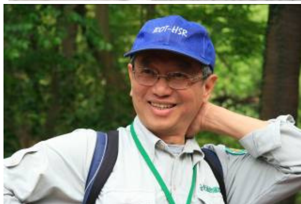
猜猜丁老師和國明老師在做什麼？