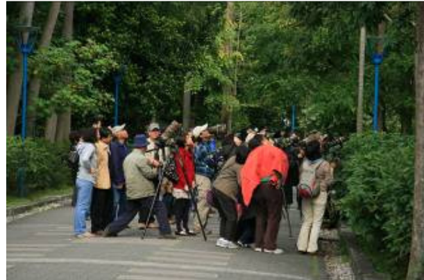
到底是什麼鳥?搶了我們活動的丰彩?

FR: http://blog.xuite.net/robertng/birding/14122784