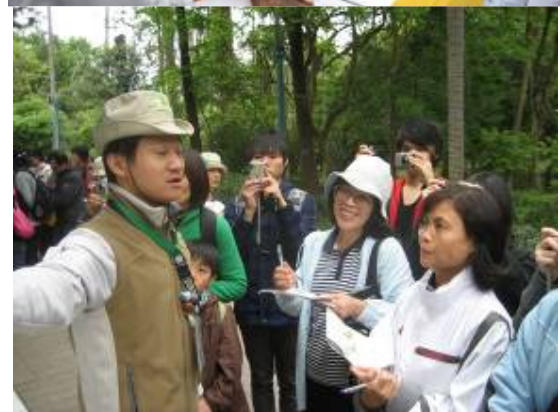
瞧瞧咱們小朱老師功力,閉著眼都能講!