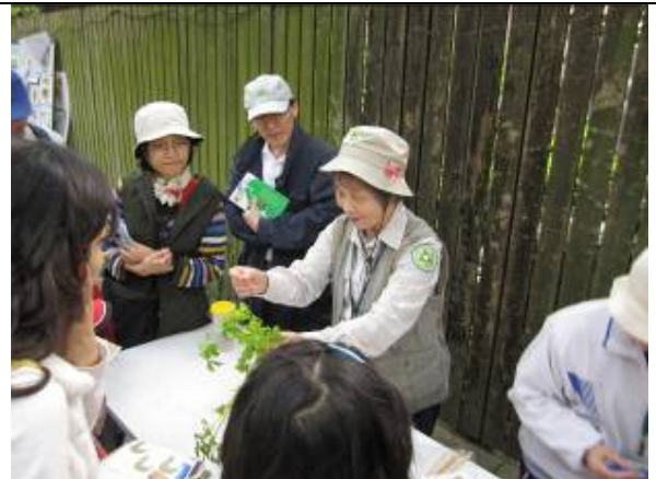
~!我想要和美香丁老師合影留念。