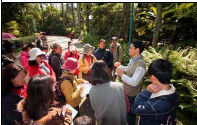
柏園老師向大家解釋附生植物的概念