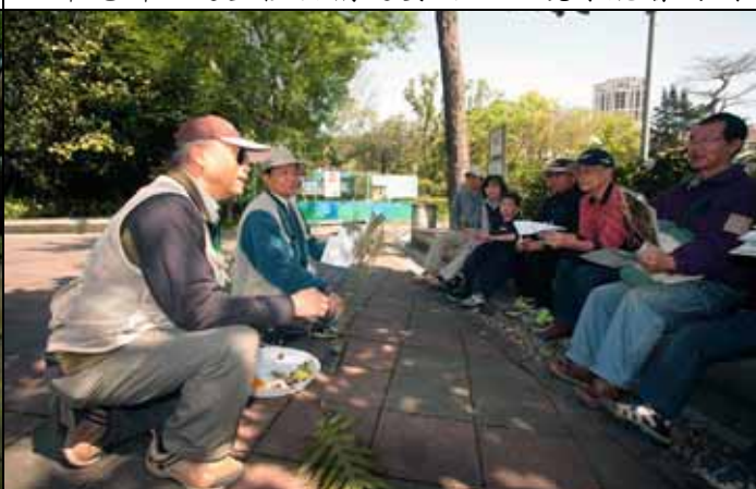
木麻黃綠色部分真的是他的葉子嗎？