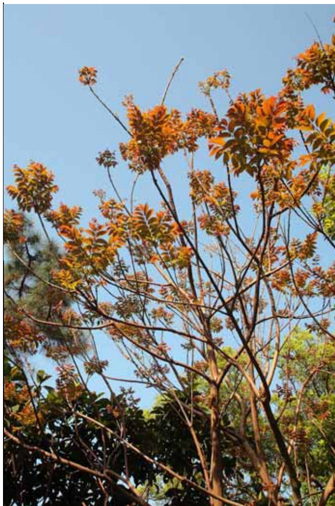
春天是色彩的季節，山豬肉正冒出紅色的新葉