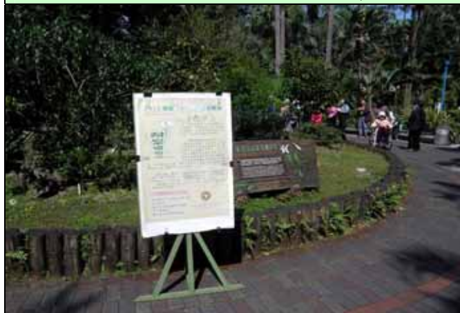
下午天高氣爽，人氣旺旺，準時開講