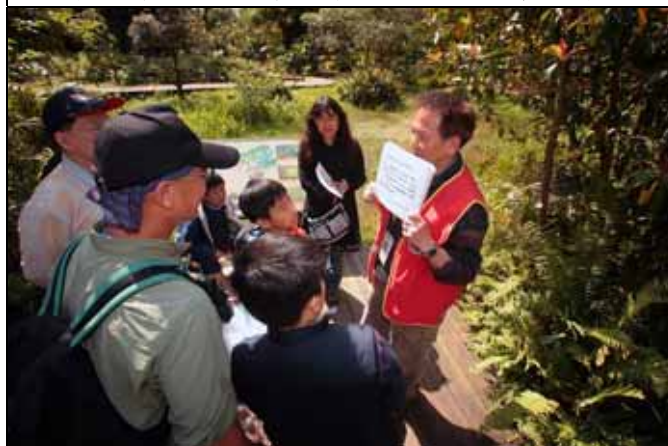
華光老師自備光合作用的簡介提供遊客參考