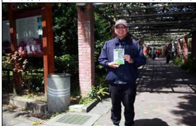
嘉義植物園的黃老師每月必來聽講令人感動