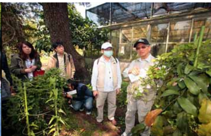
國明老師帶遊客觀察馬兜鈴特殊的花朵