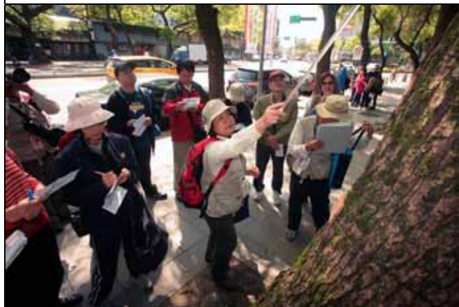
美香組長：有這根指揮棒真好就不怕身高不夠