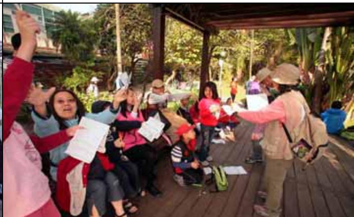
這個問題太簡單了！大家搶著舉手回答