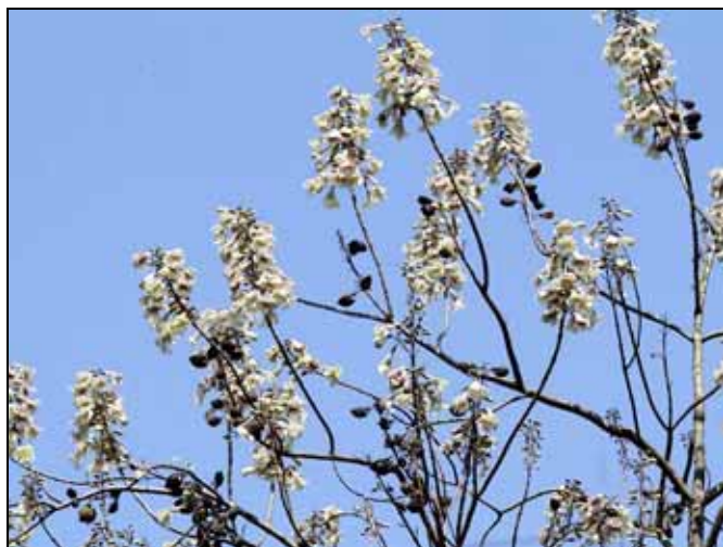
泡桐藍白色的花序在藍天下格外吸引人注意