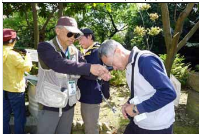
丁老師也來協助福和老師