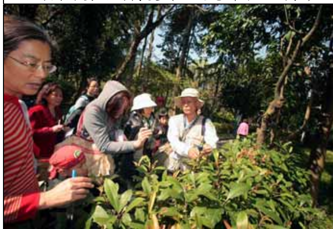
春不老的葉柄是紅色的，是其辨識特徵