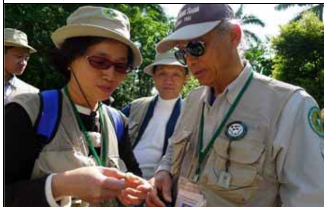
秀珍老師趁空檔趕快向丁老師請教編織技巧