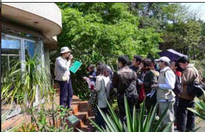
惠美老師跟遊客講解最深奧的光合作用