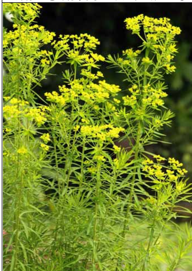
分類植物區台灣大戟正在盛開