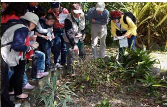
丁老師：木麒麟是仍保留葉片的仙人掌