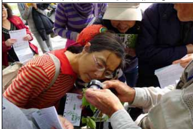
待我仔細瞧瞧樟樹花長的是何模樣