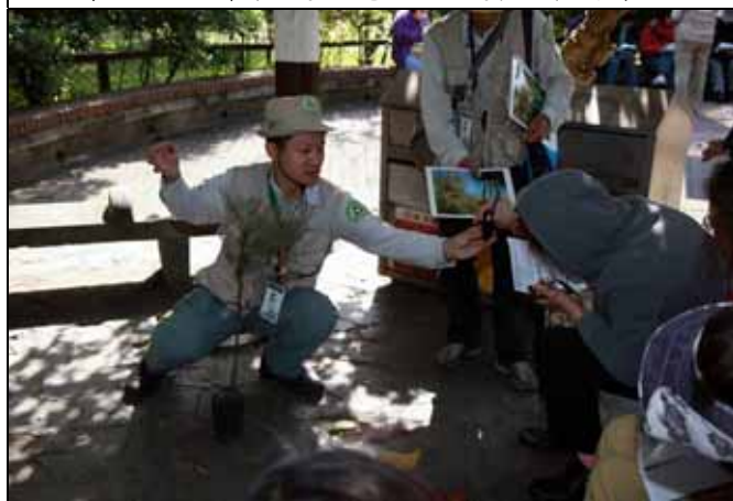
家蔚老師：木麻黃的鞘齒才是真正的葉子