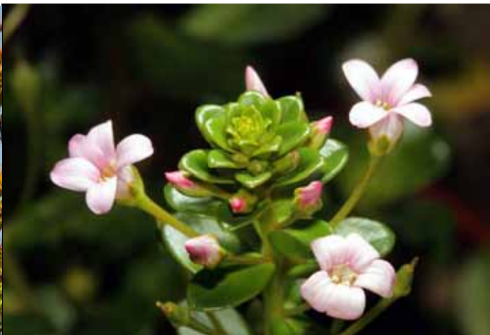
海濱植物濱排草的新芽像不像一朵玫瑰花