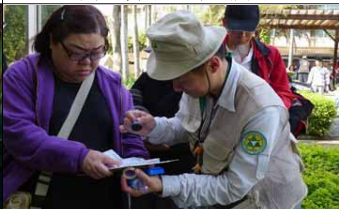
家蔚老師細心的為完成導覽的遊客蓋章