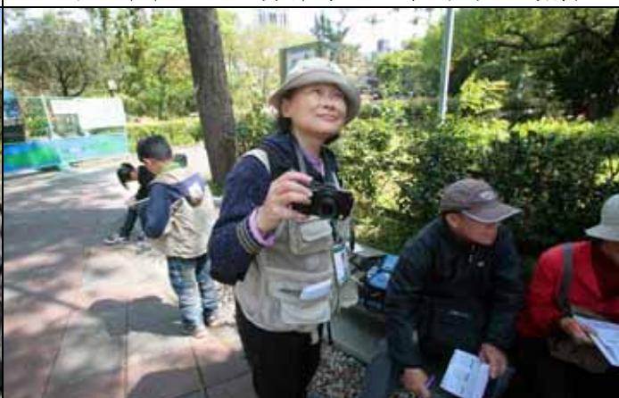
小玲老師今天也帶相機替大家留下美好的紀錄