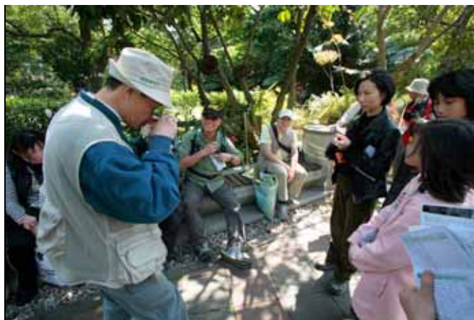
木麻黃葉子非常細小，必須用放大鏡才看的到