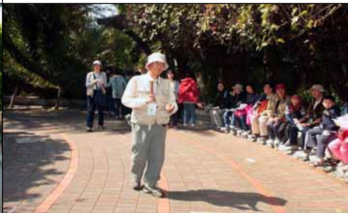
南海老師表演數來寶，十八樣武藝都搬上檯面