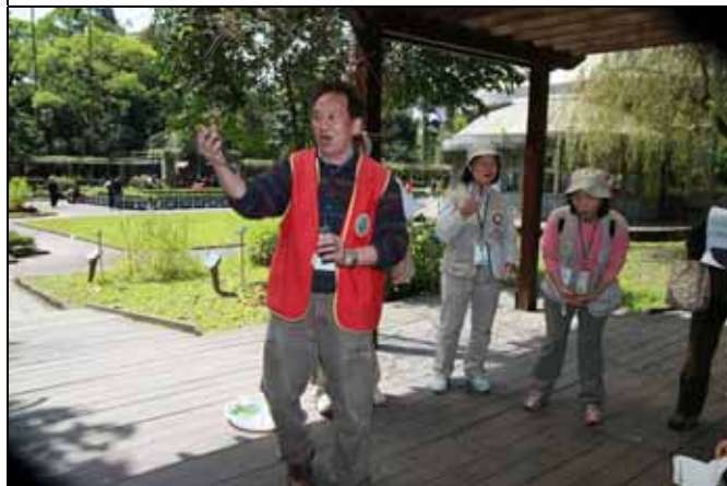
這可不是唱男高音，可見志工老師們多投入