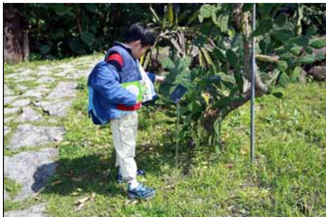
天真的小朋友仔細觀察仙人掌多肉的莖幹