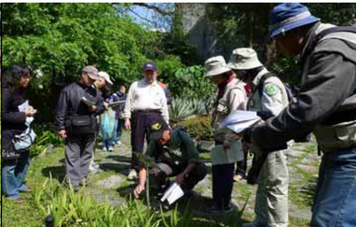
遊客分享蘆薈在古早時期的藥用效果