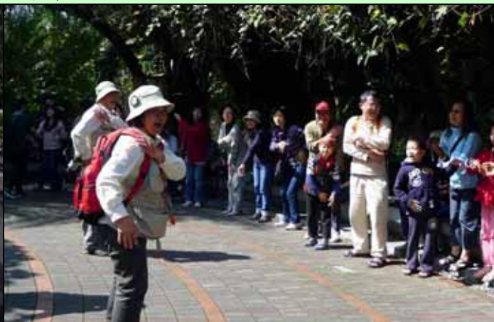
美香組長的白浪滔滔我不怕，讓大家活動筋骨