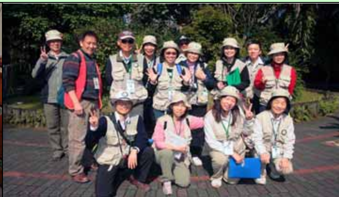
早上服勤志工快樂合影