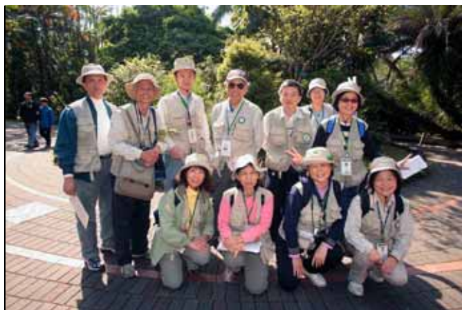
下午服勤的各位志工老師合影留念