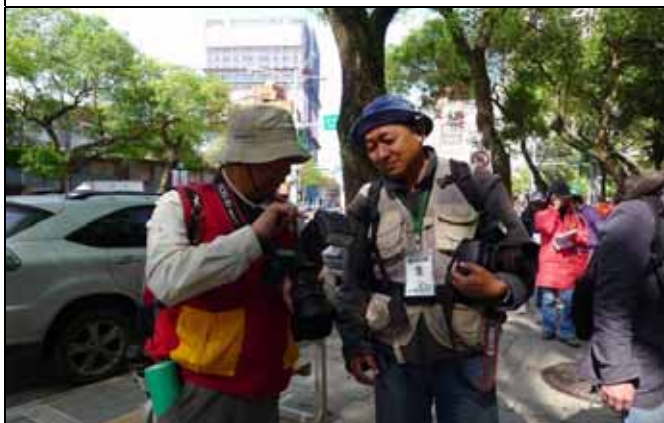
南海老師高檔的單眼相機也出動為植物園留下美好的記錄