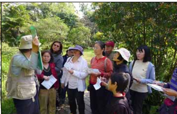
惠美老師講解耐旱植物與眾不同的光合作用