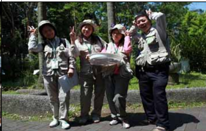
當志工，就能常保一顆年輕的心