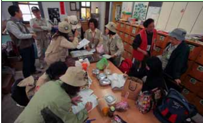
一早大夥就在志工室內忙著討論今天的行程