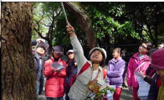
美香組長：還伸不到，應該穿恨天高來的！