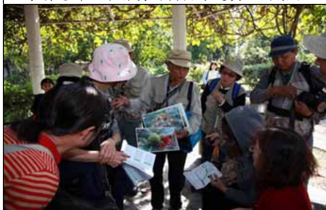
遊客都爭相看文俊老師準備的海桐種子圖片