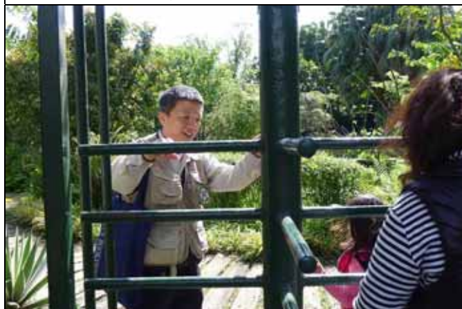
旺旺老師：請大家經過旋轉門務必小心