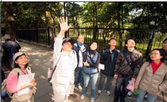
國明老師：附生植物可自行光合作用不必向宿主吸取養分