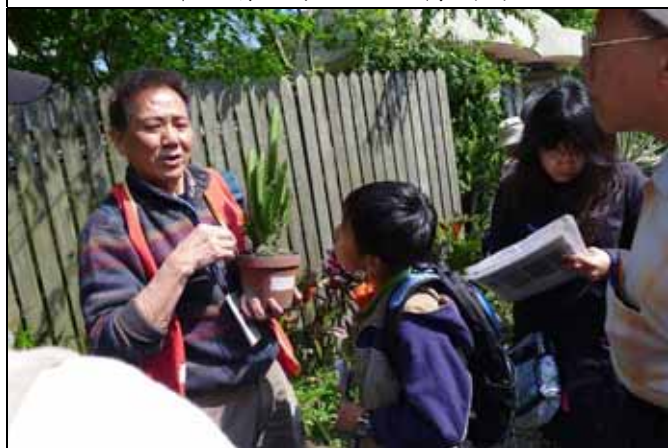
華光老師：你看這棵植物是不是很像仙人掌