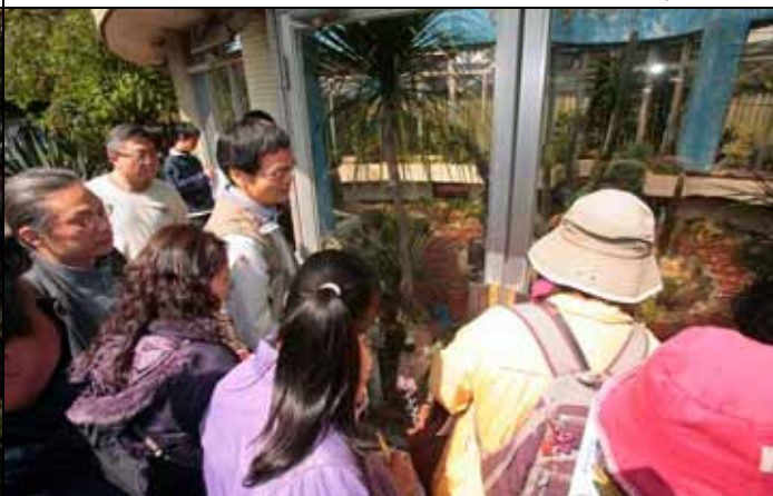
柏園老師帶遊客欣賞稀有的二葉樹（百歲蘭）