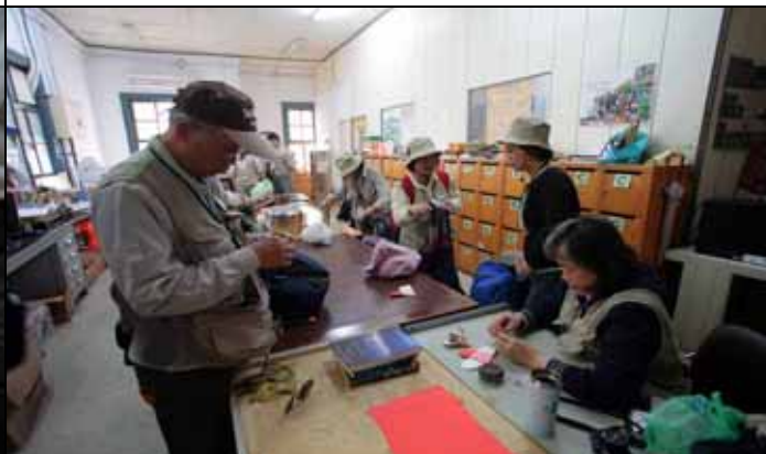
餐後丁老師還教授大家摺紙功夫