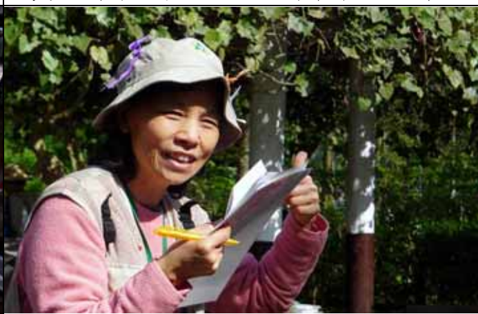
蔡蔡老師在空檔還在趕快 K 書，準備資料