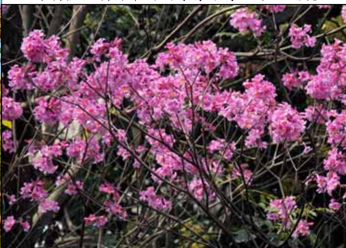
盛開的洋紅風鈴木，像燃燒的火焰