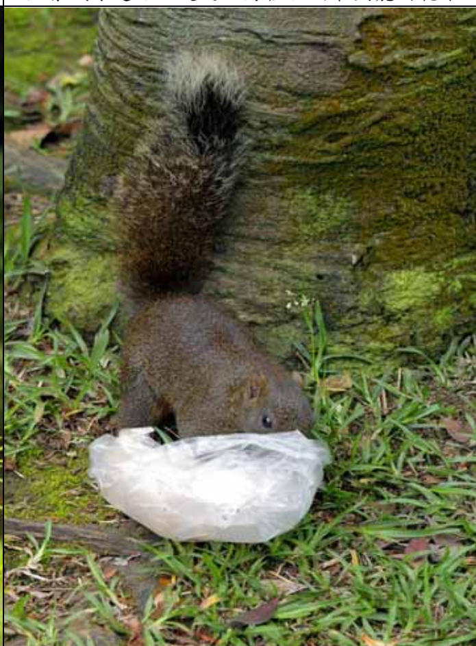
赤腹松鼠正在搜刮遊客遺留下來的垃圾袋