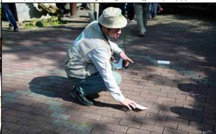
家蔚老師：請將植物分為耐旱與不耐旱兩大類