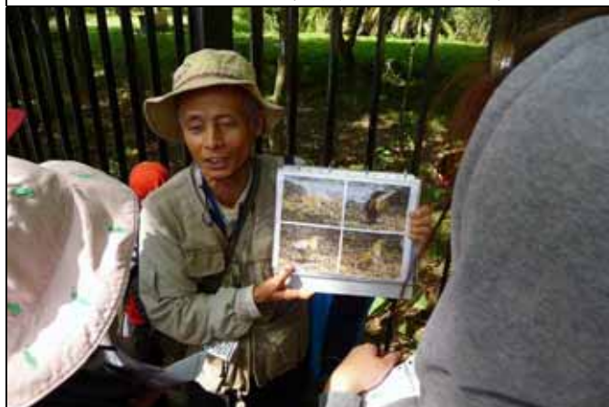
看到黑冠麻鷺，文俊老師趕快來個機會教育