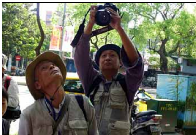
好的圖片要好的角度 (文俊老師小心腦袋)