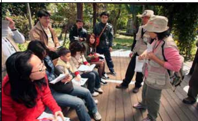
蔡蔡老師：我們來總複習順便玩九宮格遊戲