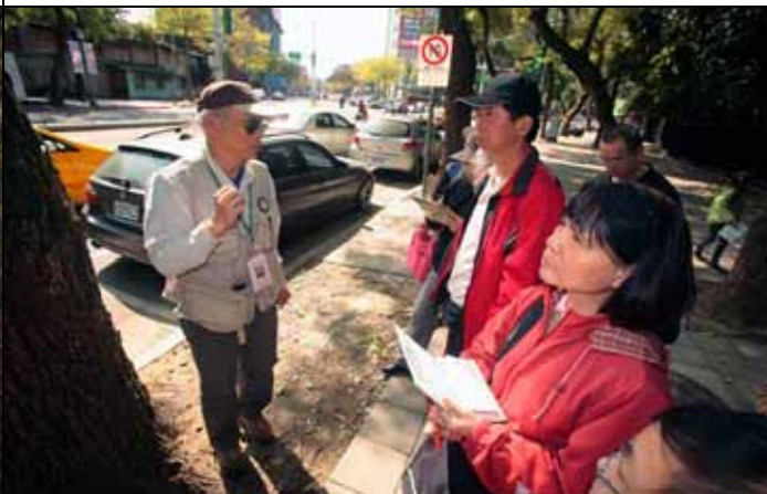
丁老師仔細回答遊客有程度的問題