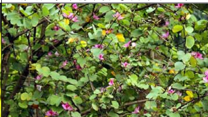
春天到了，羊蹄甲也進入花期