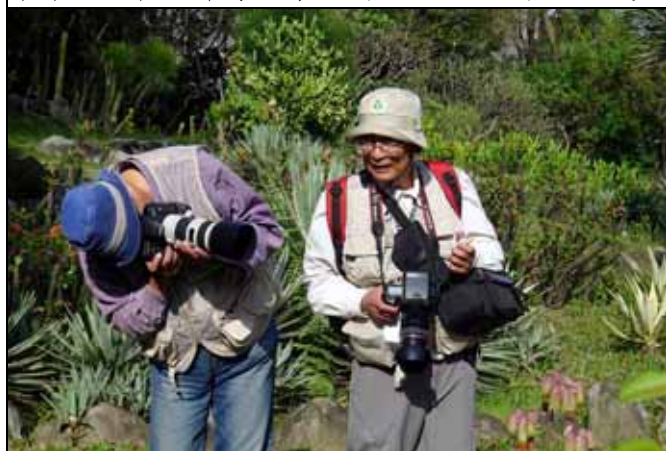
善用器材，訓練技術，為植物園內的一草一木留下珍貴的紀錄