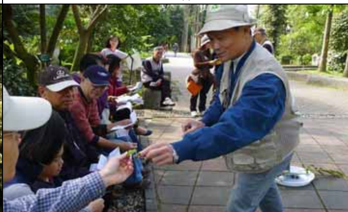
福和老師：請大家摸一摸這葉子的質感如何