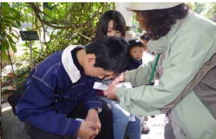
淑華老師：這些植物構造要用放大鏡才能看的到