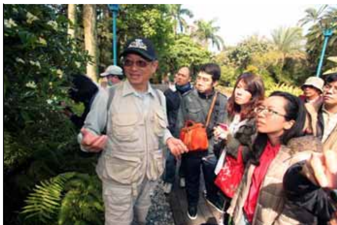
海桐現正開花，放出一股非常清爽的香味