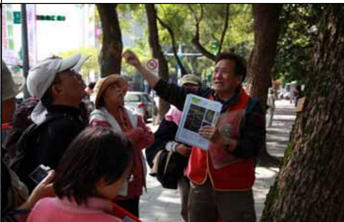
華光老師用心解說，表情十足