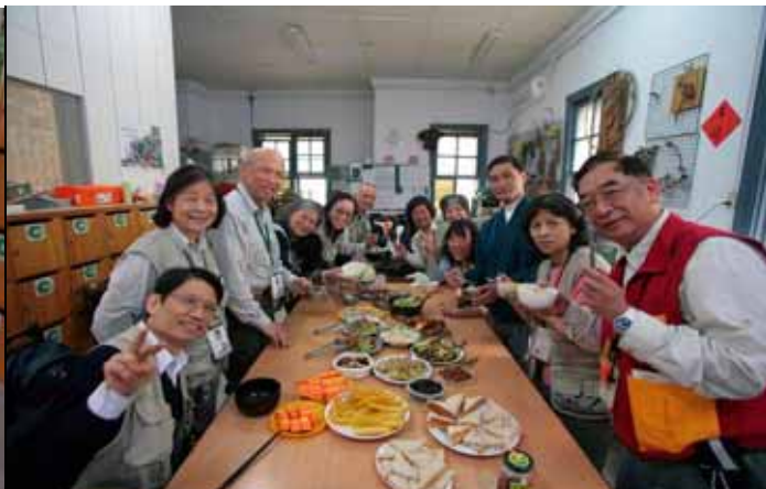
人多聚餐好聊天也是凝聚感情的時刻