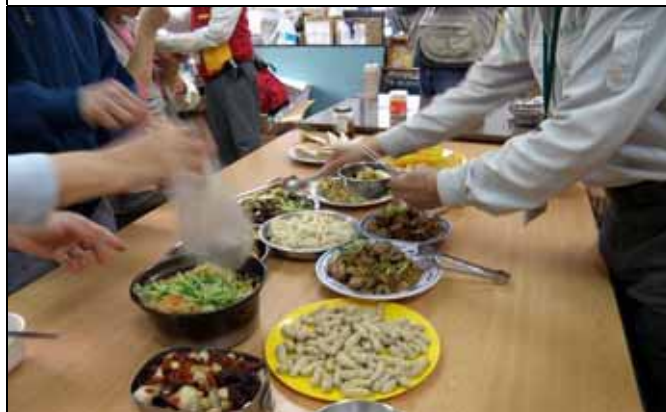
大家開動，努力加餐飯晚到的可就沒得吃了！