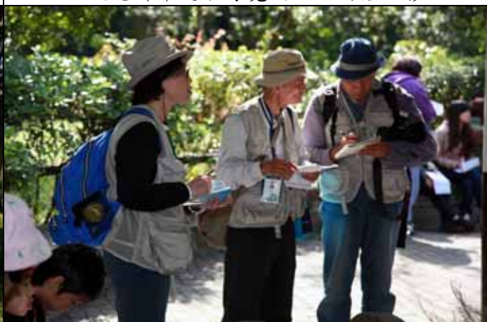
秀珍老師每次都仔細聆聽，非常詳細的做筆記