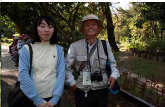
有朋自遠方來不亦悅乎，來自日本的朋友慕名而來聽講，可見植物園解說的成效