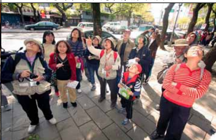
這可不是看天外飛來的幽浮，是看樹上的植物