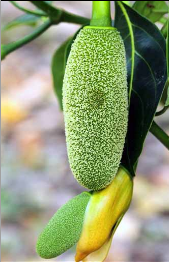
波羅蜜綠白色的肉質花序