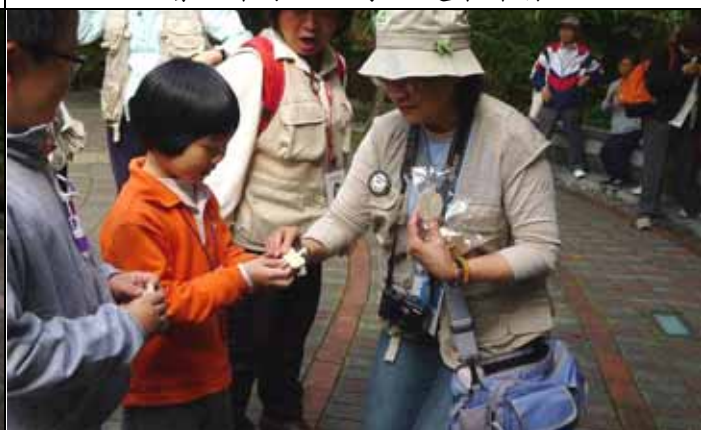
美香：送這麼好的東西我都沒有，我也要！