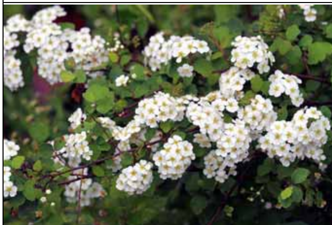
繡球繡線菊美麗的花朵像不像一顆顆的繡球