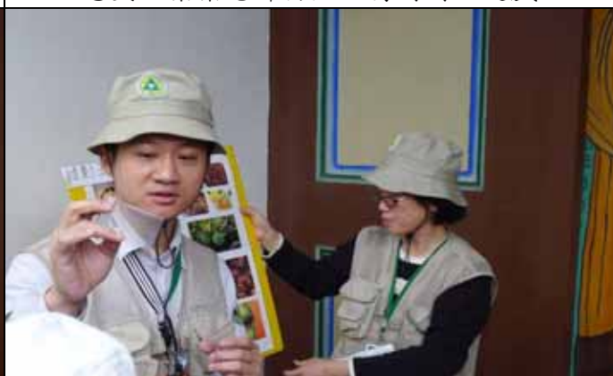
家蔚老師：大家看看水同木隱花果內的小蜂