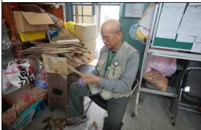
丁老師一出手就有好作品，大家趕快來學