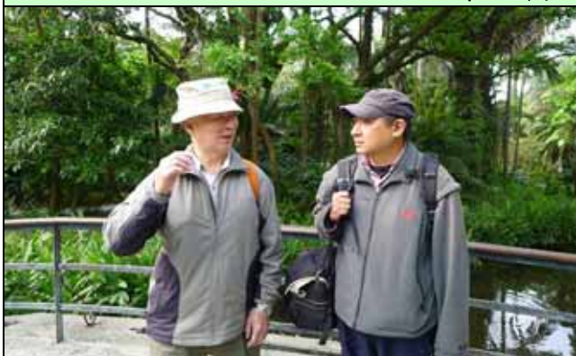
清晨的植物園最美麗，享受清新的空氣最好