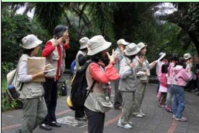
下午開場，志工、遊客們一起跳春天舞