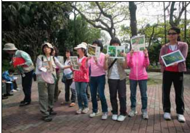
蔡蔡老師：大家看花形來判斷是何種授粉方式