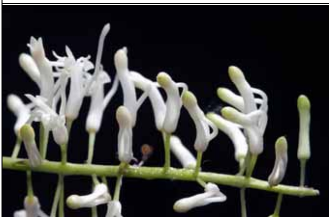
山龍眼科的澳洲胡桃的花朵形狀非常特別