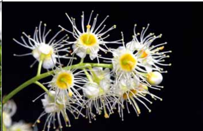
墨點櫻桃的白色花蕊輻射狀向外伸展