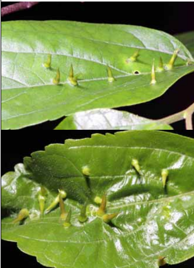
是怎樣的昆蟲在朴樹上形成這樣的蟲癭？