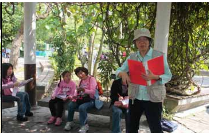
惠美老師：你們知道稻子、麥子是如何傳粉的嗎