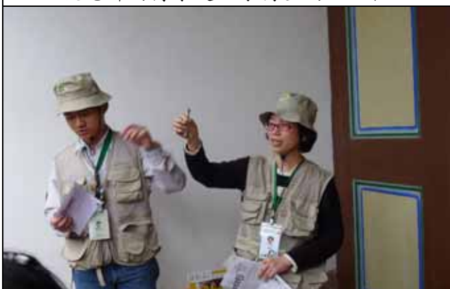
秀珍老師：隱花果內的世界可是非常複雜有趣