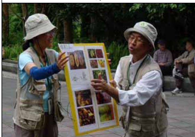
芳昌、仰恩老師是最佳解說拍檔