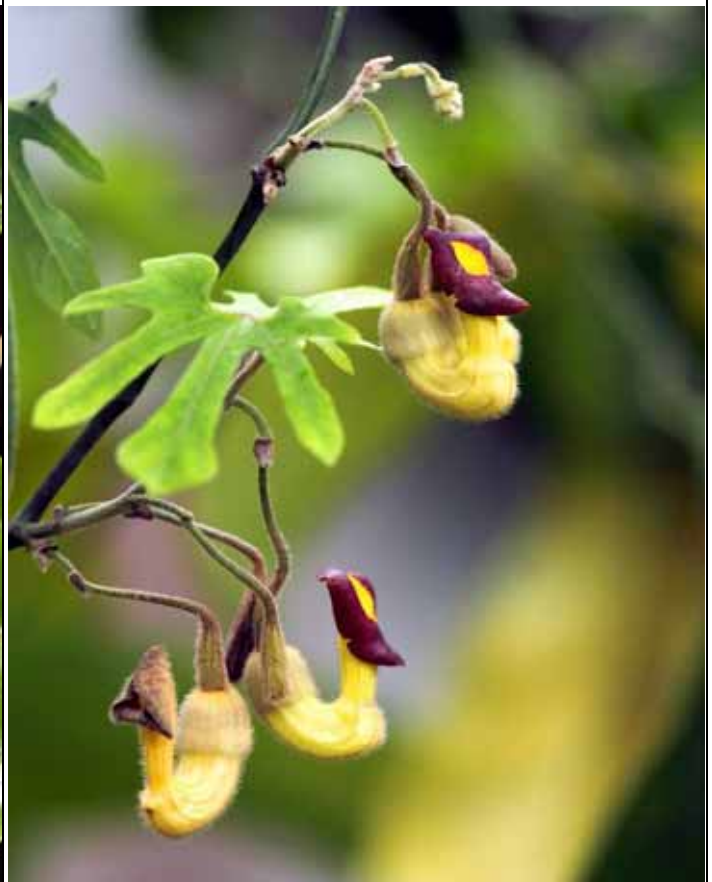
掌葉馬兜鈴特殊的花朵由雙翅目昆蟲幫忙傳粉