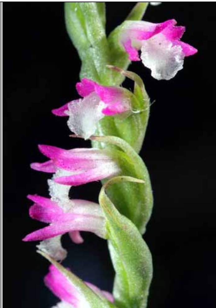
綬草因為花朵生長方式又名青龍盤柱