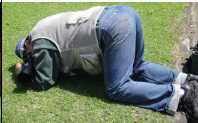
植物園有熊出沒，大家小心！其實是拍絞草的圖片