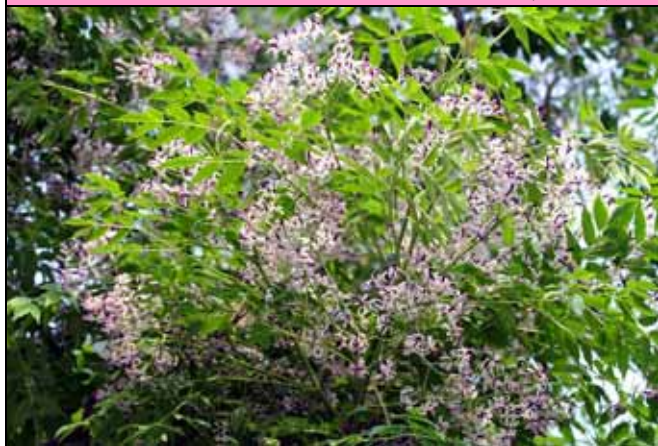
苦楝春天開出滿樹藍白色的美麗花朵