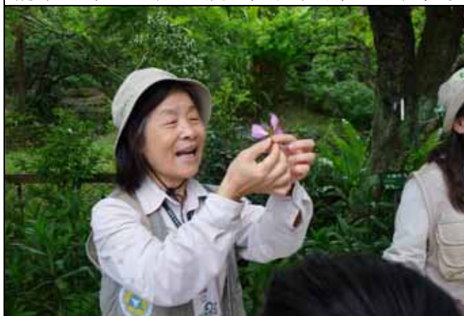
雪花老師用羊蹄甲為範例介紹花朵的構造