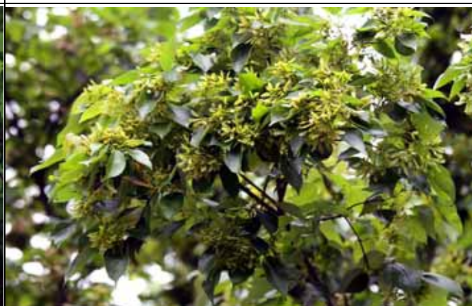
台北楓已經授粉完開始結出滿樹的翅果