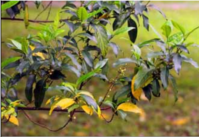
民生植物區的狗骨仔正在開花