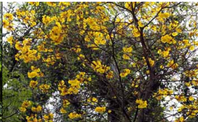
高高在上的黃金風鈴木金黃色的花朵引人注目