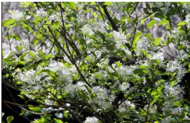
稀有的流蘇樹是近年來流行的園景樹