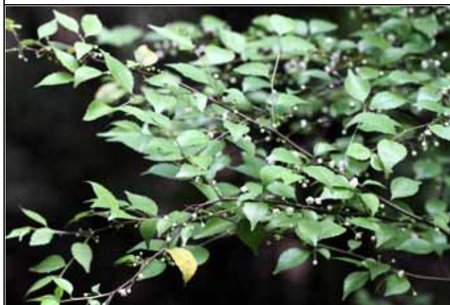
花果皆美的燈稱花是很漂亮的綠籬植物