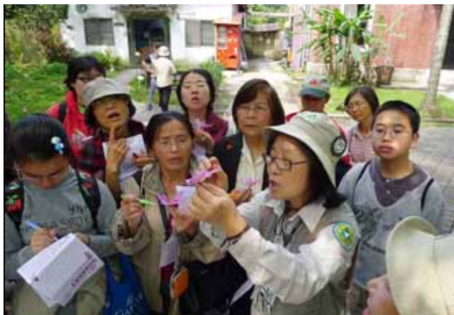
雪花老師講解讓遊客聽的是目不轉睛