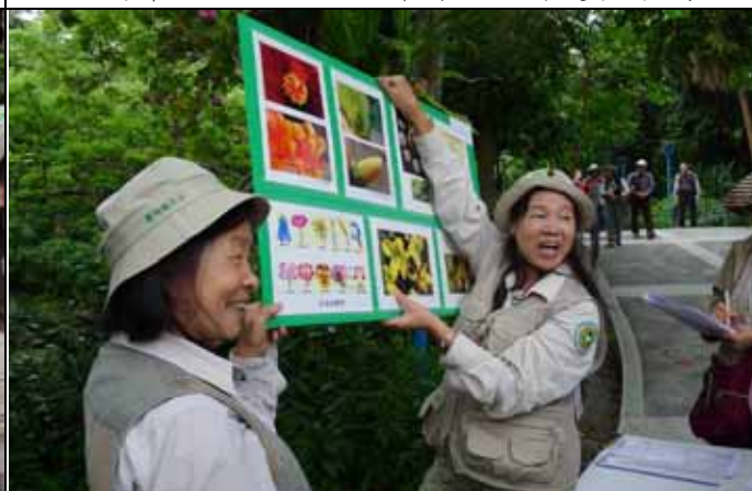
永芳老師：你看花朵其實還有許多奇特的變化