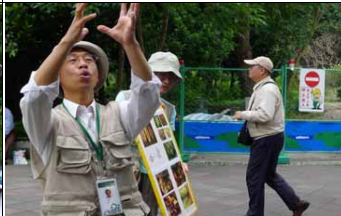
話說道光年間，芳昌老師說書一定很行！