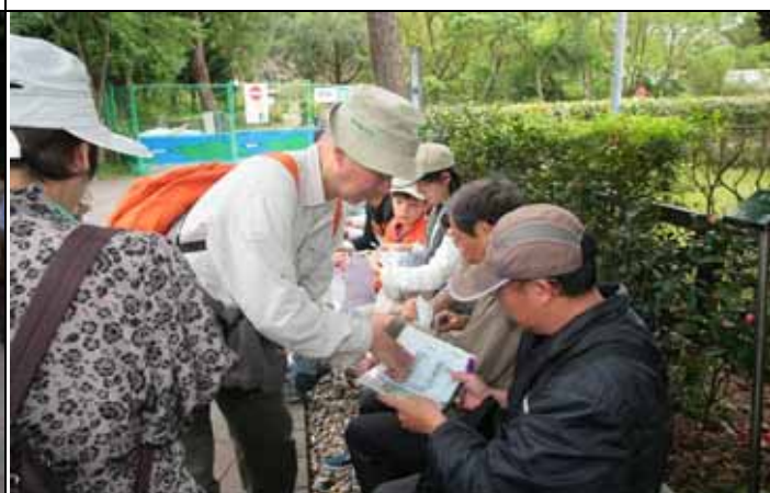
煥光老師導覽結束後細心的為遊客蓋章證明