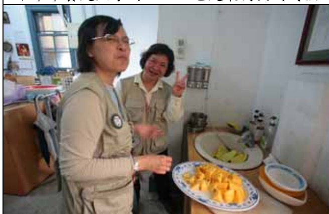
素華老師不要假借嚐嚐味道先偷吃