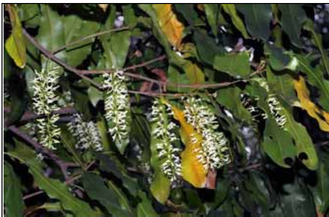
重要木本植物區澳洲胡桃開花