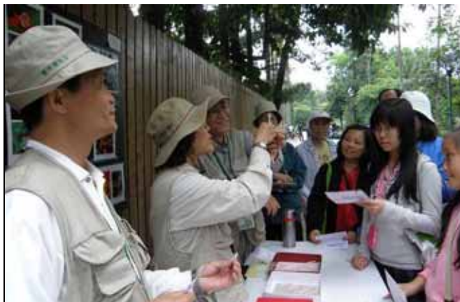
麗華老師用吸管比喻花序排列順序，相當有趣