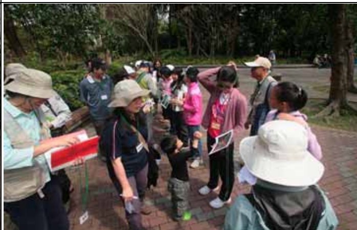
遊客們玩對對碰，要找到家還真傷腦筋！