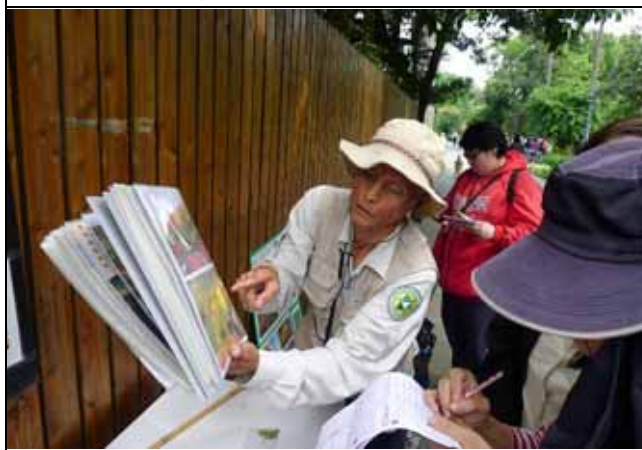
文俊老師總帶著大疊的自備講義補充教學