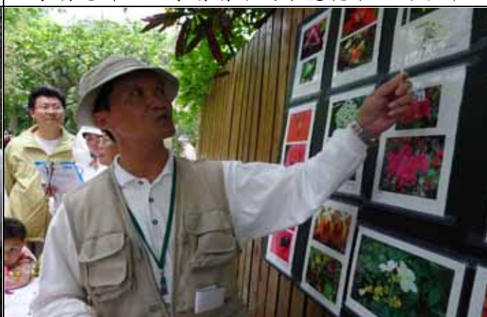
福和老師介紹各類花序及形狀