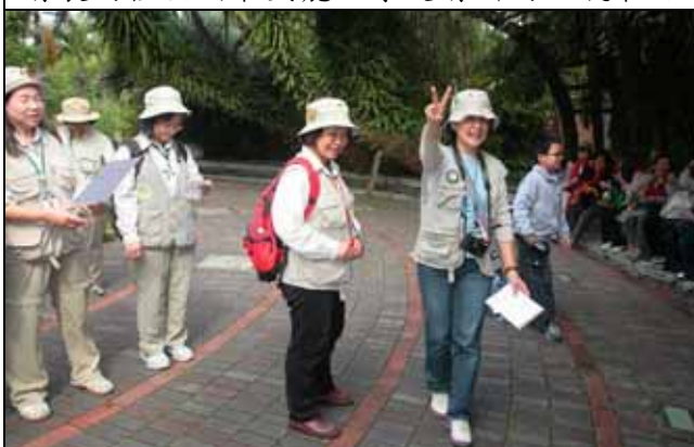
徵求兩位小朋友跟我們一起唱歌、跳舞