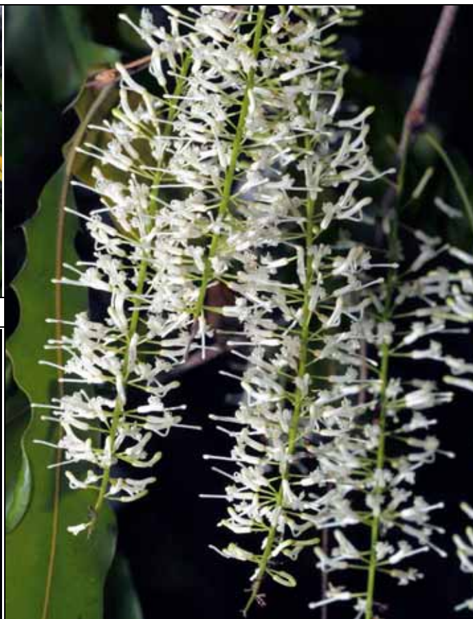
澳洲胡桃白色的美麗花序