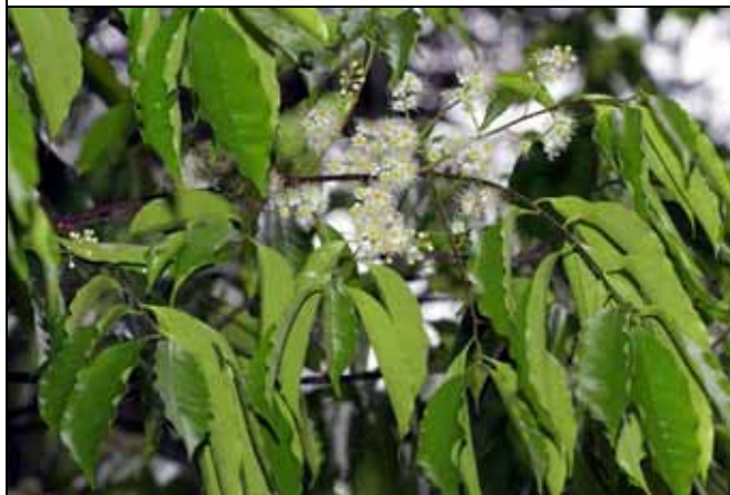
墨點櫻桃葉片有強烈杏仁味