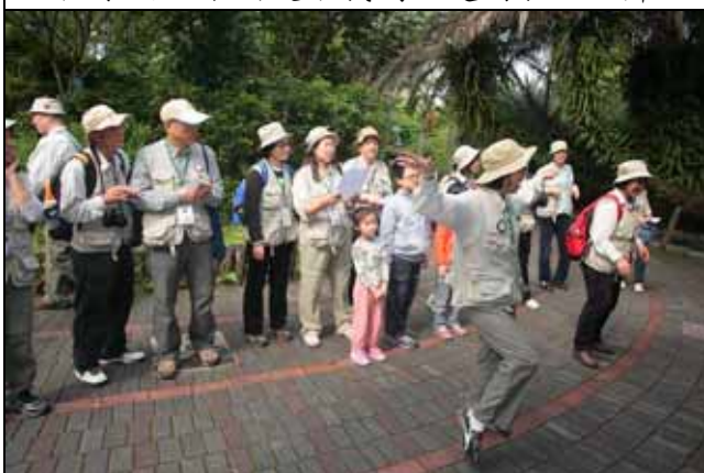
這可不是大鵬展翅，這是白鷺鷥啦！