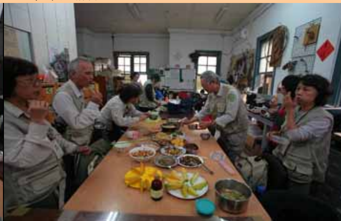
努力加餐飯，下午還有一場解說要奮鬥！