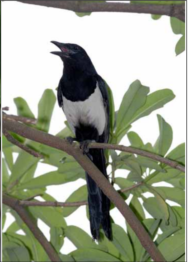
最近常在植物園成對出沒的喜鵲