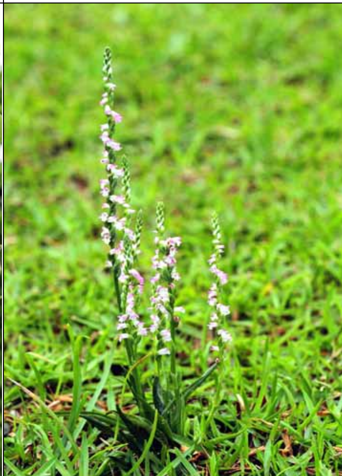
溫室前的草皮上有許多小蘭花-綬草