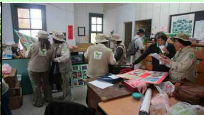
早晨的志工室大家都在忙著為解說活動準備