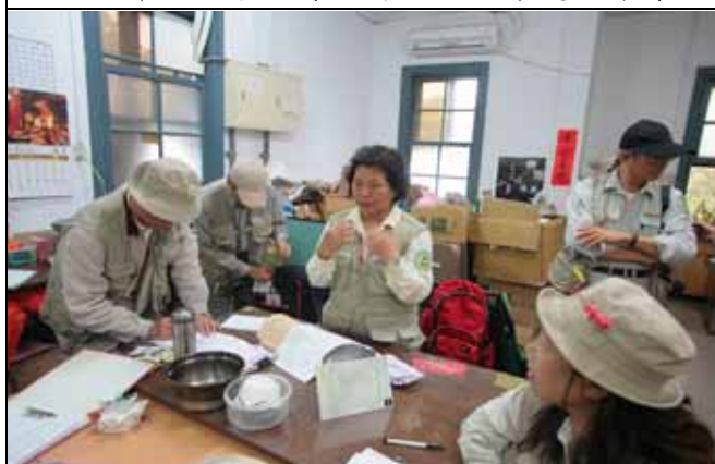
美香組長利用時間報告最近發生的大小事