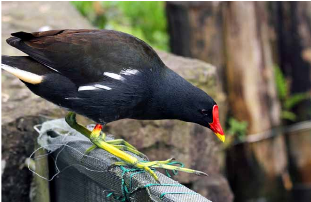
紅冠水雞腳掌特別大，但走窄路還是要步步為營，小心為上