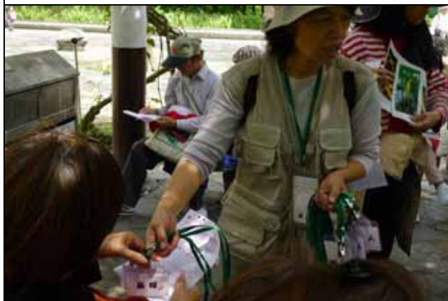
蔡蔡老師分發名牌給各位家長