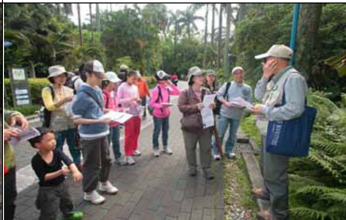
丁老師帶隊一向以周全、穩健著稱