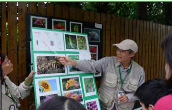
學習單作者新厚老師也來幫忙講解