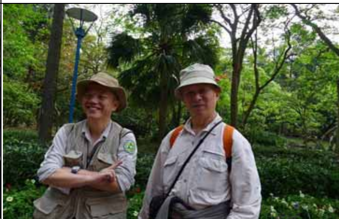
旺旺、煥光老師是幕後協助的推手