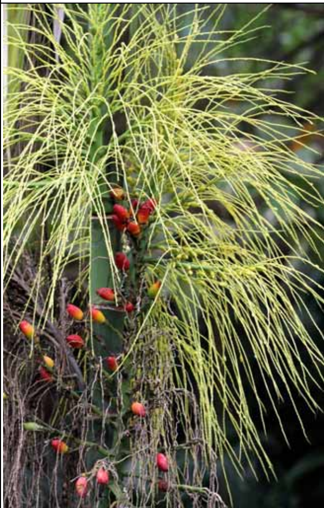
棕櫚科植物區叢立檳榔結出美麗的紅色果實