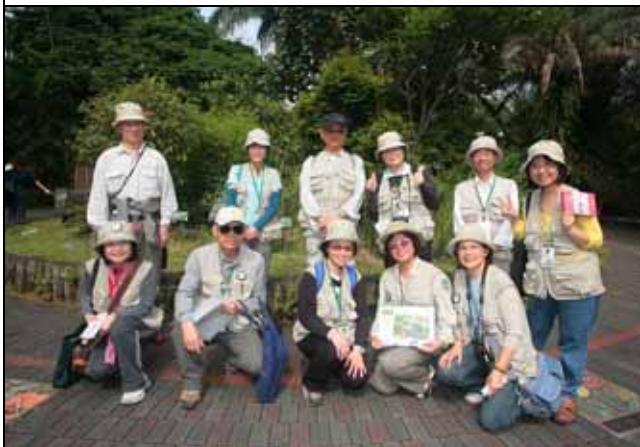
一群年輕可愛美麗英俊的志工老師合影