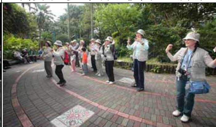
春天來了！大家一起來練習