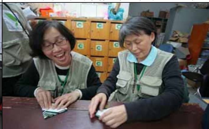
每次服勤都能學習新手藝是最快樂的事