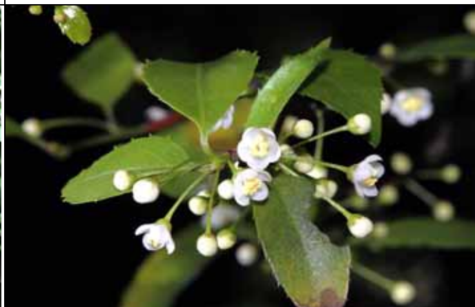
燈稱花所開出滿樹的小白花