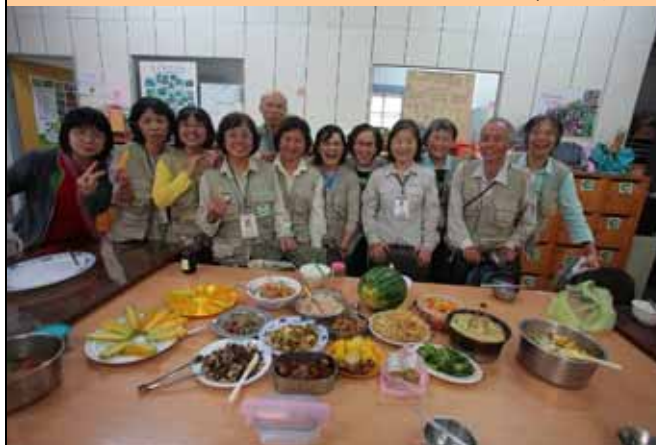
中午午餐是大家的心血，也是最高興的時候