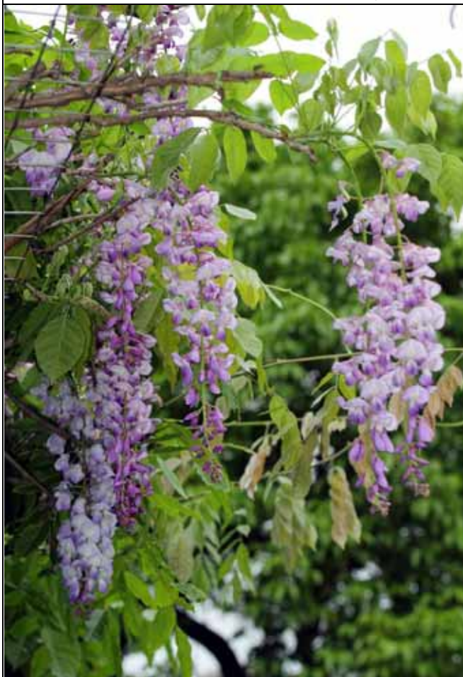
荷花池邊的紫藤開出許多紫紅色的花穗