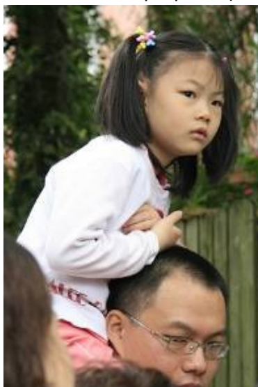
每個禮拜都有令人驚喜的活動