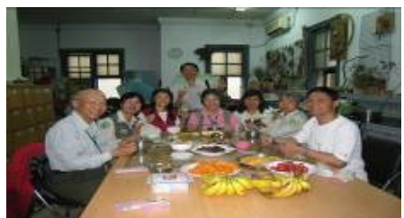
謝謝這群媽媽們的孩子, 在母親節貢獻出你們的媽媽來值勤