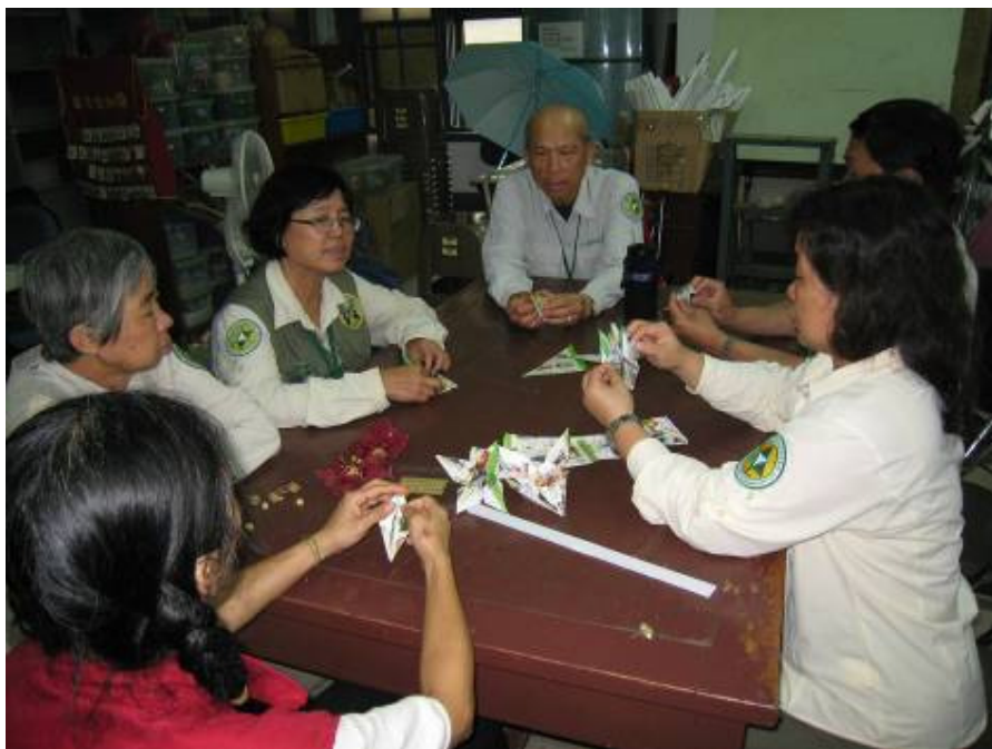
植物園加工出口區 在趕工母親節的禮品 辛苦了!