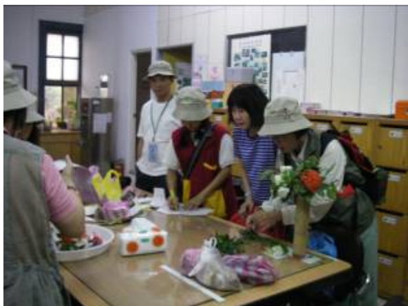
一群犧牲假日，愛捻花惹草的志工們。