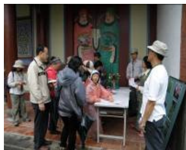
淑華老師別偷偷計時哦!