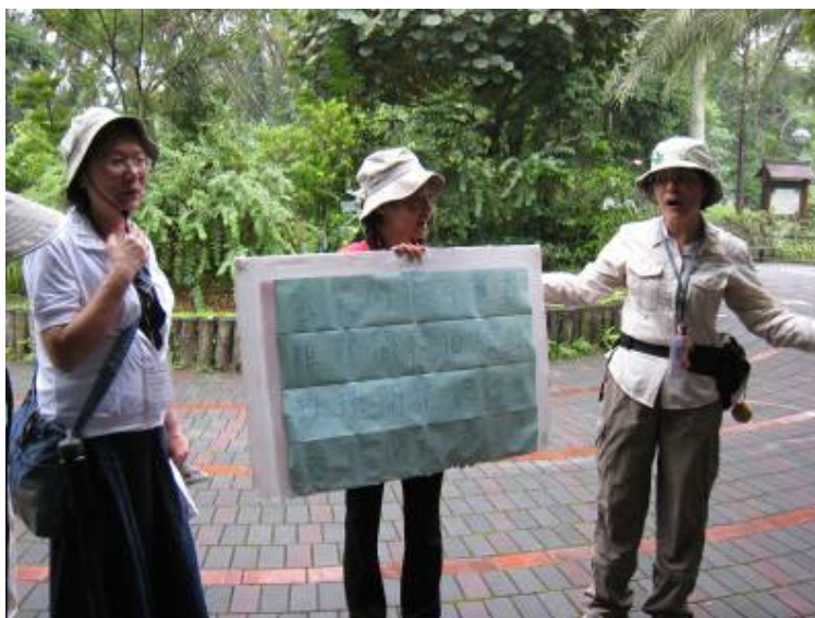
沒有三兩三不敢上植物園，加上十八班武藝....國、台、英語還有手語..... 又要帶動又要唱.....嘿! 金~力~海~