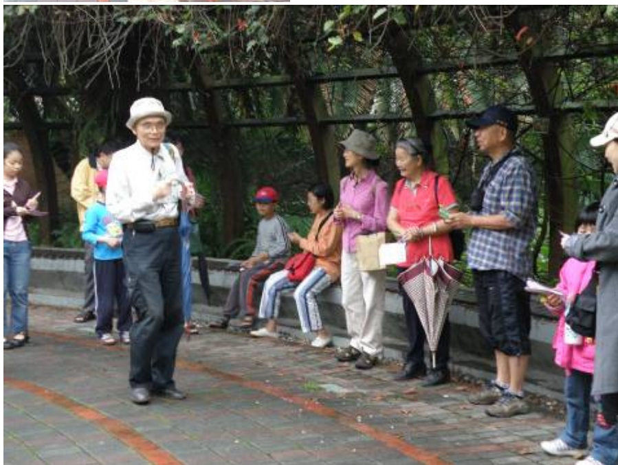
遊客來了~還是要學學游老師的精神~早睡早起身體好!