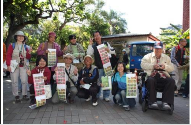
今年贈送花曆和 103 年度的手札，博得領獎遊客的一致好評。