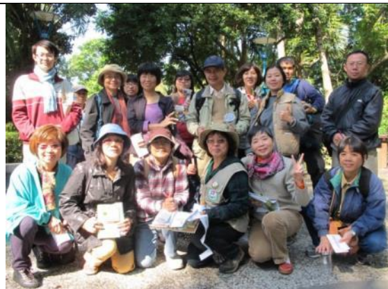
快樂的一群好朋友