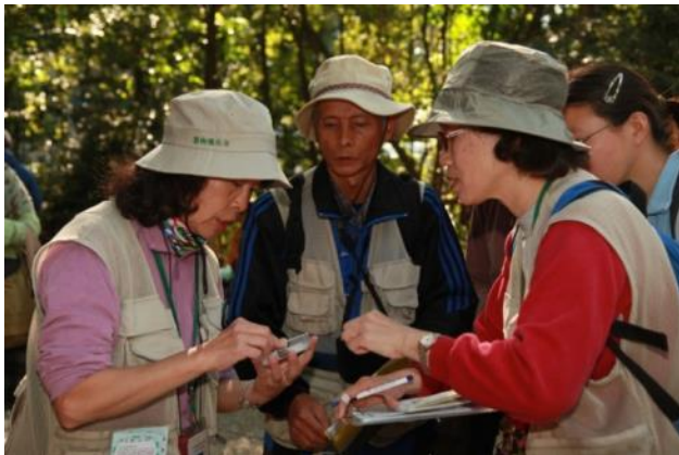
老師們彼此再研究