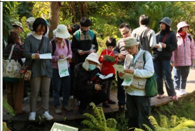
神農氏隊帶隊解說