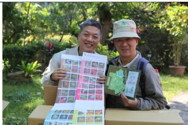
富旺與煥光老師負責贈送今年禮物—植物園春夏秋冬花曆與手札