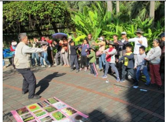
旺旺老師帶領大家帶動唱