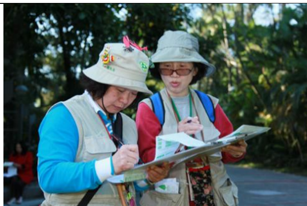
認真美麗的解說老師