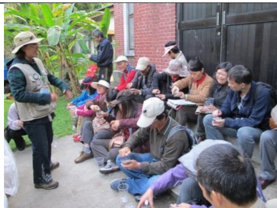
專業的解說志工與用心的來賓朋友