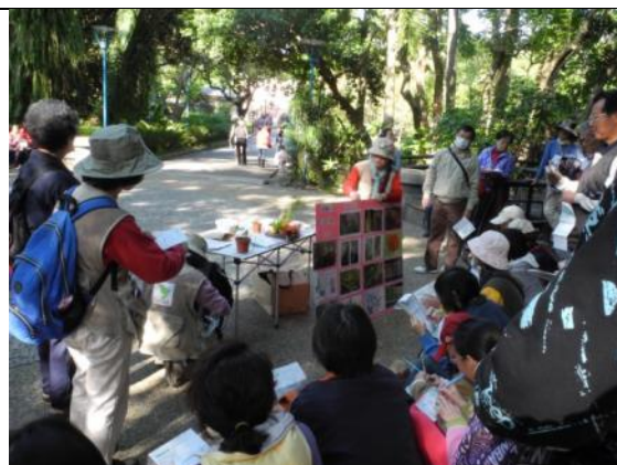
蕨代風華—認知蕨類的世代交替駐站