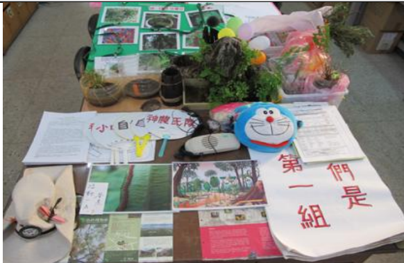
活動開場前的前置作業