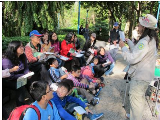
蕨佳寶貝—認識蕨類和生活的關聯駐站