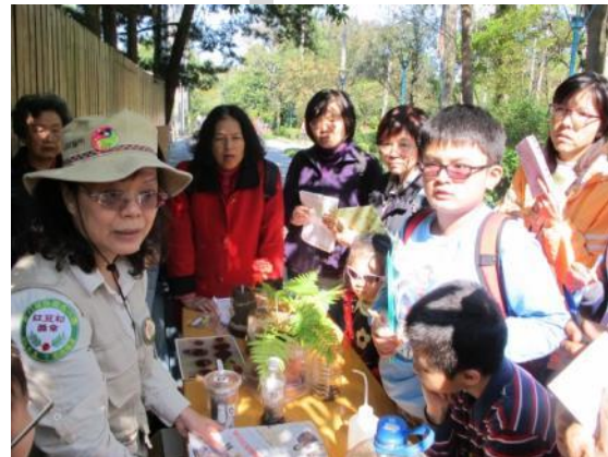
關心蕨類植物的保護及復育駐站