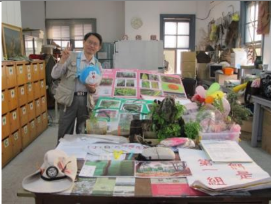
組長作最後物品清點