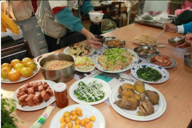
一桌子的愛心與豐富的佳餚