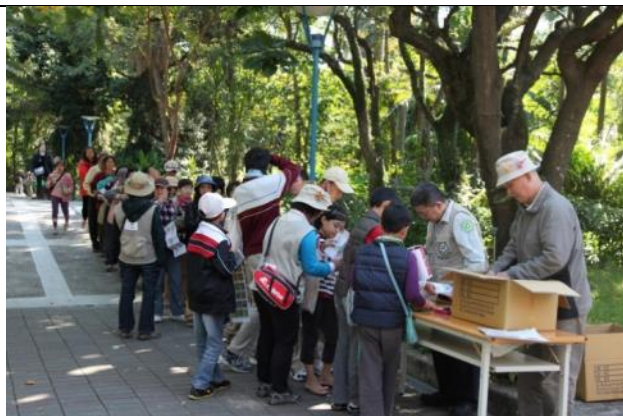
感激全年度來 10 次以上或是全勤的好朋友。