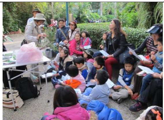
精彩的駐站解說，受到小朋友歡迎