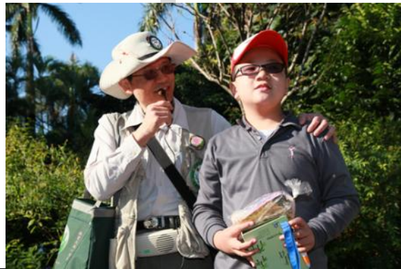
與來賓小朋友互動