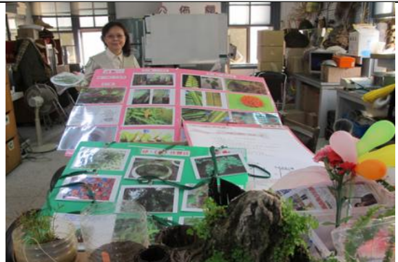
學習單作者—爾玟 8 點就來準備教具